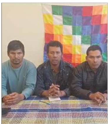
Dirigentes afines a Evo Morales.

Dice que organizaciones matrices no aceptan un cuarto intermedio