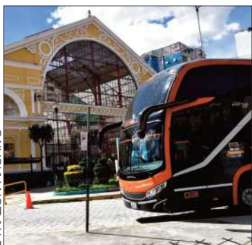
La Terminal de Buses de La Paz.

El desbloqueo en Parotani permitió habilitar la ruta en el occidente del país