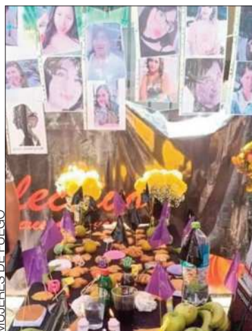
Mesa para víctimas de feminicidio.

Panes, masitas, dulces, frutas, comida, flores y velas, lo que más le gustaba en vida a las difuntas fueron puestas en la mesa por sus