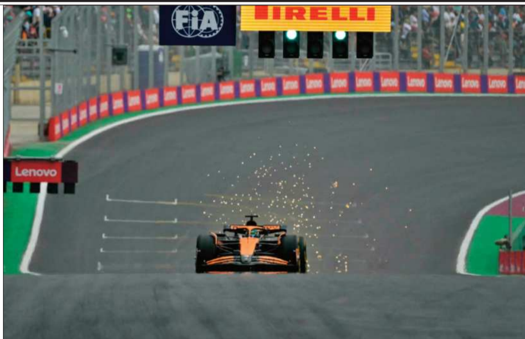
COMPETENCIA. El australiano Óscar Piastri con su bólido en plena competencia brasileña.