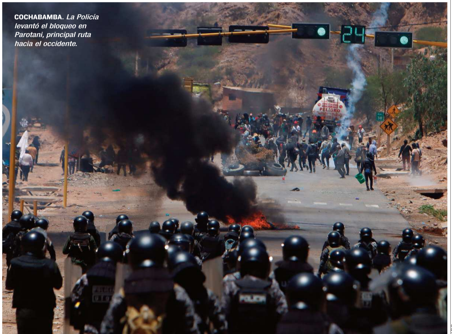
COCHABAMBA. La Policía levantó el bloqueo en Parotani, principal ruta hacia el occidente.