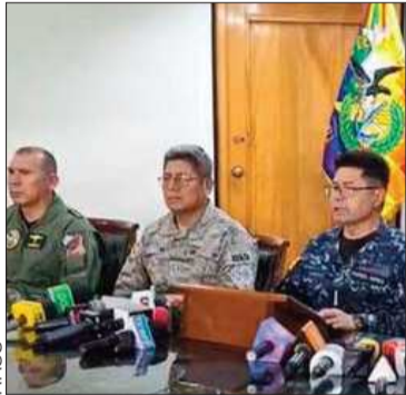
El Alto Mando Militar.

El general Zabala pidió respeto por los efectivos militares y sus familias