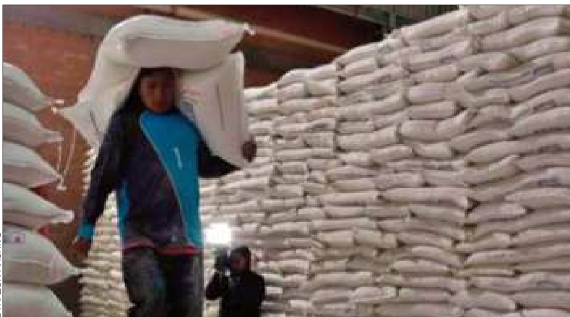
PRODUCTO. Se busca garantizar la tranquilidad en la población en cuanto a la provisión de este grano.

El ministro de Defensa argentino, Luis Petri, y la ministra de Seguridad, Patricia Bullrich, destacaron la coordinación entre fuerzas aéreas y de seguridad en la operación, calificándola de "precedente en la lucha contra el narcotráfico aéreo". Las investigaciones ahora buscan trazar el alcance de esta red de tráfico entre Bolivia y Argentina.