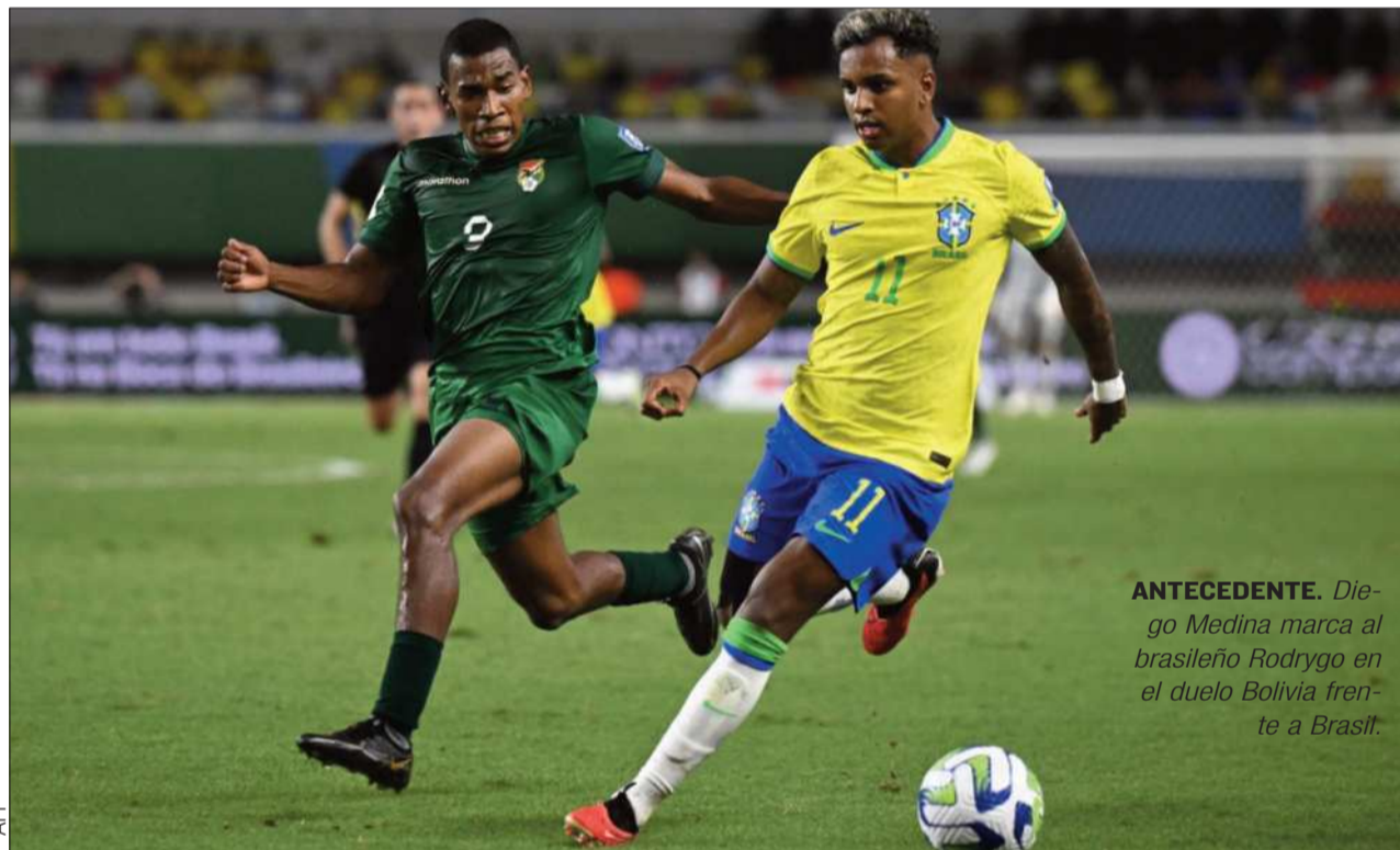
ANTECEDENTE. Diego Medina marca al brasileño Rodrygo en el duelo Bolivia frente a Brasil.