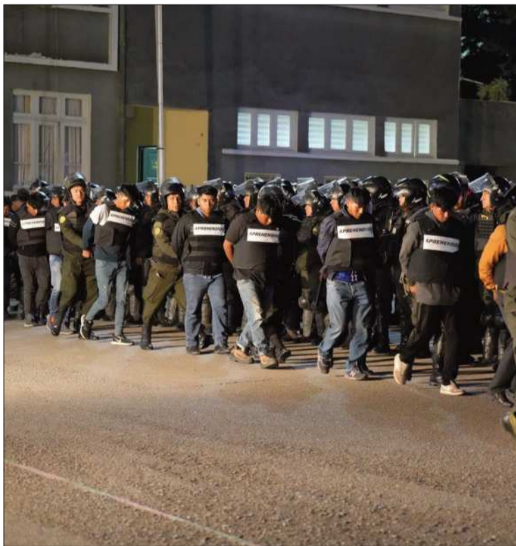
ANAPOL. Las personas aprehendidas llegaron a la ciudad de La Paz.

transporte, atentado contra los servicios públicos, asociación delictuosa y secuestro.