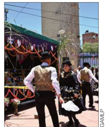
El Cementerio General.

Durante la festividad, el Cementerio General da la bienvenida a cientos de personas que visitan a sus difuntos con gigantes adornos de t'antawawas que visten el portón del camposanto.