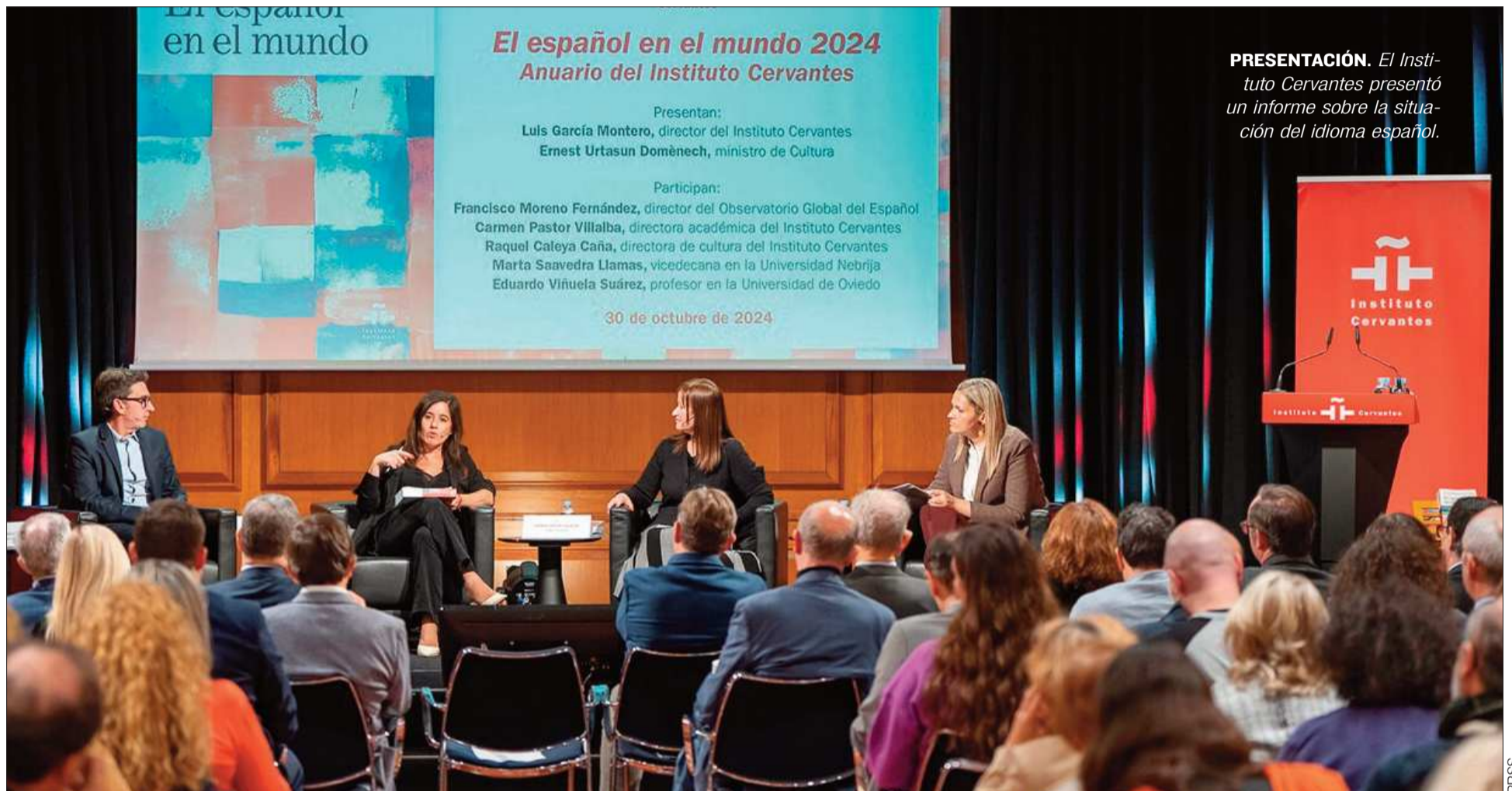
PRESENTACIÓN. El Instituto Cervantes presentó un informe sobre la situación del idioma español.

ROSÍO FLORES ■ CON DATOS DEL INSTITUTO CERVANTES