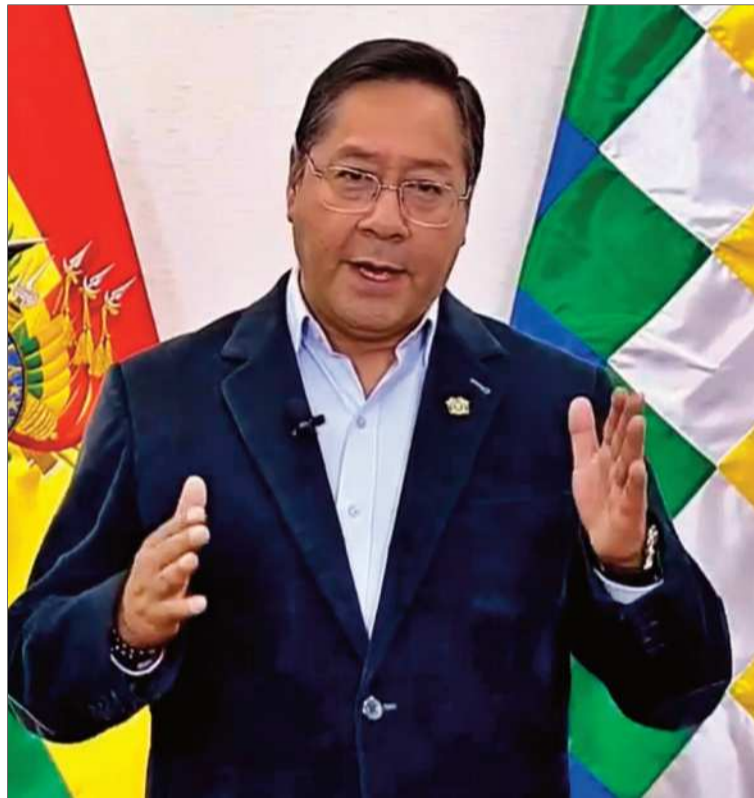
POSICIÓN. El presidente Luis Arce expresó voluntad de dialogar.

El expresidente y jefe del Movimiento Al Socialismo (MAS) Evo Morales acusó al Gobierno de