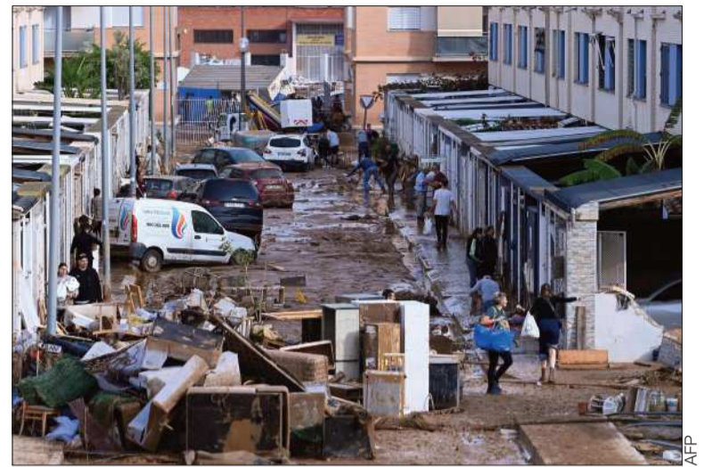
DESASTRE. Calle llena de lodo debido a las inundaciones en España.

Brasil vivió su propia jornada de disturbios poselectorales el 8 de enero de 2023, cuando los partidarios del expresidente Jair Bolsonaro, que cuestionaban su derrota frente a Lula, depredaron los edificios del Congreso y del Supremo Tribunal Federal.