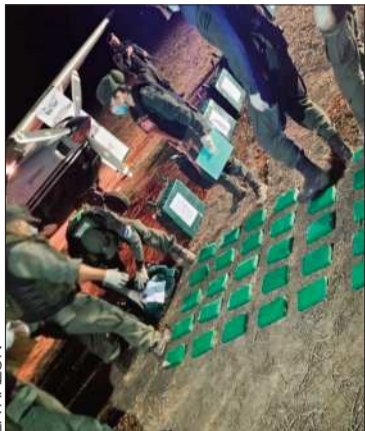
El militar fue detenido en Rosario.

Coronel en servicio pasivo transportaba casi media tonelada de cocaína