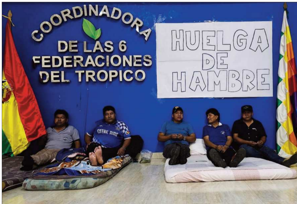
COCHABAMBA. Evo Morales inició una huelga de hambre en la Coordinadora de las Seis Federaciones.

También se declaró en huelga de hambre e instó al Gobierno a convocar una mesa de diálogo para tratar los temas económicos y los inherentes a la situación política del país. "En este afán de cómo cuidar la vida y la situación económica decidí pedir a los compañeros movilizados que pongan en consideración, al Pacto