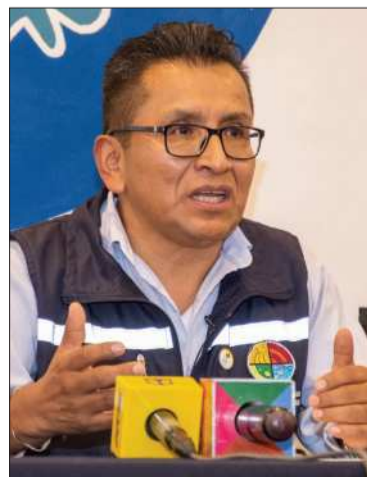
El Defensor del Pueblo.