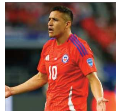
El chileno Alexis Sánchez.

Delanteros: Darío Osorio (Midtjylland, DIN), Alexander Aravena (Gremio, BRA), Maximiliano Guerrero (U de Chile), Lucas Cepeda (Colo Colo), Eduardo Vargas (Atlético Mineiro, BRA), Gonzalo Tapia (Universidad Católica), Felipe Mora (Portland Timbers, USA).