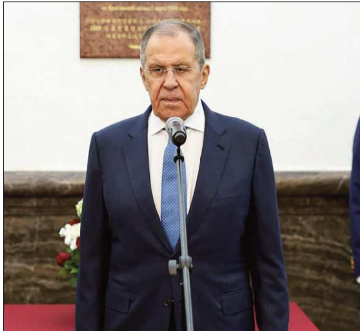
RUSIA. El ministro ruso de Relaciones Exteriores, Serguéi Lavrov.

"No importa quién gane las elecciones, no creemos que la in-