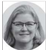
Margaret Renkl es columnista de The New York Times.

Los camiones volcadores que traqueteaban con grava eran malos. Peor aún eran las mezcladoras de cemento alineadas calle abajo. Tuve que arar un macizo de flores para salir de mi propia casa. Pero fueron los taladros de mampostería los que me llevaron al límite. Un día entero de ejercicios de albañilería a gritos puede volver loca a una persona.