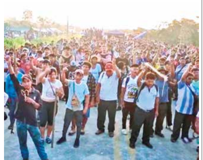
Evistas en cabildo en Ichilo, ayer. RKC