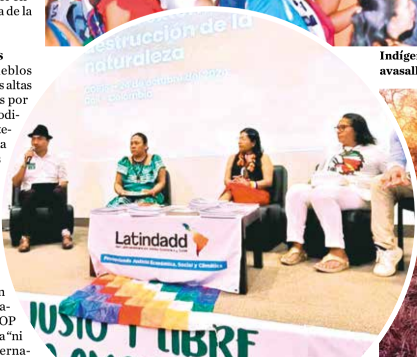
Indígenas en reuniones en la COP16, en Colombia.