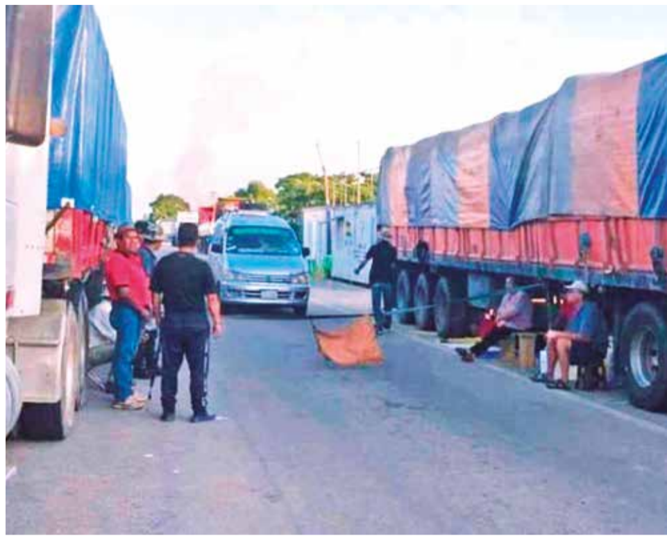
Los vehículos varados en un punto de bloqueo en la vía nueva a Santa Cruz.