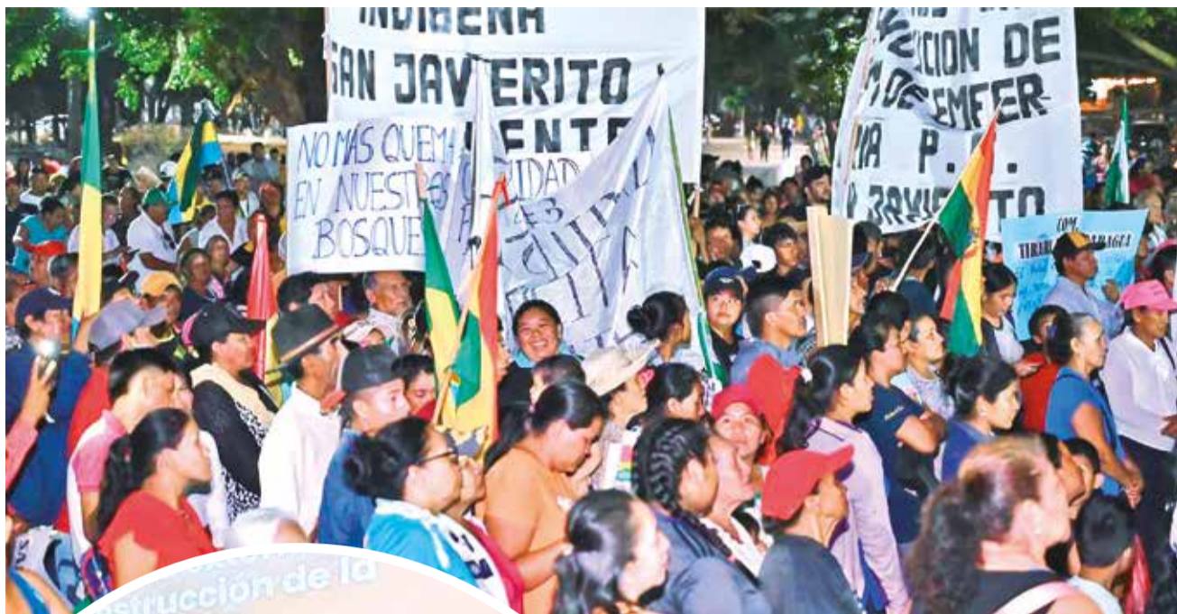
Indígenas marchan a San Ignacio de Velasco en contra de avasallamiento.

En lo que va del año, los incendios forestales superaron los 10 millones de hectáreas, principalmente en los departamentos de Santa Cruz, Beni y el norte paceño, donde