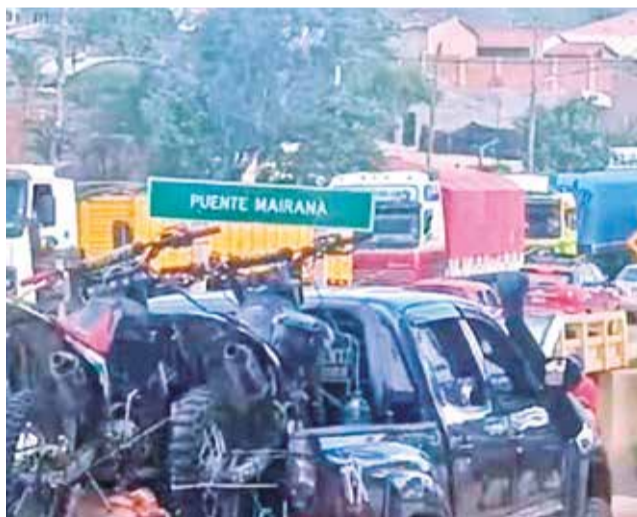
Coches circulan cuatro horas en Mairana, ayer.