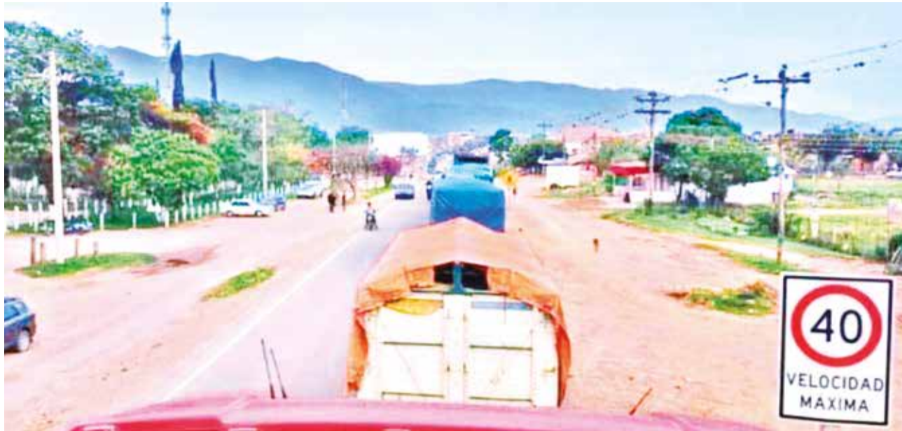
Cientos de vehículos permanecen varados en la región del trópico cochabambino.