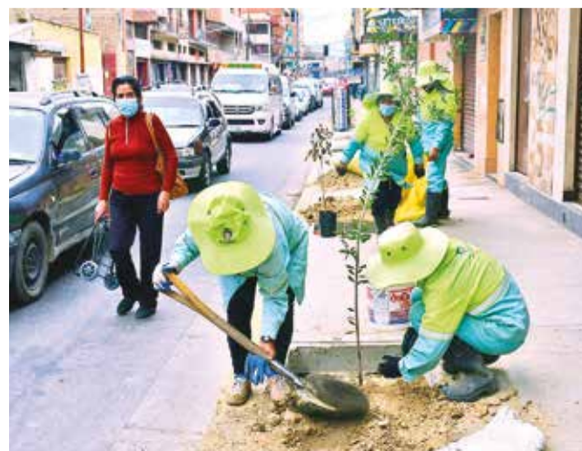
Trabajadoras del Plane reforestan en el centro. C. LÓPEZ