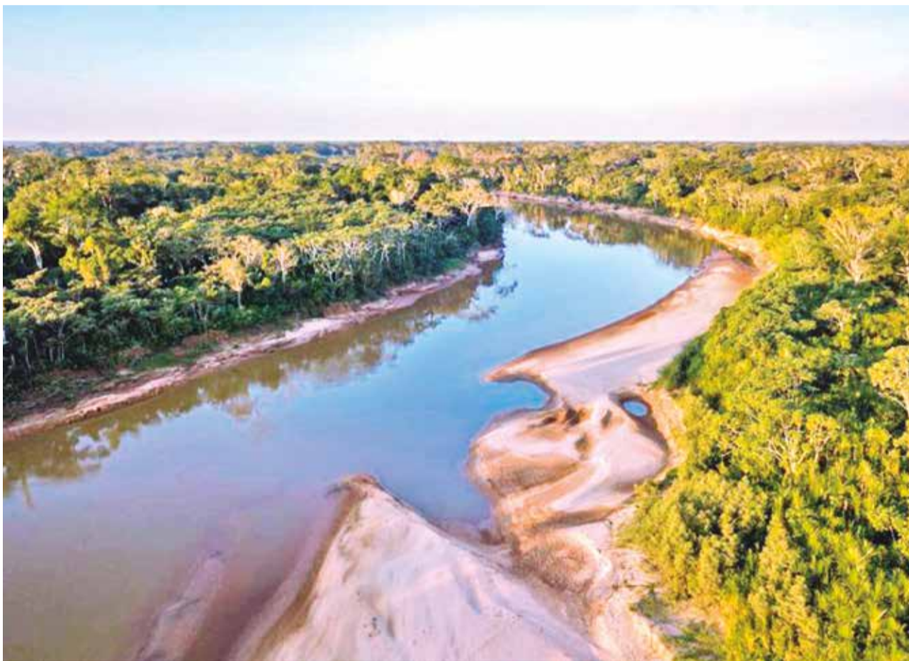
Una sabana de la Estación Biológica del Beni.

El cambio climático, la deforestación, los chaqueos y otras actividades productivas realizadas en la parte alta de la cuenca del río Maniquí ponen en alto riesgo el equi-