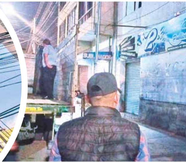
Locales nocturnos en la calle 16 de Julio.