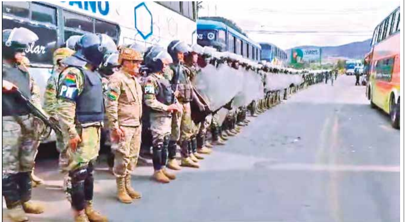
Policía resguarda la ruta al occidente del país, en Parotani.

Los sectores de Morales exigen con los bloqueos que se retiren los procesos judiciales contra su líder por trata de personas y estupro, se resuelvan los problemas económicos y también en defensa de la candidatura presidencial del político para los comicios de 2025.