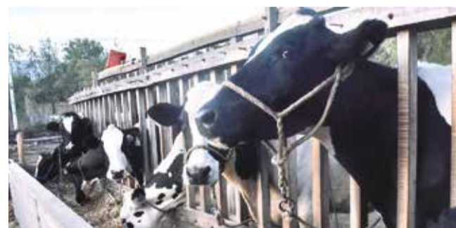
La producción lechera en la región de los valles. JOSÉ ROCHA

Crisis. El sector sufre pérdidas cuantiosas por 22 días de bloqueos y padece por la falta de insumos que llegan desde Santa Cruz.