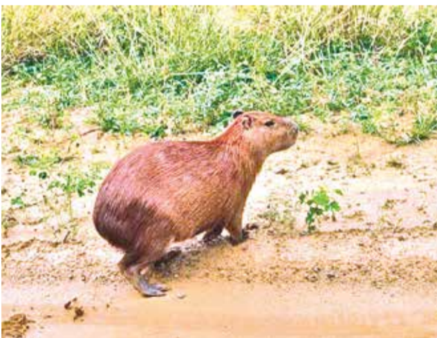
Un capibara en la reserva Pílon-Lajas.