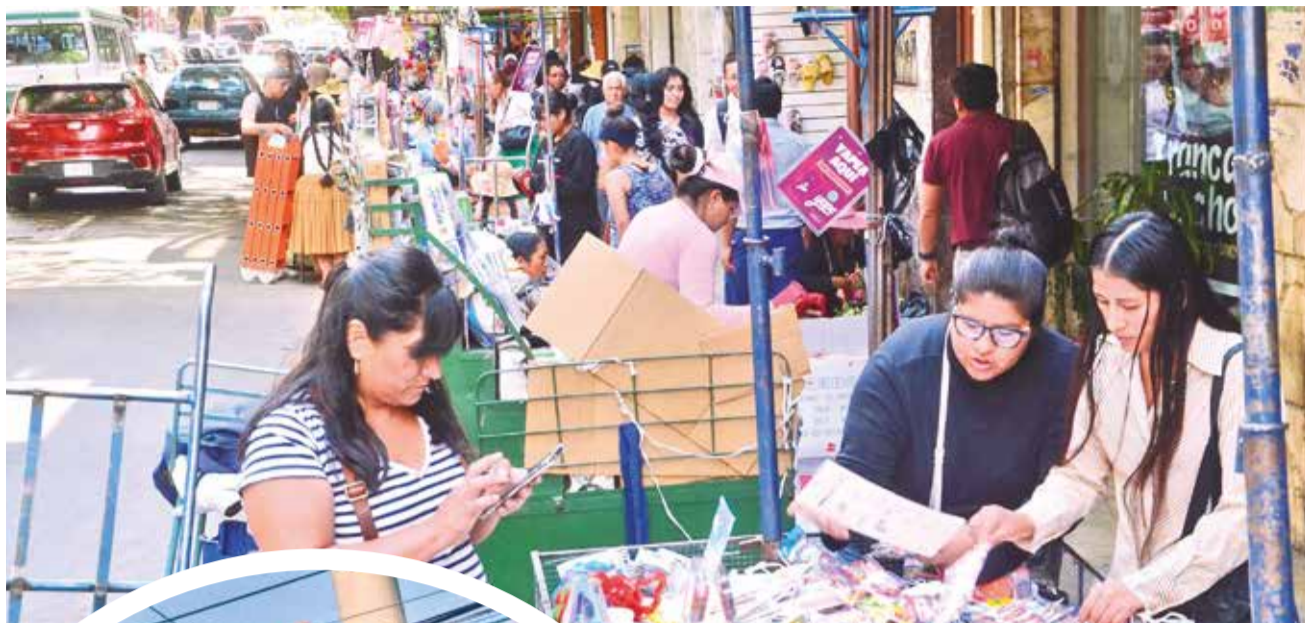
Comerciantes en la av. San Martín. HERNAN ANDIA

Los carros de la Empresa Municipal de Servicio de Aseo (EMSA) circulan por el centro de la ciudad al menos tres veces al día; recogen la basura de las calles, de los centros de abasto y