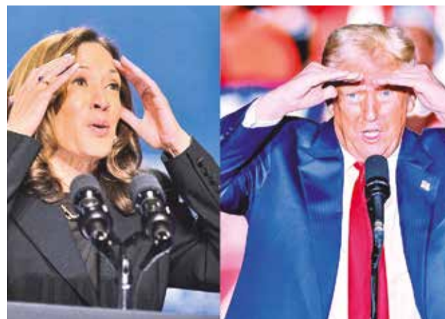
Los candidatos Kamala Harris Donald Trump.

El maratón de mítines de Trump comenzó ayer en el condado de Lancaster, Pensilvania, territorio del grupo religioso, pacifista y tradicionalistas de los amish, para pedir el voto en una comunidad