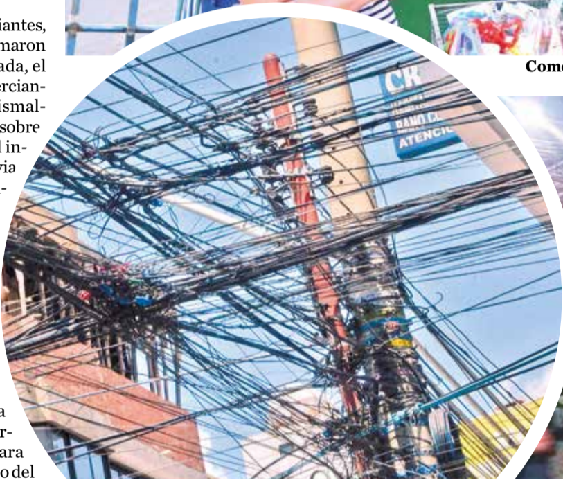
Maraña de cables en el centro de la ciudad. HERNAN ANDIA