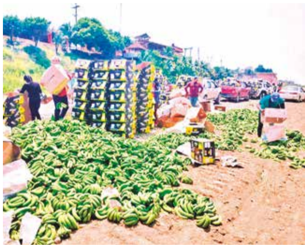
Bananeros tiran su producción, la semana pasada. VICE MIN DE COMUNICACION

Según el reporte, esta situación los daños no sólo tienen un efecto inmediato en términos económicos, sino también se proyectan efectos en la campaña de verano 2024-2025 por falta de insumos que no llegan debido a