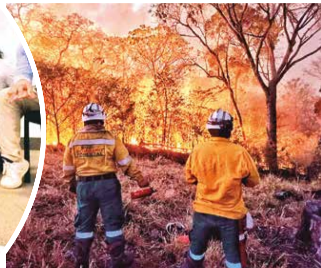
Incendios en la Chiquitanía. GADSC