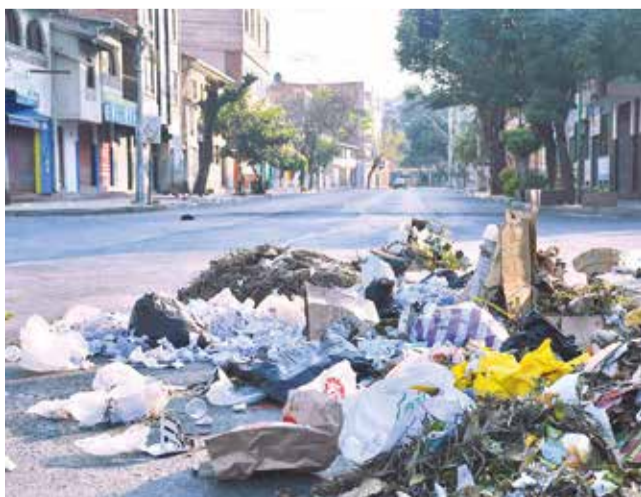
Basuras en las calles del centro de la ciudad. CARLOS LÓPEZ

Datos. Los vecinos impulsan la reforestación en las aceras del centro. Medio Ambiente anunció que los trabajos iniciarán en la época de lluvias para garantizar el “prendimiento” de los plantines