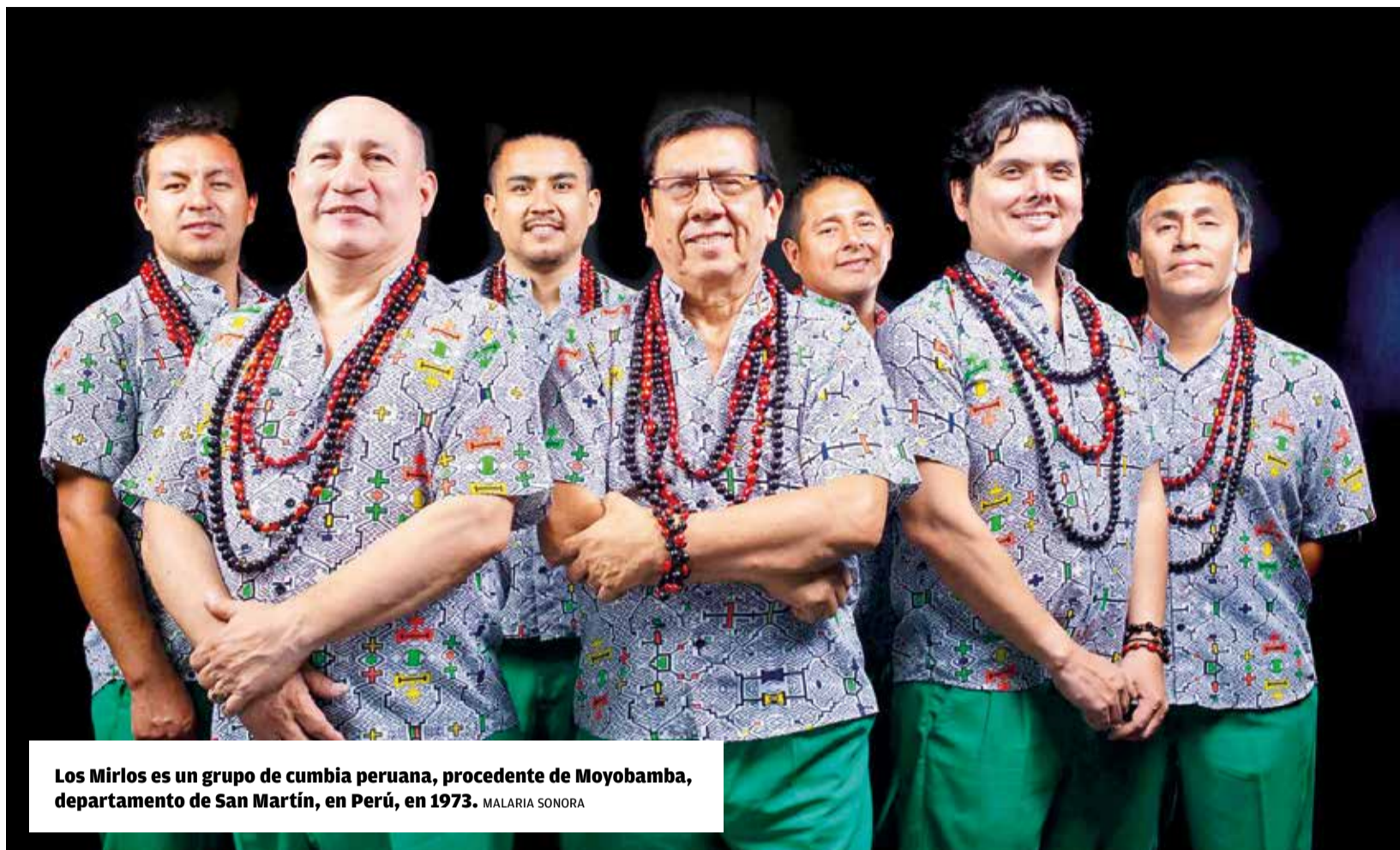
Los Mirlos es un grupo de cumbia peruana, procedente de Moyobamba, departamento de San Martín, en Perú, en 1973. MALARIA SONORA