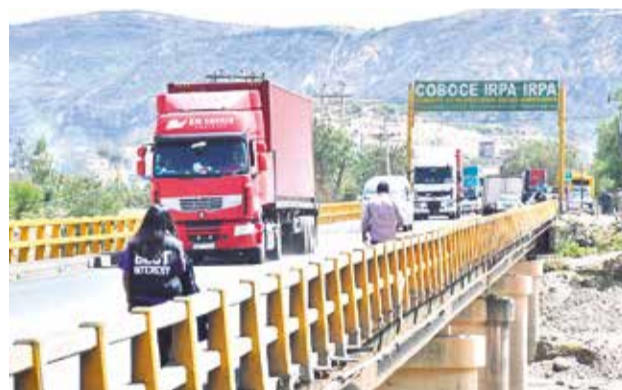
La circulación de autos en el puente Parotani. CARLOS LÓPEZ

Se prevé que esta semana el cupo de entrega se reduzca más.