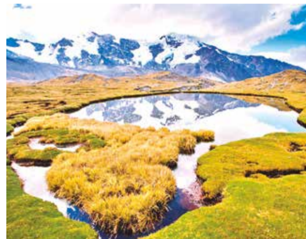
El Parque Nacional Apolobamba.

librio de la reserva, que es la única área protegida que conserva la sabana beniana.