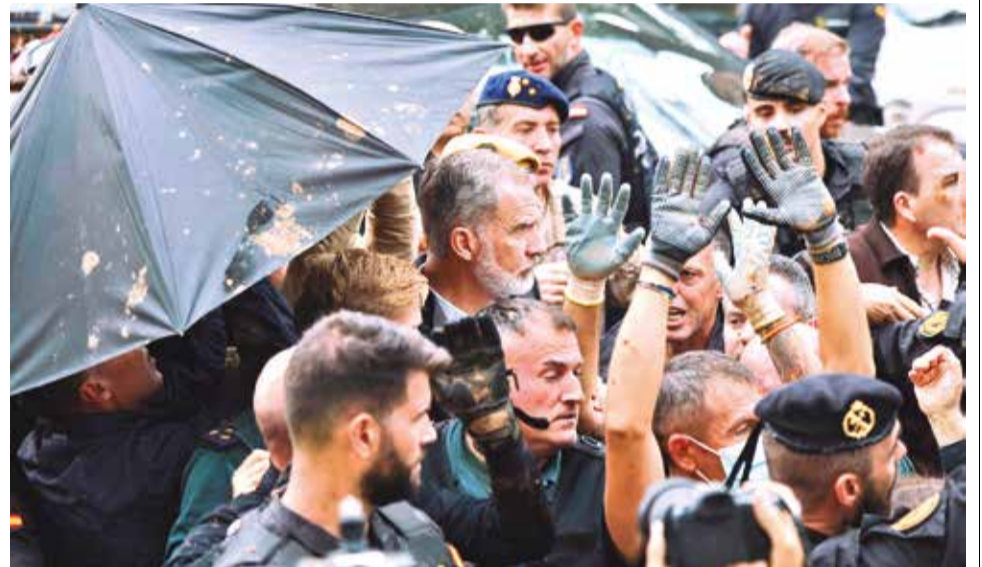
El rey de España, Felipe VI, protegido por su guardia del barro que le echan vecinos.

Felipe VI escuchó pacientemente al menos a una decena de vecinos, a los que repetía fórmulas como “lo entiendo” o “hacemos todo lo que podemos hacer” ¿Y Sánchez dónde está? El rey está dando la cara”, preguntó uno de los presentes a los periodistas.