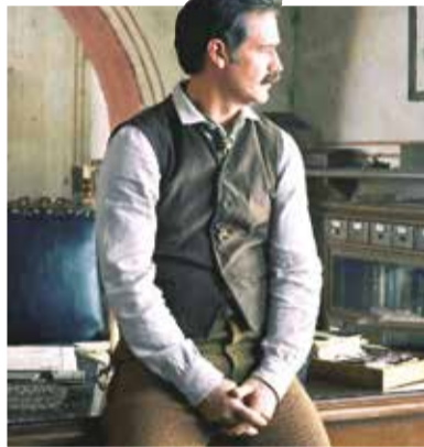
Fotogramas de las series y películas que se estrenan en noviembre.