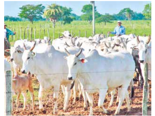
Ganado en la región cruceña. ECONOMY