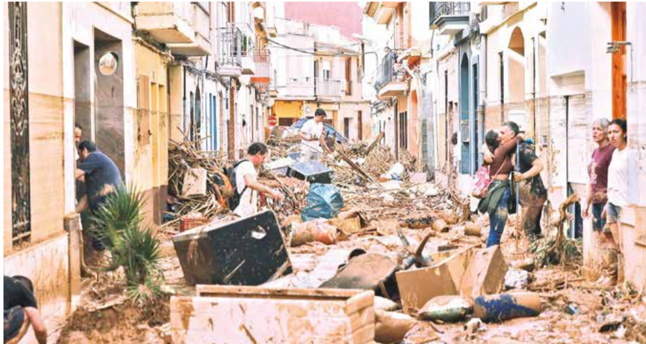
Una calle de Paiporta, a 10 kilómetros de la capital valenciana, donde la riada tuvo consecuencias más graves. EFE

“La gente va como loca en las calles, desesperada, buscando de todo”, pero en los supermercados no queda “nada de nada”, relató a EFE en una conversación telefónica desde su vivienda, en una cuarta planta de un edificio de cinco de Paiporta, considerada la zona cero de las inundaciones.