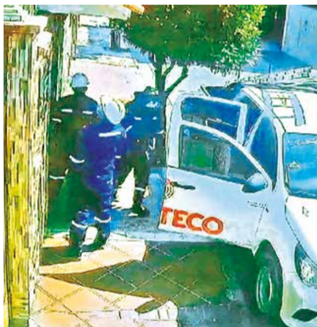
La camioneta usada para el robo a una casa.

Además, la víctima contó que los delincuentes desordenaron su casa para buscar el dinero. “Estas personas in-