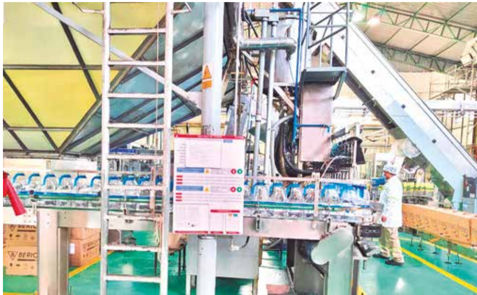
Algunas empresas continúan sus operaciones a pesar de los desafíos que enfrentan. WS

El impacto se extiende al sector agropecuario, que requiere insumos, como semillas y fertilizantes, y la distribución de productos parece-