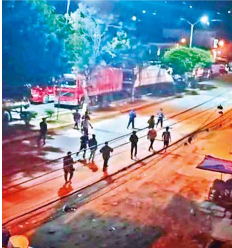
Nuevos enfrentamientos en Mairana dejaron al menos tres heridos.