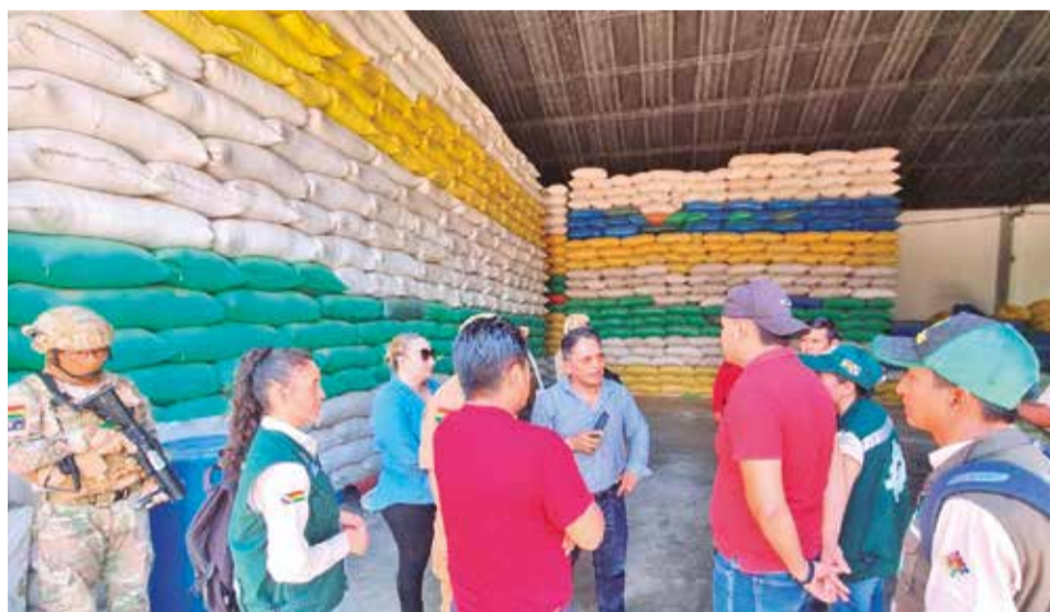
Autoridades inspeccionan un ingenio arrocerero en el municipio cruceño de Montero. VDDUC

Durante la inspección, Silva indicó que, si bien los ingenios arroceros disponen de suficiente arroz para abastecer el mercado nacional, la distribución de este y otros productos —como carne de pollo, res y cerdo— ha sido obstaculizada por los blo-