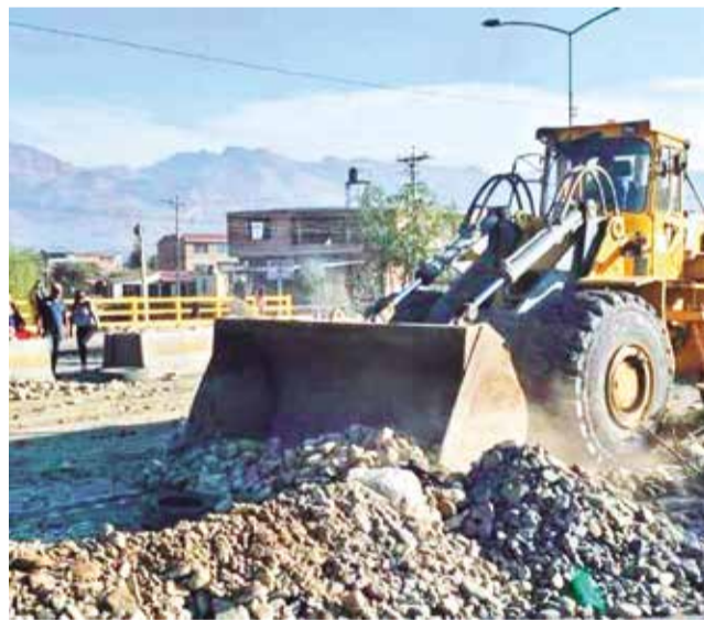
Limpieza en Vinto luego de levantar el bloqueo.

redes sociales se observa a un joven ensangrentado, presuntamente herido por una piedra en la cabeza.