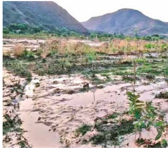
El desborde de un río en Pojo afecta sembradíos. RRSS.