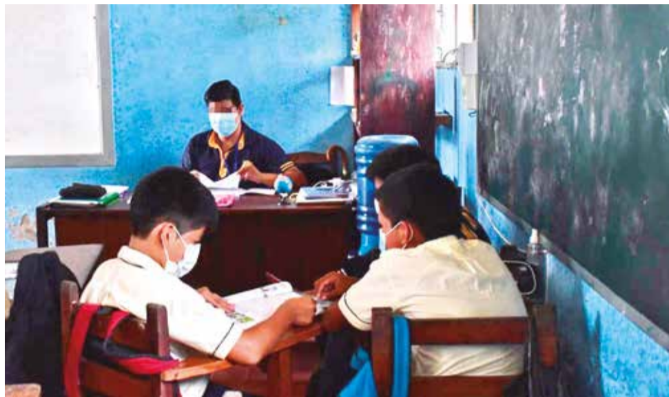
Las clases en una unidad educativa del trópico de Cochabamba. CARLOS LÓPEZ

Detalló que de los 2 mil maestros afectados, cerca de 800 se encuentran en el trópico, lugar en donde ya no existe presencia policial desde el pasado martes por las amenazas de los afines al expresidente Morales.