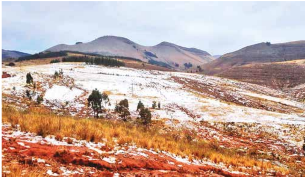
La granizada que dañó cultivos en el municipio de Alalay.