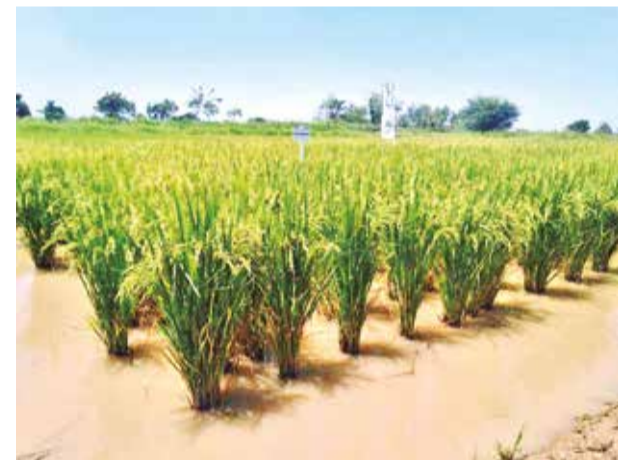
Cultivos de arroz en Santa Cruz.

“El productor que cuenta con algo de diésel ha podido sembrar, pero la mayoría no tiene lo necesario para comenzar”, advirtió Ortiz en entrevista con Canal Rural. La situación se agrava con los bloqueos logísticos, que han dificultado la llegada de insumos agrícolas a las zonas productoras. La región del Beni, que también depende del diésel para sus actividades agrícolas, enfrenta una crisis similar: aunque las lluvias recientes han sido favorables, la falta de combustible pone en riesgo la producción.