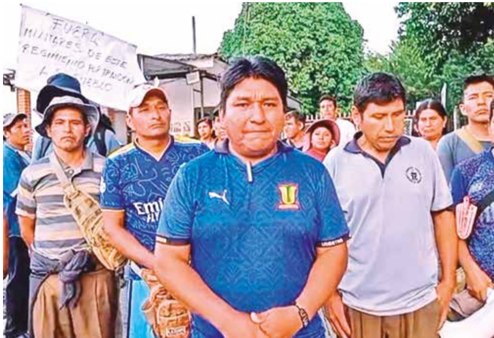
Dirigentes dan conferencia sobre la toma de la Novena División de Chimoré, ayer.