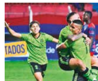
Partido Wilster Cooperativas vs. Nueva SCZ. CNSCA FC

El primer cotejo se jugará hoy (15:00), con Ciudad Nueva Santa Cruz AFC vs.