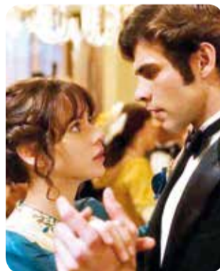
Fotogramas de la serie que se estrenará este 3 de noviembre en Max.