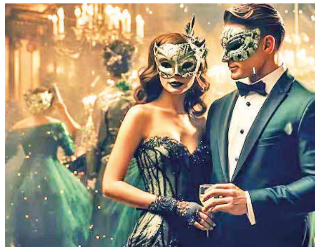
Imagen referencial de lo que será “La mascarada”.

La invitación promete un encuentro de ensueño en “La Abadía Fortificada”, con la presencia del Príncipe Próspero, quien seleccionará a 1.000 asistentes entre los ca-