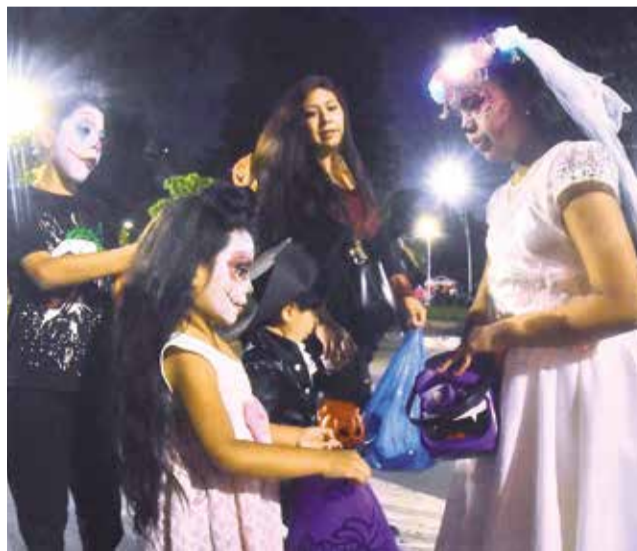
Niños y padres pasean disfrazados por El Prado. JOSÉ ROCHA

La celebración se concretó el 31 de octubre con una oferta variada de disfraces y decoraciones. Como de costumbre, uno de los sectores donde