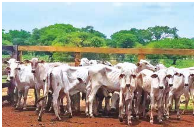
Reses en una estancia ganadera en Santa Cruz. APG

los ganaderos, afecta sus derechos y pone en riesgo la estabilidad de su sector. En una reunión extraordinaria, representantes del gremio expresaron su rechazo a la medida y solicitaron un encuentro urgente con las autoridades para evaluar el impacto del decreto y avan-