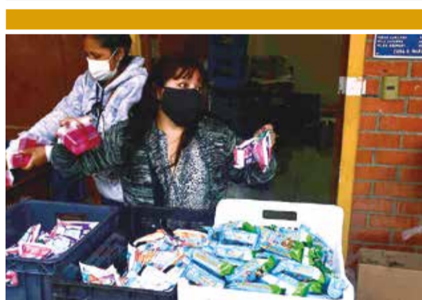
Algunos productos del desayuno escolar. CARLOS LÓPEZ

Revollo contó que varios educadores hacen transbordos para llegar a sus unidades educativas a pasar clases, una situación que ya es insostenible por los altos costos.