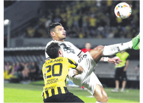
Incidencia del partido jugado anoche entre Peñarol y Botafogo en Montevideo

El equipo brasileño se clasificó por la goleada 5-0 de la anterior semana con el mismo rival