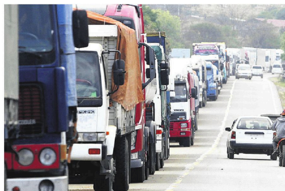
El bloqueo en Mairana perjudica al transporte de alimentos

Poco antes, el mandatario exigió "el levantamiento inmediato de todos los puntos de bloqueo para el restablecimiento de la normalidad en nuestro país" y aseguró en su mensaje que "no puede haber ningún diálogo sin levantar los bloqueos y las medidas de presión que