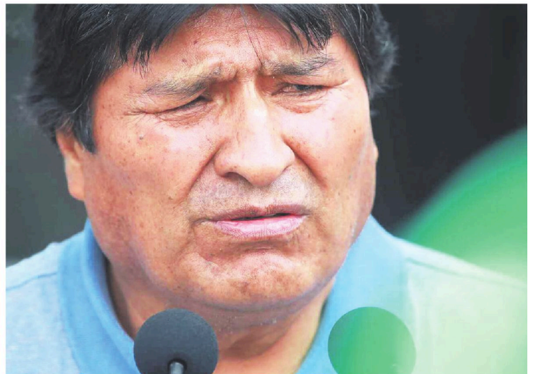
El expresidente Evo Morales fue entrevistado por medios internacionales y se refirió a su situación

El exmandatario sentenció que el ministro Del Castillo es su “enemigo” porque él lo ha afectado “económicamente”, al denunciar la corrupción dentro de la Policía Boliviana.