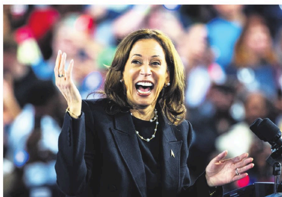
La campaña de Kamala Harris censuró el comentario de Joe Biden

“Déjenme decirles algo. (...) La única basura que veo flotando por ahí son sus seguidores”, dijo Biden, unas palabras que la