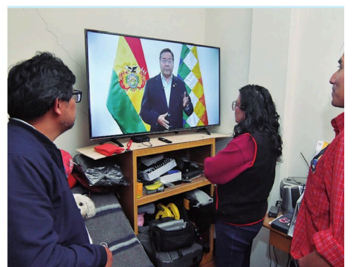
El discurso televisado del presidente Luis Arce Catacora

En los 18 días de bloqueo, la Policía intentó levantar sin éxito varios puntos clave. El martes estalló la violencia en Mairana y el viernes pasado se produjo una resistencia con explosivos en Parotani, Cocha-