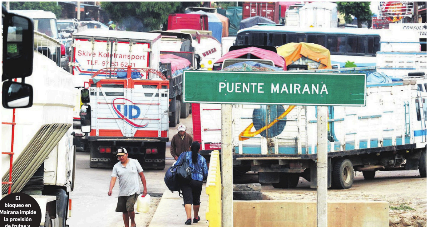
El bloqueo en Mairana impide la provisión de frutas y verduras

PERJUICIOS POR B En Santa Cruz hay escasez de carburantes y se encareció el precio de verduras y frutas que se producen en la zona.