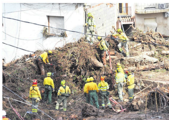
La tromba arrastró todo lo que tenía a su paso por Valencia

Además, las lluvias torrenciales que azotan Castilla-La Mancha provocaron ya dos muertes, una en Mira (Cuenca) y otra en Letur (Albacete), donde continúa la búsqueda de cinco personas desaparecidas y hay desplazados alrededor de 300 efectivos de emergencias, mientras que en Málaga, un hombre de 71 años, que fue rescatado de su vivienda