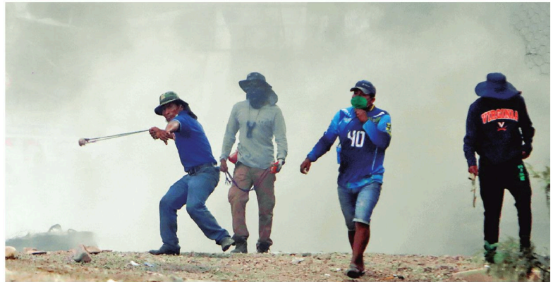
La intransigencia mostrada por sectores evistas anula las posibilidades de un diálogo con el Gobierno