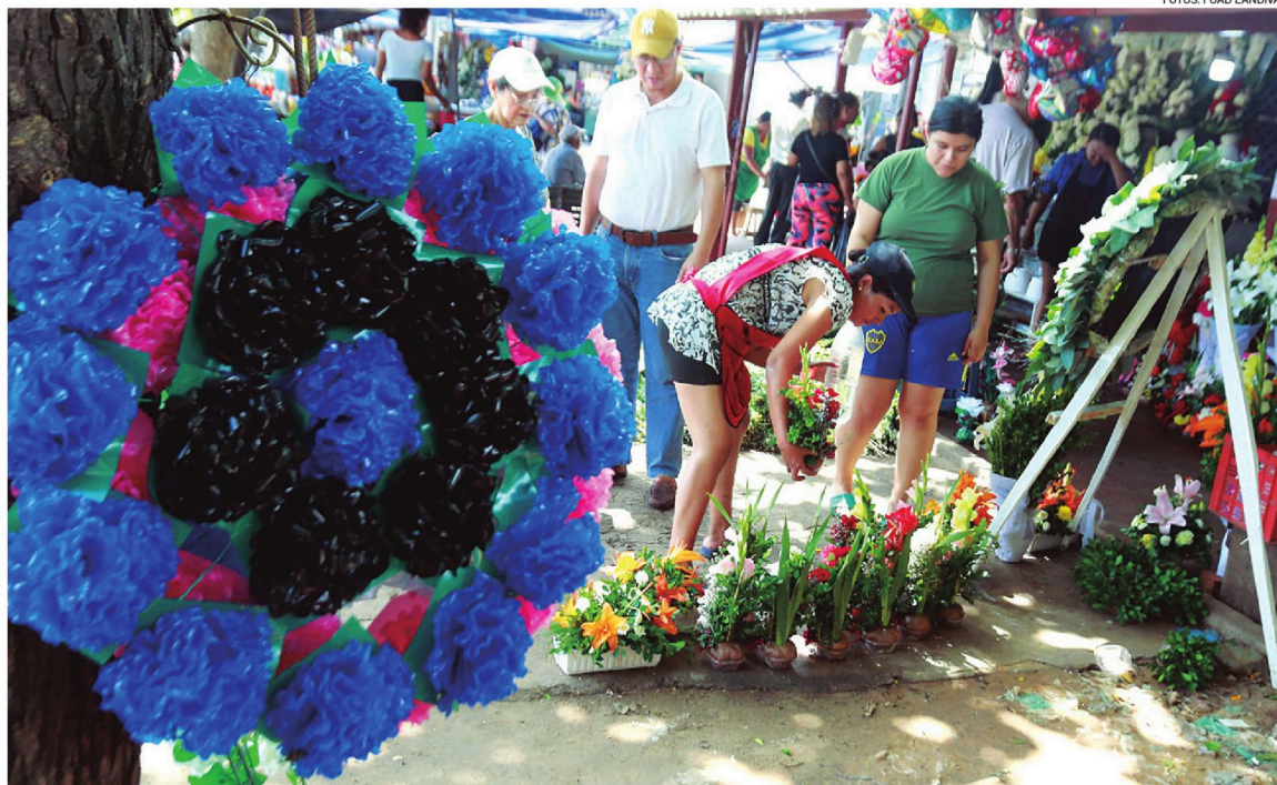
Las coronas de hule se exponen en las florerías de los cementerios. Hay desde Bs 10 hasta Bs 50, dependiendo del tamaño