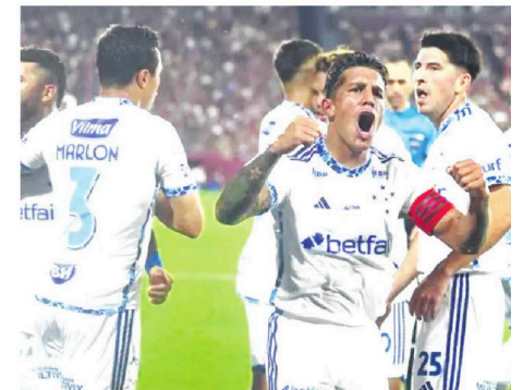
La celebración de los jugadores de la Raposa luego de que se sellara el triunfo

Otro golazo de Baco corrían 66 minutos iluminó más al Aurinegro, pe Almada descontó a Botafogo y Facundo Izolet cerró el partido con el 3 a 1 final. (EFE)