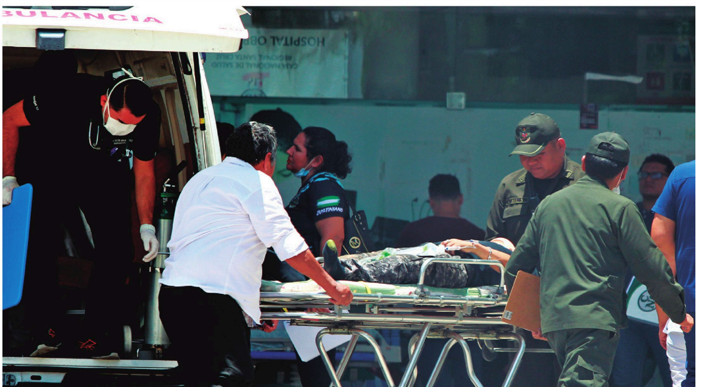
Los policías heridos fueron trasladados desde Mairana a diferentes centros de Santa Cruz para que reciban atención médica. Son 27 los que están en la caja nacional