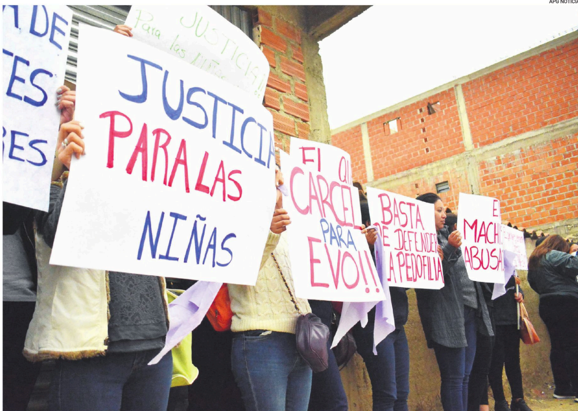
Hace unas semanas se registraron una serie de manifestaciones en contra del expresidente Evo Morales en diversos puntos del país.