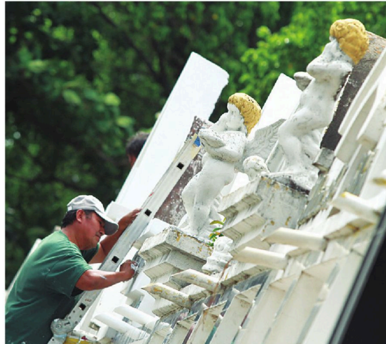
La gente aprovechó el último día para limpiar y pintar los mausoleos

Está prohibido ingresar con bebidas alcohólicas a los camposantos