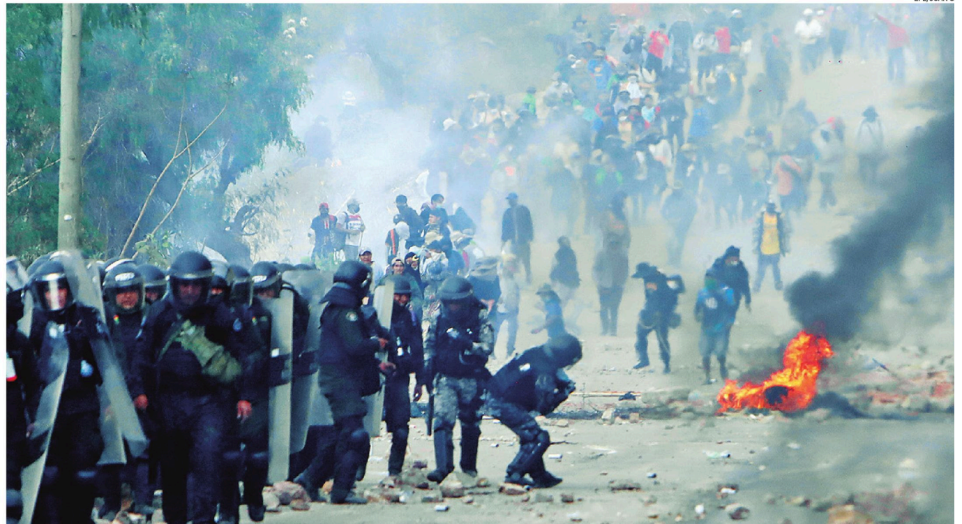
Policías intentan despejar las carreteras para facilitar el transporte al interior del país. Los bloqueadores recurren a dinamita, piedras y palos para enfrenar a los uniformados.

PRESIDENTE DENUNCIA DOBLE DISCURSO QUE AHOGA A LA POBLACIÓN