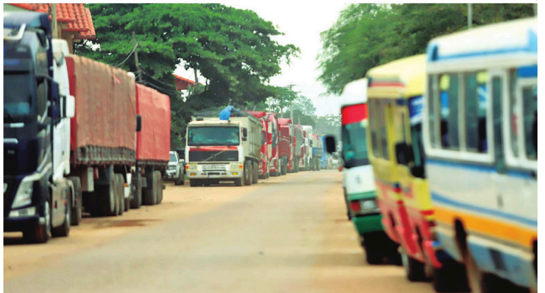
Las filas a la espera de combustible siguen en Santa Cruz, pese al anuncio de una normalización gradual realizadas por las autoridades.