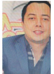
El comunicador Mau

La salida de Mondino se confirmó al cabo de una ola de rumores sobre su inminente eyección del Gabinete de Milei tras el voto de Argentina en la Asamblea General de la ONU.