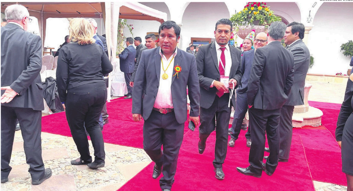
El diputado Israel Huaytari en los actos protocolares por el 6 de Agosto, en la ciudad de Sucre

"NI PAGADO" Israel Huaytari dijo que "ni pagado" volverá a ser presidente de la Cámara de Diputados.