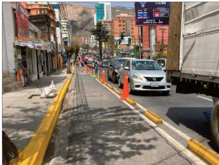
RUTA. La ciclovía que se construyó en la zona Sur de La Paz.

En Piedra, Papel y Tinta , de La Razón , la autoridad puntualizó que, después de hacer una reconulta,