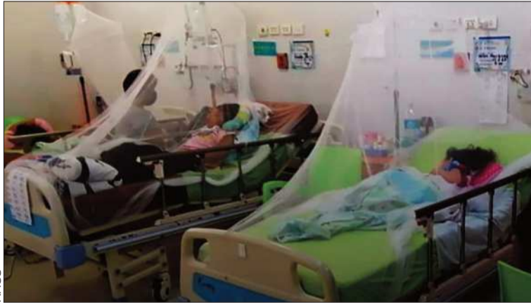
ENVENENADOS. Los niños fueron internados en el Hospital Holandés.

SEGURIDAD. Los médicos lograron salvar la vida de los menores de edad