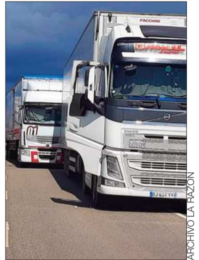
Unidades de transporte pesado.

Diversos actores y sectores, así como el propio Gobierno, rechazan la medida de presión del evismo.