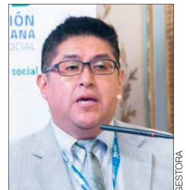
El gerente de la Gestora.

Según Durán, la idea de ampliar la edad de jubilación en Europa “implica que también tengan que trabajar 40 a 45 años”. “En cambio, en mi país, hemos bajado a los 58 años de edad y una persona puede jubilarse con 10 años de aporte”, ejemplificó.