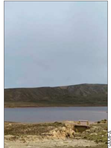
Las represas están abastecidas.

Se pidió medida para no repetir problemas como el de 2023, cuando las lluvias escasearon.