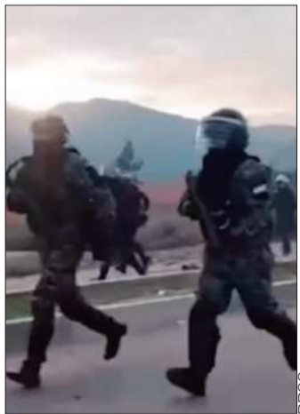
Policías en Mairana, Santa Cruz.

Hasta la fecha, 61 efectivos policiales fueron heridos en los enfrentamientos con los bloqueadores del ala evista del Movimiento Al Socialismo (MAS).