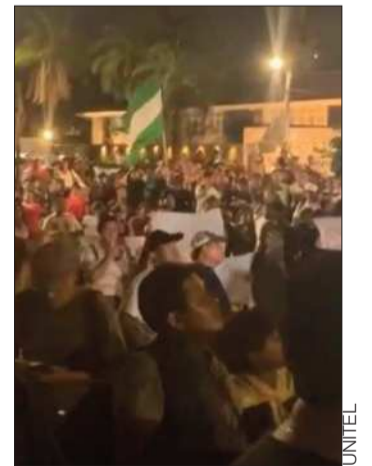
UJC frente al comando policial.

Varios dirigentes del evismo afirmaron que para que se levante el bloqueo, el Gobierno debe anular las investigaciones en contra del exmandatario.