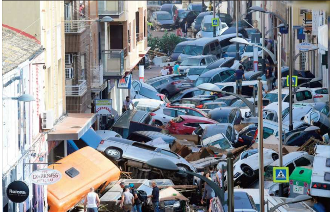
DESASTRE. Vehículos amontonados en el sur de Valencia después de las inundaciones mortales.

La agencia estatal de meteorología Aemet registró "acumulacio-