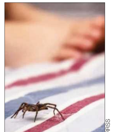
Picada por araña, muere mujer.

Uno de los reclamos de las autoridades en salud es que la paciente demoró en buscar ayuda médica y esperó a que su estado de salud se complique.