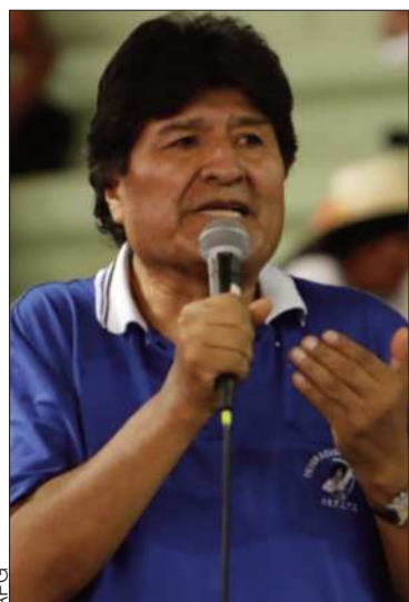
El expresidente Evo Morales.

El expresidente dice que ‘solo el diálogo sincero’ resolverá los problemas