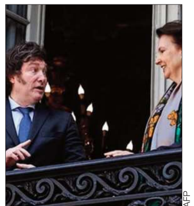
Milei junto a Mondino en un acto.

Hace dos semanas Milei destituyó al embajador en la ONU, e instó al cuerpo diplomático a alinearse con su política exterior.