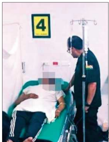
Varios policías fueron heridos.