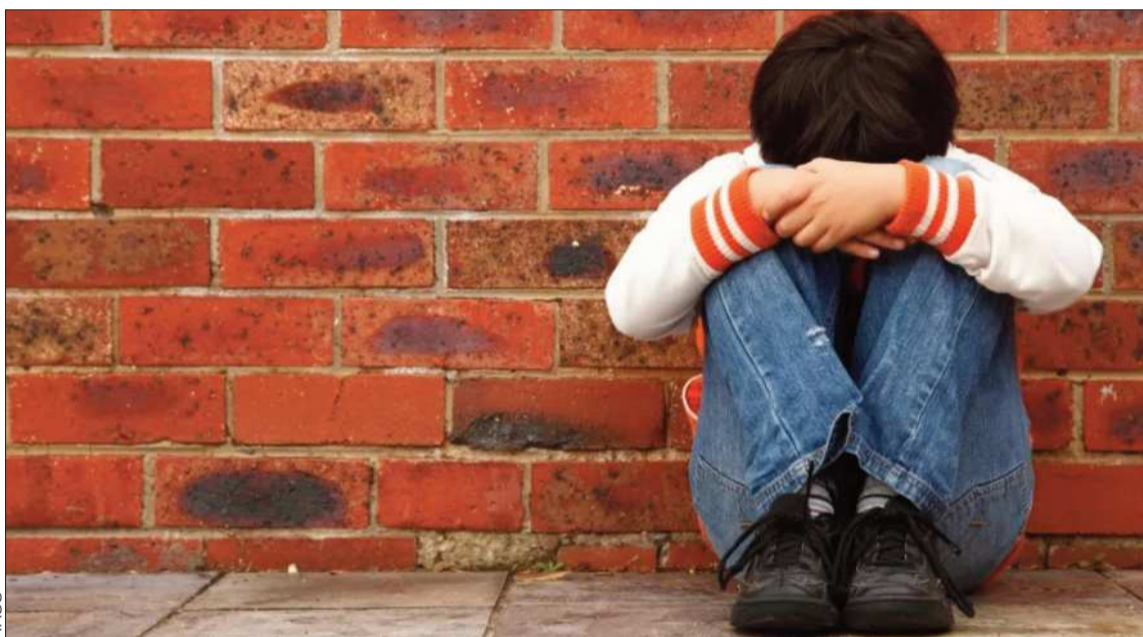
VIOLACIÓN. Un menor de edad fue víctima de violación grupal en un internado de San Lorenzo, en Tarija.

La mujer fue aprehendida. Será imputada por tentativa de infanticidio. Buscan al padre de los menores.