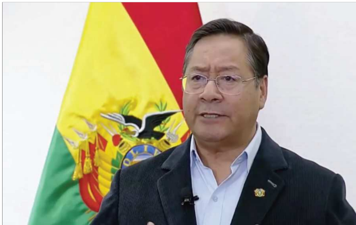
POSICIÓN. El presidente Luis Arce brindó un mensaje a la población respecto a los conflictos sociales.

Desde hace días, sectores sociales, organizaciones sociales y al-