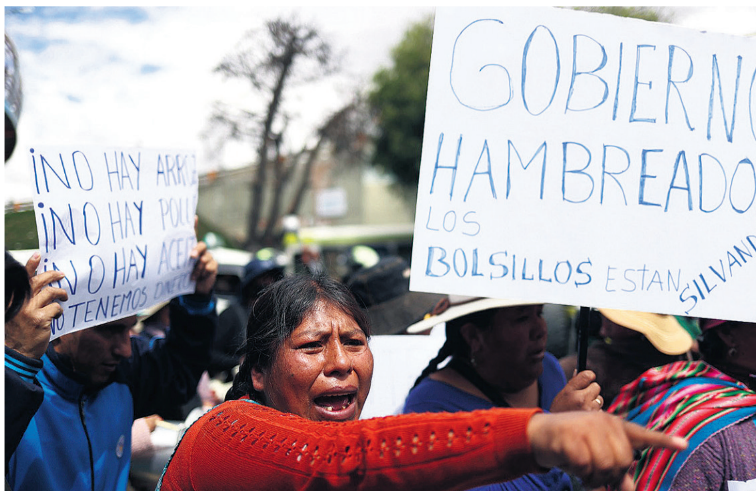
Juntas vecinales y amas de casa han salido a protestar ante la escasez de los productos de primera necesidad y la elevación de precios

provisiones para el fin de semana, aunque estas ya están nuevamente agotándose. “Tenemos alimento máximo hasta el miércoles o jueves. Ya nos han informado que no hay arroz ni otros insumos básicos. Las empresas harán lo posible por ayudarnos, pero el abastecimiento es incierto”, insistió.