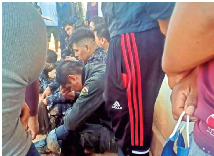
Periodistas y policías estuvieron retenidos por los manifestantes

"Hoy hemos sido testigos de una serie de hechos de violencia en la zona de Mairana, ha habido una serie de situaciones violentas y la Defensoría del Pueblo se ha sumado a las negociaciones junto