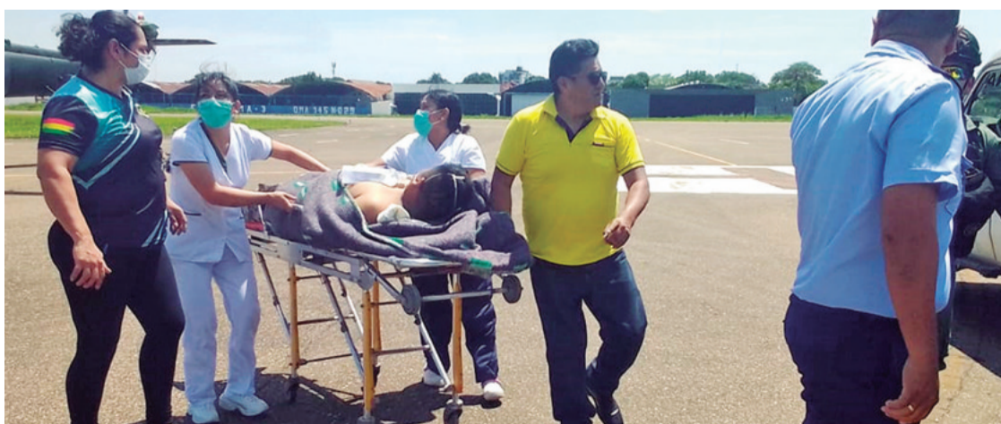
El subteniente, el más grave de los heridos, fue trasladado desde Mairana para ser internado en la CNS

dos en la Caja Nacional de Salud de Santa Cruz (CNS), donde reciben atención médica.