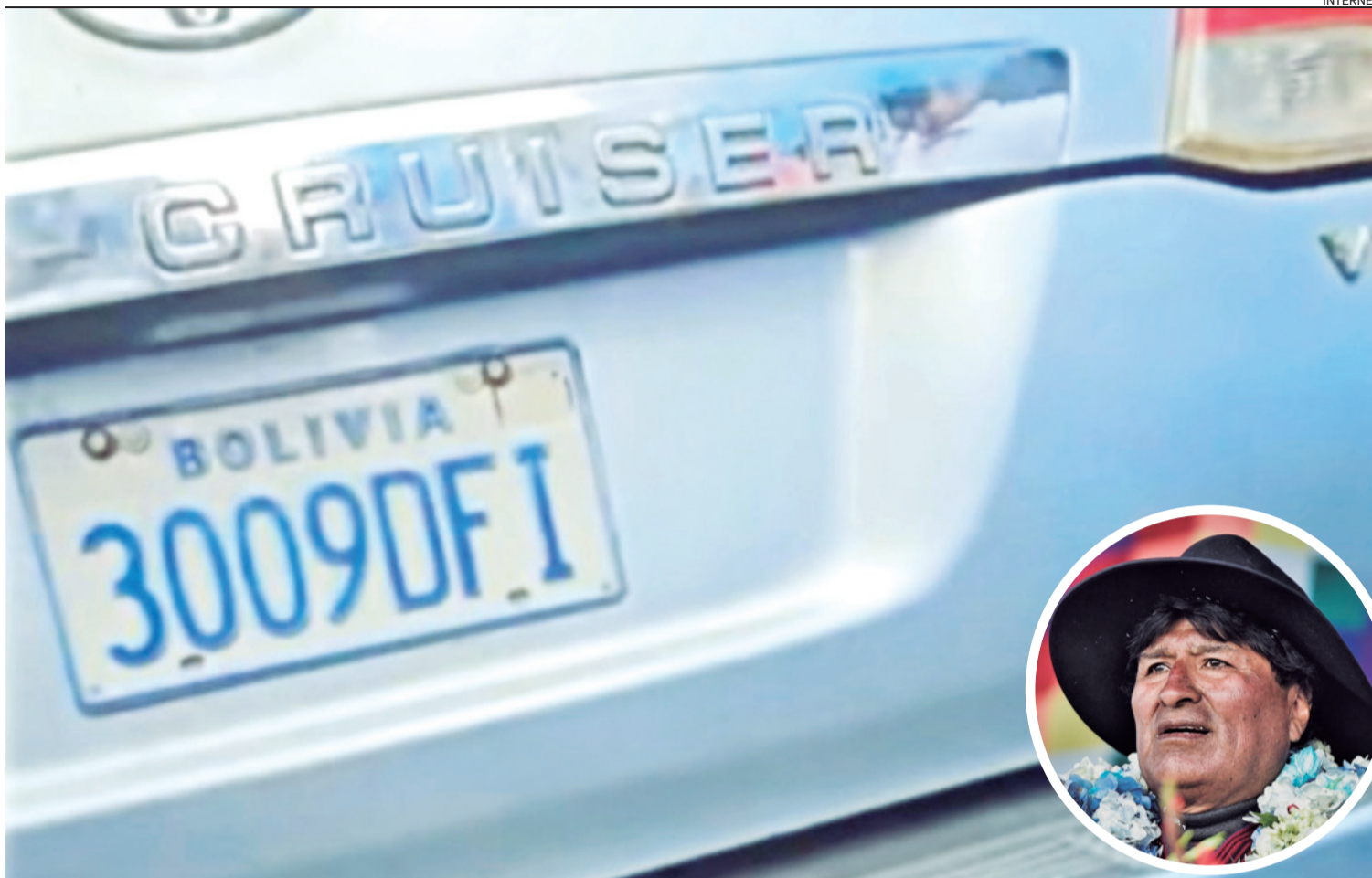
El vehículo en el que se transportaba el pasado domingo Evo Morales es de propiedad de un ejecutivo de la estatal petrolera venezolana