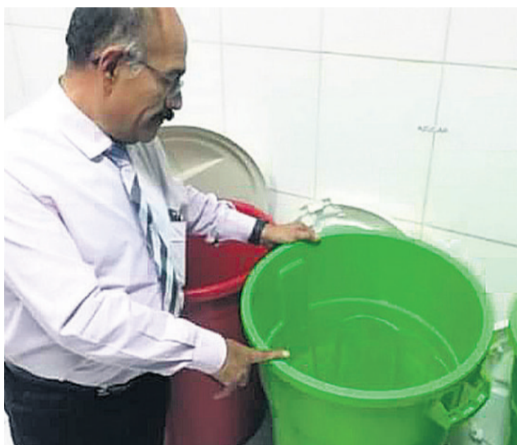
La semana pasada, el secretario de Salud mostró las despensas vacías

Los ciudadanos piden que se habiliten las vías para el paso de los alimentos