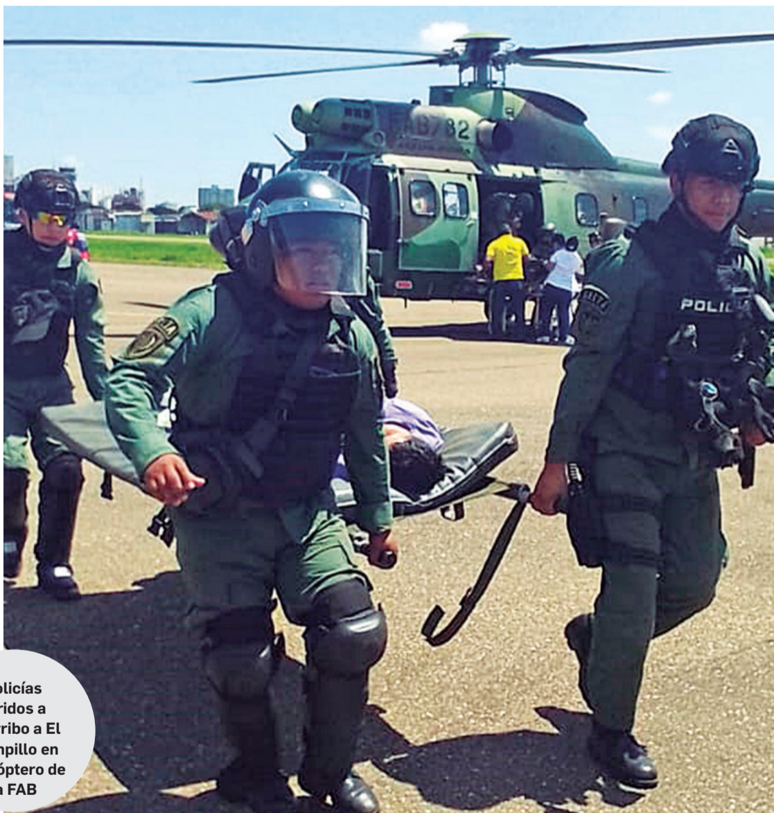
Policías heridos a su arribo a El Trompillo en helicóptero de la FAB

Tras este hecho en Mizque, desde la madrugada de ayer en Mairana los bloqueadores hirieron a un total de 27 policías, uno de los cuales está grave. Todos los uniformados fueron trasladados en al menos tres viajes a Santa Cruz en helicópteros Super Puma de los Diablos Rojos de la Fuerza Aérea Boliviana (FAB) para ser interna-