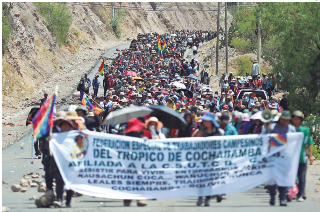
Las bases de Evo Morales salieron a marchar en Parotani exigiendo la renuncia del presidente Arce

A pesar de las gestiones de la Defensoría del Pueblo, no existe ningún acercamiento entre el Gobierno y el evismo