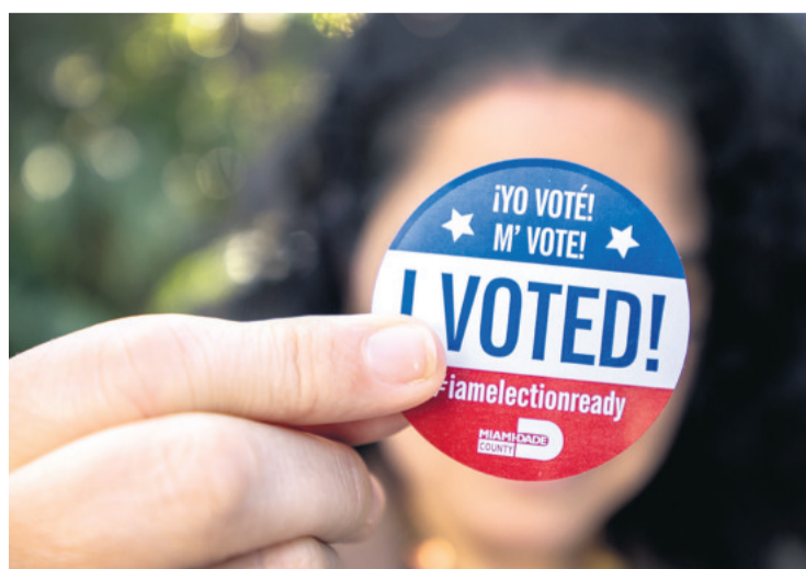
La campaña electoral en Estados Unidos entra en la recta final

En las elecciones de medio mandato de noviembre de 2022 los demócratas perdieron el control de la Cámara Baja y mantuvieron el Senado. Así, los republicanos tienen ahora en la primera 220 de sus 435 escaños y la formación de Joe Biden goza de la mayoría en el Senado con 47 de sus 100 asientos y el apoyo de cuatro indepen-