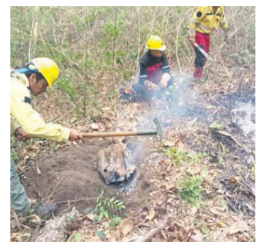
Se continúa combatiendo el fuego

Áreas Protegidas), desde el inicio de los incendios en Bolivia hasta el 22 de este mes, se han rescatado 810 animales silvestres, entre mamíferos, reptiles y aves. De estos, 783 fueron rescatados en Santa Cruz y 27 en Beni. Hasta el momento, 754 fueron liberados, 17 están en rehabilitación y 39 murieron.