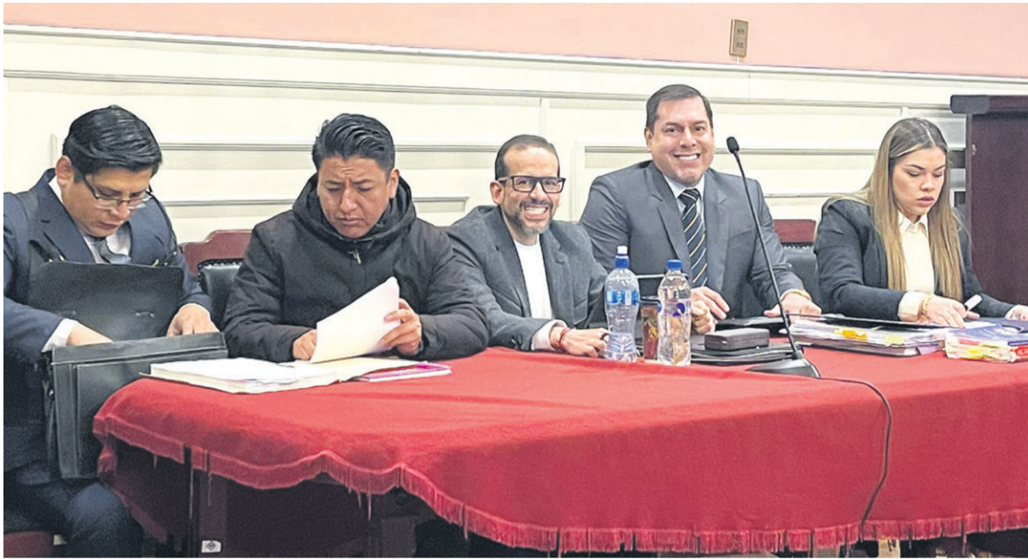
El gobernador Luis Fernando Camacho y el excívico Marco Pumari, junto a sus abogados en la tercera audiencia del juicio del caso "Golpe I"

MARCO PUMARI SE QUEDA EN LA PAZ HASTA SU SENTENCIA