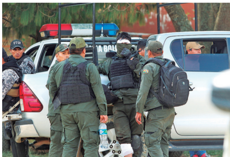
Un policía que fue golpeado con un palo espera ser atendido

Desde la oposición, rechazaron la posibilidad de que Arce renuncie a su cargo y le cuestionaron por la “inacción” frente a los bloqueos que golpean al país.