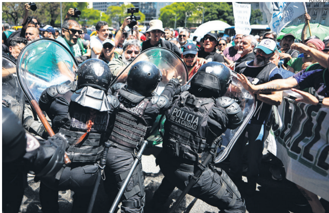
La Policía bonaerense trata de contener a los manifestantes en el centro de la capital argentina

MILES DE EMPLEADOS PÚBLICOS EN LAS CALLES