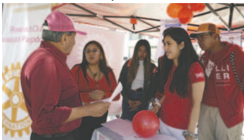
Rotarios brindaron información sobre la Polio

La polio, o poliomielitis, es una enfermedad que ocasiona parálisis y potencialmente la muerte, y generalmente afecta a los niños menores de