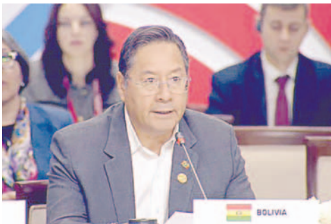
En la Cumbre de los Brics, el Presidente Luis Arce proclamó un “nuevo amanecer” hacia un mundo multipolar que desafía al dólar