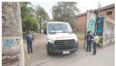
Personal de salud y ambulancias llegan hasta el liceo estudiantil Internado Nacional Barros Arana (INBA) este miércoles, en Santiago (Chile)

LA PATRIA / EFE E l Ministerio de Salud informó este jueves que de los 35 estudiantes que el miércoles resultaron heridos tras explotar una bomba molotov que estaban fabricando, 25 se encuentran hospitalizados y de ellos cinco están en extrema gravedad y 11 en estado crítico. Además, hay otros 17 estudiantes en estado grave internados en distintos hospitales de la capital. La explosión ocurrió en un instituto de Santiago antes de participar en una concentración que iba a celebrarse a las afueras del establecimiento. El accidente se produjo cuando los estudiantes, de entre 14 y 18 años, preparaban el artefacto en uno de los baños del Internado Na-