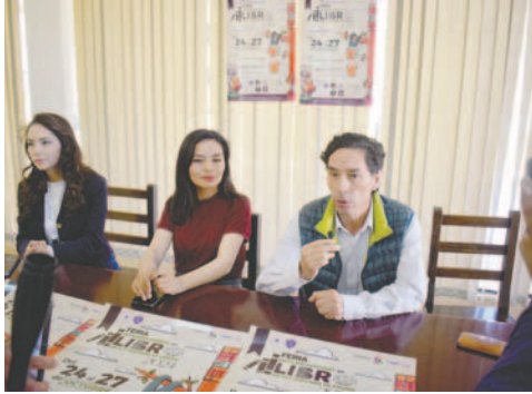
Conferencia de prensa en la que se anunció la reprogramación de la inauguración y actividades previstas para ayer

La inauguración de la Filart debía ser ayer; sin embargo, fue reprogramada para desarrollarse a las