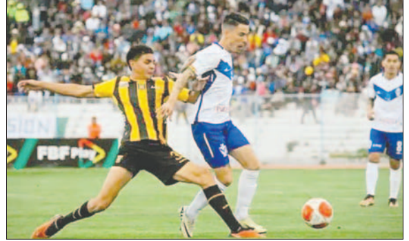
El cuadro orureño tendrá como próximo rival a The Strongest en La Paz

reño saben que deben conseguir un resultado positivo en La Paz para no perderle pisada a Bolívar, que de momento es líder del campeonato Clausura y se va alejando de sus perseguidores.