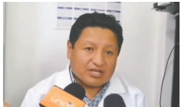
El doctor Roger Rea señaló que el motociclista se encuentra estable a la espera de otros exámenes médicos

medio de los bloqueos que lleva adelante la Federación Departamental de Chóferes San Cristóbal, que pretende que las tarifas