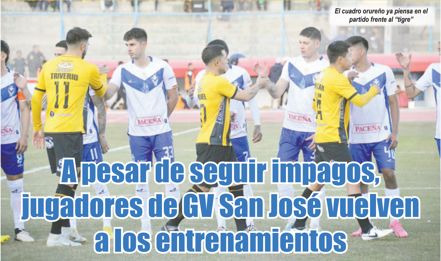
El cuadro orureño ya piensa en el partido frente al "tigre"