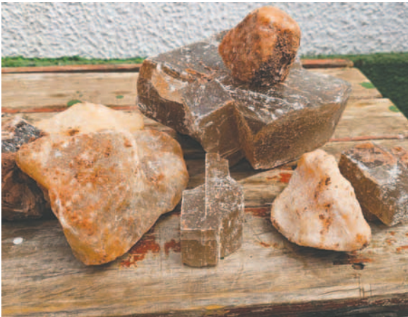
El implicado fue aprehendido en flagrancia explotando sal rosada en el área revertida "Martín Olguita" /AJAM

La AJAM reiteró su firme compromiso con la protección de los recursos minerales, que son patrimonio de todos los bolivianos.