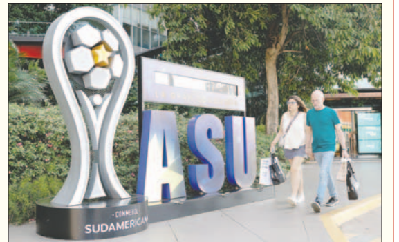
La Conmebol presentó el contador oficial para la final de la Copa Sudamericana

Por su parte, Corinthians empató de local ante Racing 2-2 en el partido de ida de las semifinales, en el estadio Neo Química Arena, en São Paulo. Las revanchas se juegan la siguiente semana.