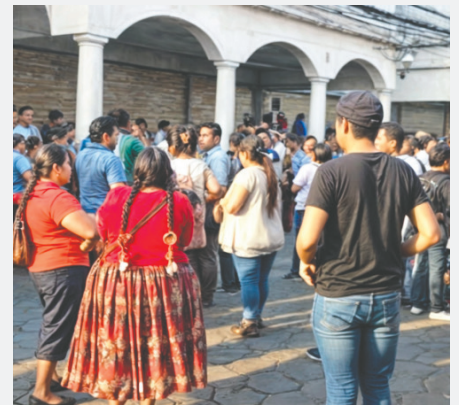
Transportistas bloquearon el ingreso a las oficinas del Servicio de Impuestos Nacionales (SIN)