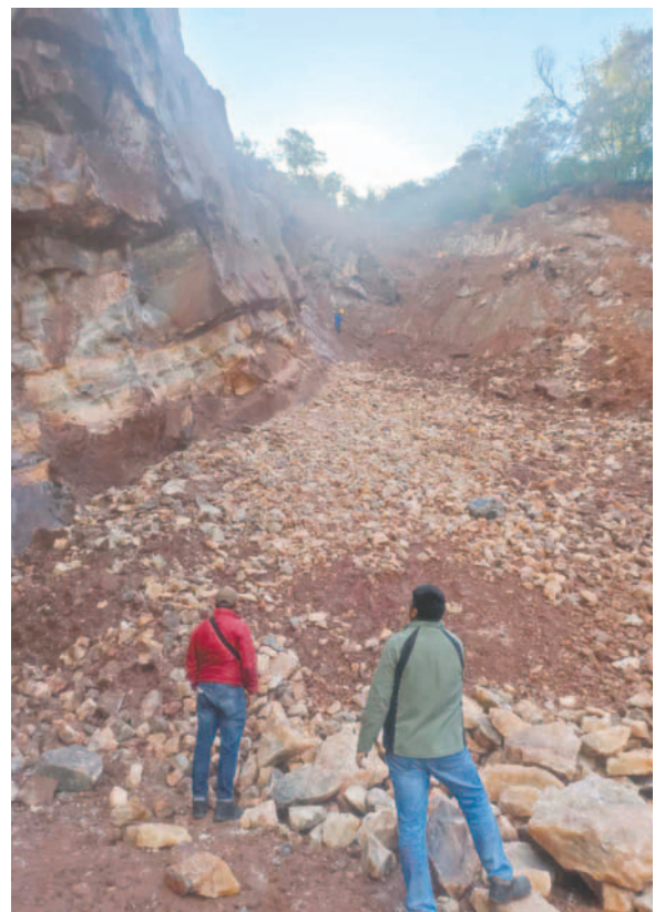
Por explotación ilegal de mineral, una persona fue sentenciada a 4 años de cárcel