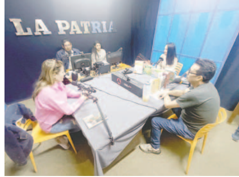
Algunos escritores cruceños y orureños visitaron LA PATRIA Radio ayer

“Desde el día de mañana (viernes), estaremos mañana, el sábado, el domingo y probablemente también podamos ampliarlo hasta el día jueves. Esto todavía está por definirse, pero seguro vamos a ampliarlo en unos días