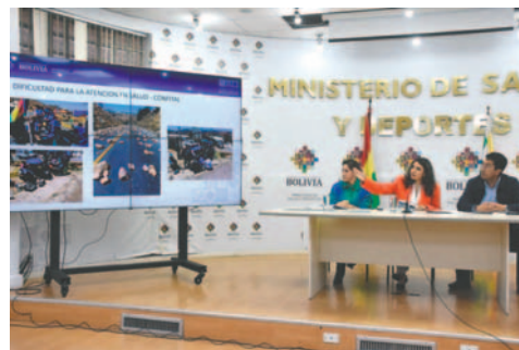
La ministra de Salud mostrando los bloqueos

Mediante fotografías y videos, la autoridad mostró cómo los bloqueadores utilizan piedras, troncos, clavos e incluso dinamita para impedir el paso de vehículos sanitarios.