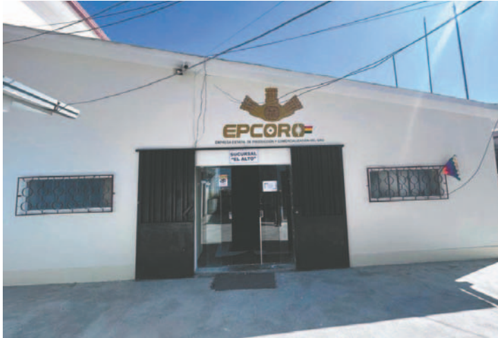
La sucursal de Epcoro, en la ciudad de El Alto

El Decreto Supremo mencionado autoriza al Ministerio de Economía y Finanzas Públicas a realizar un aporte de capital con recursos provenientes del Tesoro General de la Nación (TGN) de hasta Bs 500.000.000 a favor de Epcoro para potenciar la comercialización del oro. Los desembolsos estarán sujetos a la disponibilidad de recursos del TGN, garantizando así una gestión