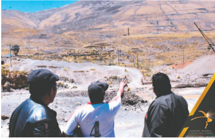
Acuerdo establece delimitar cuadrículas de explotación minera a dos empresas /MMYM