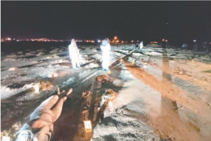
El Ministerio Público inició las investigaciones por presunto feminicidio