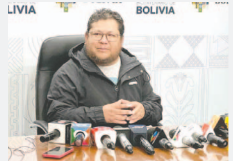
El ministro de Trabajo, Erland Rodríguez