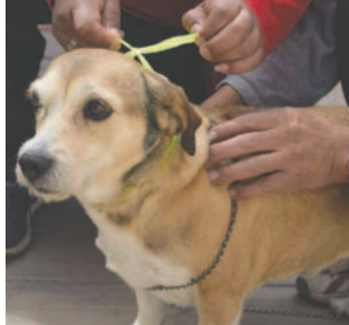
Oruro se mantiene libre de rabia

Los centros de salud que no lograron esa cobertura fueron la Asis-