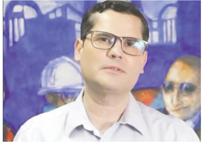
La institución alertó sobre una situación insostenible