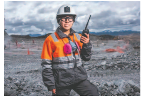
Trabajadora de Nexa

En lo que respecta al nivel de departamentos, Pasco se mantuvo en el primer lugar registrando una producción de 53.815 TMF y representando el 27,9%. De manera similar, Lima conservó la segunda posición con 33.580 TMF y concentrando el 17,4%.