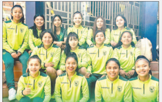
Las integrantes de la selección boliviana de futsal damas

El domingo rivalizará con Colombia (11:15), el lunes se enfrentará a Chile (11:15), el martes será jornada de descanso para todas las selecciones, el miércoles tendrá libre la Verde y el jueves disputará su último partido de fase de grupos contra Ecuador (11:15).