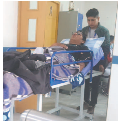
La víctima ingresó a quirófano tras ser apuñalado en el muslo derecho