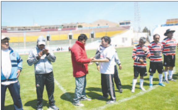
La inauguración del torneo será en el estadio "Jesús Bermúdez"

Los partidos inaugurales del torneo serán los siguientes: desde las 08:50 horas, Deportivo Itos se enfrentará a La Unión en Mutual Honor; desde las 10:00 horas, Deportivo Catco rivalizará con Universidad en Súper Máster Honor.