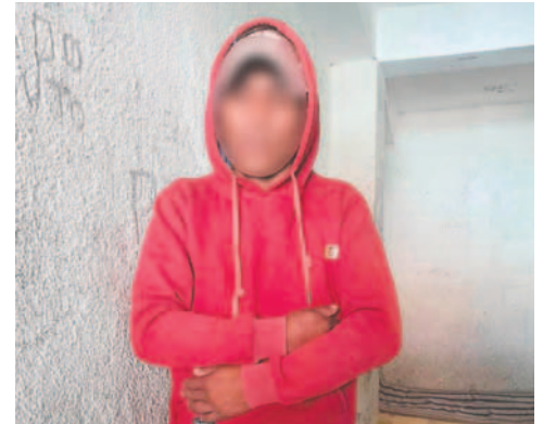
Están siendo investigados por lesiones graves y leves