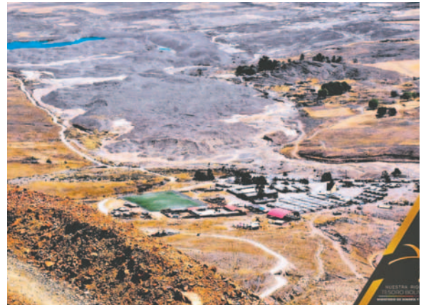
El ministro de Minería, Alejandro Santos, anunció el acuerdo entre empresas de Totoral y Avicaya, conflicto que inició en 2021

“Esto va a ser una solución equitativa, esto va a ser una solución definitiva (...) Lo bonito es que continuamos trabajando el uno con el otro y eso nos alegra”, afirmó Ballesteros al concluir su visita a las minas. El presidente ejecutivo de la Comibol, Reynaldo Pardo, comprometió agilizar los trámites para firmar los contratos necesarios para consolidar a ambas empresas como “operadores legalmente establecidos y reconocidos por el Estado Plurinacional de Bolivia”.