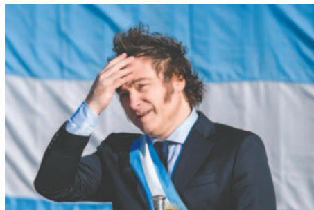
El presidente de Argentina, Javier Milei, en la ciudad de Rosario (Argentina)

El Gobierno del presidente Javier Milei alcanzó un superávit fiscal de 0,4 % del PIB en septiembre último, frente a un 6 % del PIB de diciembre de 2023, lo que hizo bajar el riesgo país de Argentina al entorno de los 1.100 puntos básicos, lo que implica que el mercado financiero todavía sigue cerrado para el país sudamericano.