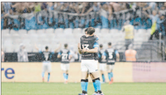
Jugadores de Racing celebran el empate logrado de visita

Almendra casi certifica la remontada poco después con un trallazo que atajó como pudo Souza. Con este empate, decidirá Avellaneda.