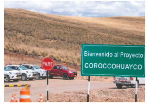
Ingreso al proyecto Corocchohuayco, en Cusco

“Si se ejecutan los proyectos en cartera de US$ 54.000 millones a nivel nacional y para Cusco de US$ 2.790 millones, en los proyectos Quechua, Corocchohuayco y también Crespo,