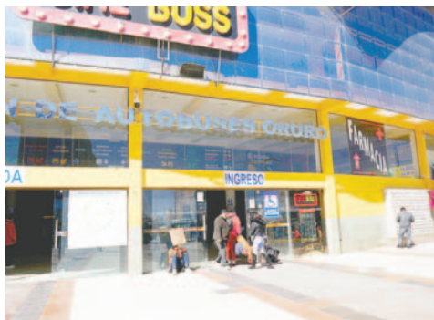
Se suspendieron las salidas interdepartamentales e internacionales

“Las actividades que tenía la UTO han sido