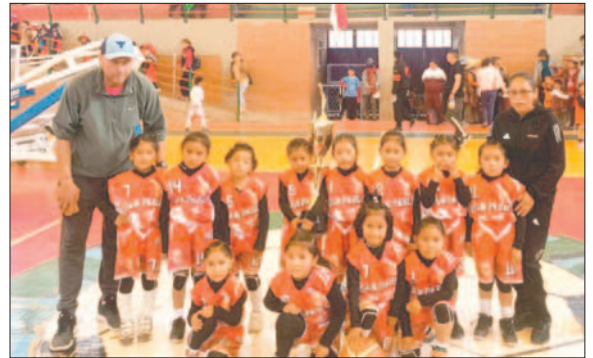
Las integrantes de Juan Pablo lograron el primer lugar en básquetbol