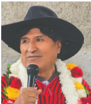
El expresidente de Bolivia, Evo Morales

Las declaraciones de Morales surgen cuando se cumplen 11 días de bloqueos convocados por el denominado Estado Mayor del Pueblo, conformado por organizaciones sociales afines al ala “evista” del Movimiento Al Socialismo (MAS).