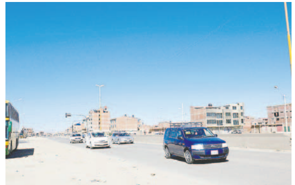
No hubo minis ni micros, pero sí se vio taxis del transporte libre

Varios grupos se organizaron con banderas, sillas y otros elementos para hacer un cerco, en algunos lugares, se utilizó incluso alambre de púas, piedras para evitar el paso y con-