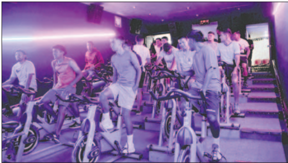
Trabajo intenso de los jugadores en el gimnasio

reño saben que deben conseguir un resultado positivo en La Paz para no perderle pisada a Bolívar, que de momento es líder del campeonato Clausura y se va alejando de sus perseguidores.