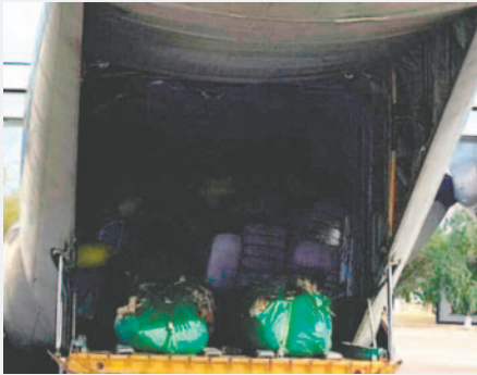
Un avión de la Fuerza Aérea con productos alimenticios