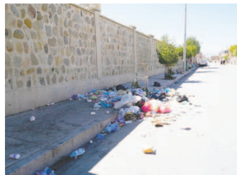
El carro recolector de basura no pudo ingresar a su ruta por los bloqueos

sajes; ahora estamos en la misma situación que teníamos hace un año. Quisiéramos que se evite este perjuicio. Por el tema nacional se ha ampliado el horario continuo y ahora a nivel municipal también”, manifestó el