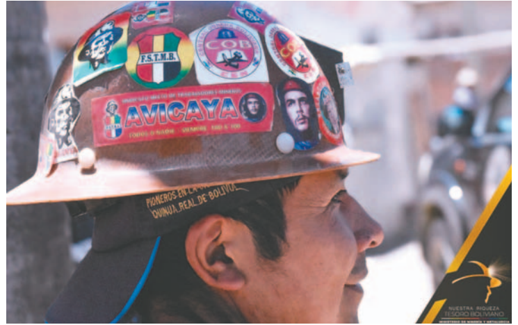
La empresa minera de Avicaya obtuvo diez cuadrículas para trabajar