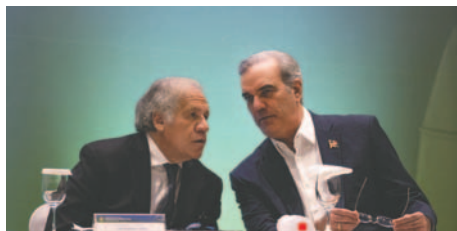
Luis Almagro (i), secretario general de la Organización de los Estados Americanos (OEA), habla con el presidente de República Dominicana, Luis Abinader, este jueves durante la inauguración del Congreso Internacional Democracia en América Latina, en Santo Domingo (República Dominicana)

"Los asesinatos, repatriaciones, secuestros de críticos y opositores (...) Esa violencia estructural ha erosionado la democra-