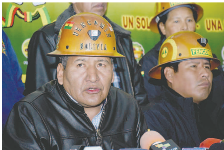
Los dirigentes expresaron su preocupación por la falta de insumos, producto de los bloqueos

pues no quieren que se generen confrontaciones entre bolivianos.