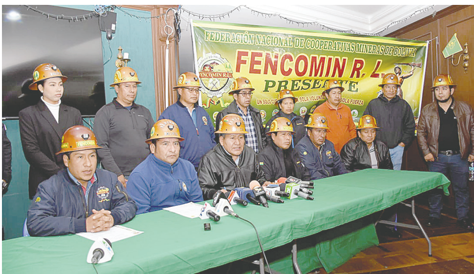
Ayer se pronunciaron los representantes de las cooperativas mineras en el país

En Oruro, la Federación Departamental de Cooperativas Mineras (Fedecomin), también se pronunció, expresando su rechazo a las movi-