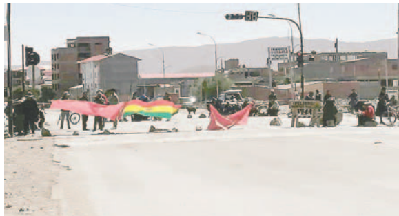
Puntos de bloqueo se registraron en distintos lugares de la ciudad

Mucha gente tuvo que caminar grandes trechos para llegar a destinos; ahora para hoy viernes 25 de octubre, no habrá el bloqueo, pero se continuará con la paralización de sus servicios.