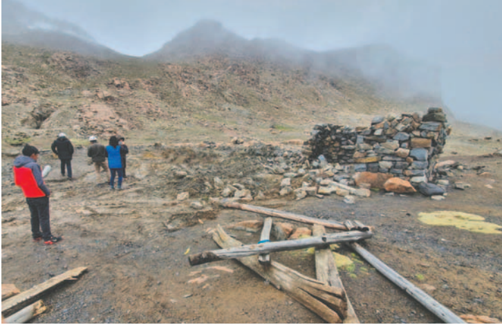
Acción popular establece que la AJAM cierre bocaminas ilegales en inmediaciones de la laguna Mazuni/AJAM