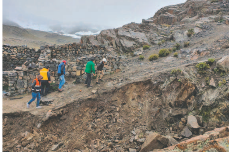
La AJAM Potosí ejecutó la orden judicial