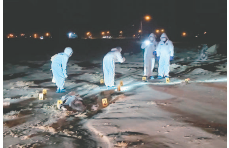
Peritos del litcup realizan distintos trabajos en el lugar del crimen