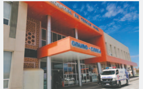
Al próximo año se dará inicio a la construcción de la Segunda Fase del Hospital Oruro-Corea