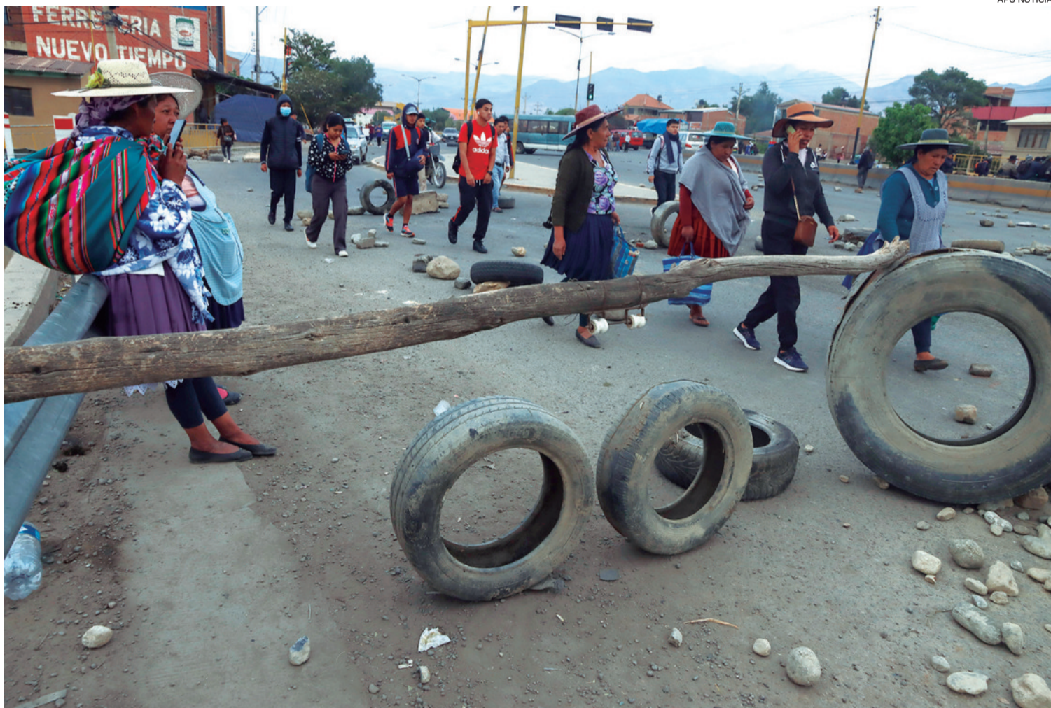
Los seguidores de Evo Morales reactivaron ayer el bloqueo en el municipio de Vinto, donde la pasada semana hubo enfrentamientos

Valles cruceños", expresó un productor local, que rechazó la medida de presión promovida por los seguidores del expresidente.