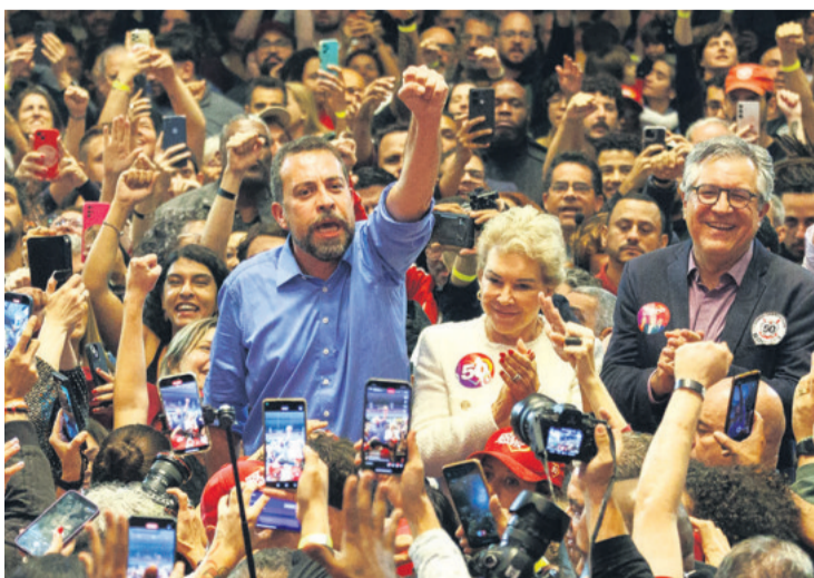
Guilherme Boulos, del PT, postulaba para la alcaldía de Sao Paulo