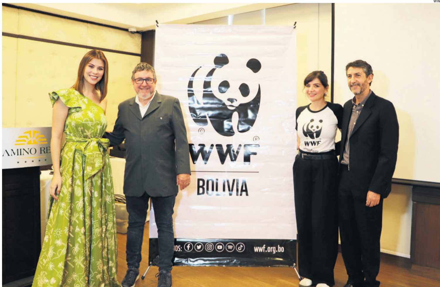
Los ejecutivos de la ONG expusieron los detalles de la investigación, que se realiza cada dos años, junto con la Sociedad Zoológica de Londres