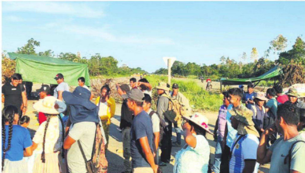
MÁS BLOQUEOS EN SANTA CRUZ. Interrumpen la carretera en Choré. Hubo violencia en Mairana