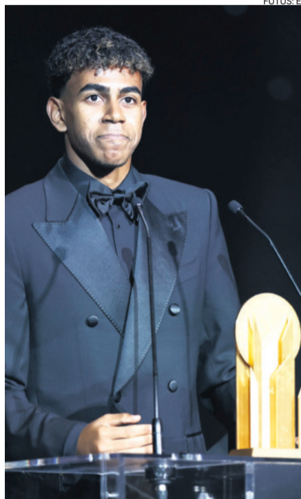
Yamal se viene luciendo con la camiseta del Barça