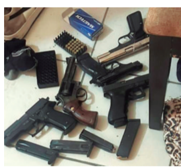
Armas que tenían en su poder

En plena audiencia, frente a la jueza Salazar, los imputados negaron las acusaciones, pero cayeron en contradicciones. Ello estaban alojados en la casa de su