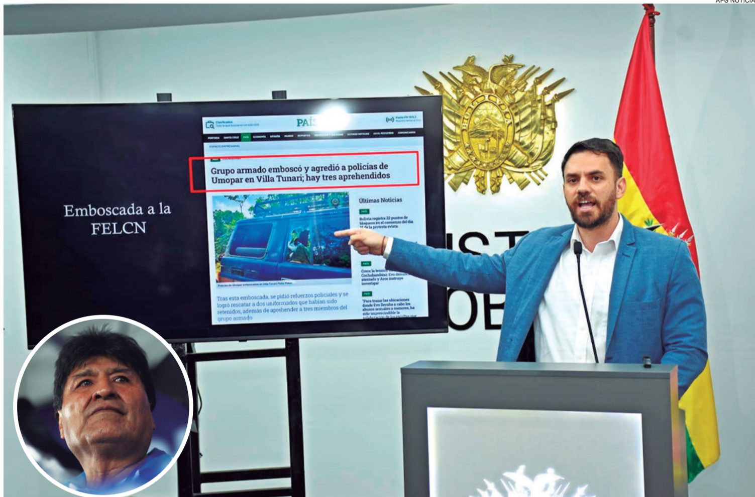
El ministro de Gobierno culpó a Evo Morales de disparar contra funcionarios policiales y cuestionó que el expresidente evada la investigación