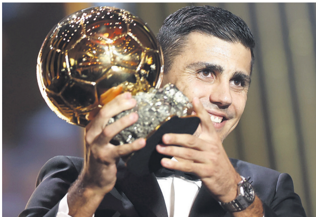
El balón de oro es para un jugador que sobresale en la selección española y en el Manchester City que dirige Pep Guardiola

Contra todo pronóstico y cuando los rumores apuntaban a Vinicius Junior, el volante del Manchester City tumbó todo. Es la segunda vez que un futbolista español gana el trofeo