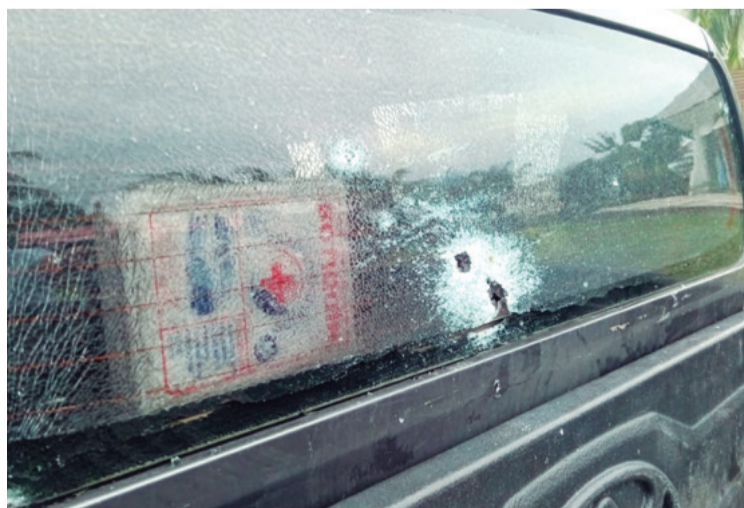
Evo Morales dice que recibió varios disparos y culpa al Gobierno

El abogado puso en tela de juicio la versión del ministro Eduardo Del Castillo sobre los hechos del domingo en el trópico de Cochabamba. Aseguró que hay incoherencias en el relato y afirmó que se trata de un "atentado".