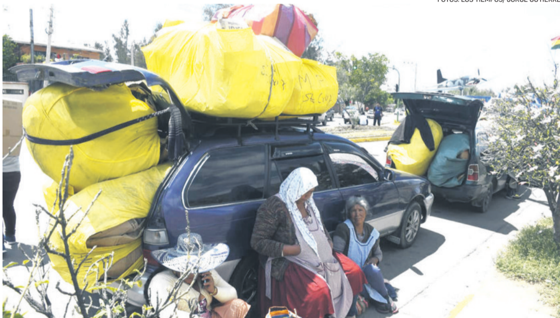
Acomodan grandes bultos para facilitar el traslado de las flores a distintos sectores

Argumenta que esta fecha es clave para su sector, porque entre un 70 y 80 por ciento se produce específicamente para cosechar en esta temporada. “Con todo este problema, no podemos sacar nuestros productos. Abastecemos hasta el último rincón del territorio nacional, pero ahora solo estamos mandando al occidente y al oriente, pero solo a las ciudades principales, pero tampoco en la cantidad prevista”, se queja.