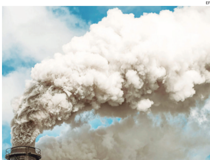
El calentamiento global es consecuencia de la emisión de CO2

minado presupuesto de carbono, (la cantidad de CO2 que aún puede añadirse a la atmósfera sin provocar un aumento de la temperatura global superior a 1,5°C), se agotará en unos cuatro años si el mundo sigue con las emisiones actuales.