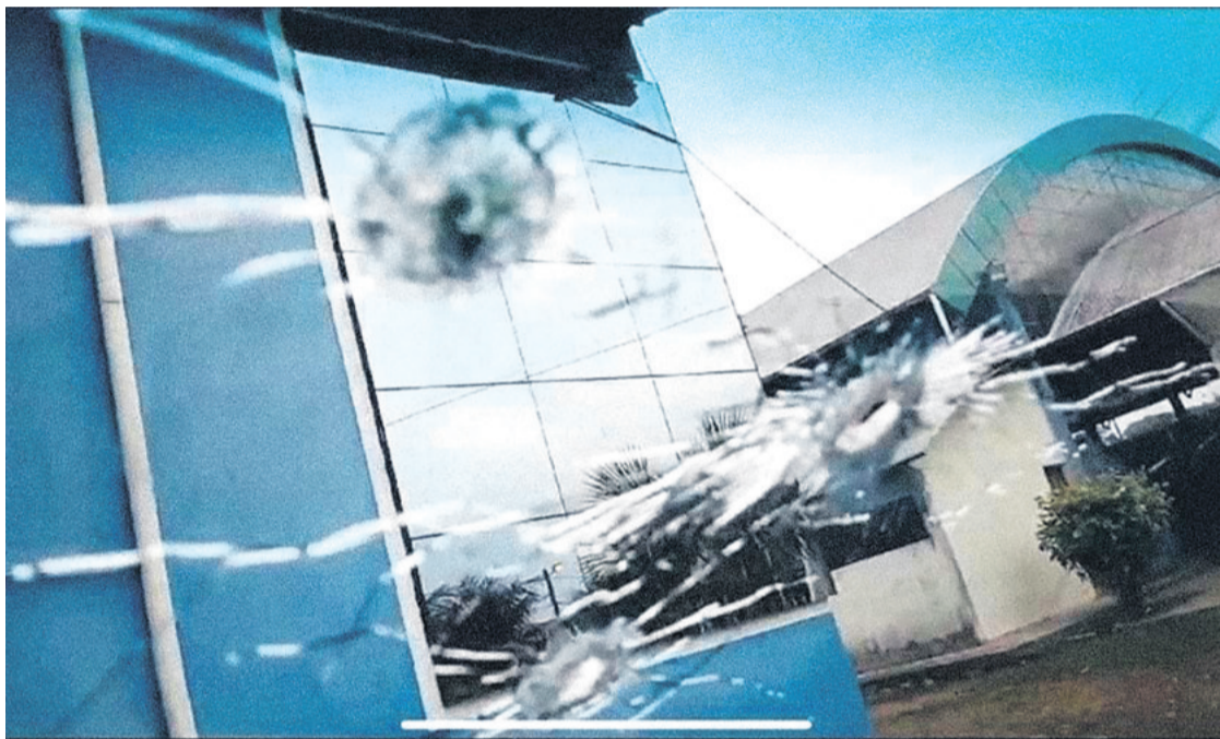
Parte de los destrozos que dejaron las movilizaciones de este fin de semana