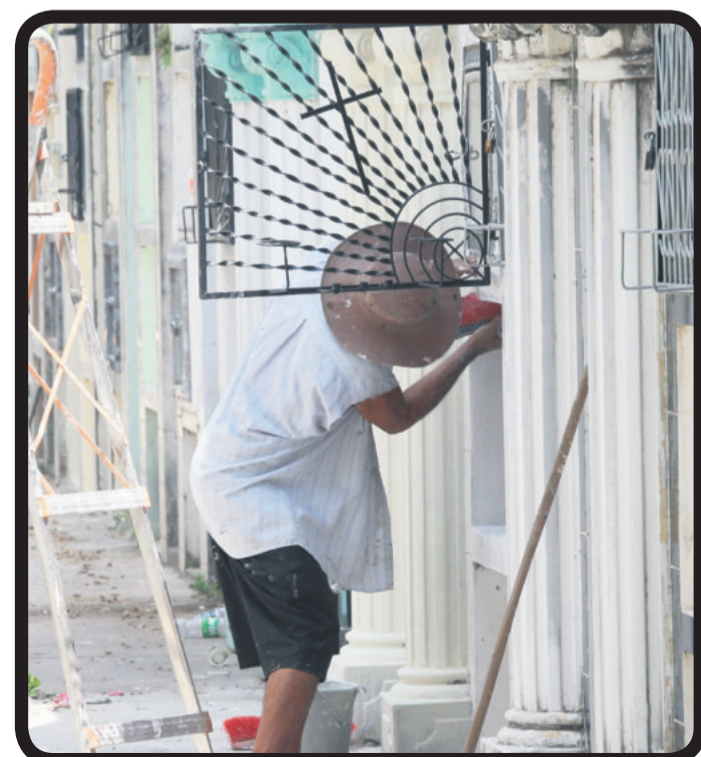
La cercanía del Día de Difuntos genera movimiento en los camposantos. Albañiles aprovechan para conseguir trabajo