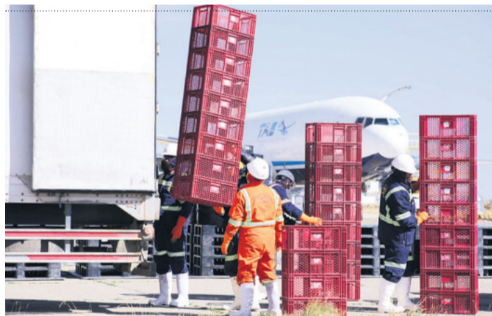
Trabajadores descargan pollos de un avión del TAM

El bloqueo de caminos que realizan sectores campesinos que apoyan a Evo Morales, ha generado una pérdida económica de más de mil millones de dólares en la economía del país, según el ministro de Desarrollo Productivo y Economía Plural, Néstor Huanca.