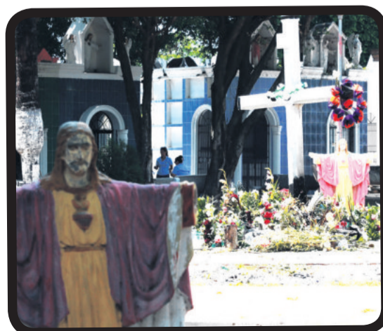
Junto a las imágenes, la cruz donde rezan por las almas que descansan en otros panteones