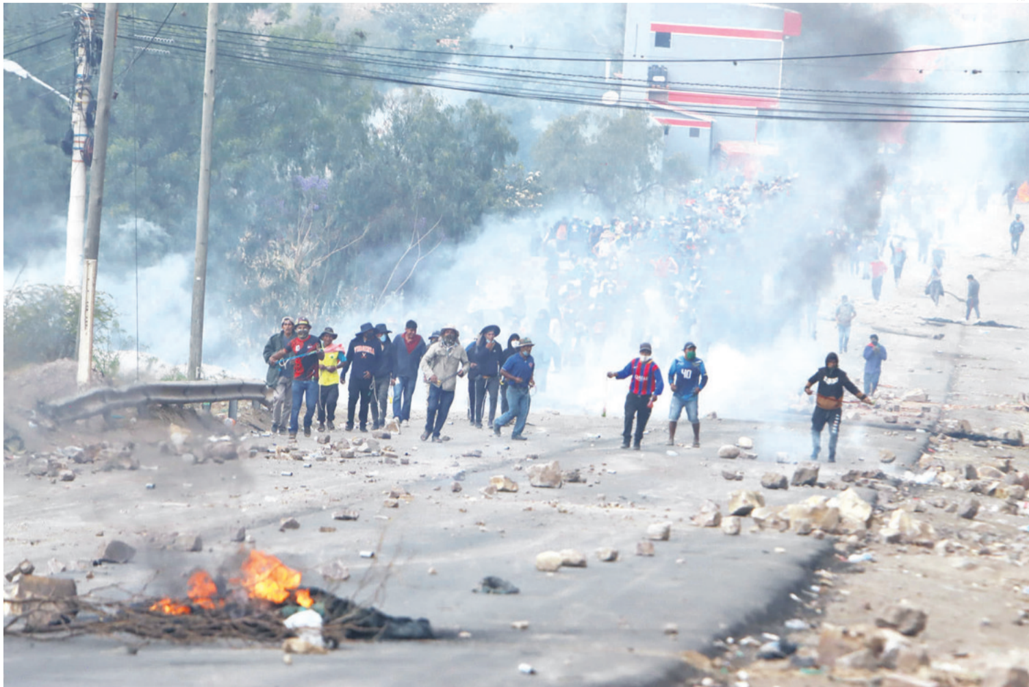
Campeños evistas se enfrentan con la Policía en Parotani, Cochabamba. Fue la jornada más violenta y dejó a un policía con heridas graves.

LA MAYORÍA DE LAS PROTESTAS SON POR DEMANDAS ECONÓMICAS