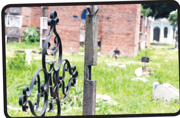
Muchas de lápidas y nombres han desaparecido con el tiempo, hasta el punto de que resulta imposible identificar al difunto