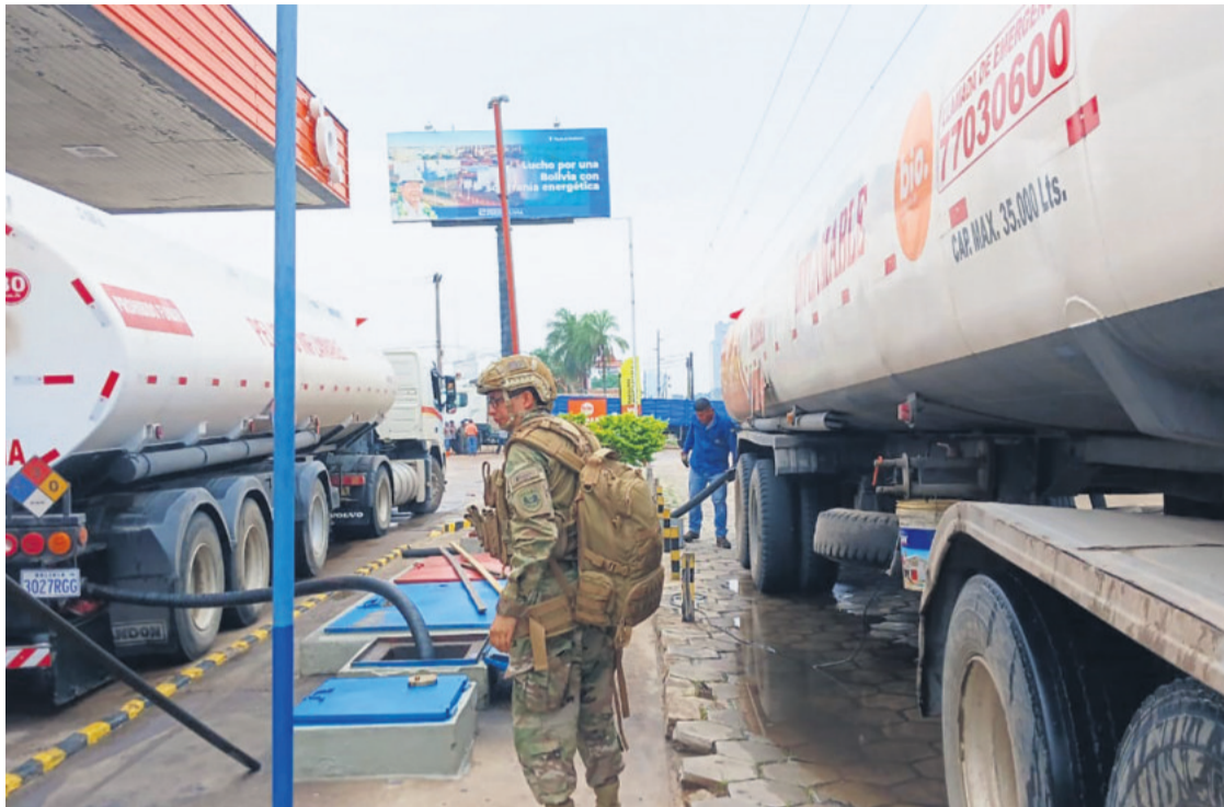
Cisternas que llegaron de Chile descargan combustible en los surtidores.

"14 efectivos policiales han resultado heridos y uno de ellos, la-