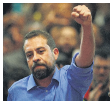
San Pablo tiene un edil de derecha

La votación anticipada ya se realiza y la elección final será el 5 de noviembre.