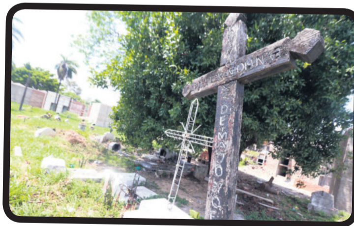
Los panteones se encuentran desiertos la mayor parte del año, pero sepultureros y albañiles van a trabajar todos días allí