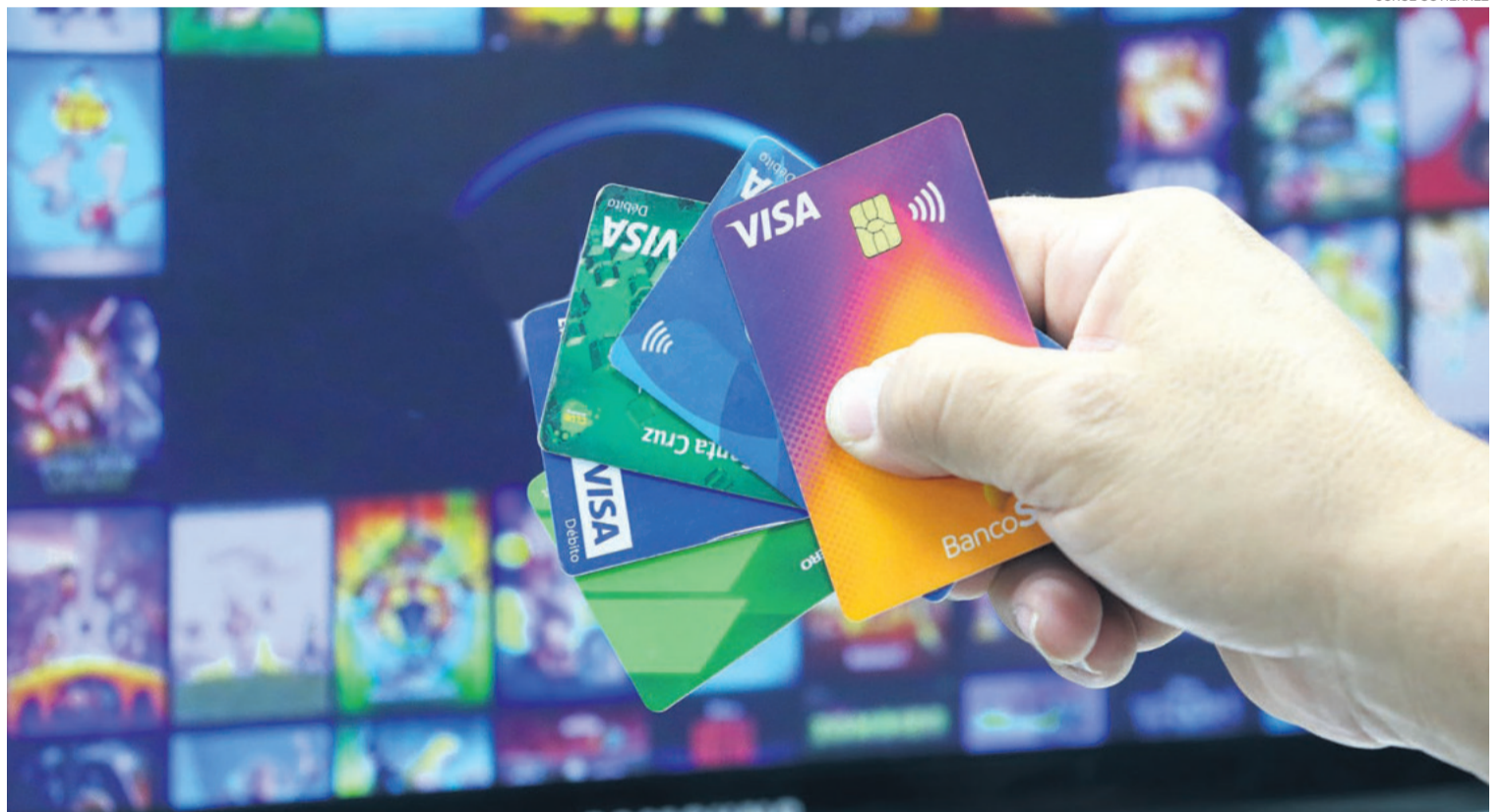
La tarjeta de débito se ha vuelto una importante herramienta para que los jóvenes profesionales puedan realizar sus compras por internet.

Desde la Autoridad de Supervisión del Sistema Financiero (ASFI) indicaron a este medio que esta entidad estatal no emitió ninguna normativa que restrinja