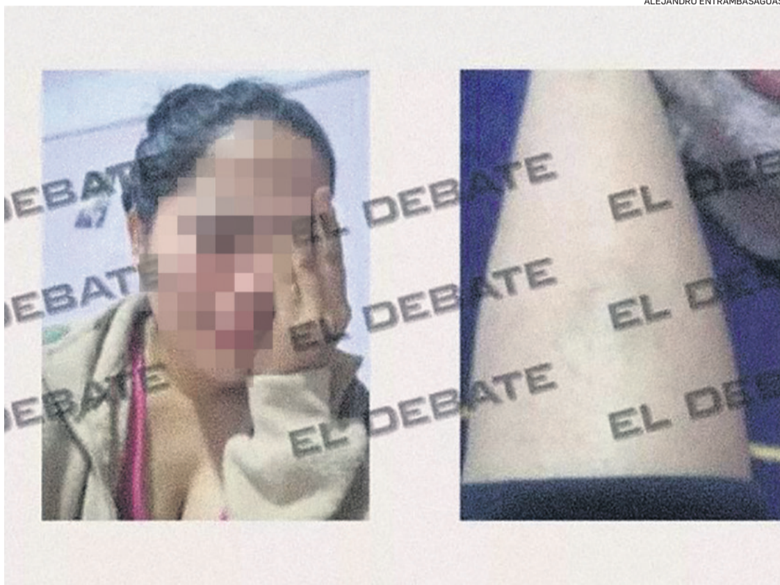
El reportaje habla de agresiones físicas, además de los abusos sexuales

El reportaje afirmó que la adolescente, en la actualidad veinteañera, y su hija, fueron declaradas desaparecidas la semana pasada por las autoridades, y que en su momento la