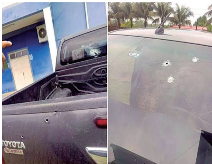
Circularon fotografías de los vehículos con los impactos recibidos

El presidente de la Cámara de Senadores, el evista Andrónico Rodríguez, envió este domingo cartas