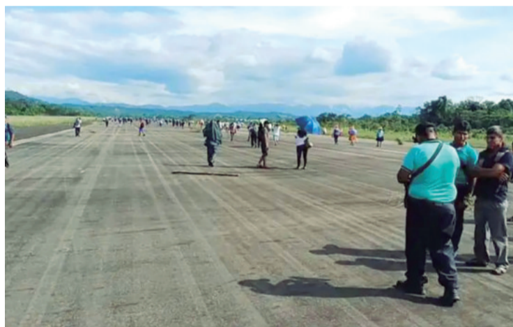
Denuncian que explotaron dinamita y dañaron la pista en Chimoré

ciones. “No habrá operaciones hasta que se realicen las verificaciones sobre los daños”, informó.