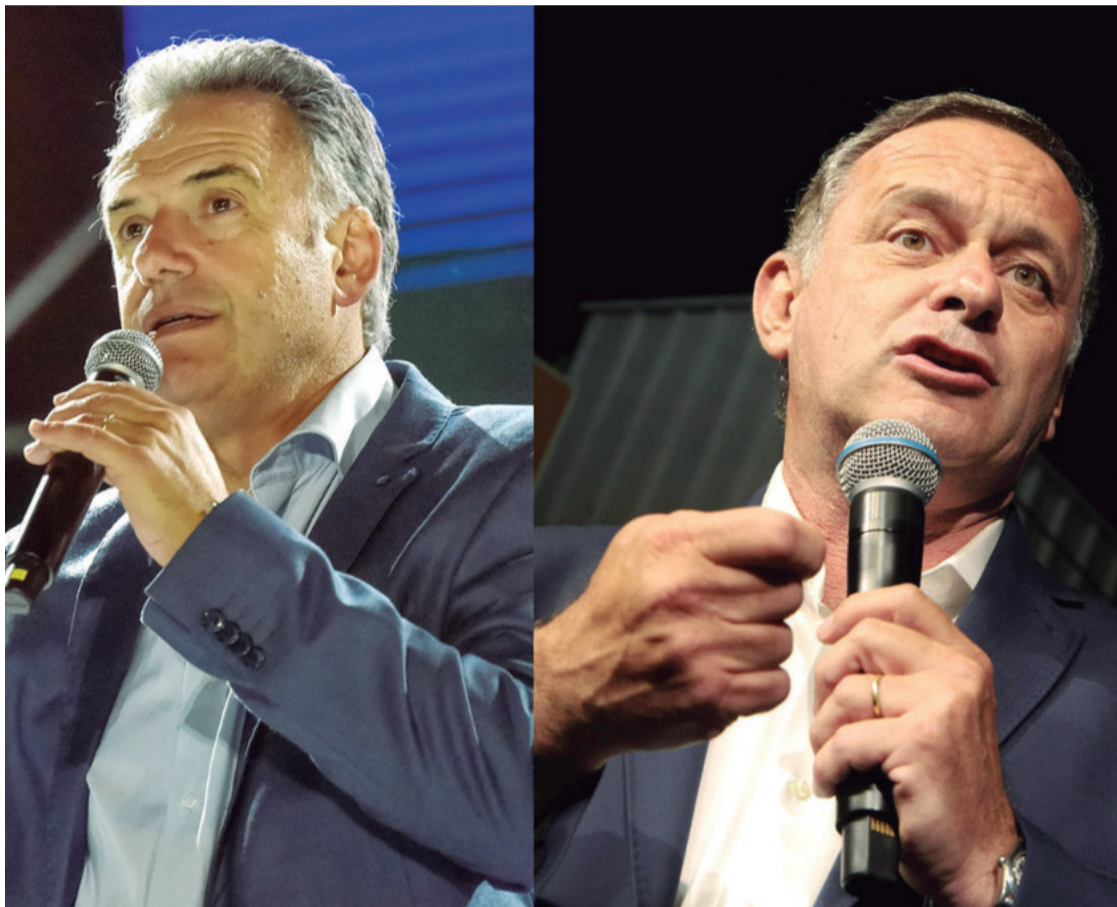
Orsi y Delgado medirán sus fuerzas en la segunda vuelta electoral de Uruguay

Estos números marcan que las cuatro fuerzas políticas de la coalición aventajan al Frente Amplio