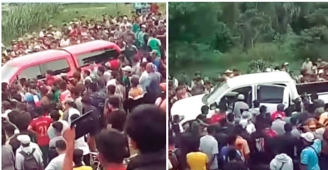
Los seguidores del expresidente quemaron los supuestos vehículos utilizados para hacer los disparos