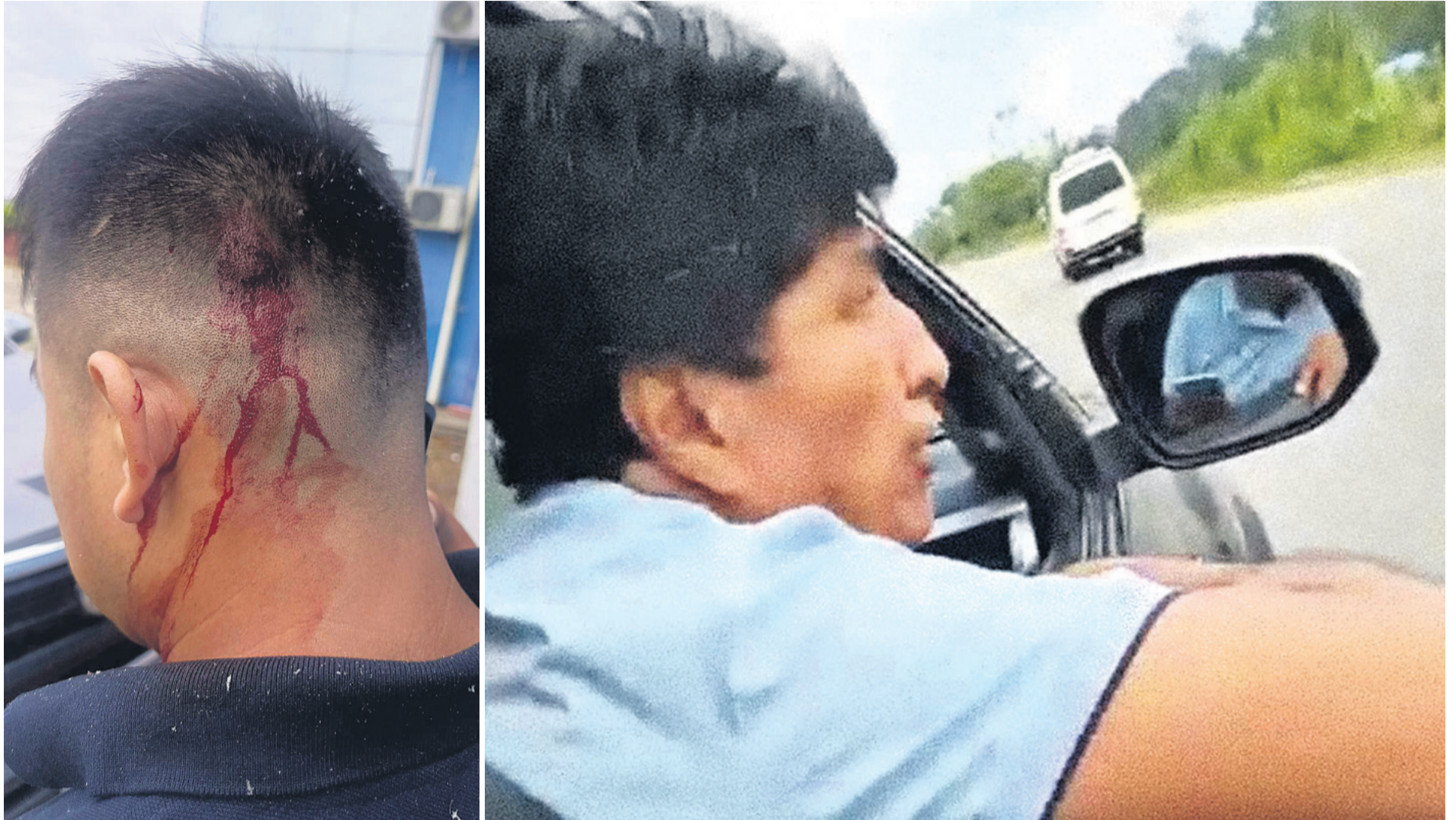
El expresidente Evo Morales denunció este domingo que atentaron contra vida y que el chofer resultó con heridas