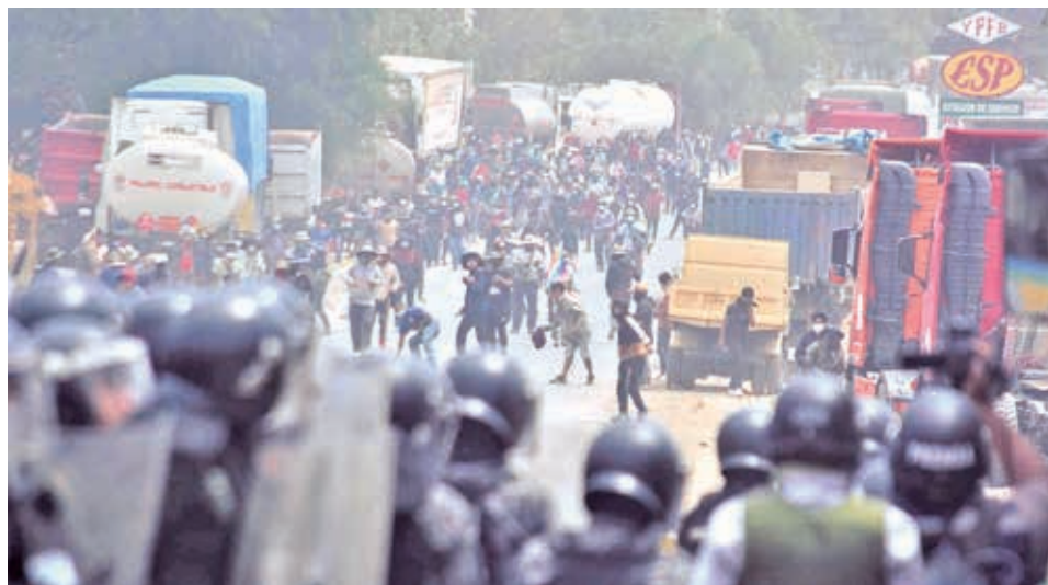
La intervención policial en Parotani, Cochabamba. JOSÉ ROCHA

“El paciente tiene quemaduras, lo que hace presumir que la lesión fue ocasionada por un artefacto explosivo. En este tipo de lesiones, se debe esperar un tiempo, puede ser hasta 72 horas, para analizar la evolución de las lesiones; por ese motivo, solo se le amputó un dedo y las demás le-