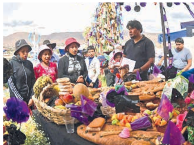
Los cantos en el cementerio por Todos Santos. CARLOS LÓPEZ