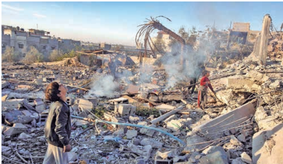
Las exposiciones provocadas por los bombardeos israelíes en territorio iraní.

Los ataques fueron condenados por varios países de la región, y se lanzaron llamados a la moderación. Arabia Saudita alertó sobre los riesgos para la seguridad en Oriente Medio, mientras que