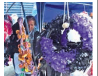
El inicio de la feria en Sacaba.