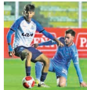
Partido entre Bolívar y Blooming, ayer.