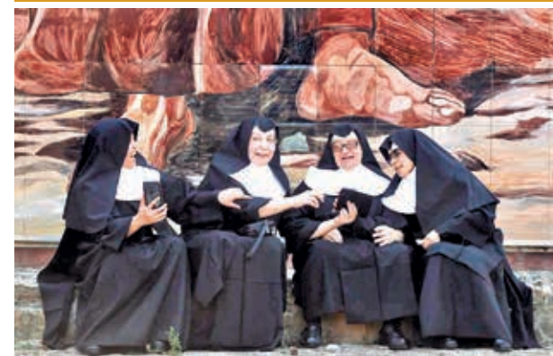
Un grupo de monjas en un templo católico.

Según Tamara Samudio, politóloga de la consultora Nómada, el principal debate es la continuidad de un gobierno de coalición que ha sido inédito en Uruguay. La actual coalición de centro-derecha reúne a cuatro partidos —el Nacional, Colorado, Cabildo Abierto y el Partido Independiente— que lograron mantenerse unidos durante el mandato de Lacalle Pou. Samudio, entrevistada por France 24, señala que este modelo de coalición “marca un hito en la historia política de Uruguay”, aunque su continuidad depende de los resultados en las urnas.