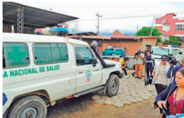
Una de las ambulancias que acudieron al bloqueo. CNS

Agresión. En Epizana y en Parotani, no solo destrozaron los vidrios de los vehículos, sino que agredieron a los conductores.