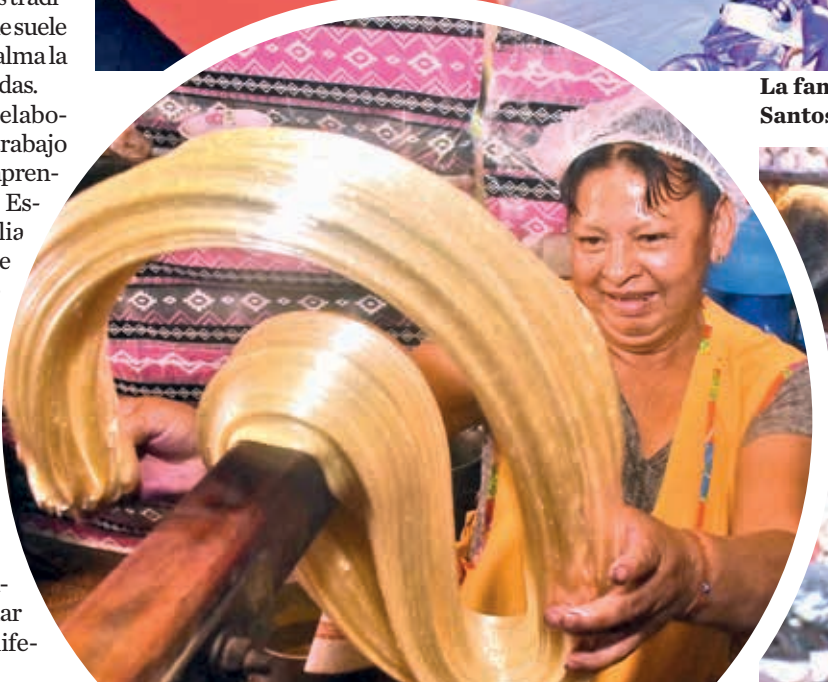
Tradición y color marcan el proceso en Quillacollo. J. ROCHA