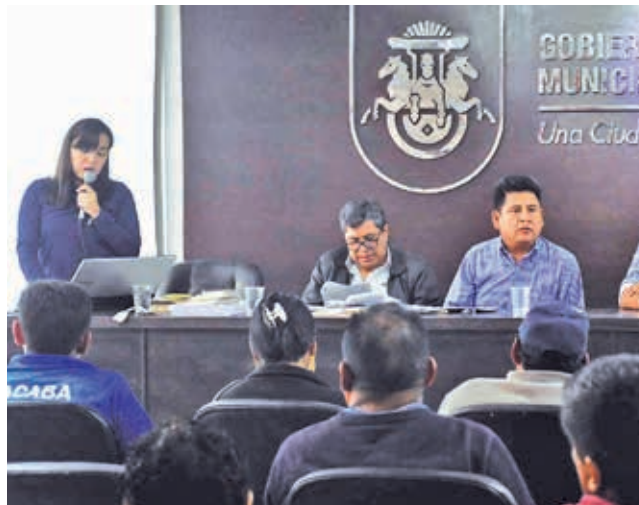
Los presidentes de distritos de Sacaba reciben el informe. CARLOS LOPEZ

“Nuestra demanda de límites territoriales ya fue instaurada, se halla en trámite y