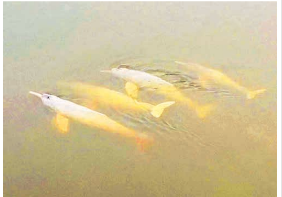
Un par de bufeos o delfines bolivianos en el río Ichilo del trópico.

En este contexto se espera que el Ministerio de Medio Ambiente pueda adherirse al plan de conservación de bufeos en la Conferencia sobre la Diversidad Biológica COP16 para apoyar con medidas otras medidas de preservación.