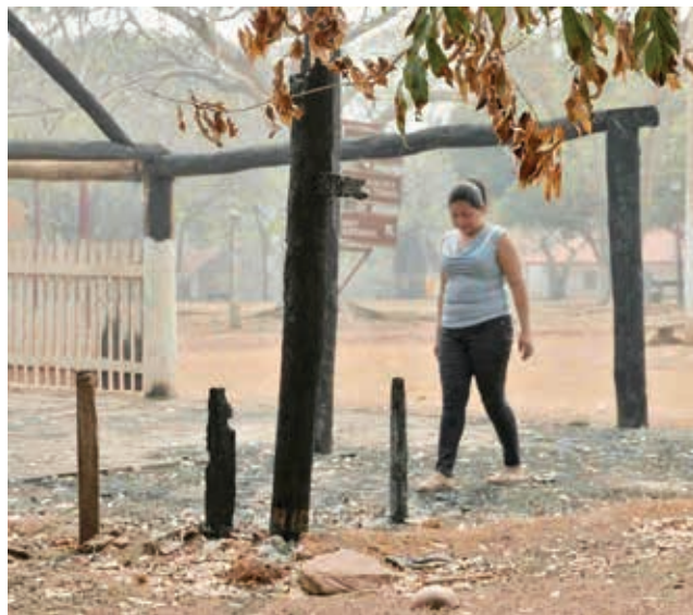
Los daños del incendio en Santa Ana.