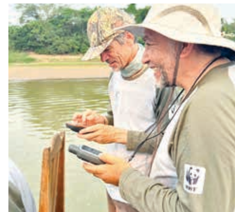
La expedición de biólogos y pescadores en Puerto Villarroel.