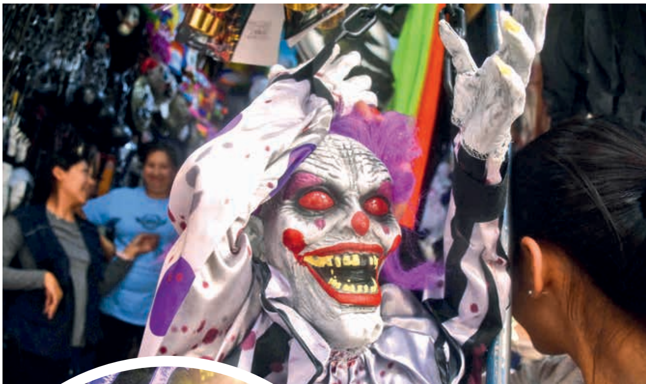
Los disfraces de Halloween en la calle 25 de Mayo. JOSÉ ROCHA

Por ejemplo, en el armado de mesas, Rocha sostuvo que hay una infinidad de variedades de mast’akus. “Llama la atención que en una mesa haya un helicóptero y se dice que con la escalera se tarda más en llegar al cielo, en cambio con el otro medio es mucho más rápido. Esto es una reinterpretación urbana de la cultura”, contó. La celebración de Todos Santos se festeja el 1 y 2 de noviembre.