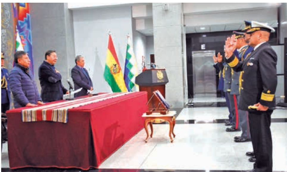
El presidente Luis Arce posesiona al nuevo Alto mando Militar, anoche.