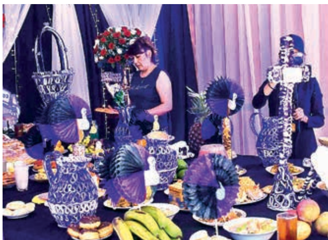
El armado de mesas por la fiesta de Todos Santos. C. LÓPEZ