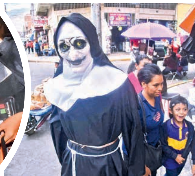
Máscaras a la venta en el sector de cotillones. JOSÉ ROCHA