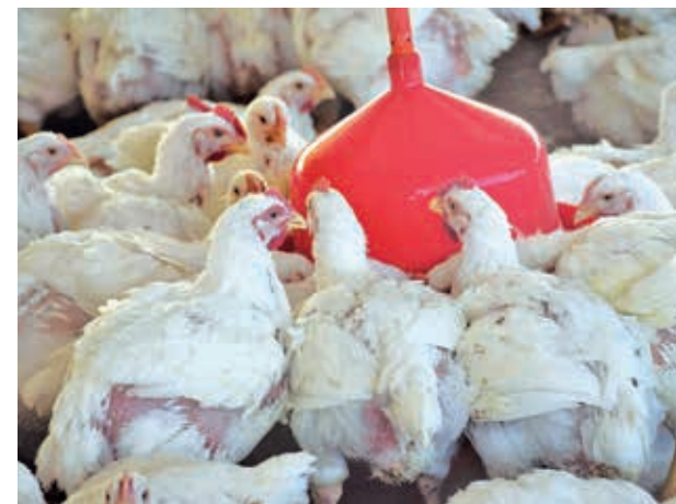
Una granja de pollos en Cochabamba. xxx

En respuesta a la crisis, el Gobierno implementó un puente aéreo entre Santa Cruz y Cochabamba para asegurar el suministro de alimentos e insumos a la industria avícola de esta última región. Esta medida fue acordada con la Cámara Agropecuaria de Cochabamba (CAC).