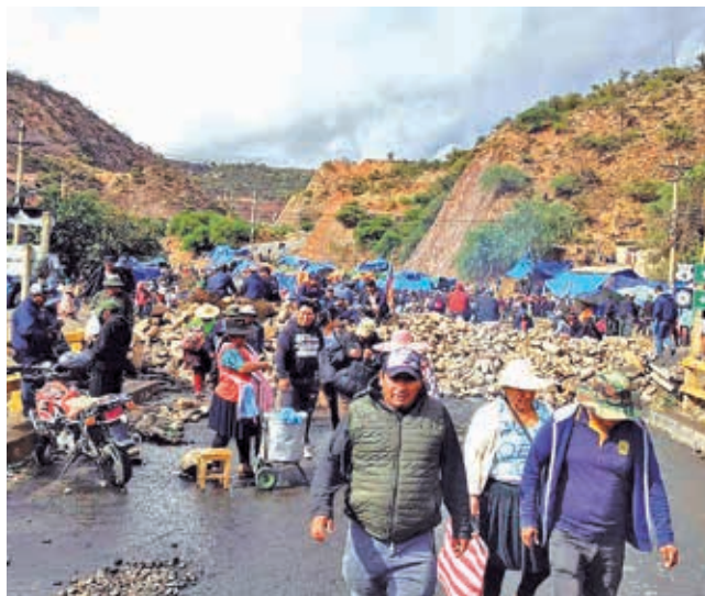
Uno de los puntos de bloqueo en la ruta al occidente. xxx

preocupación por el uso de armas en los bloqueos, lo que, dijo, representa un riesgo grave para la vida y seguridad de los bolivianos. Ante esta situación, Arce afirmó que el Gobierno debe actuar para preservar el Estado de derecho y proteger la economía nacional, asegurando que las rutas principales permanezcan expeditas. “Proteger el aparato productivo es nuestro mandato fundamental”, recaló.