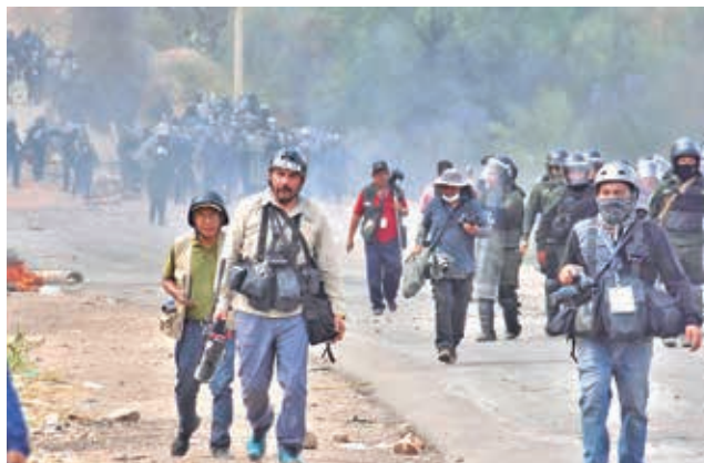
Periodistas realizan cobertura de los bloqueos.

bloqueos en Parotani, Cochabamba, e instó al líder cocalero Evo Morales a ordenar el cese de la “violencia irracional” ejercida contra la prensa. En un comunicado, la ANPB pidió a Morales que instruya a sus seguidores a evitar los ataques y respetar la labor informativa de los