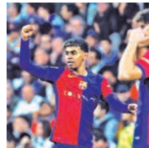
Lamine Yamal festeja el tercer gol de Barcelona.

Barcelona goleó gracias al doblete del polaco Robert Lewandowski (9'ST y 11'ST), Lamine Yamal (32'ST) y Raphinha (39'ST).