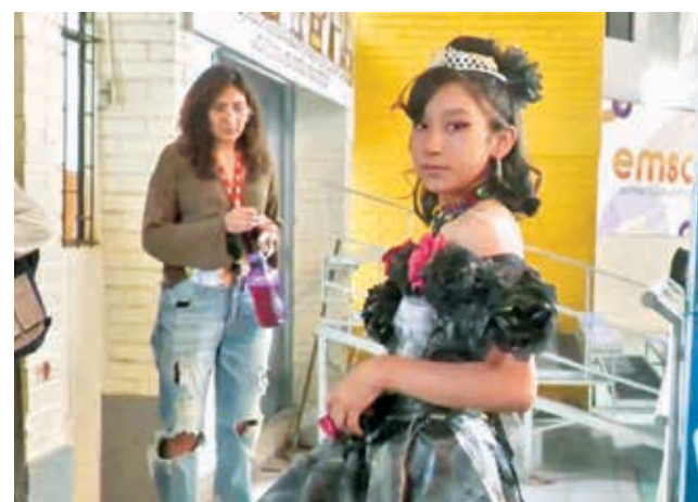
Los participantes de “ReciclARTE”. GAMC

Este mensaje fue presentado a través de diversas manifestaciones artísticas, desde actuaciones teatrales, hip-hop y rap hasta presentaciones musicales que incluyó instrumentos elaborados