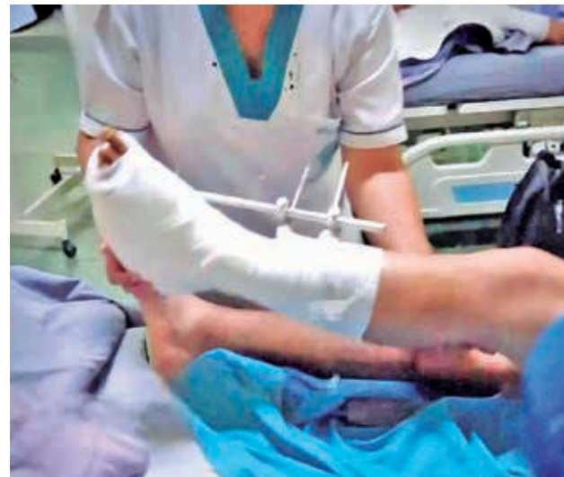
falta pie de foto. RRSS

Nueve policías heridos llegaron a la CNS y cuatro permanecen internados, uno debido a una fractura en un dedo, otro por lumbalgia y el tercero por trauma auditivo.