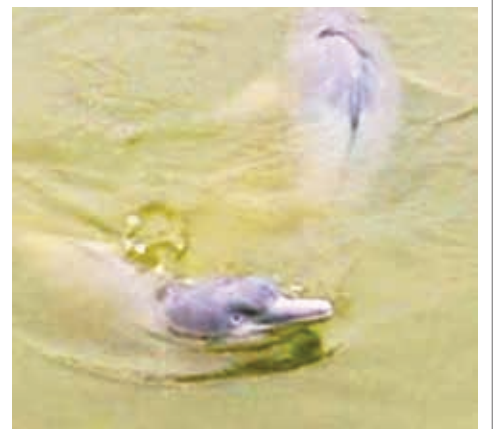
El registro del avistamiento de bufeos y las amenazas.