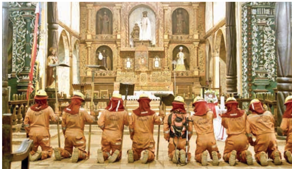
Bomberos voluntarios en la iglesia de Santa Ana.