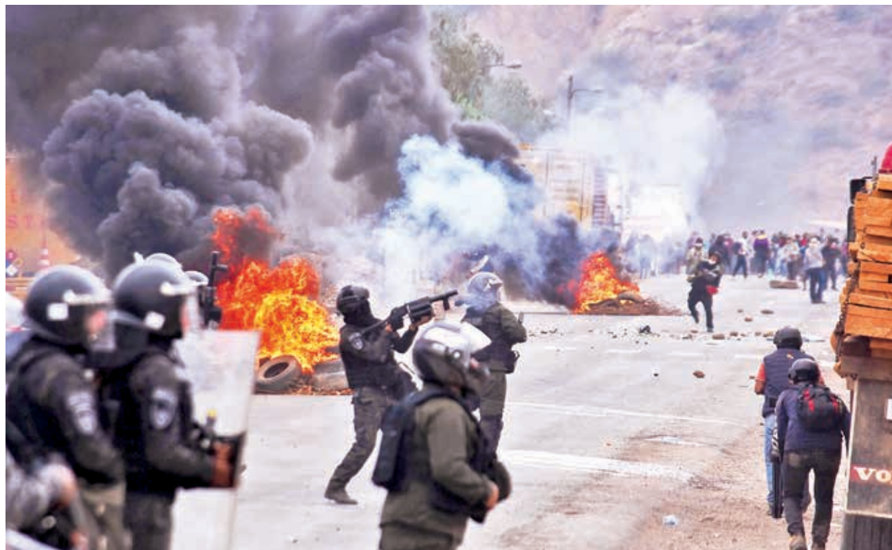
Policías y sectores que bloquean la carretera hacia Oruro se enfrentan en el puente Parotani, el viernes. JOSÉ ROCHA

Otra fractura se repitió en 2019 en el marco de esa crisis