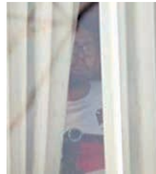
La foto por la que Colombia habló de espionaje.

Ante estos rumores la Federación Boliviana de Fútbol (FBF) informó a los medios que no recibió ninguna comunicación oficial de la FIFA por un supuesto reclamo de la Federación