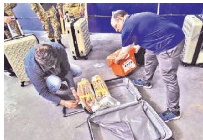
Preparativos de las elecciones en Uruguay.

Apunte. Además de la elección presidencial, los uruguayos decidirán la composición del Congreso Nacional