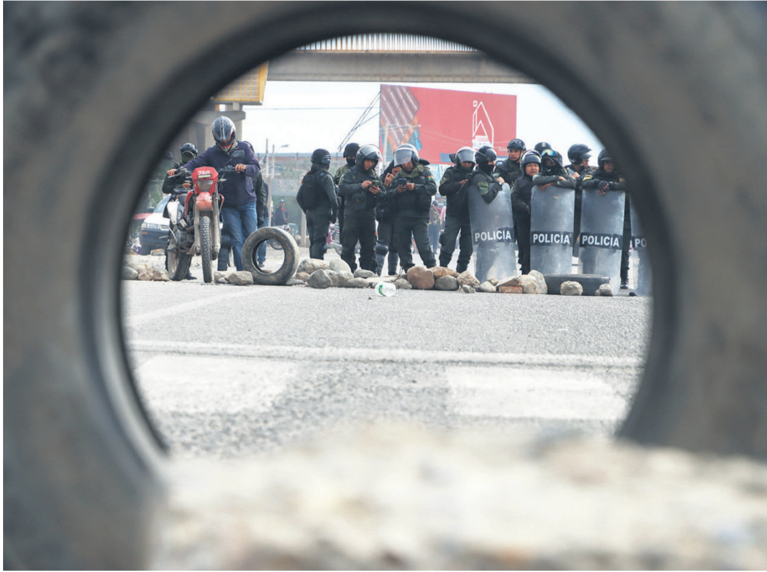
Agentes antidisturbios tras haber despejado un punto de bloqueo en Vinto, en uno de los ingresos a la ciudad de Cochabamba.