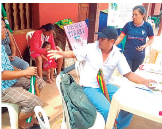
Permanecen en vigilia en la plaza de San Ignacio

Mujeres con niños en brazos, adultos mayores y hombres dejaron sus hogares, movidos por un objetivo mayor: levantar la voz en defensa de la 'casa grande', la tierra que les da vida y sustento.