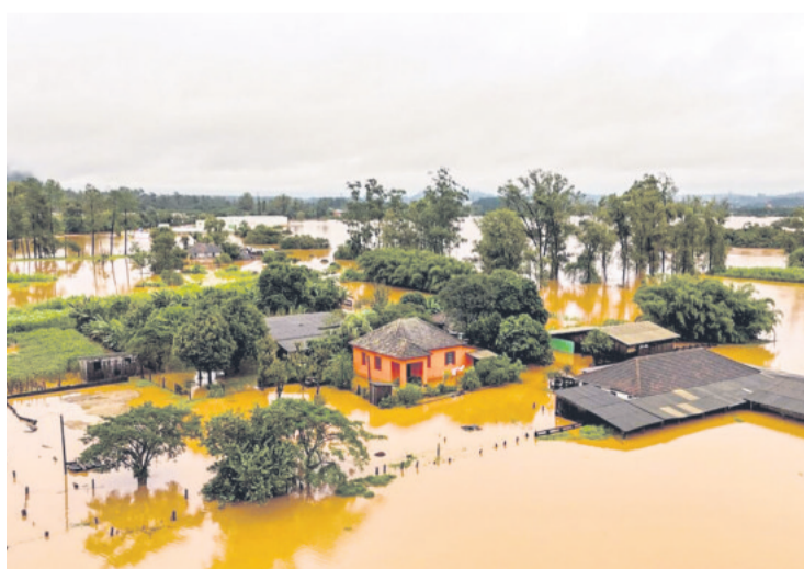
Varios municipios quedaron anegados por el violento temporal

Este nuevo evento climático extremo levantó los tejados de alrededor de 400 residencias y escuelas, dejó sin luz a barrios enteros de algunas localidades y provocó la caída de árboles y el bloqueo