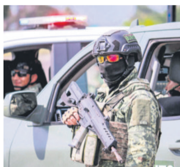
Violencia extrema en México