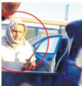
El jefe Mohamed Abu Itiwi

Abu Itiwi, cuya muerte se produjo el miércoles, era el comandante de la fuerza Nukhba del Batallón de Bureij, en el centro de la Franja de Gaza, y -según los informes de Israel- durante los atentados del 7 de octubre, dirigió el ataque contra un refugio anti-aéreo en Reim, donde acudieron a esconderse varios de los asistentes al festival de música Nova en el que fueron asesinadas unas 370 personas. (EFE)