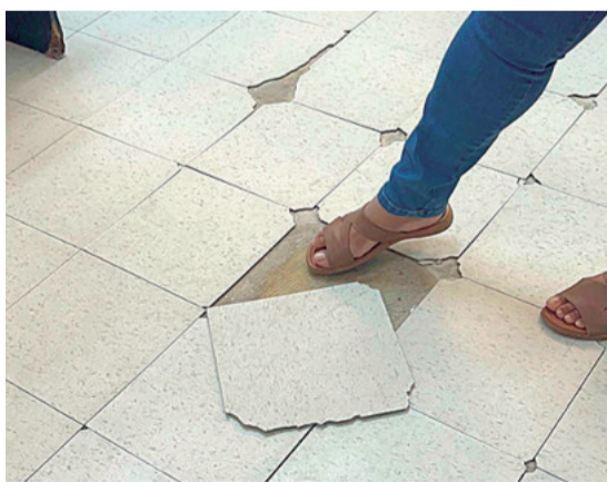
Muestran las condiciones en que están algunos pisos

De inmediato, cursaron otra invitación para este viernes a las 10:00, esta vez en el centro