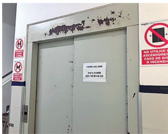
Piden que se arregle este ascensor en el Plan