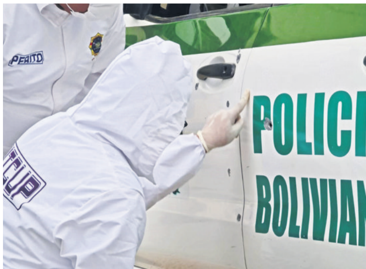
Agentes de la Policía verifican los daños por la balacera del miércoles