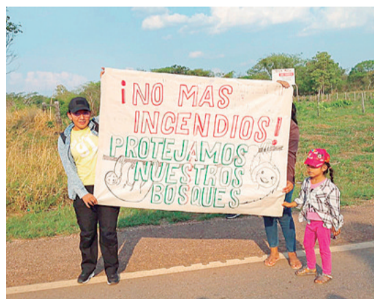
Mujeres y niños también son parte de la protesta

Contó que la movilización surgió de manera espontánea ante el abuso que sufrieron los comunarios de José de Campamento, que fueron embos-