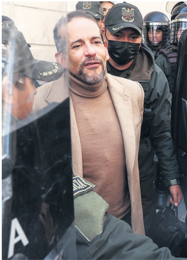
El gobernador Luis Fernando Camacho y el excívico Marco Antonio Pumari, son sacados de los juzgados de La Paz al final de la audiencia.

El Juzgado sexto de sentencia ve más errores en las acusaciones contra Luis Fernando Camacho y Marco Pumari en el caso "Golpe I" y conmina a la Fiscalía que corrija. Los demandantes dicen que son observaciones "de forma" y no de fondo.