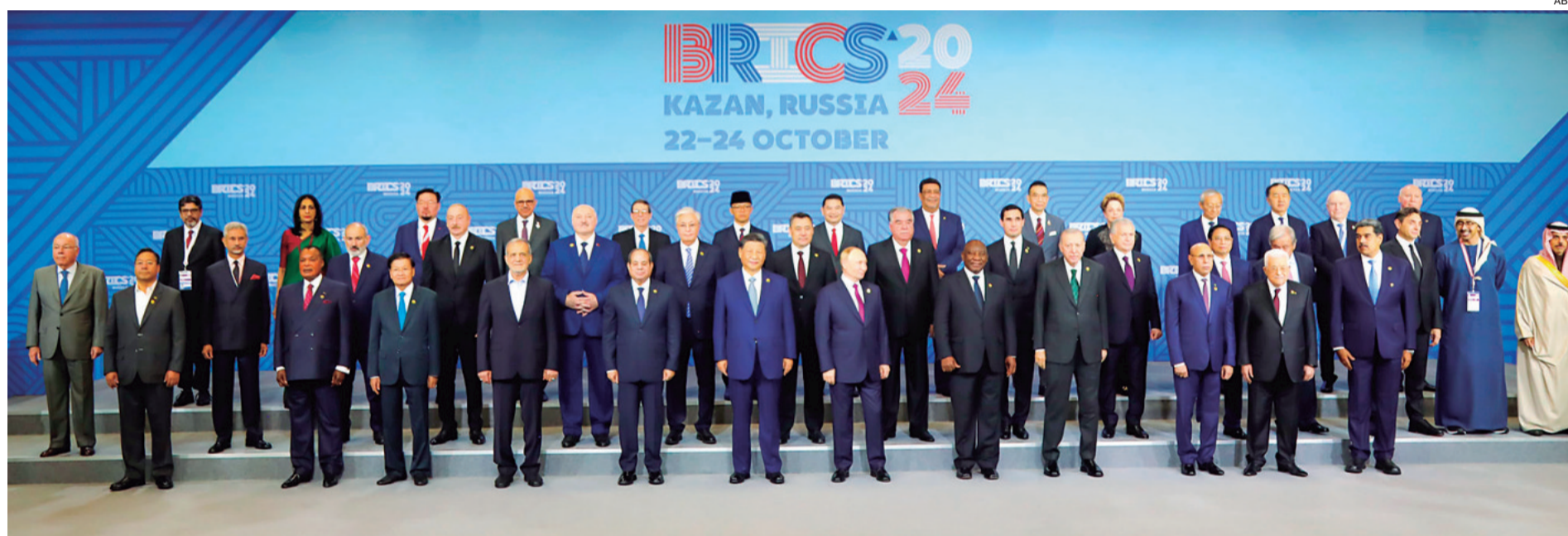
El presidente Luis Arce junto al resto de los mandatarios, en una entrevista con medios rusos pidió ayuda al bloque para acelerar el proceso de industrialización en Bolivia.

Son cinco los miembros: Brasil, China, India, Rusia y Sudáfrica, a los cuales Bolivia ha realizado sus exportaciones. Ser socio de los Brics es una oportunidad de ingresar con más productos a más mercados