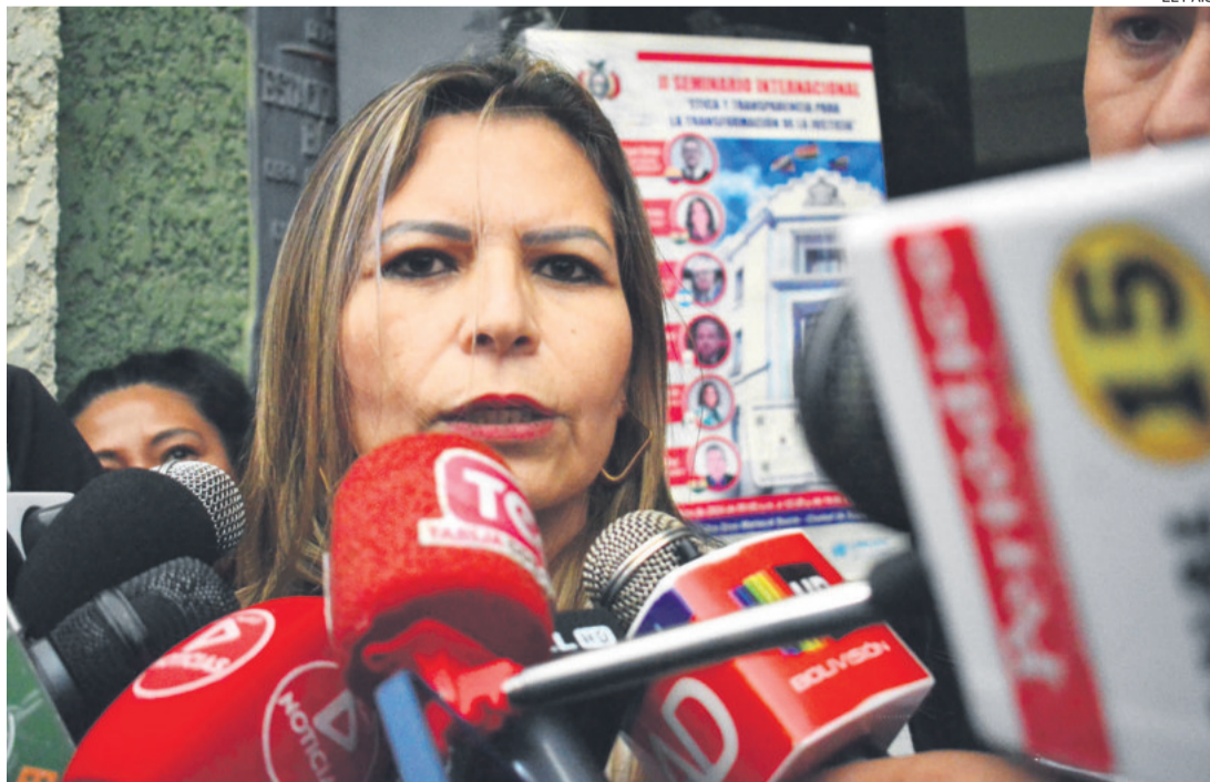
La fiscal de Tarija espera la evaluación del nuevo Fiscal General para continuar con el caso de estupro.