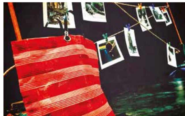
Una muestra del proyecto en su primera versión. FACEBOOK