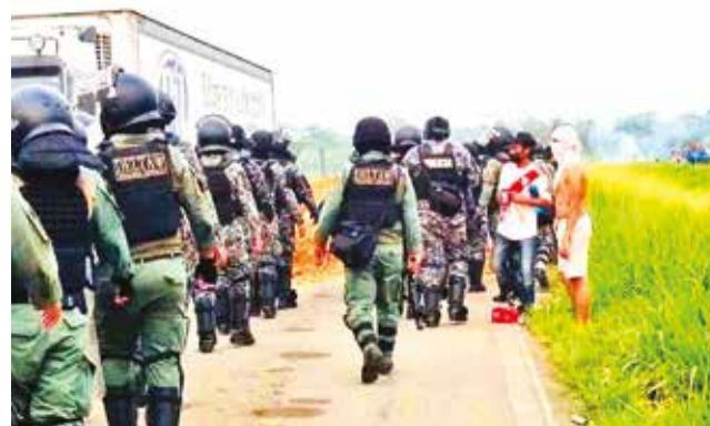
Desbloqueo de la Policía en Bulu Bulu.

“Denunciamos que, según reportes de varios medios de comunicación, periodistas que se desplazaron a la zona de Bulu Bulu fueron obligados a tirarse al suelo ante bloqueadores supuestamente armados