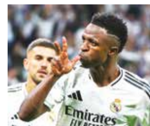
Vinicius festeja uno de sus goles, ayer.

Los otros resultados en el inicio de la tercera jornada fueron: Mónaco 5-1 Estrella Roja, Milán 3-1 Club Brujas, Arsenal 1-0