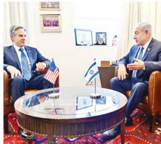
El primer ministro de Israel, Benjamin Netanyahu (der.), se reúne con el secretario de Estado de Estados Unidos, Antony J. Blinken.

Reunión. Blinken y Netanyahu abordaron la ayuda humanitaria en Gaza y la creciente tensión en la frontera con Líbano