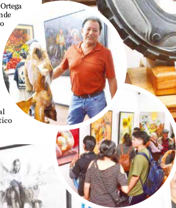
Durante la noche de la inauguración se realizó también la entrega de certificaciones a los ganadores presentes.