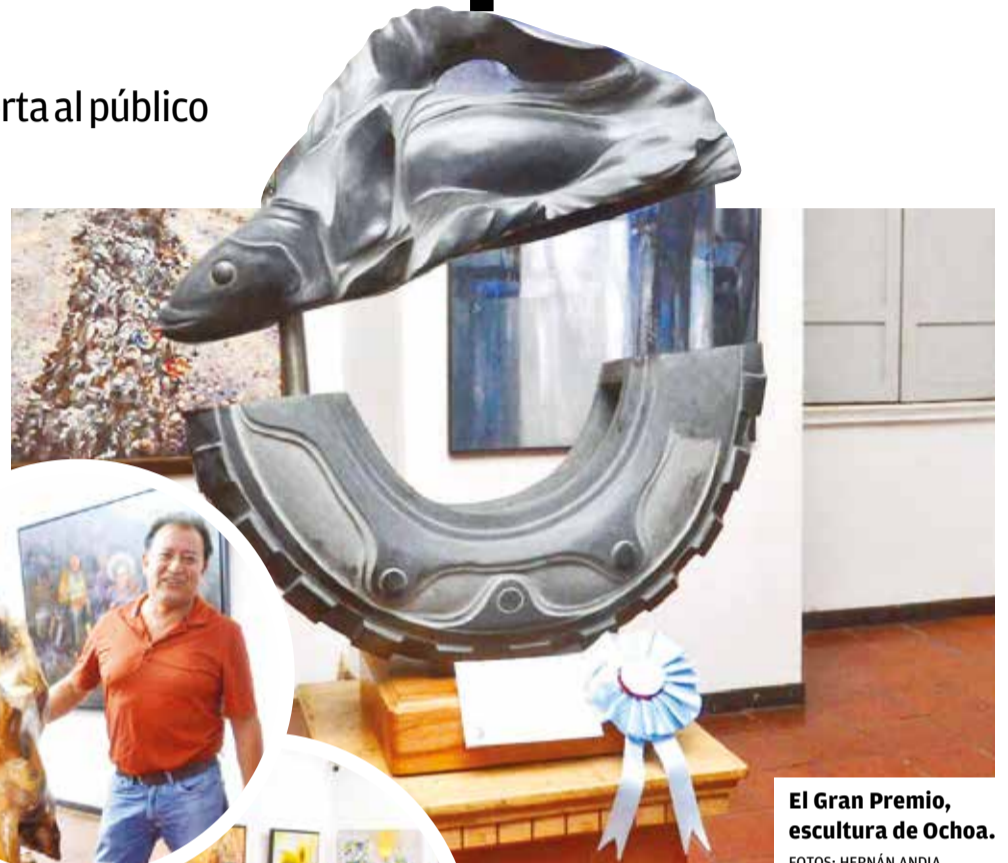
El Gran Premio, escultura de Ochoa.