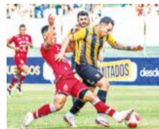
Partido entre Guabirá y The Strongest, el domingo.

La dirigencia de Guabirá determinó presentar la impugnación contra The Strongest ante el Tribunal de Disciplina Deportiva (TDD) de la Federación Boliviana de Fútbol (FBF), por la inclusión de cinco extran-