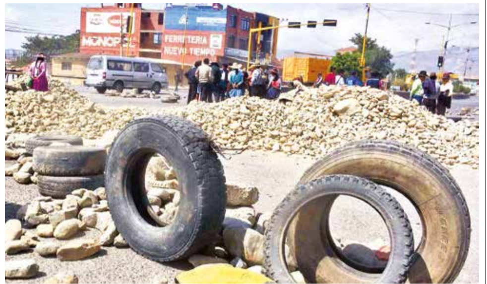
La Policía desbloqueó ayer uno de los carriles en la carretera al valle bajo. JOSE ROCHA

Donde sí lograron habilitar parcialmente la transitabilidad fue en el km 18 de la carretera que une Cochabamba con Oruro, a la altura del puente Khora II. En forma pacífica, la Policía logró abrir el carril del lado sur de la avenida para que puedan transitar los vehículos. La vía norte permanece cerrada por piedras y agregados.