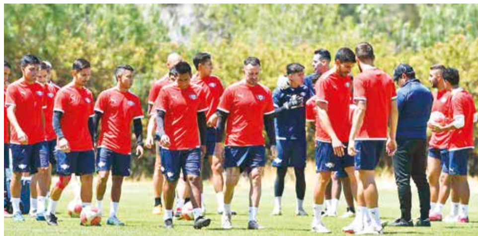
El plantel de Wilstermann antes de un entrenamiento, la semana pasada. CARLOS LÓPEZ