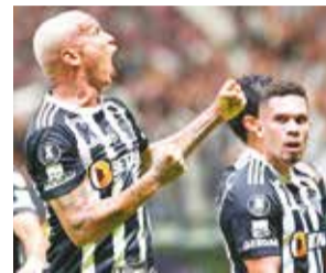
Partido entre Atlético Mineiro y River Plate.

mer título de la Copa Libertadores, recibirá hoy (20:30 HB) en Río de Janeiro a Peñarol, que vuelve a las semifinales del torneo tras una larga ausencia, obsesionado con lograr "la sexta".