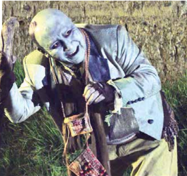
“Averno”, cinta que será proyectada esta noche.