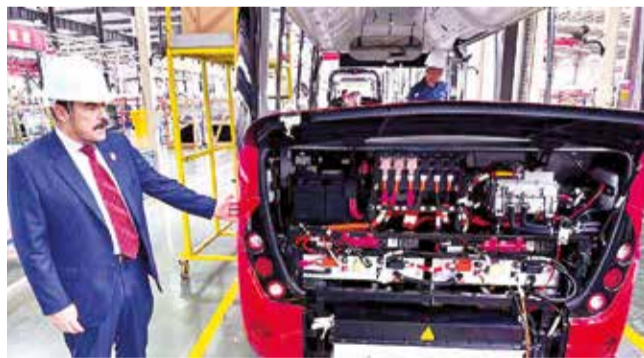
Uno de los vehículos eléctricos hechos en China. RR55

Observaciones. Los transportistas apoyan la renovación, pero cuestionan el precio para implementar el proyecto en Cochabamba