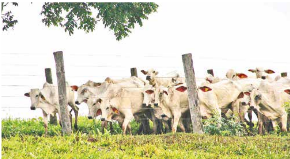
El ganado pasta en llanuras del departamento de Santa Cruz.

“Desde 2013, las políticas estatales, en su afán de promover la economía nacional, han incentivado la deforestación a través de la legalización de desmontes que antes eran considerados ilegales”, destacó el Cedla.