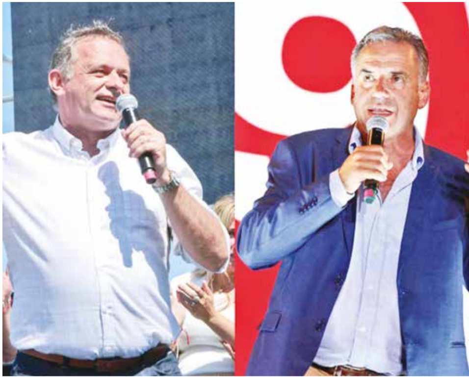
El candidato a la presidencia de Uruguay por el oficialista Partido Nacional, Álvaro Delgado (izq.), y el líder de la coalición izquierda Frente Amplio, Yamandú Orsi.