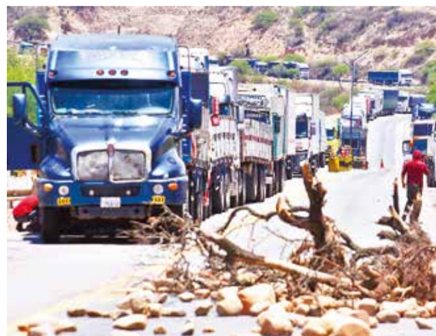
Camiones retenidos con productos por bloqueos. JOSÉ ROCHA