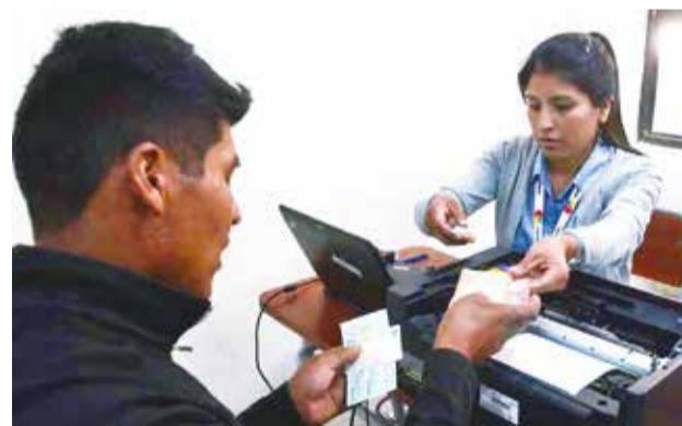
El pago del bono en la ciudad. HERNÁN ANDÍA

De acuerdo a los antecedentes, el precio fue otro aspecto observado por los transportistas, por lo que se busca alternativas de financiamiento para consolidar el proyecto.