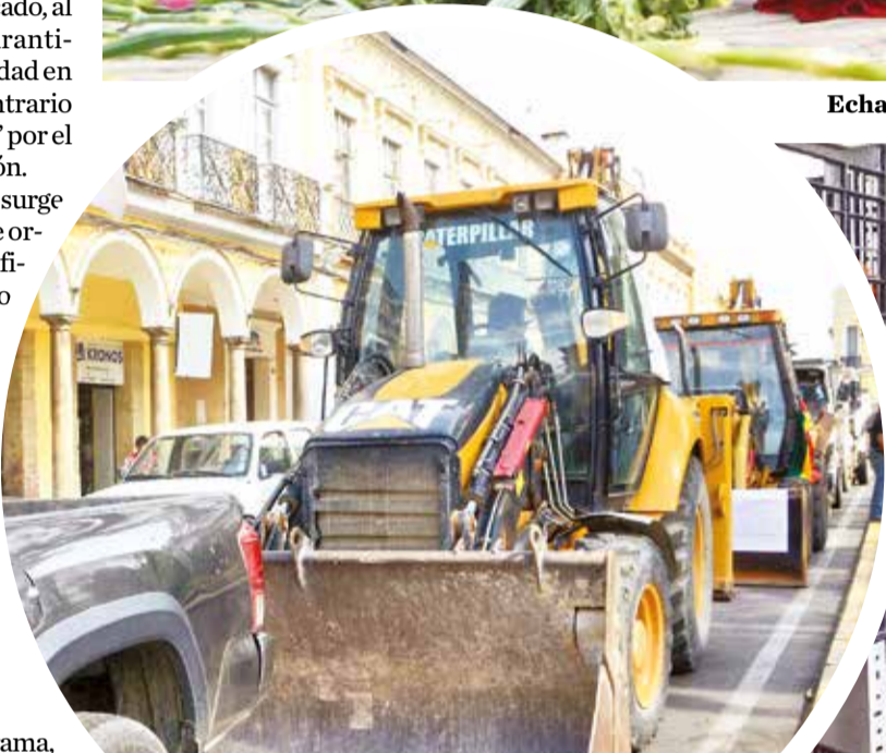
La caravana de equipo pesado de los constructores.