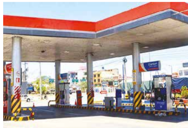
Una estación de servicio cerrada en Cochabamba. H.A.

Postura. La entidad pide al Gobierno garantizar las operaciones empresariales, afectadas por problemas económicos