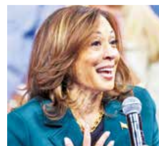
Kamala Harris, aspirante a la presidencia en EEUU.

En una entrevista con Telemundo ayer por la tarde, la vicepresidenta Harris tiene planeado destacar la forma en la que su agenda