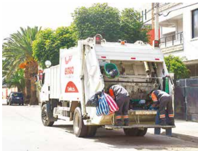
Un carro basurero en servicio en la ciudad.

Pérdidas. Los productores inician movilizaciones exigiendo respeto al libre tránsito. La falta de alimentos, insumos, material de construcción y combustible se ahonda en las cinco regiones del departamento