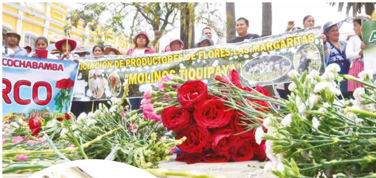
Echan las flores marchitas a la plaza, ayer.

En tanto, los productores del cono sur denunciaron que al menos 50 camiones repletos de hortalizas y verduras están varados en Pocona, mientras que en los mercados de la ciudad escasean va-