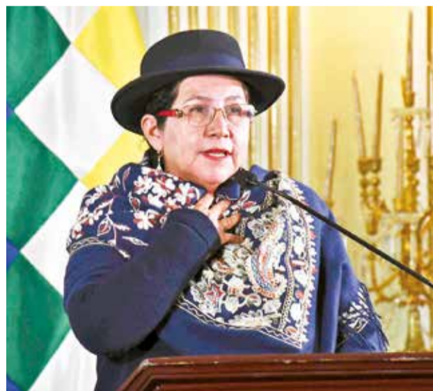
La canciller de Bolivia, Celinda Sosa Lunda.

El Ministerio también ratificó el apoyo del Gobierno de Luis Arce “a la causa palestina y al clamor de la mayor