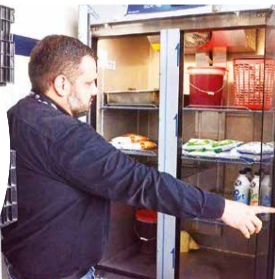
Depósito sin víveres en el Hospital Cochabamba.