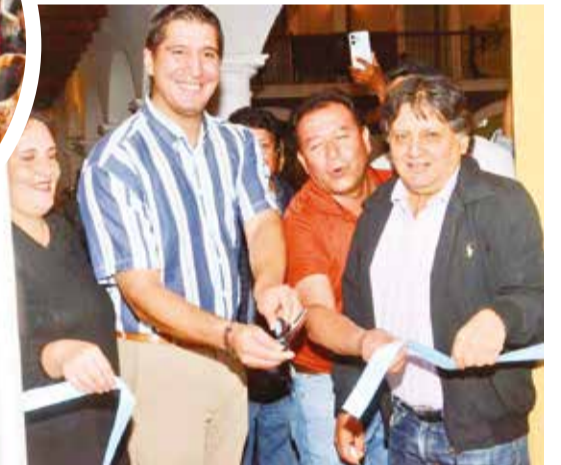
Ceremonia de inauguración y reconocimiento.