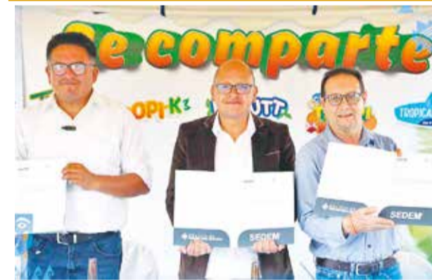
Firma del contrato entre Envibol y Tropifrut. SEDEM

Desde hace nueve días, sectores afines al expresidente Evo Morales mantienen bloqueos en diferentes puntos del país, principalmente en Cochabamba, lo que ha interrumpido la conexión entre el occidente y el oriente del territorio.