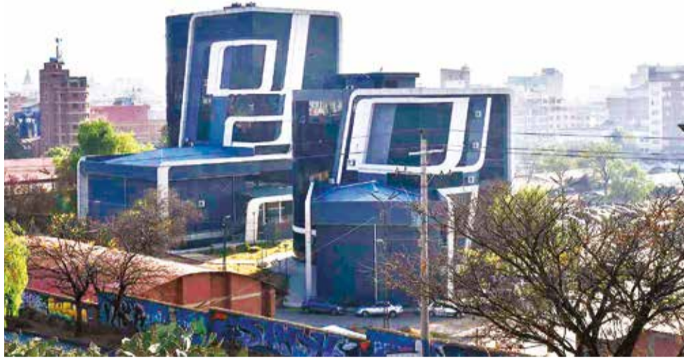
El edificio de la Gobernación de Cochabamba, donde se atiende a la población. CARLOS LÓPEZ

Según los antecedentes, las transferencias de recursos a las gobernaciones han sido más bajas este año en comparación con 2006. La situación se complicará más en 2025. Por este motivo, las autoridades trabajan en ajustes presupuestarios.