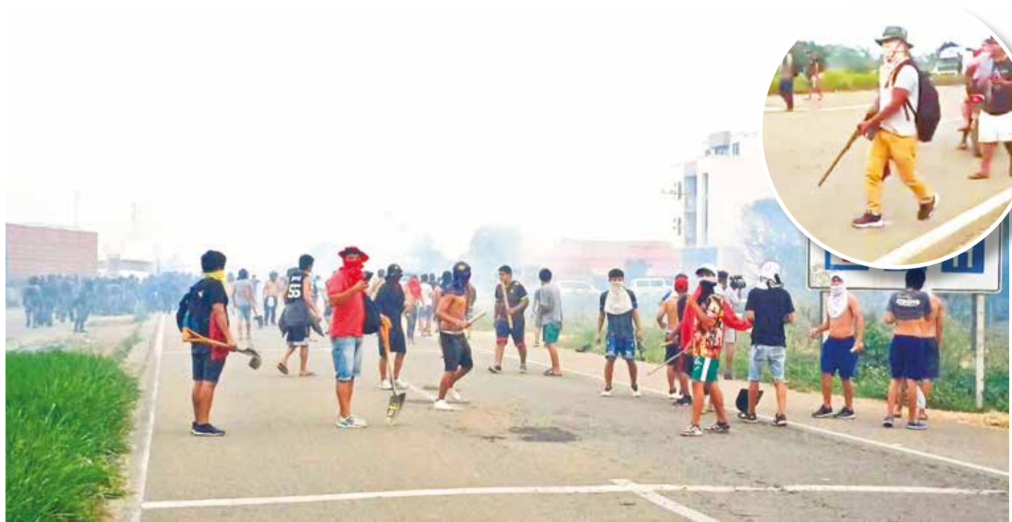
El enfrentamiento entre civiles y policías con bloqueadores en Bulo Bulo. Además, un manifestante porta una escopeta.

Tensión. Policías, bloqueadores y grupos de choque se enfrentaron ayer en el puente Ichilo, en Bulo Bulo, cuando se intentaba despejar la vía al oriente. Págs. 4 y 5