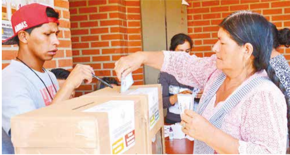
Ciudadanos votan en las elecciones judiciales de 2017, en Cochabamba.

Existe un total de 47 recursos jurídicos contra el proceso de las elecciones judiciales presentadas en distintas salas constitucionales del país. Pese a los recursos, las elecciones avanzan y se encuentran en la etapa de la difusión de méritos a los cargos para el Tribunal Constitucional Plurinacional (TCP), el Tribunal Supremo de Justicia (TSJ), el Consejo de la Magistratura y el Tribunal Agroambiental. La fecha de los comicios judiciales se mantiene para el próximo 10 de diciembre.