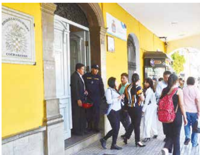
Funcionarios atienden en horario continuo. JOSÉ ROCHA

Consecuencias. Los choferes limitan su trabajo y en varios mercados ya no hay carne de res y los precios del arroz, la harina y el azúcar se duplican. La Alcaldía de Cochabamba trabaja a media máquina.