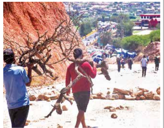
Trasladan ramas para bloquear.