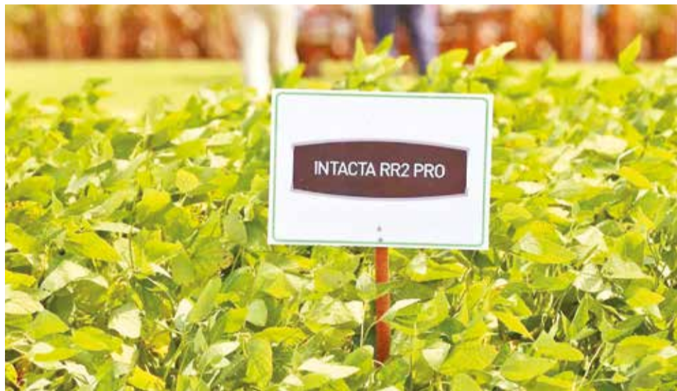
Cultivos de la soya transgénica Intacta en el Centro Experimental de Anapo.

Proyecciones económicas Los beneficios económicos proyectados por Anapo son alentadores. Romero estima que, de continuar aprobando-