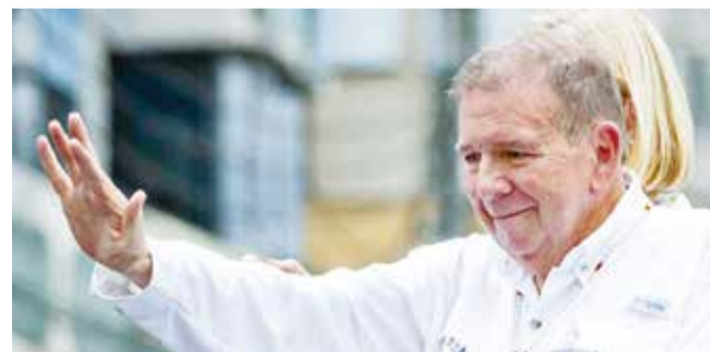
El líder opositor venezolano, Edmundo González Urrutia.

Venezuela. Entre los firmantes de la declaración se encuentran los bolivianos Carlos Mesa y Jorge "Tuto" Quiroga