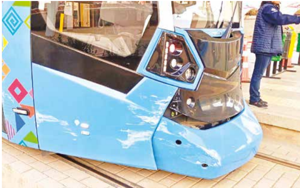
El vagón del tren eléctrico con daños tras la colisión de un taxi.

Sin embargo, algunos conductores y vecinos aseguran que hay algunos puntos críticos en los que se deben reforzar las medidas de seguridad.