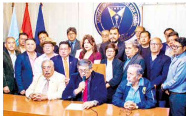
Las actuales autoridades universitarias. TIEMPO UNIVERSITARIO

El Cañadón es considerado el hábitat de varias aves, como el tucán andino y búhos pequeños. Asimismo, es un área donde existe gran cantidad de orquídeas y plantas con una alta calidad endémica, según los biólogos.