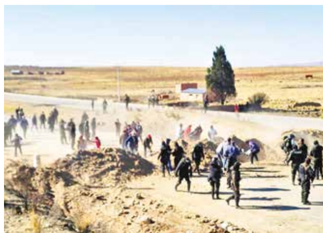
Policías desbloquean la carretera en Caracollo.