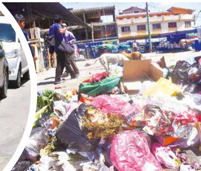
Basura acumulada en calles de Quillacollo. JOSÉ ROCHA