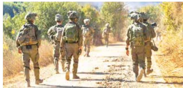
Soldados israelíes en una de las operaciones en la Franja de Gaza, en el sur de Líbano.

Entre los firmantes figuran los expresidentes Mario Abdo (Paraguay), Óscar Arias (Costa Rica), José María Aznar (España), Nicolás Ardito Barletta (Panamá), Felipe Calderón (México), Rafael Ángel Calderón y Laura Chinchilla (Costa Rica), Alfredo Cristiani (El Salvador), Iván Duque (Colombia), Vicente Fox (México) y Federico Franco (Paraguay) e Hipólito Mejía (República Dominicana), Mauricio Macri (Argentina), Carlos Mesa (Bolivia), Lenin Moreno (Ecuador), Jorge Tuto Quiroga (Bolivia).