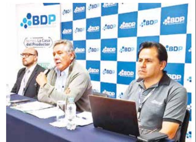
Funcionarios del BDP en conferencia de prensa. S.MENDOZA

El FVC fue creado en 2010 por la Convención Marco de las Naciones Unidas sobre el Cambio Climático como el principal mecanismo financiero internacional para ayudar a los países en desarrollo a reducir sus emisiones de gases de efecto invernadero y combatir la crisis climática.