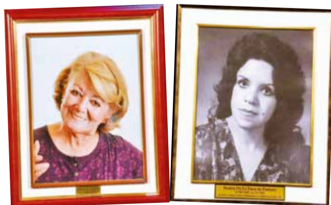
Los cuadros de quienes fueron destacadas actrices de teatro. HERNÁN ANDÍA

La elección del teatro Achá como escenario del homenaje fue un símbolo de justicia para quienes consideran este espacio la “casa” de los actores cochabambinos. Aunque las autoridades determinaron que los cuadros de ambas actrices sean parte de la Galería de Notables de la Casa de la Cultura, Aranibar expresó su deseo de que fueran exhibidos en el propio teatro Achá, en reconocimiento a la cerca-