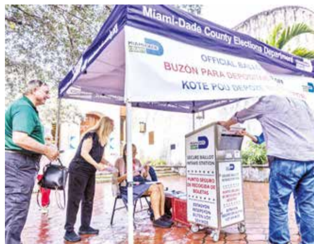
Los electores llegan a depositar sus papeletas en una estación segura de recepción de boletas en Florida.

cuestados que decidieran solo entre Harris y Trump, el 66% apoya la campaña de Harris. Eso supera el 63% de latinos que votaron por el presidente Biden en 2020, según estimaciones de Catalist.