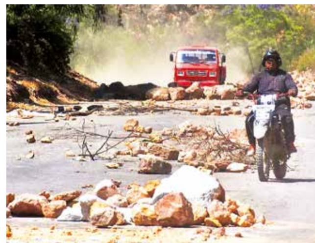
El bloqueo en la carretera a occidente. JOSÉ ROCHA