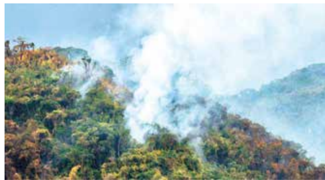
Quema para la apertura de vía en El Cañadón.

Biodiversidad. La zona es un sitio en el que viven varias especies de aves y crecen plantas catalogadas como únicas en Cochabamba