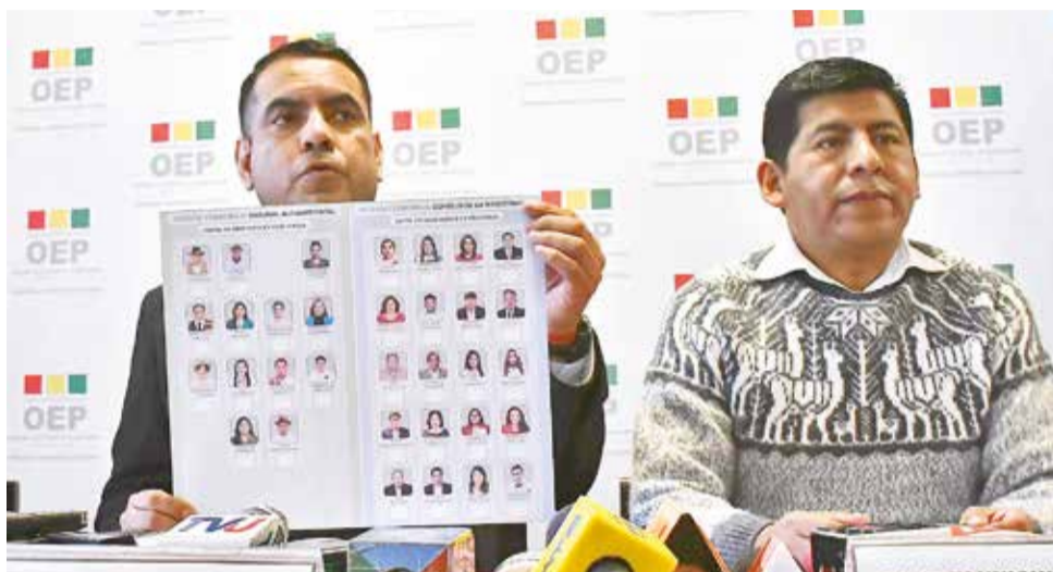
Las papeletas que se usarán en las elecciones judiciales de diciembre.

Asimismo, los medios estatales deben brindar espacios gratuitos para la difusión de méritos de las candidatas y candidatos, garantizando que tengan el mismo tiempo y las mismas condiciones de participación.