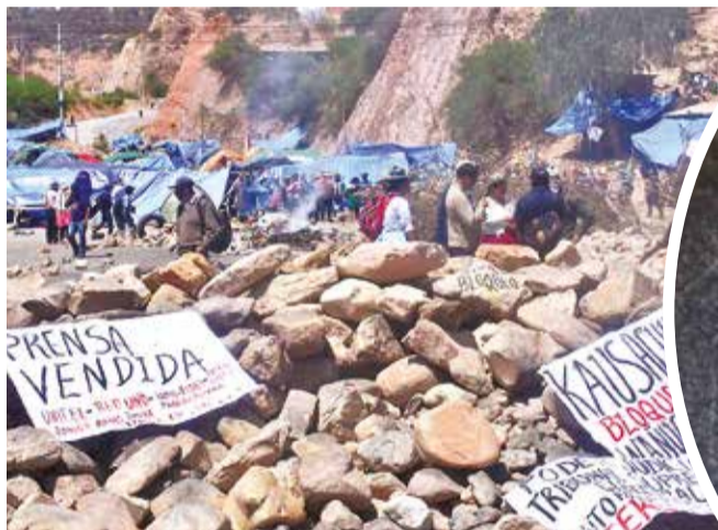
El puente Parotani está intransitable.