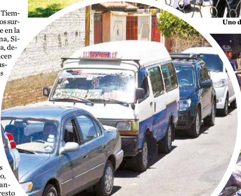
Fila de vehículos para cargar diésel en la ciudad.