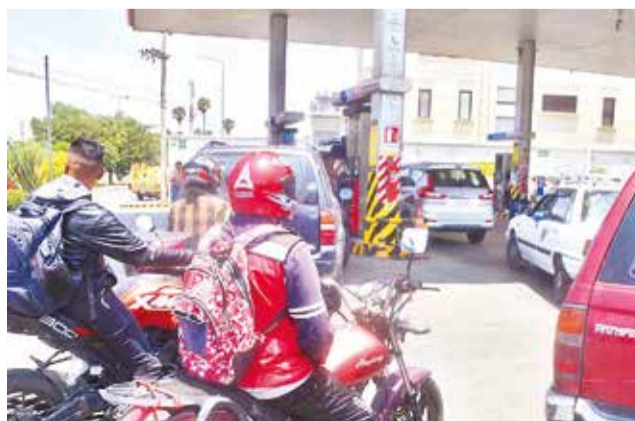
Vehículos hacen fila en un surtidor de Cochabamba. J.R.

las 24 horas del día, los siete días de la semana. La medida busca asegurar el suministro continuo de combustible en todo el país, con un enfoque especial en las ciudades de El Alto y La Paz, donde también se ha dispuesto que las estaciones de servicio funcionen bajo el mismo esquema, in-