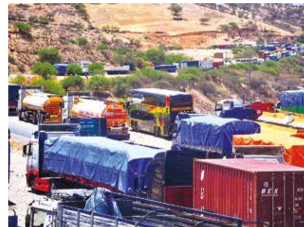
Uno de los puntos de bloqueo en la ruta al occidente. J.R.

Los manifestantes hicieron un llamado urgente a las autoridades para que tomen medidas y pongan fin a esta situación, que no solo impacta a los pequeños empresarios, sino también a la población en general. Portando pancartas, los dirigentes expresaron su rechazo a los bloqueos, que consideran injustificados, e instaron a Morales a resolver sus problemas legales “donde corresponde: en las instituciones legales”.