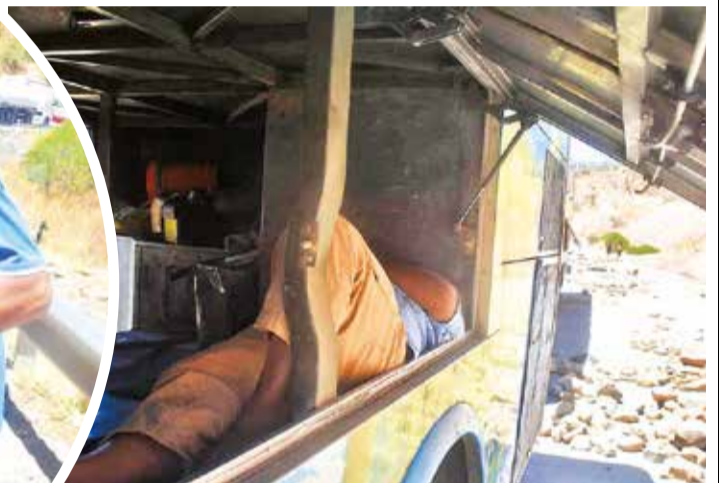
Un conductor descansa en el camarote, ayer.