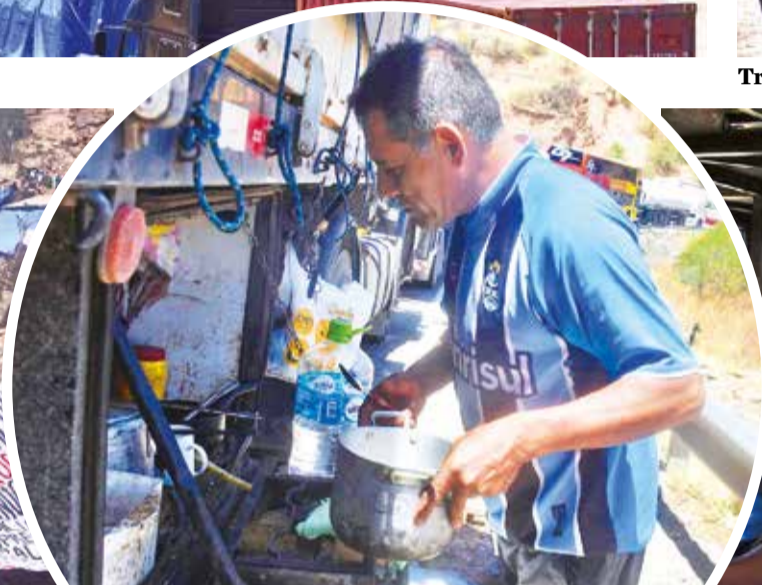
Un chofer prepara sus alimentos.