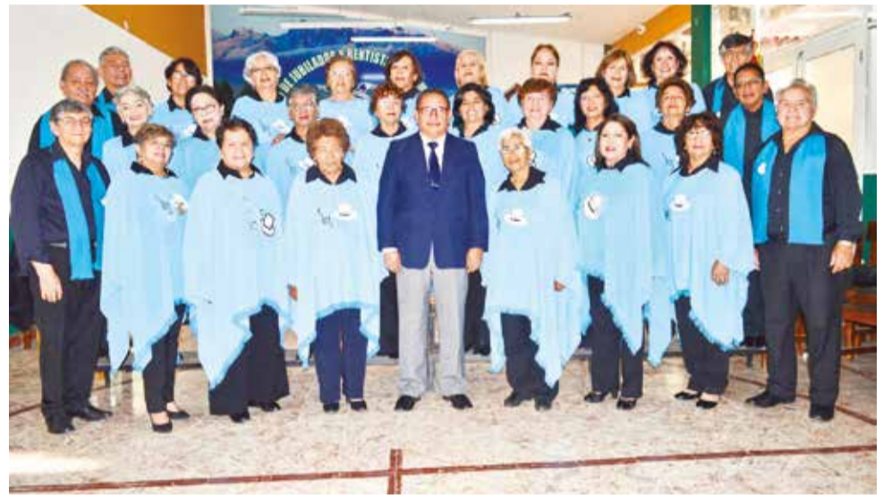
Miembros actuales del centro cultural Voces y Cuerdas del Valle.

Este año, se llevará a cabo el 1er Festival Nacional de Coros del Adulto Mayor, el próximo 3 de noviembre en el Teatro Adela Zamudio, donde nuevamente se destacará la participación de coros locales y nacionales.