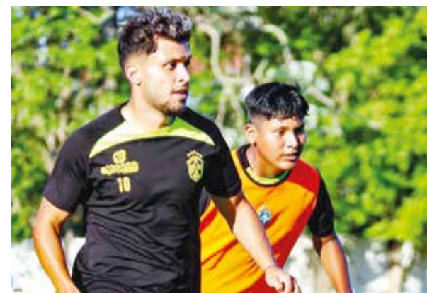
Entrenamiento de San Antonio en Santa Cruz. SAN ANTONIO