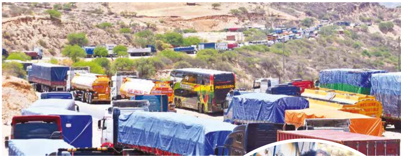
Buses y camiones detenidos en Parotani.