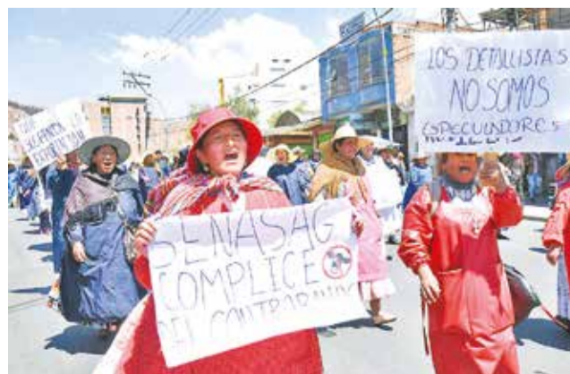
Marcha de comerciantes de carne en La Paz, ayer.

cios de estos productos. Los manifestantes denuncian que las exportaciones descontroladas y el contrabando hacia países vecinos han afectado gravemente los costos. La protesta, liderada por la Federación Única de Trabajadores en Carne y Ramas Anexas (Futecra),