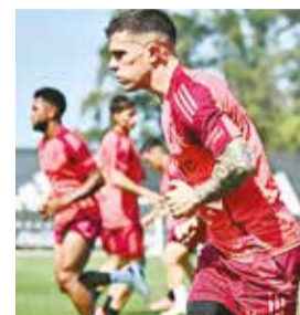
Entrenamiento de River Plate. CLUB ATLÉTICO RIVER PLATE