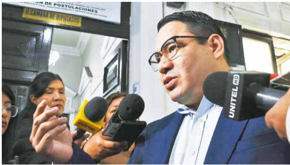
Roger Mariaca, el nuevo Fiscal General del Estado. APG

El analista Israel Quino mencionó cuatro tareas inmediatas que debe asumir el nuevo fiscal: reestructuración, debe cesar en sus funciones a los malos operadores; descongestión procesal, los índices de detenidos preventivos sin sentencia sobrepasan el 65% de la población y debe terminar con eso; solvencia, debe garantizar una Fiscalía institucionalizada, firme en defensa de los derechos de la sociedad, y objetividad, debe construir un Fiscalía sólida capaz de procesar a los poderosos y a los allegados de las esferas del poder.