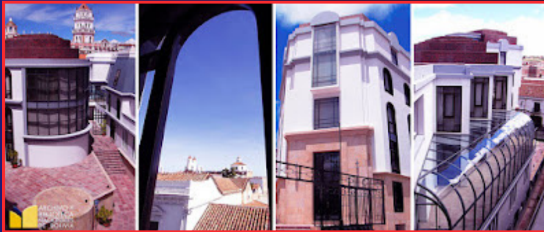
Archivo y Biblioteca Nacional de Bolivia (ABNB), ubicado en la ciudad de Sucre, del Estado Plurinacional de Bolivia.

"El archivista protege la integridad de los bienes documentales, fiel testigo del pasado y presente"