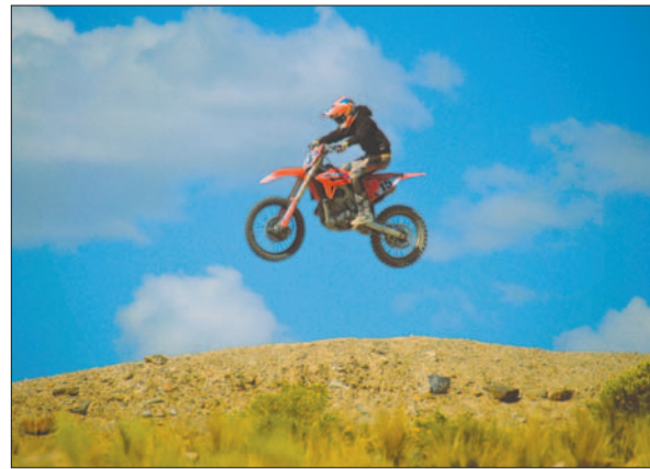
El público disfrutó de los saltos en la modalidad Cross