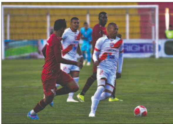
Nacional Potosí no pudo hacer valer su condición de local