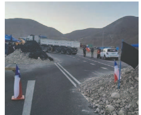
La ruta entre Bolivia y Arica /RRSS.

Durante esta crisis, las estaciones han reportado largas filas y escasez significativa. La situación ha llevado a un aumento en la preocupación entre los ciudadanos sobre el acceso al combustible necesario para sus actividades diarias.