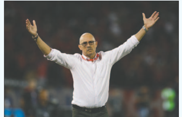
Alfredo Arias volverá a dirigir a Deportivo Cali el 2025

Actualmente ocupa la casilla 17 con 11 puntos de 42 posibles, lejos del líder de la liga América de Cali, que tiene 32 unidades, y sin posibilidad de clasificarse a la siguiente fase del torneo colombiano que disputan 20 equipos. De momento Deportivo Cali seguirá al mando de Sergio Herrera hasta final de este año.