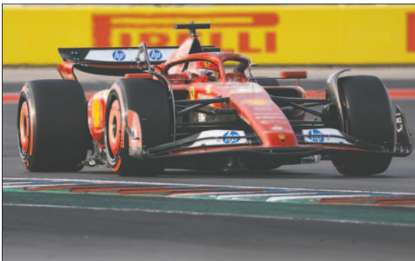
Charles Leclerc ganador de la prueba en plena competencia

Pero Norris fue penalizado con cinco segundos, los mismos que evitaron que Norris pudiera recortar tres unidades en el Mundial de pilotos y lo que permite a Verstappen sumar esos tres puntos de diferencia.