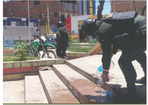
Efectivos policiales desechan la bebida de algunas personas que estaban con alcohol en vía pública

Los trabajos se hicieron en varias horas, algunos durante el día y otros por la noche, según hicieron conocer los efectivos policiales; este plan se ejecutó en el marco de evitar que los transeúntes sean atacados durante su paso por algunos espacios.