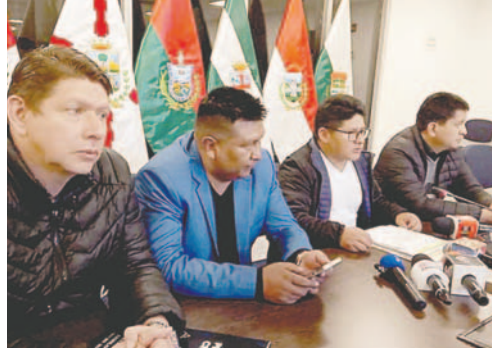
La Comisión Mixta de Justicia Plural se hizo cargo de las primeras etapas del proceso

La norma establece que si en la primera votación no se obtienen los dos tercios de los asambleístas presentes para la designación de la o el Fiscal General del Estado, se dará