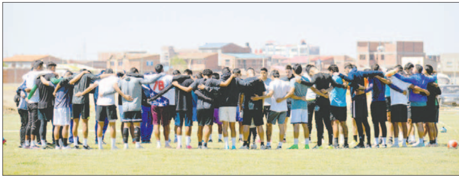
El plantel está unido a pesar de la falta de pago de sueldos pasan los tres meses / LA PATRIA

En horas de la noche se programó el viaje a la capital oriental, primero por vía terrestre hasta La Paz, donde pernoctarán; este lunes sostendrán un entrenamiento para luego, en horas de la tarde, emprender el viaje vía aérea hasta la capital oriental.