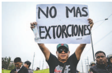
Foto de archivo de un hombre que sostiene un cartel durante una jornada de paro de transportadores en Lima (Perú)

El nuevo texto mantiene la definición de crimen organizado como una “es-