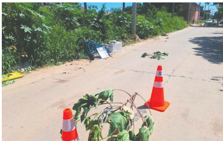
Así quedó la bicicleta del vendedor después del accidente

Tras el incidente, los vecinos llamaron a la Policía, que procedió a aprehender al sujeto. Este fue llevado a las dependencias de la institución del orden, donde esperará hasta que se de-