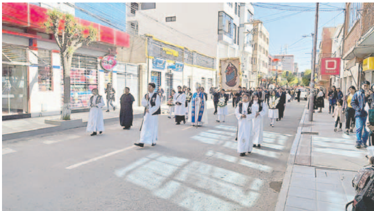
Estudiantes del Magdalena Postel secundaria y miembros de la Diócesis de Oruro encabezaron la entrada