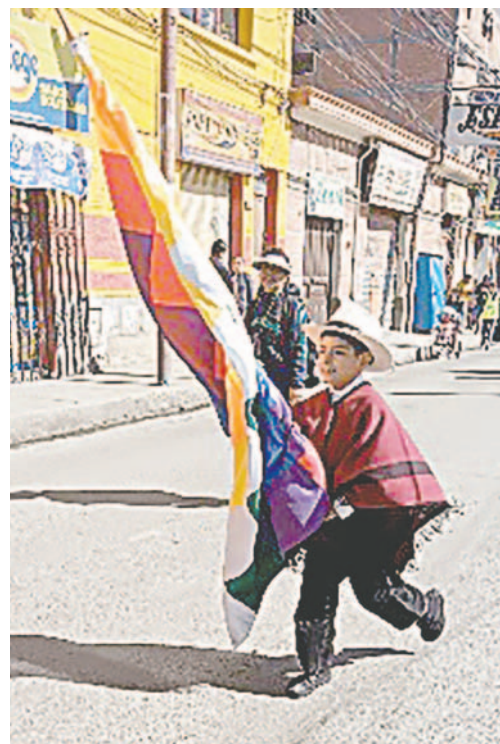
Niños con discapacidad toman el protagonismo en la 1ra. Entrada de Educación Especial

"Hemos estado aproximadamente más de 2.000 integrantes en esta primera actividad, por ser de inclusión han estado los centros de educación especial, unidades inclusivas, normales quienes nos han acompañado en esta actividad que tiene el mensaje de promover la inclusión educativa, social y laboral. Por ser la primera vez damos una valoración buena porque es sana y de esparcimiento", expresó el subdirec-