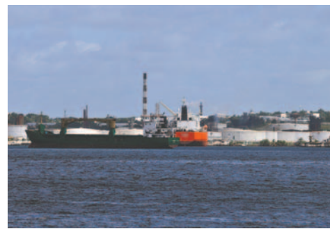
Fotografía de la refinertía Níco López este domingo, en La Habana (Cuba)

El proceso de reenergización y recuperación del SEN ha logrado avances