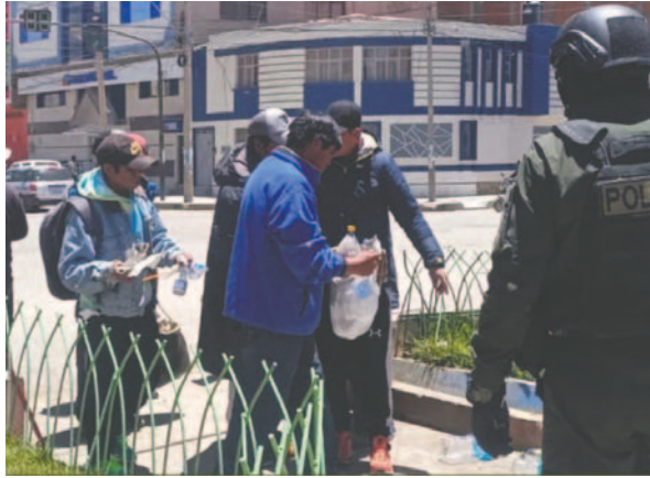
Los bebedores consuetudinarios fueron retirados

consuetudinarios que se encontraban en varios espacios, se hizo un monitoreo de personas sospechosas, patrullajes preventivos en zonas alejadas de la ciudad y también el retiro de personas quienes se encontraban durmiendo en entidades bancarias y cajeros automáticos.