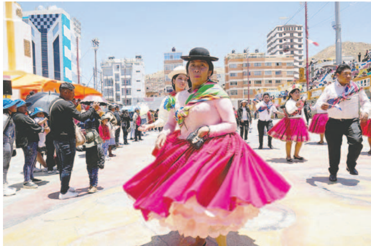
Desde Eucaliptus la moseñada se hizo sentir en la entrada