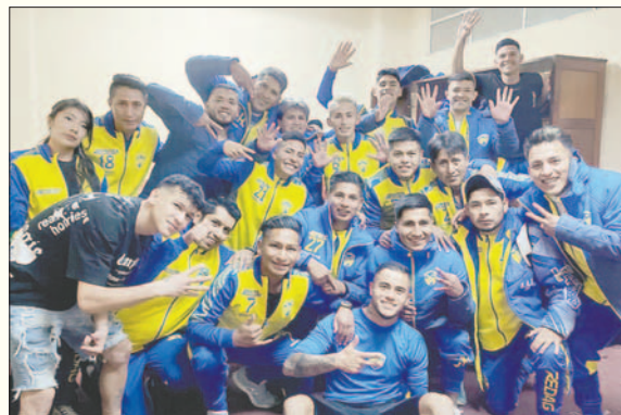
Jugadores de Proyecto Redag celebran la clasificación a cuartos de final