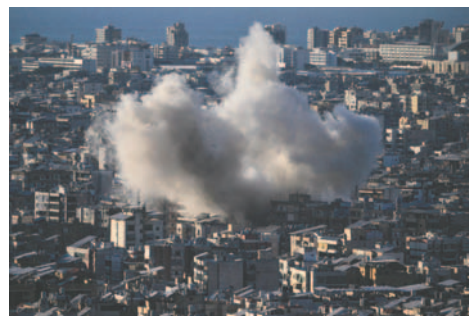
El humo se eleva tras un ataque aéreo israelí contra el Dahye, un suburbio del sur de Beirut (Líbano), el 19 de octubre de 2024

Este es el segundo ataque en dos días contra el Dahye, una zona severamente castigada desde el inicio de la campaña de bombardeos masiva inicia-