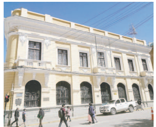
GAMO toma acciones para recuperar predios

Según la autoridad, lo que se busca es que los procesos de licitación que se realicen sean transparentes, mediante los cuales se pueda postular