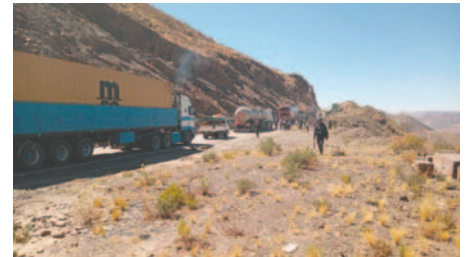
La Policía intervino en la zona de Pocoata