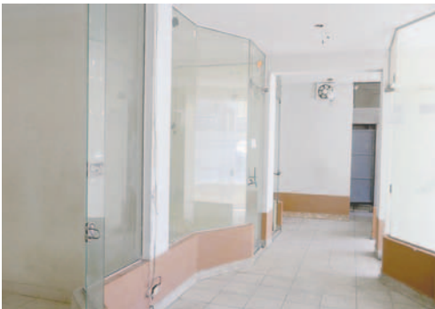
Recientemente, el edificio “Mil Novedades” fue recuperado por la Alcaldía

aquel que ofrezca mejores cánones que ingresen a las arcas del municipio.