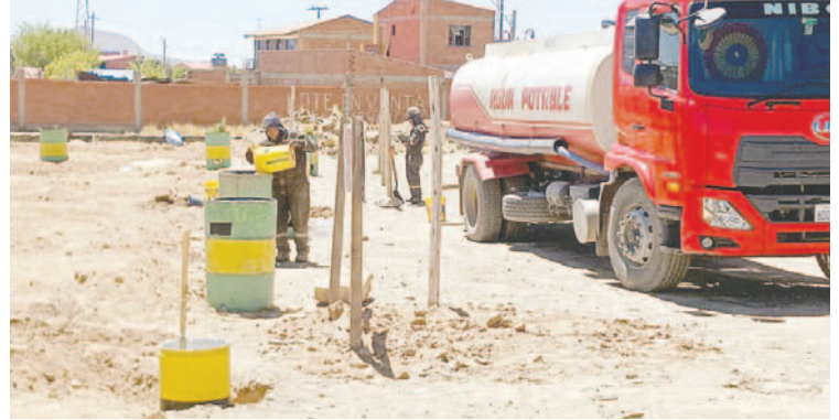
Lugar donde se hizo la reposición de los 200 plantines