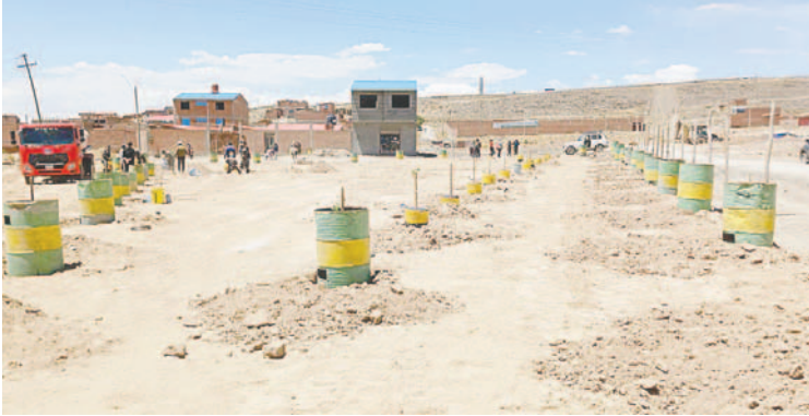
También se realizaron tareas de riego en el lugar /DSA-GAMO