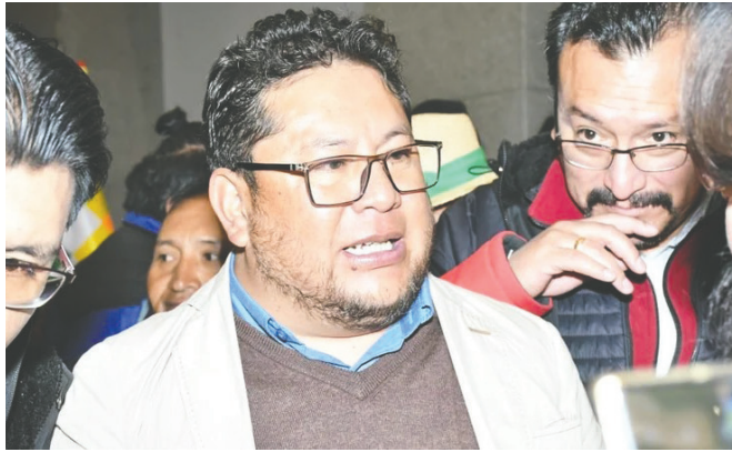
Erland Julio Rodríguez Lafuente, ministro de Trabajo, Empleo y Previsión Social

En principio, solo los departamentos mencionados trabajarán desde las 8:30 hasta las 16:30 horas y el jueves se retoma el horario normal. El ministro explicó que “por los problemas de la llegada de combustible a nuestro país, tanto por el paro en Chile como por los bloqueos en Bolivia, el Ministerio de Trabajo y Previsión Social ha tomado la medida”.