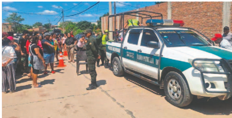
La Policía llegó al lugar del hecho para proceder a realizar el levantamiento legal del cadáver