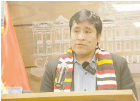
El presidente de la Cámara de Diputados, Israel Huaytari

"¿De qué medio es?", preguntó Huaytari a la periodista que pidió conocer detalles sobre la reunión con el fiscal Alave, un encuentro registrado en imágenes el miércoles 16 de octubre. "De Red Uno", respondió la periodista con firmeza.