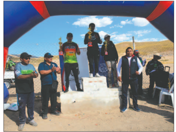
Los ganadores de la categoría MX1-MX2

Otra de las categorías donde se tuvo mucha emoción fue la 220-250cc, donde los abandonos por fallas mecánicas estuvieron a la orden