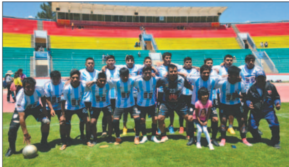
Honroso segundo puesto para Santos de Belén "B"