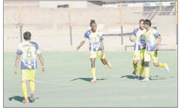
Deportivo Shalon recupera el segundo puesto de la tabla