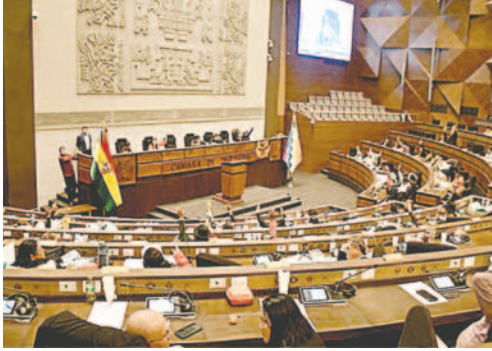
La Asamblea tiene el plazo ajustado para escoger al nuevo Fiscal General