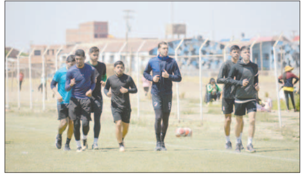
Los jugadores que jugaron el sábado hicieron un trabajo regenerativo

El equipo estaba decidido a paralizar la práctica como medida de protesta, pero se tuvo la mediación del cuerpo técnico y decidieron seguir apoyando a la institución, que