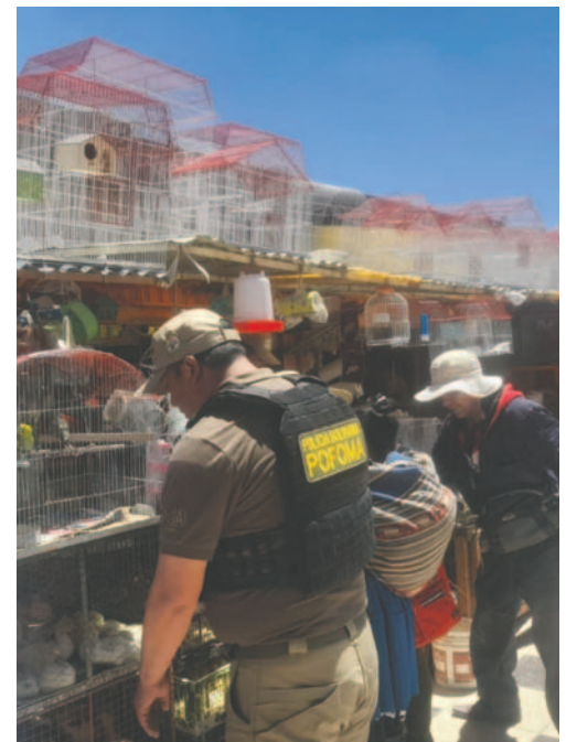
Controles se hicieron en mercado Bolívar, Kantuta y otros

Bajo la Ley 1525, que garantiza la protección y conservación del cóndor andino como símbolo y patrimonio natural y cultural del país, establece sanciones para quienes