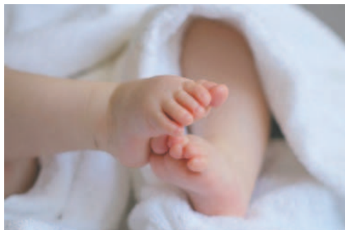
El bebé fue agredido con un cuchillo /REFERENCIAL

El hombre quedó aprehendido y aguarda su audiencia cautelar en oficinas de la Fuerza Especial de