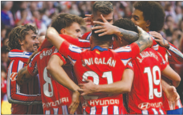
Atlético de Madrid pudo remontar ante Leganés (3-1)

Osasuna 1-2 Betis, Girona 0-1 Real Sociedad, Celta de Vigo 1-2 Real Madrid, Mallorca 1-0 Rayo Vallecano, Atlético de Madrid 3-1 Leganés, Villarreal 1-1 Getafe, Barcelona 5-1 Sevilla; lunes: Valencia-Las Palmas.