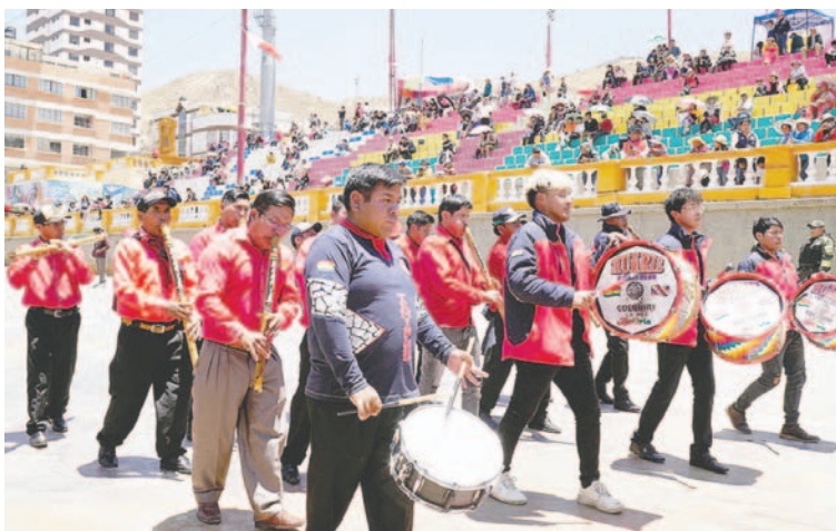
Cada conjunto tenía su propia banda que los acompañó de principio a fin

cación, en coordinación con el Ministerio de Educación, comenzó en la calle Pagador y Montesinos y concluyó en el Campo Mariano, afuera del Santuario del Socavón.