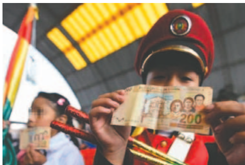
El bono Juancito Pinto es un beneficio que consta en un pago de Bs 200 /APG

a los estudiantes del nivel primario y secundario. Para acceder al beneficio, solo es necesaria la pre-