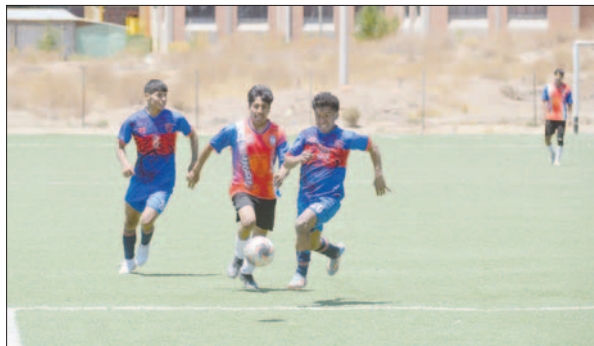
El equipo de JCDT pudo marcar más goles, faltó finura en la puntada final

La Cantera FC se alzó con un triunfo importante sobre Atlético La Joya por la cuenta de 2 goles contra 1, buscando eludir la zona del descenso.