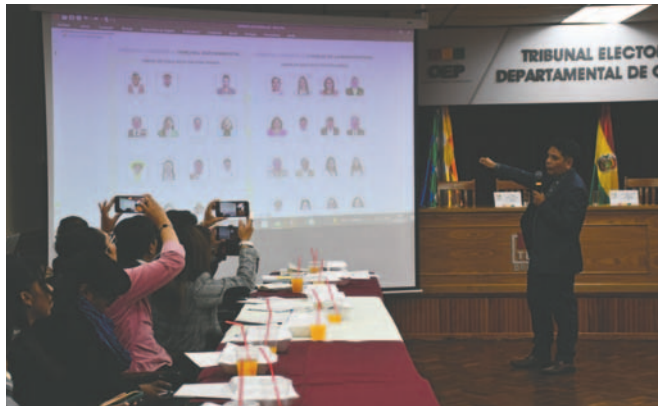
El TED Oruro realiza varias actividades previas a las elecciones judiciales

El Padrón Electoral se encuentra en la etapa final de consolidación, dijo Arroyo, puesto que se trabajará con las listas oficiales para el posterior sorteo de los jurados electorales y la asignación de mesas de los habilitados el 24 de octubre, a través de los medios escritos y redes sociales