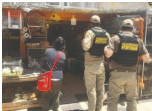
Los controles se intensificarán antes del Primer Convite /CDPO

personal de la Policía Forestal y Preservación del Medio Ambiente (Pofoma) realizó controles en el mercado Simón Bolívar, donde existe esta actividad comercial, y se verificó los puestos de venta; así mismo, se recordó que la venta de fauna silvestre es sancionada con la ley.