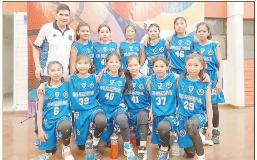
Gran campaña de Saavedra en la Libomemor femenina / CLUB SAAVEDRA