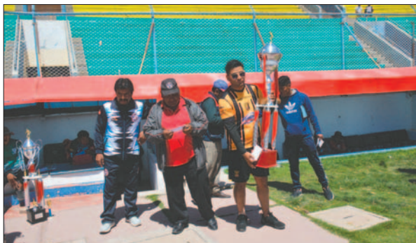
La jornada concluyó con la premiación a los campeones de cada categoría