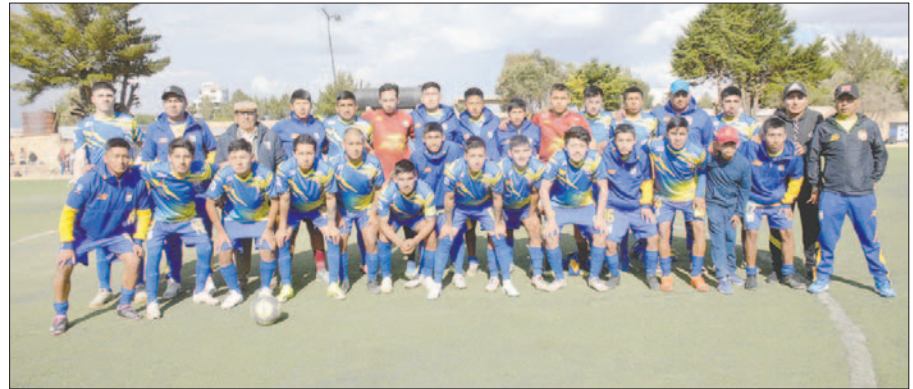
EM Huanuni sigue de líder y es firme candidato al título

El partido fue dinámico de principio a fin, con una leve inclinación hacia JCDT, que generó ocasiones claras de gol pero no supo capitalizarlas en su momento; por ello, sufrió más de la cuenta para lograr su segundo triunfo en el torneo.