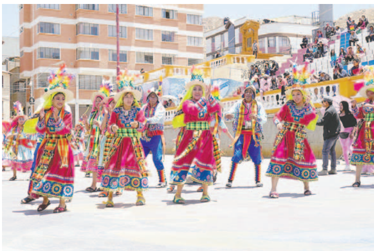
Centros de educación especial, unidades inclusivas, universidades de Oruro y otras provincias se sumaron a la causa