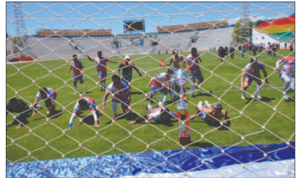
El festejo de los campeones luego de la vuelta olímpica

En esta categoría, las posiciones finales quedaron con 24K Amistad como primero, Santos de Belén "B" en segundo lugar y Santos de Belén "A" en tercera casilla. En el encuentro por la categoría Primera de As-