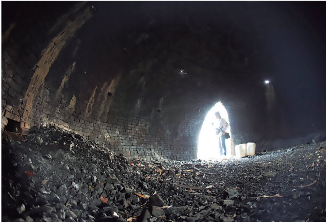
El interior oscuro de un horno carbonero. En él, cientos y cientos de troncos frondosos se reducen a nada

“Los requisitos para abrir un horno son básicos: una resolución de asentamiento y un plan de desmonte de 20 hectáreas, entre otros documentos menores”, detalló.