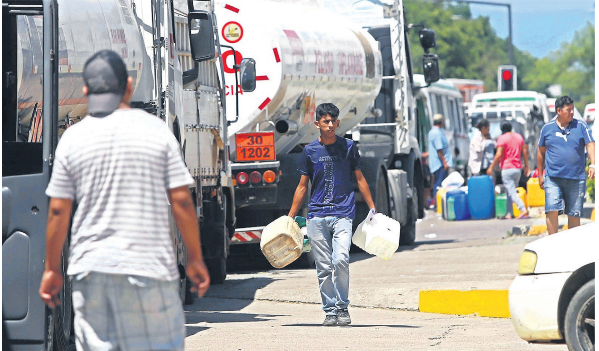
La falta de combustible en las ciudades es uno de los principales efectos del bloqueo que realizan los evistas del MAS.

EVO YA HACE CÁLCULOS DE SUS ACTOS COMO PRESIDENTE