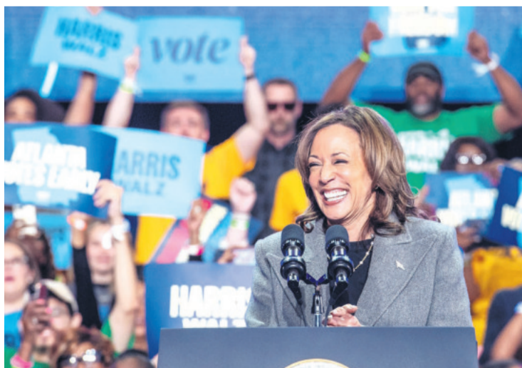
La candidata demócrata para los comicios del martes 5 de noviembre

En un acto de campaña celebrado en la iglesia Divine Faith Ministries International de Jo-