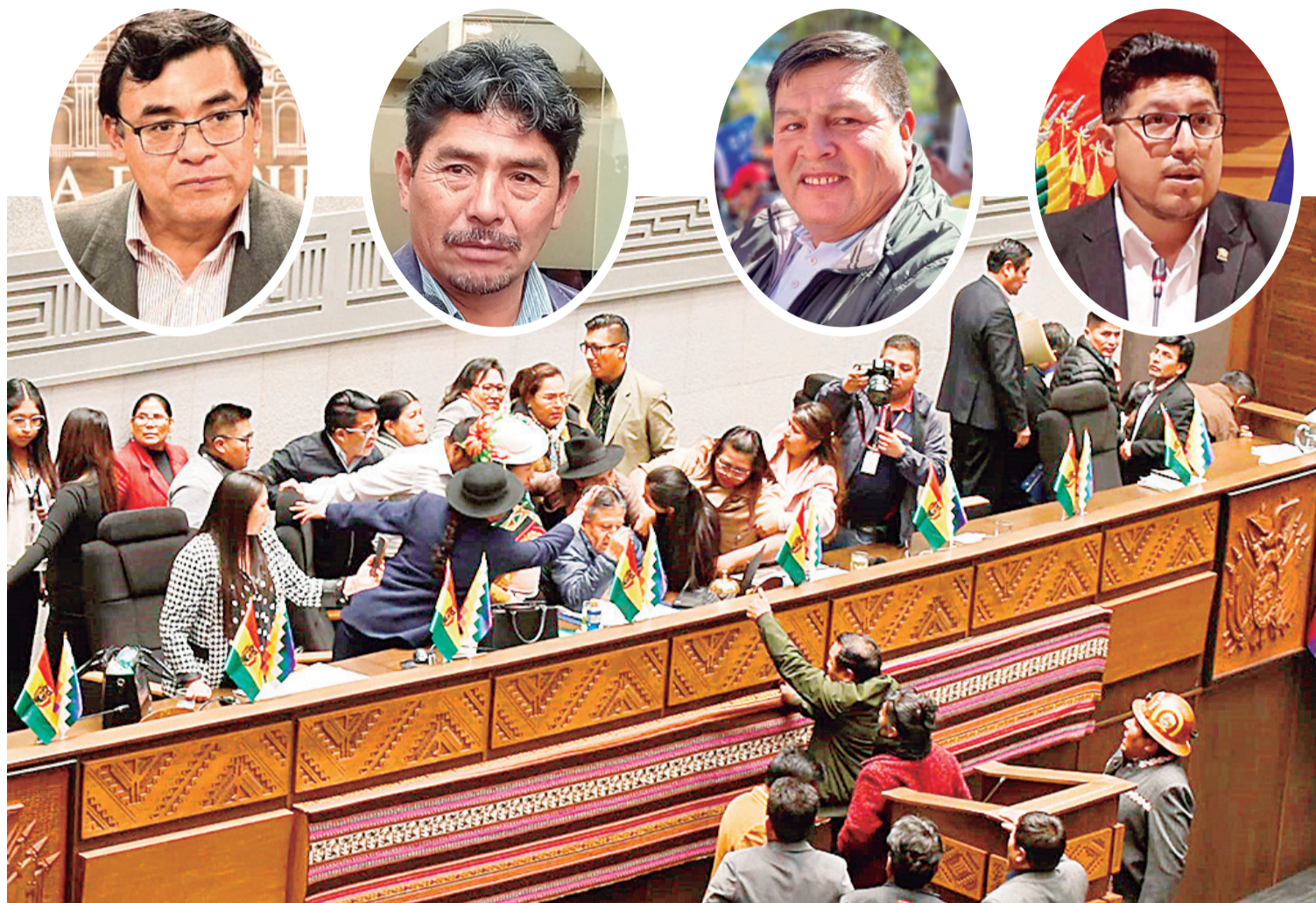
Asambleístas violentos. La imagen refleja uno de los varios momentos vergonzosos que protagonizaron los "padres de la Patria" este año.

estrecha relación con el expresidente Evo Morales quien se sujetó de Rodríguez para fortalecer su marcha política de septiembre de Caracollo a La Paz, cuando resaltó que tenía el apoyo del "tercer hombre del Estado".