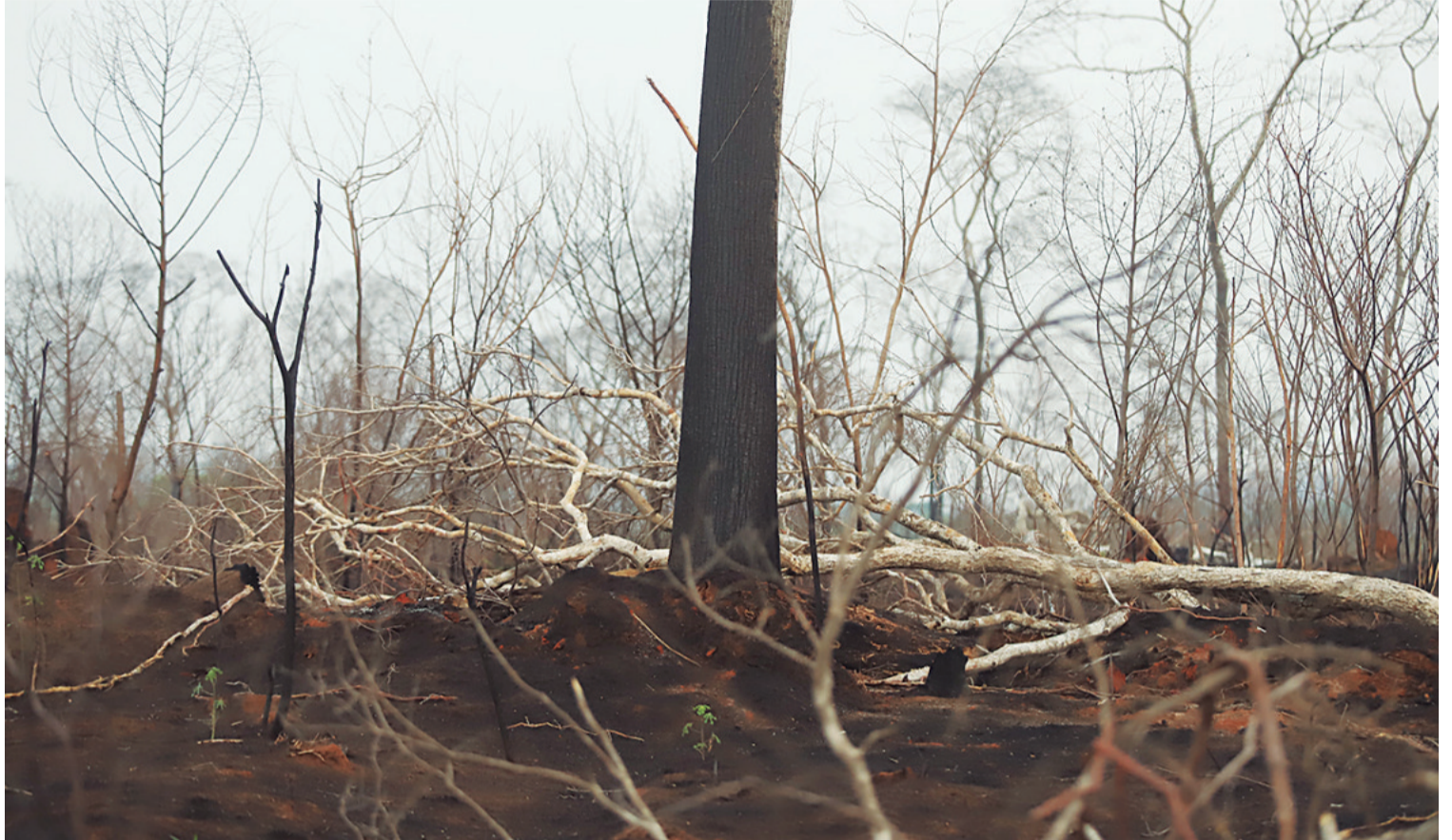
Solo algunos árboles se salvaron del voraz incendio que azotó durante cuatro meses al municipio de San Rafael, que perdió el 60% de sus bosques

Sin embargo, explicó que los requisitos para abrir un horno son mínimos, lo que facilita que estas instalaciones se multipliquen.