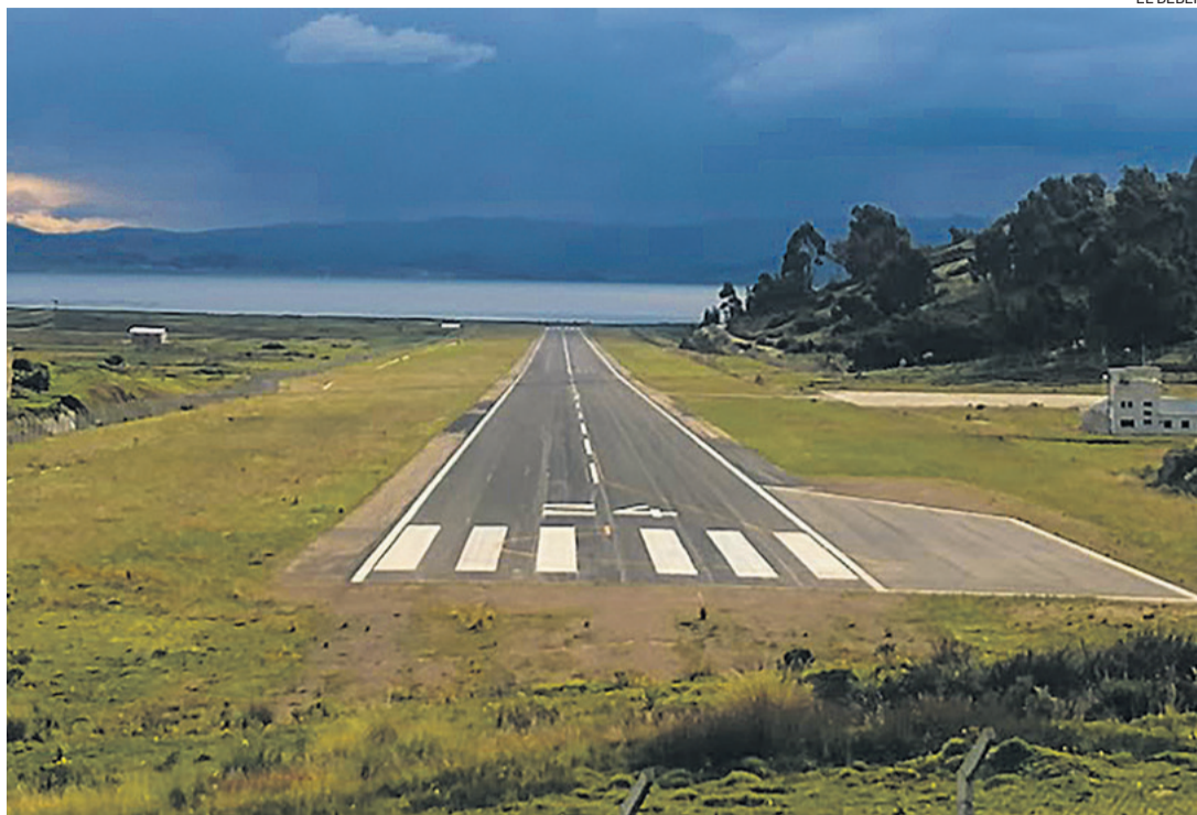
El aeropuerto de Copacabana no recibe vuelos regulares. Una empresa gestiona paseos en helicóptero.

Ixiamas es una región que tiene el 60% de su extensión inmerso en un área protegida municipal. Esta zona es una fuerte área productora, sobre todo de castaña y frutas, como el asá y el plátano.