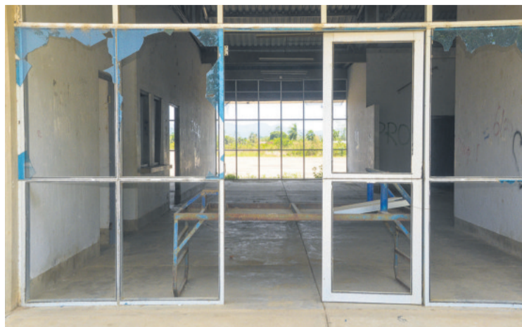
Las puertas del aeropuerto de Ixiamas están totalmente dañadas.