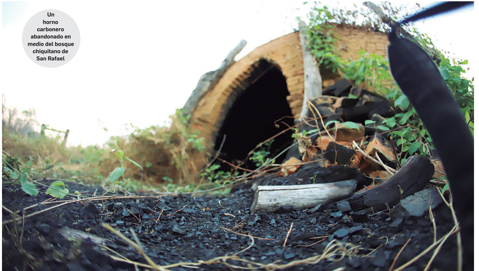
Un horno carbonero abandonado en medio del bosque chiquitano de San Rafael