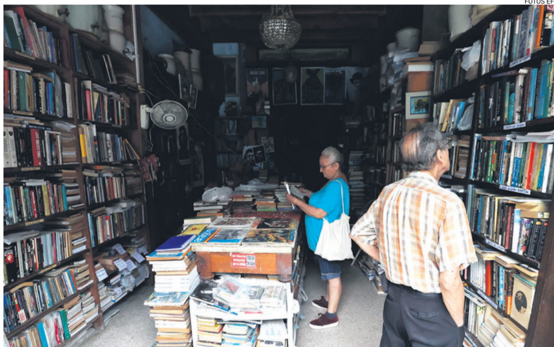
Desde el viernes han sido tres los apagones totales por fallas en el sistema eléctrico de la isla

El ministro de Energía y Minas, Vicente de la O Levy, aseguró este domingo en una comparecencia antes de este tercer apagón total que el Gobierno aspira a que el SEN vuelva a alcanzar el martes el estado en que se encontraba el