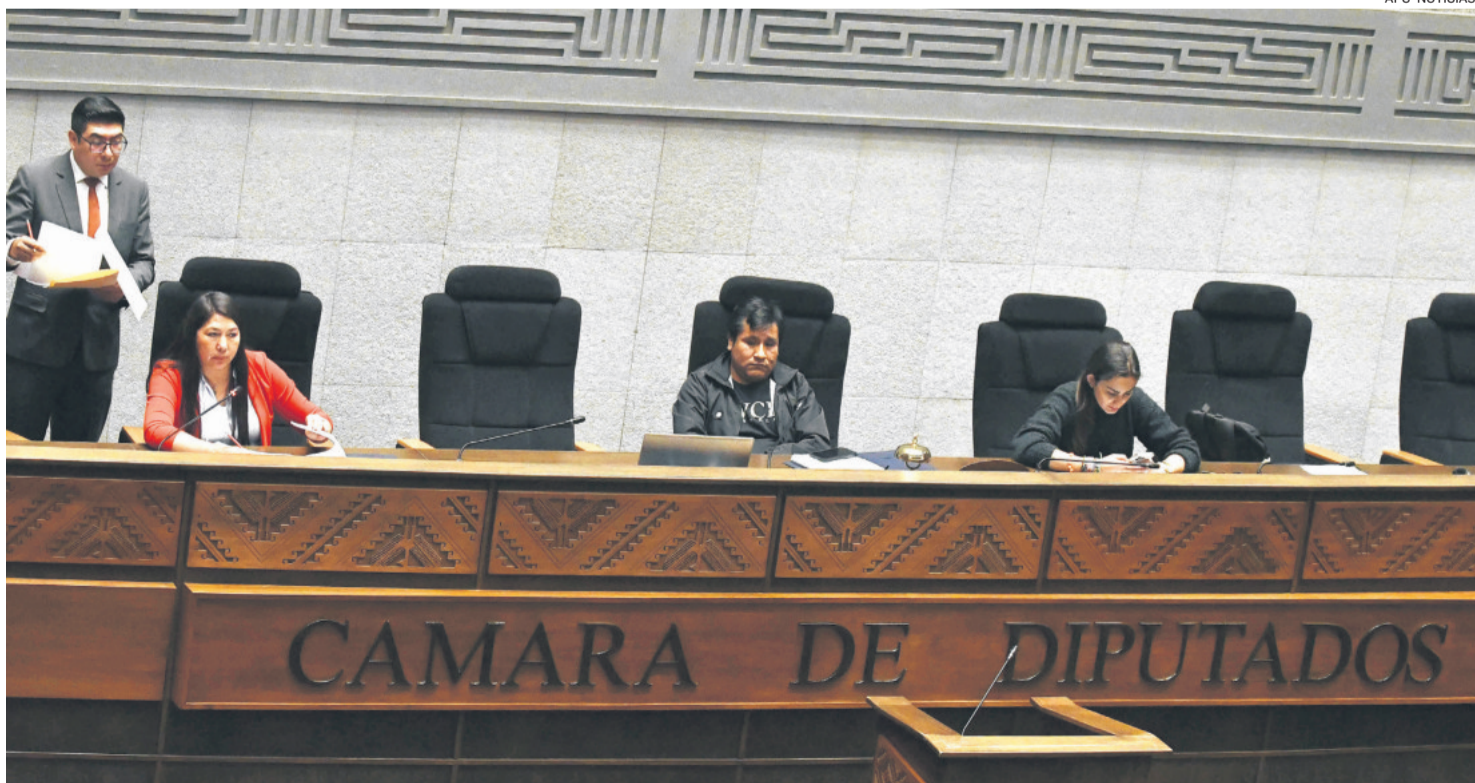
La testera del hemiciclo de la Cámara de Diputados donde este lunes sesionarán ambas cámaras legislativas.

Rek hizo votos para que exista consenso y se pueda elegir a la persona menos cuestionada y capaz de generar consensos.