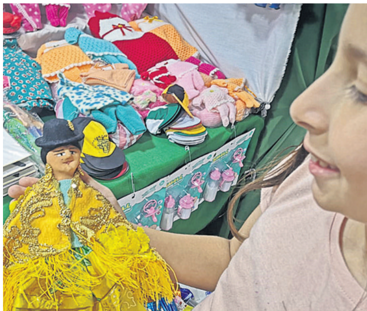
La pequeña admira una cholíta de trapo, a la venta en Bs 20

Las figuras recurrentes son el ekeko (dios de la abundancia) y el sapo