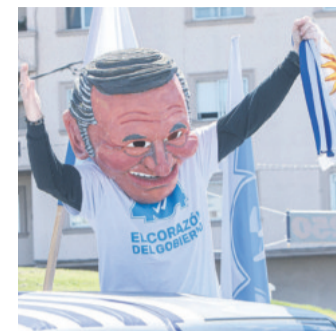
El proselitismo en las calles

Según la agencia, Oscar se desplaza con vientos máximos sostenidos de unos 130 kilómetros por hora.