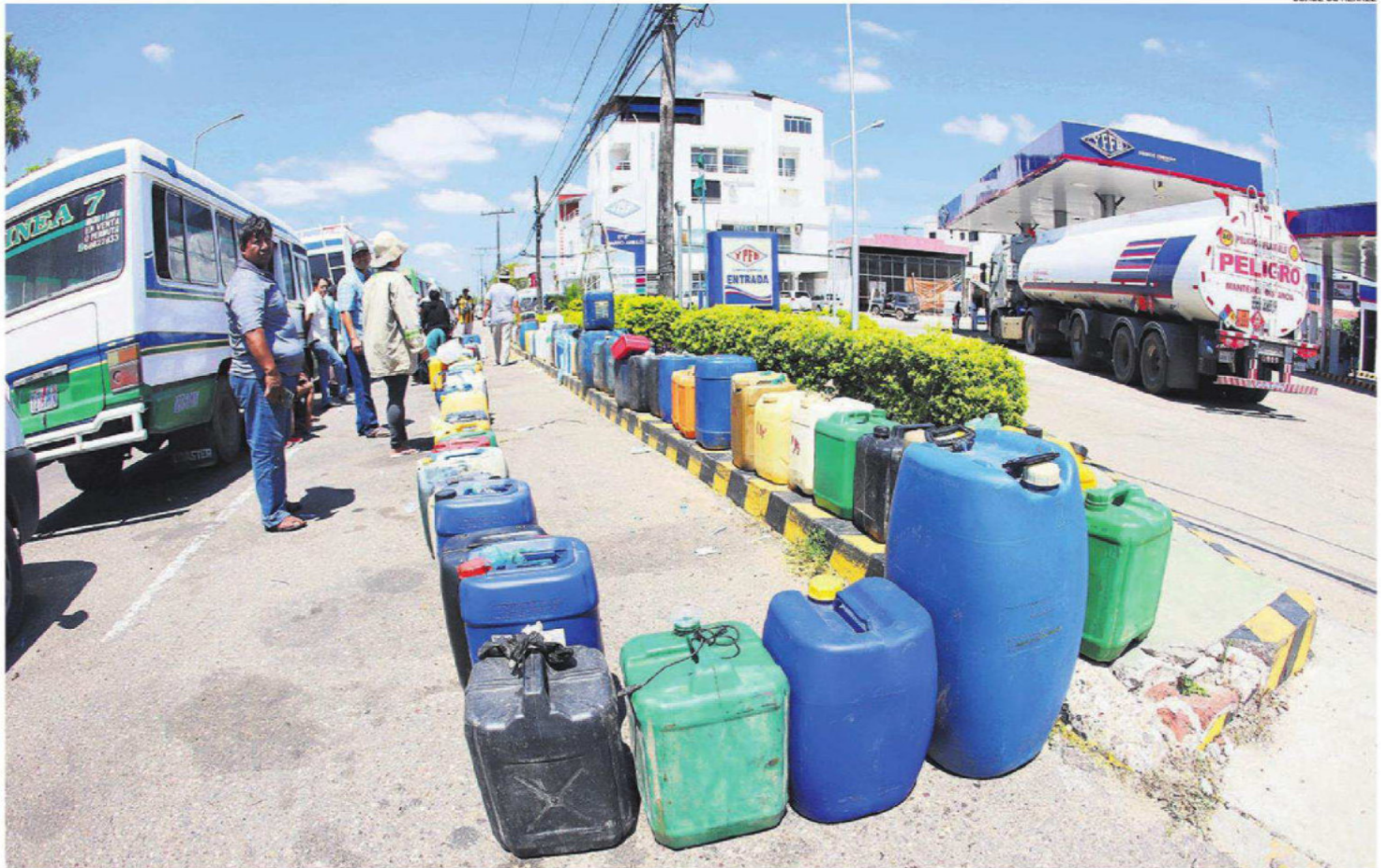
BIDONES Y COLAS. Decenas de personas y vehículos llegaron a los surtidores en busca de carburantes, mientras la estatal YFPB hacía gestiones para poder vencer los bloqueos