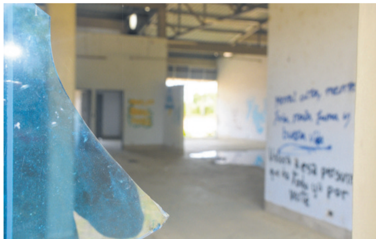
Por dentro los malvivientes pintarrajearon las paredes del aeropuerto.

Gobernación de La Paz”, dijo la exautoridad.