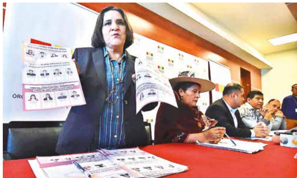
Un vocal del TSE muestra las papeletas electorales que se usarán el 1 de diciembre.