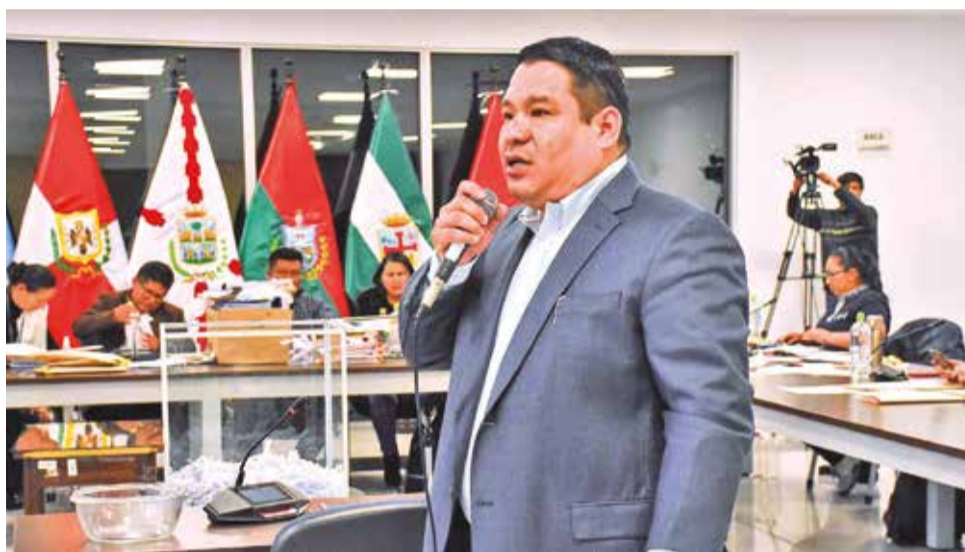
Proceso de evaluación oral de los postulantes a Fiscal General. APG

Precisó que, de los 33 postulantes, 25 son varones. Remarcó que, durante las 13 etapas de este proceso de selección y designación, se trabajó en "aras de la transparencia" y en cumplimiento de la Ley 1579 y la Constitución.