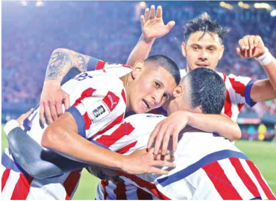
Jugadores de Paraguay celebran la victoria sobre Venezuela, ayer. SPF

El defensa de la Real Sociedad supo capitalizar la oportunidad con un tiro desde media distancia que puso en ventajosa