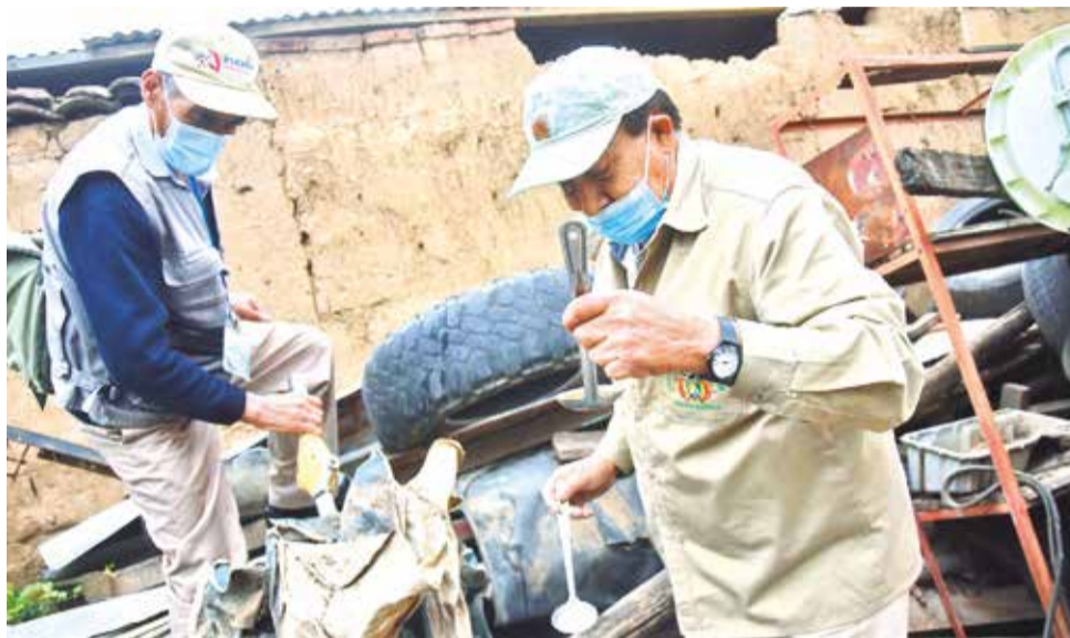
La destrucción de criaderos del mosquito Aedes aegypti en la ciudad. DANIEL JAMES

“A partir de la próxima semana con la dirección del Sedes vamos a hacer lanzamiento oficial con un nuevo eslogan para que la gente se apropie y sean partícipes de que queremos reducir el riesgo de enfermar y morir por dengue”, aseveró.