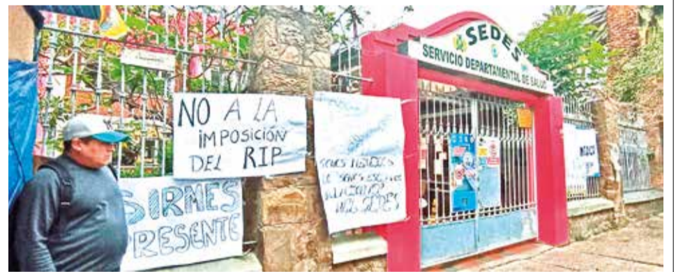
Los carteles de la protesta en puertas del edificio del Sedes, ayer.

Los Tiempos intentó sin éxito conocer la versión de la Alcaldía sobre el tema.