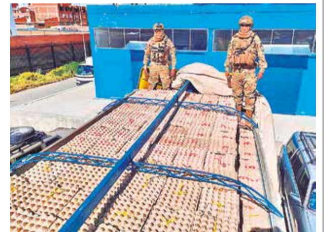
Huevos incautados por personal anticontrabando.

El viceministro Velásquez señaló que los operativos, que forman parte de una estrategia continua del Gobierno para combatir el contrabando, se llevan a cabo las 24 horas del día y los siete días de la semana en las fronteras del país.