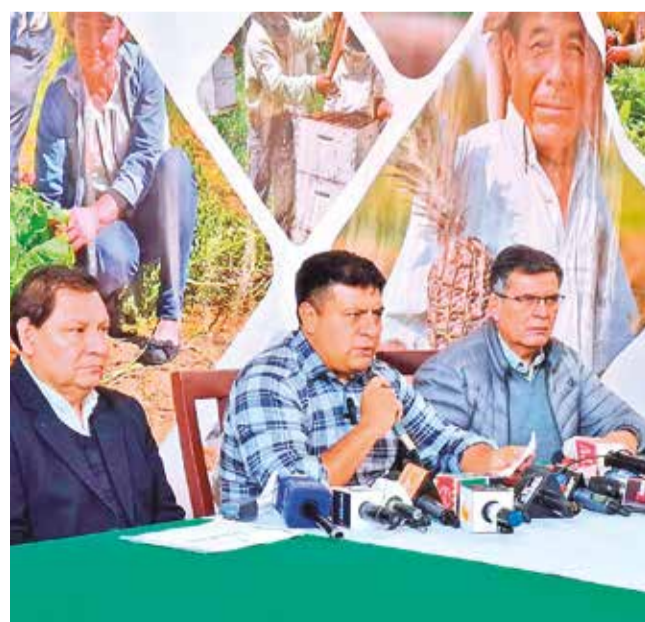
El ministro Yamil Flores, en rueda de prensa, ayer. S.MENDOZA

El consenso entre el sector privado y las autoridades parece ser la única vía para detener esta crisis. Demeure subrayó la importancia del diálogo para encontrar soluciones a los problemas estructurales de la economía boliviana. “Este año hemos vivido un número sin precedentes de bloqueos y conflictos sociales, lo que ha tenido un impacto directo en el aparato productivo. No podemos permitir que esta situación siga deteriorando la economía”, concluyó.