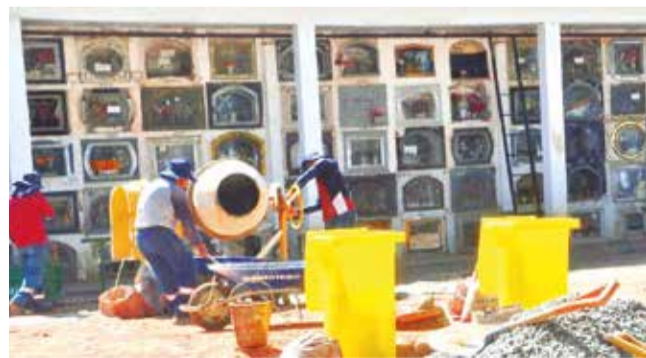
Los trabajos en el Cementerio de Cochabamba. H. ANDIA

Escenificación. Estudiantes de Turismo mostrarán a los visitantes los sitios y personajes notables del camposanto