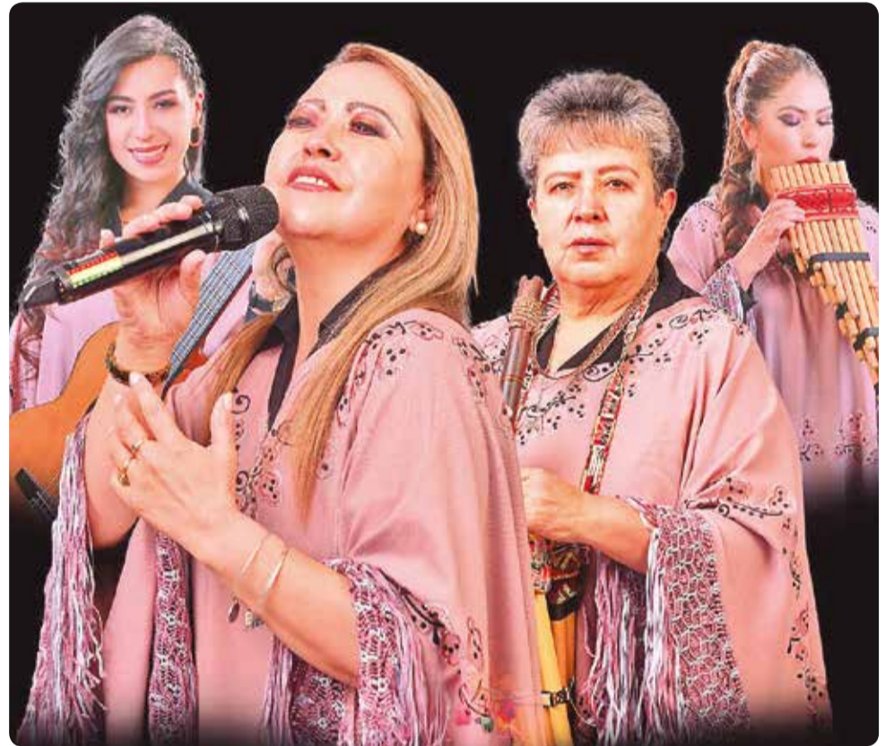
Integrantes del Grupo Femenino Bolivia.

En 2018, editaron "Ayer, hoy mañana y siempre", una producción con 12 canciones que