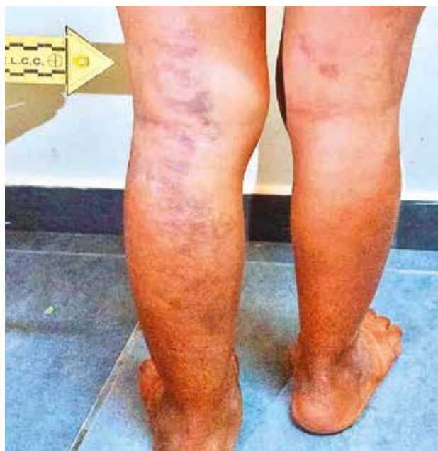
Algunas de las heridas que presenta la niña. POL. BOLIVIANA

La víctima recibió golpes en los pies, fue flagelada con