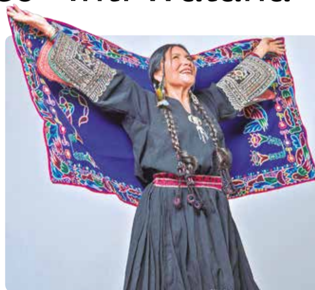
La cantante Luzmila Carpio.

El álbum, lanzado el 21 de septiembre de 2023 en formato digital y vinilo, destaca por su apuesta tecnológica.