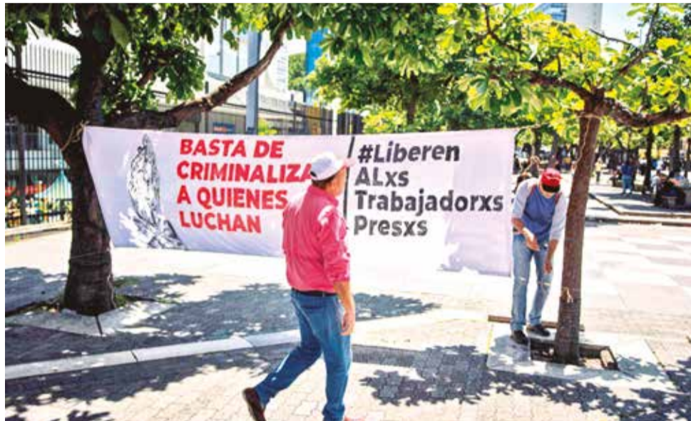
Una persona instala una pancarta durante una manifestación para exigir libertad a sus familiares detenidos, en Caracas, Venezuela.

El informe de la Misión confirma la conclusión de que algunas de las graves violaciones de derechos humanos investigadas durante este período fueron cometidas siguiendo la misma línea de conducta previamente calificada por la Misión como crímenes de lesa humanidad. Además, dichas violaciones, cometidas con una intención discriminatoria, constituyen el crimen de lesa humanidad de persecución por motivos políticos