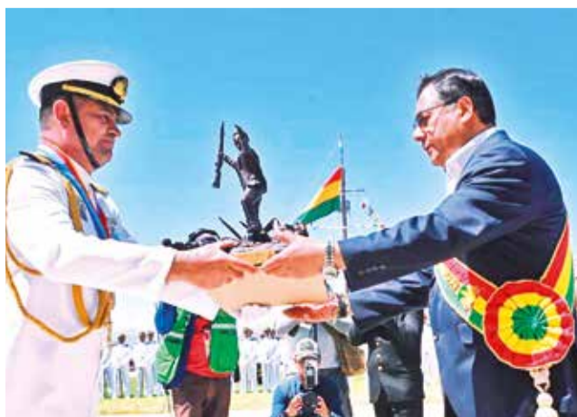
El presidente del Estado, Luis Arce Catacora.

“La historia nos enseña la importancia de seguir el ejemplo de líderes patriotas que privilegiaron los intereses de nuestro pueblo antes que cualquier interés personal o de grupo”, destacó y planteó una formación militar for-