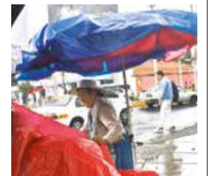
La lluvia en el centro de la ciudad ayer.