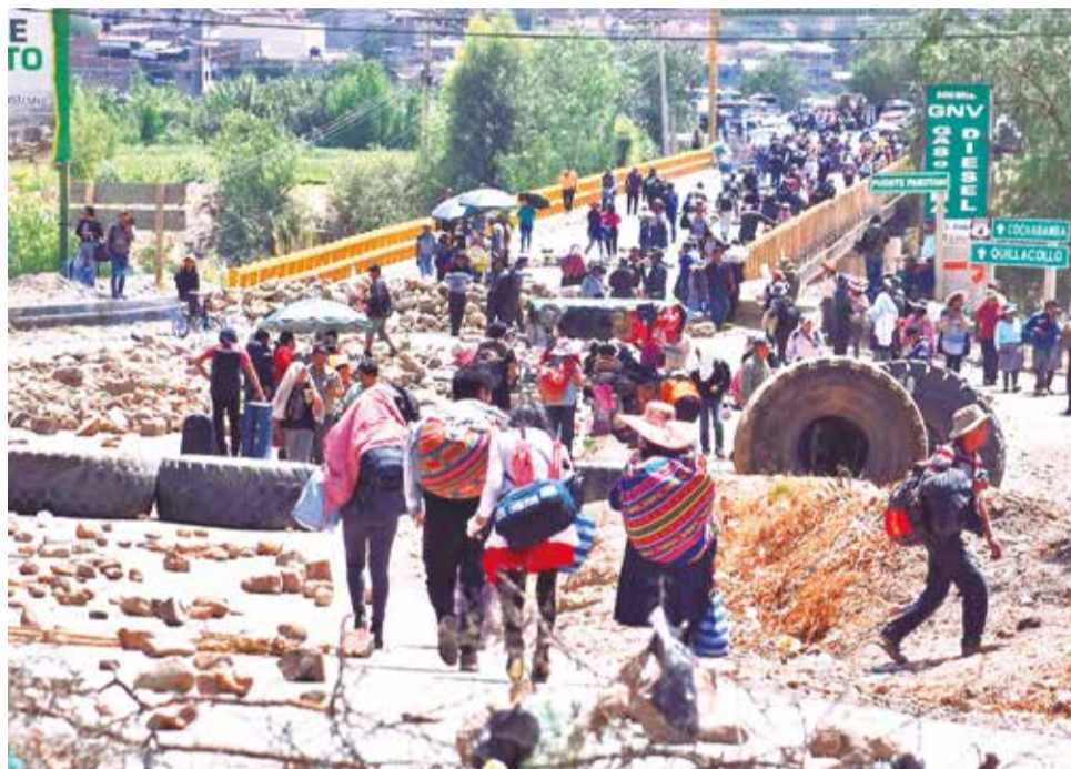
Uno de los puntos de bloqueo en la carretera Cochabamba-La Paz, ayer.