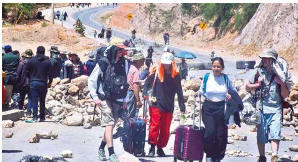
Los seguidores del expresidente Evo Morales bloquean el puente de Parotani.

Entre las demandas del pliego de 18 puntos de los evistas figuran la estabilización de los precios de la canasta familiar, el respeto a la democracia y a la Constitución, solución a la escasez de combustible y dólares en el país, además del reconocimiento del ampliado del MAS en Lauca Ñ, donde se eligió a Morales como candidato presidencial. Piden además el cese de la “persecución judicial y el abuso de poder” y la inmediata liberación de los “compañeros injustamente detenidos”.