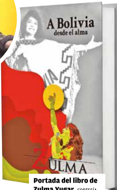
Portada del libro de Zulma Yugar. CORTESÍA

El libro presenta una mezcla de memorias