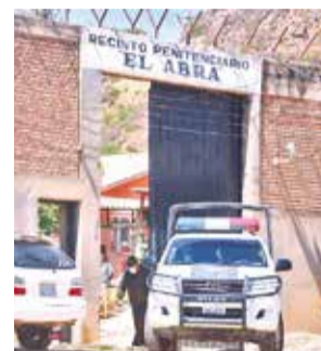
La Fachada de la cárcel de El Abra. DANIEL JAMES

Por otra parte, Tejerina confirmó la existencia de un