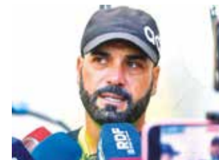
El estratega brasileño Thiago Leitao.

Leitao ocupará el lugar del colombiano Jaime de