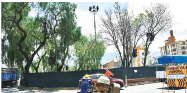
Los árboles de la rotonda Perú y Blanco Galindo.

Avance. Los trabajos del distribuidor tienen un 25% de avance físico. Los ambientalistas proponen hacer el traslado el próximo año