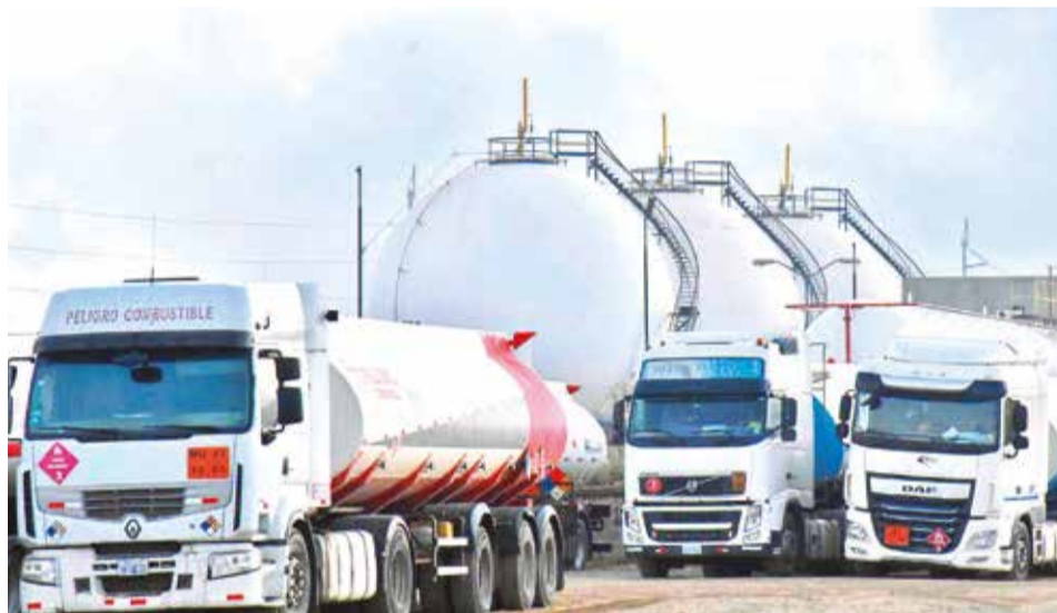
Un camión cisterna transporta combustibles a una planta de YPFB.

En segundo lugar, subrayó el impacto en el abastecimiento de combustibles. Si bien las estaciones cuentan con sufi-