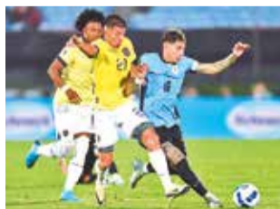
Duelo entre Uruguay y Venezuela, ayer. FUTBOL ECUADOR

En el estadio Centenario de Montevideo, la Celeste alargó su divorcio con el triunfo