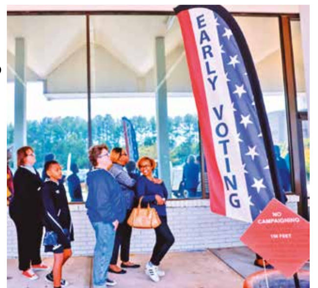
Personas esperan en fila para emitir su voto durante el primer día de votación anticipada en Georgia, EEUU.

La importancia de Georgia ha llevado a ambos candidatos a intensificar sus esfuerzos en esta crucial etapa.