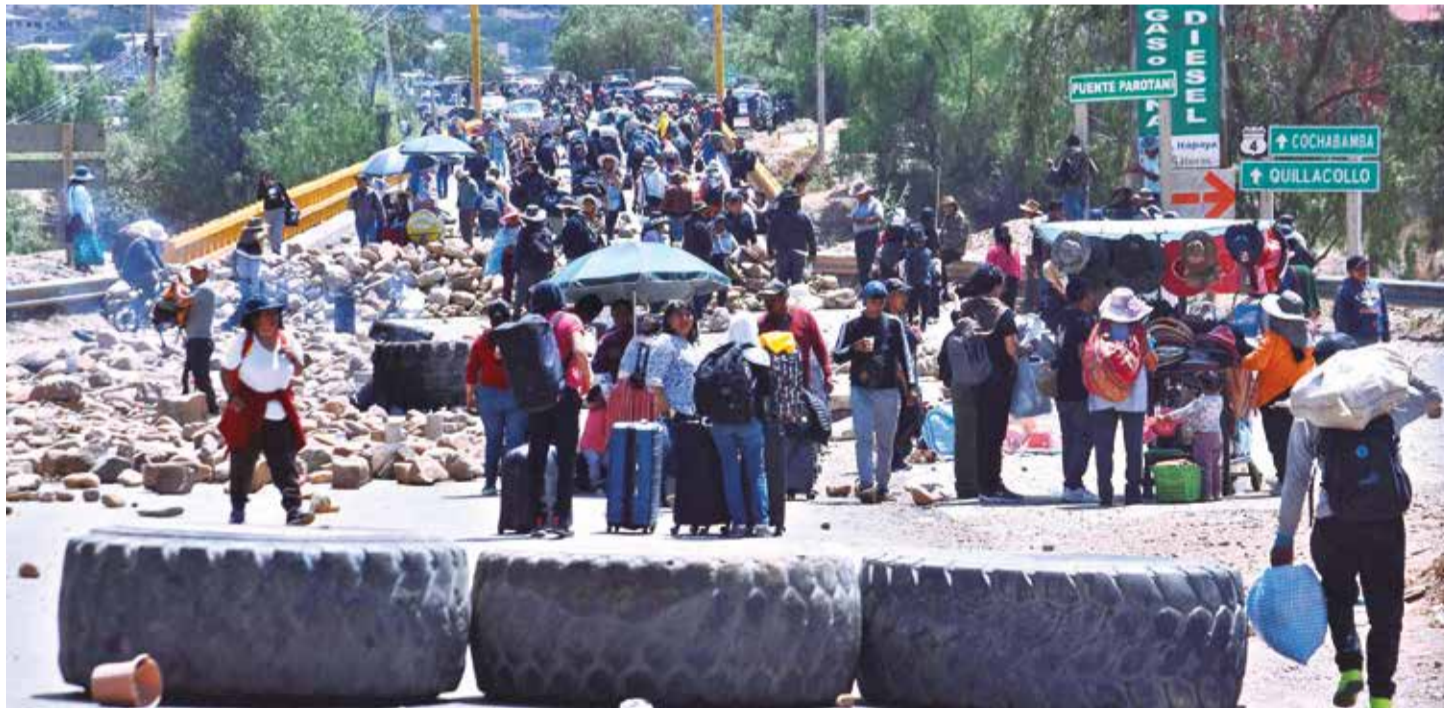
Las barricadas de piedras dejadas por los bloqueadores del ala evista impiden el paso a occidente, en Parotani, ayer.

Combustible. YPFB advirtió que el cierre de vías pone en riesgo el suministro de diésel y gasolina. La ANH reforzó el control de despachos de cisternas. Págs. 3, 6 y 7