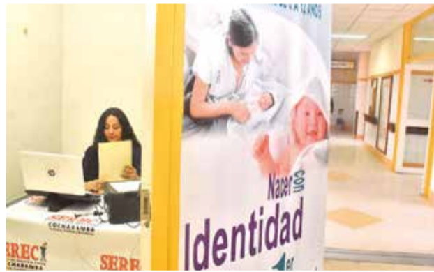
Oficina del Sereci en el materno Germán Urquidí.