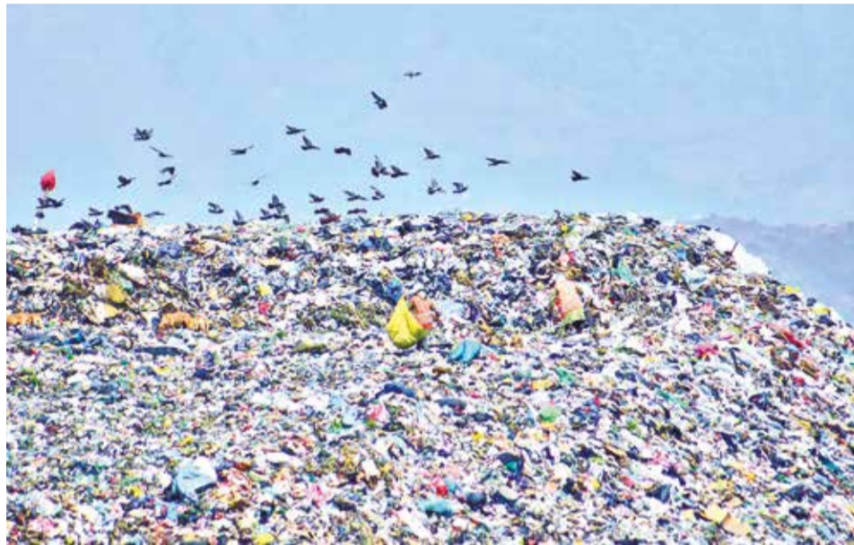
La disposición de los residuos sólidos en el relleno sanitario de K'ara K'ara.

Entre tanto, los pobladores solicitaron ayer una reu-