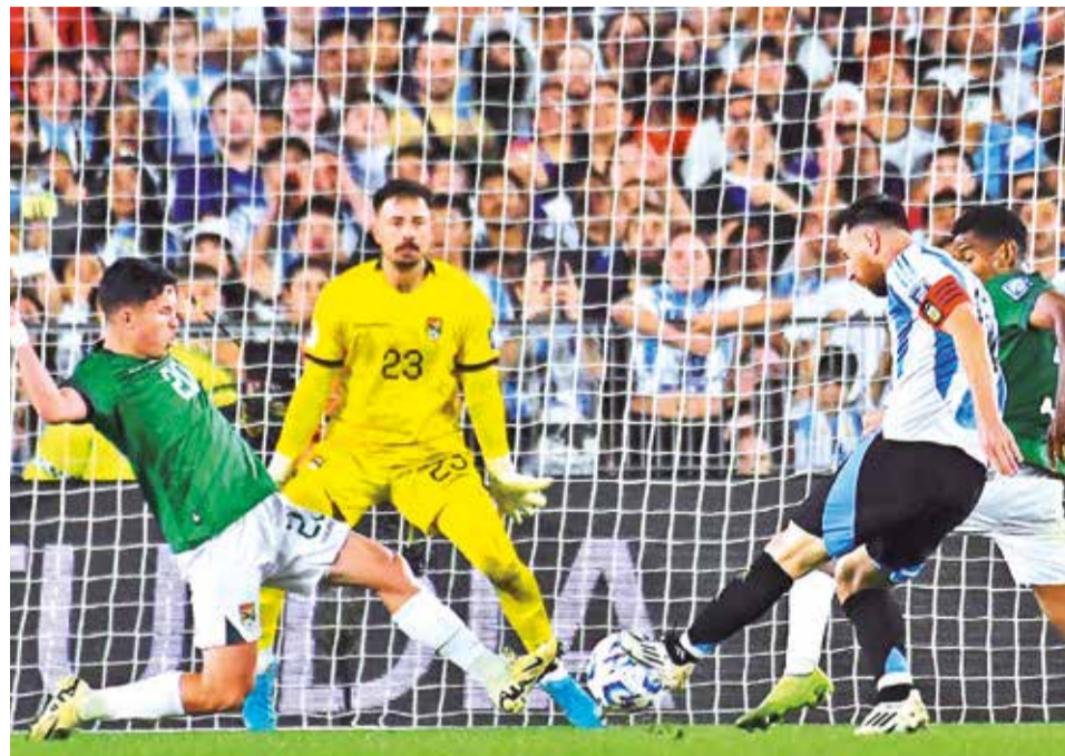
Lionel Messi (der.), de Argentina, anota el sexto gol de la Albiceleste.