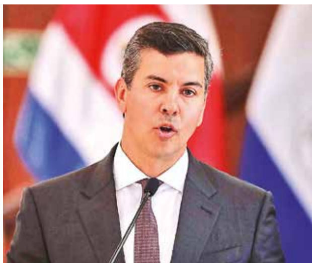
El presidente de Paraguay, Santiago Peña, inaugurará el 17 de octubre la 80 Asamblea de la SIP.

presente, periodismo del futuro”, reconocidos editores como Marty Baron, exdirector de The Washington Post, compartirán sus perspectivas, incluyendo un análisis de las elecciones presidenciales en Estados Unidos.