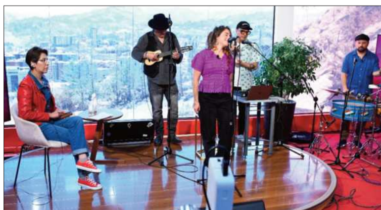
MÚSICA. Radio Cutipa, en Piedra, Papel y Tinta de La Razón.

En Piedra, Papel y Tinta , de La Razón , la Imilla Kózmika invitó a la población paceña a asistir al Nuna Fest 2024 para presenciar el