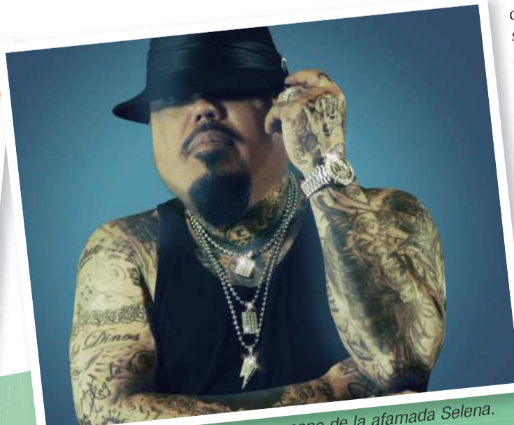
COMPOSITOR. El músico es hermano de la afamada Seelena.