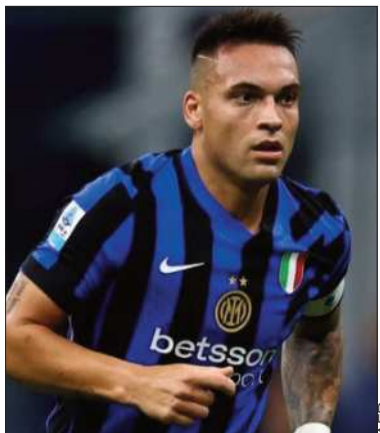
Lautaro Martínez, de Inter.

El sábado se disputará el partido Juventus y Lazio, tercero contra cuarto clasificado, ambos con 13 puntos en la clasificación, aunque el 'bianconeri' sigue invicto.