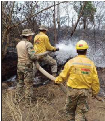
El 90% de quemas sofocadas.

Según el Presidente, las quemas fueron sofocadas con dos planes aplicados