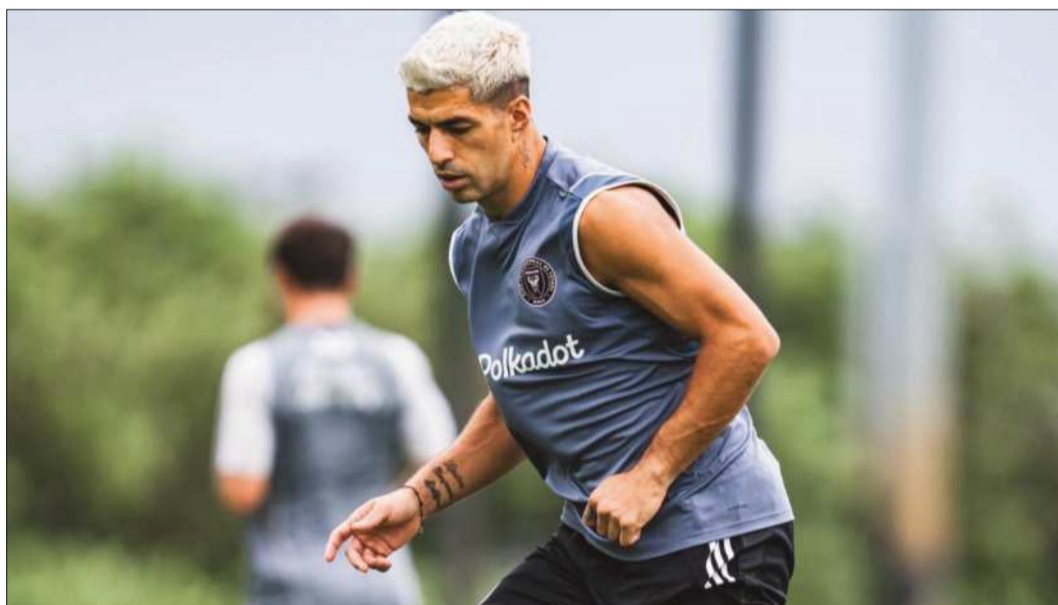
HISTÓRICO. El delantero uruguayo Luis Suárez durante una de las prácticas del Inter de Miami.