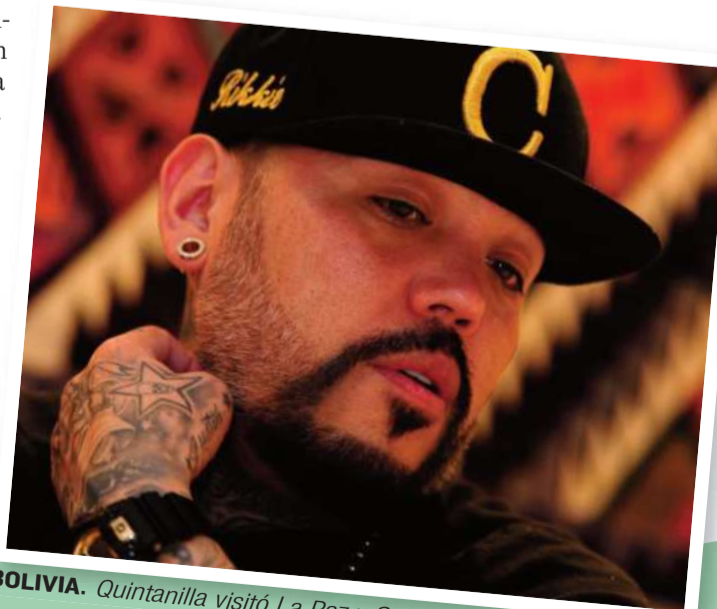
BOLIVIA. Quintanilla visitó La Paz y Santa Cruz en septiembre.

Dado que se realizó un primer pago de 100.000 bolivianos de los 200.000 que exigía el grupo musical para una presentación de apenas seis canciones en la ciudad de Potosí.