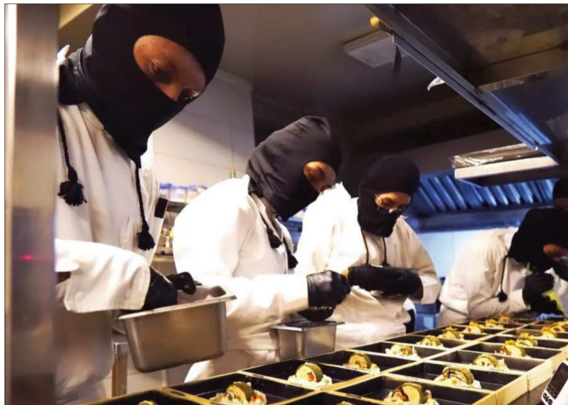
GASTRONOMÍA. El colectivo de chefs de Sabor Clandestino trabaja de forma autogestionada desde 2014.

res, y más. Promueven una cocina basada en productos regionales y tradicionales, integrando el mestizaje cultural de Bolivia.