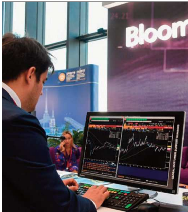
INFORME. Bloomberg afirma que bonos llegaron a su nivel más alto.

Según el informe, los bonos continuaron aumentando, con los de vencimiento en 2028 y 2030 subiendo 0,2 centavos más. En el transcurso del mes, los bonos ganaron en total 8 centavos, reflejando una mejora en la percepción del riesgo.