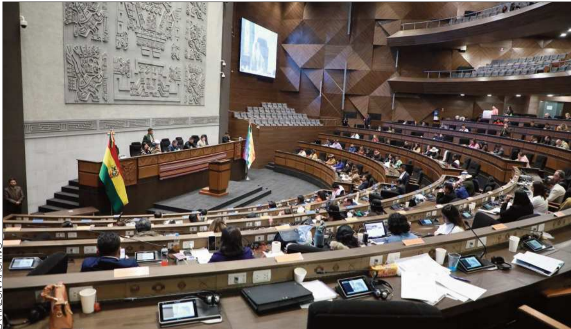
ASAMBLEA. El pleno del Órgano Legislativo elegirá el lunes al nuevo Fiscal General del Estado.