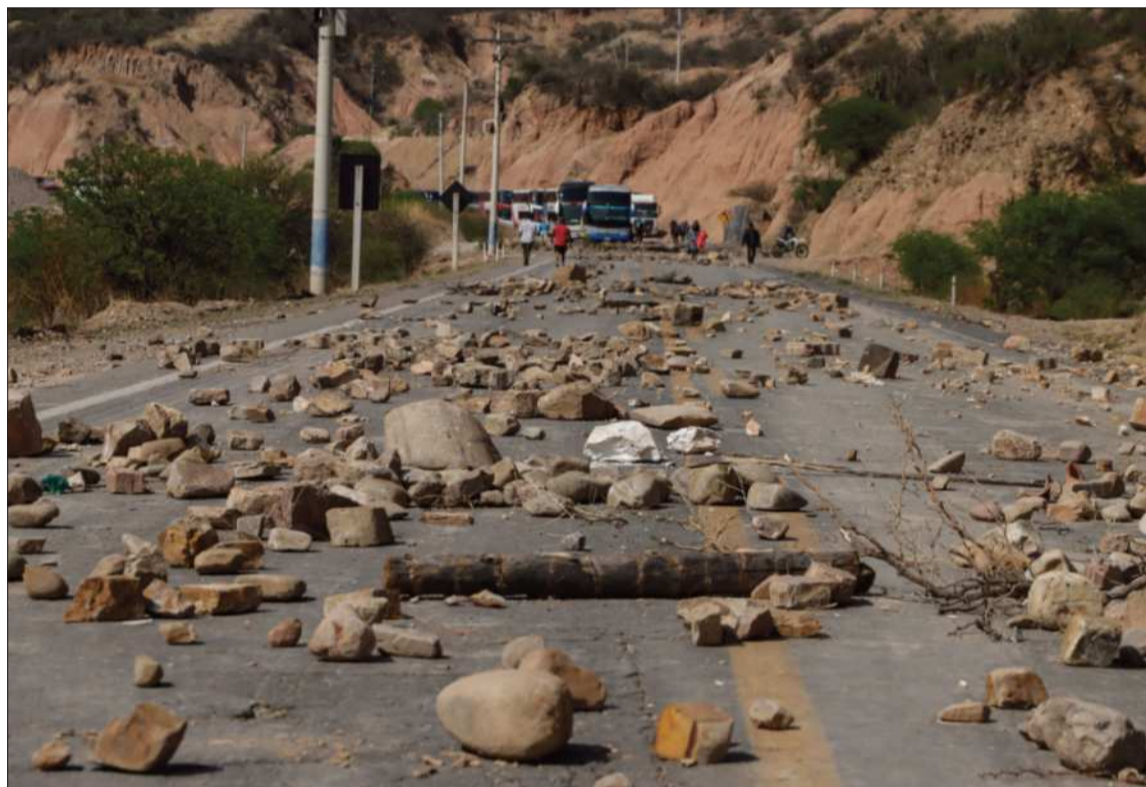
PRESIÓN. Los bloqueos son instalados por la facción evista del Movimiento Al Socialismo (MAS).

Las medidas de presión del sector evista se radicalizaron, llegando a registrarse ayer hasta 14 pun-