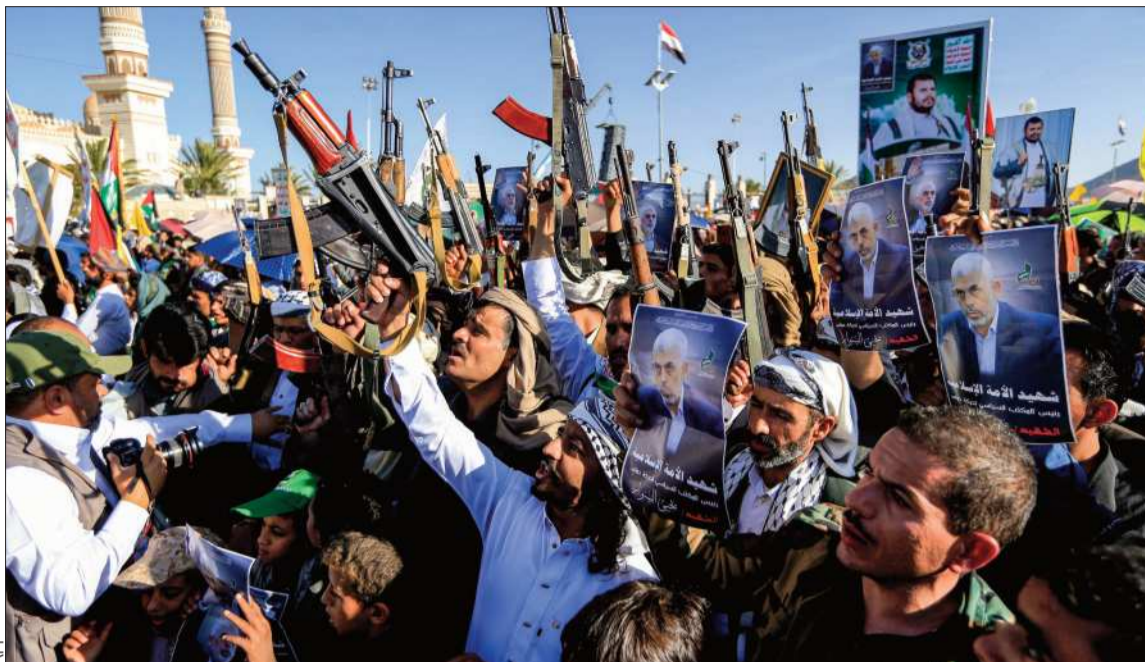
PROTESTAS. Una manifestación islamista por la muerte de Yahya Sinwar, jefe de Hamás.