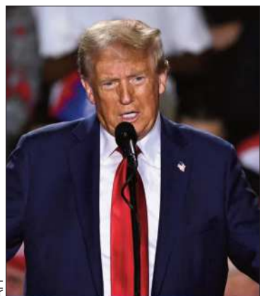
Donald Trump, expresidente.

MUNDO. Una magistrada rechazó la solicitud para mantenerlas en secreto