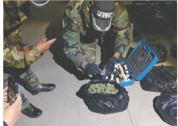
Prueba de narcotest dio positivo para marihuana

Dentro del motorizado encontraron 63 bolsas de nylon negro que, al pesarse, dieron un peso total de 62 kilos con 250 gramos de marihuana, además de la incautación del motorizado.