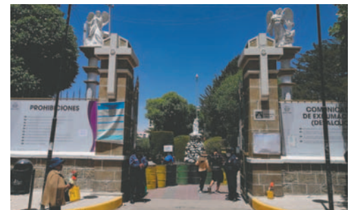
Cementerio General recibirá la visita masiva de personas en Todos Santos

Por otro lado, la administración del camposanto pidió que aquellas personas que adeudan por concepto de las conservaciones acudan a las oficinas para realizar la cancelación correspondiente, ya que las notificaciones se llevarán a cabo en estos días.