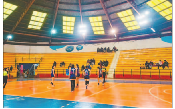
Buena victoria de CAN en el coliseo 10 de Noviembre de Potosí

CAN sumó su segundo triunfo, contabilizando cinco puntos en su haber y estando a la par del Club Tenis La Paz, que ayer jugó en su reducto ante Ingavi de Llallagua, con un resultado a favor de las actuales campeonas por 98 a 64, con parciales de 24-14, 32-10, 21-14 y 21-26. Las pacañas son líderes con cinco puntos pero con una mejor diferencia de aros.