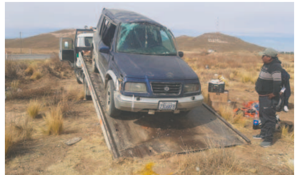
Vehículo sufrió daños de consideración