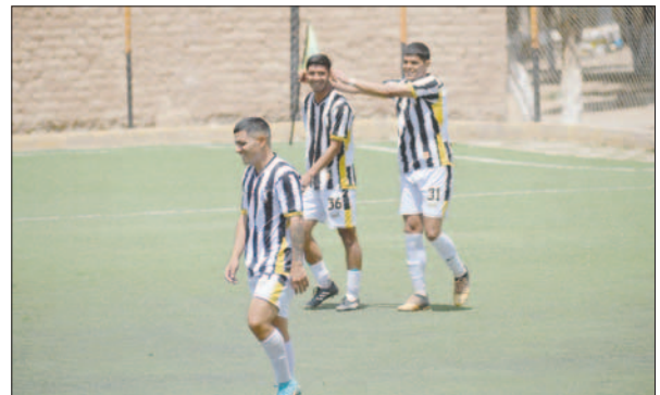
El decano con una victoria cómoda sobre Sportivo Equeño