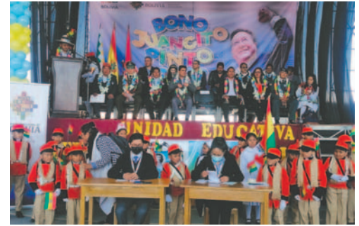
En Oruro, el acto de inicio del pago del bono será en la Unidad Educativa El Paraíso

Con la finalidad de evitar las largas filas durante la entrega del bono, para las ciudades capitales de los nueve departamentos