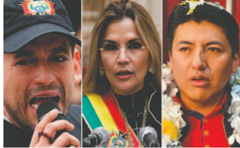
Luis Fernando Camacho, Jeanine Añez y Marco Pumari

El jurista también hizo hincapié en que Lidia Patty, quien en los últimos