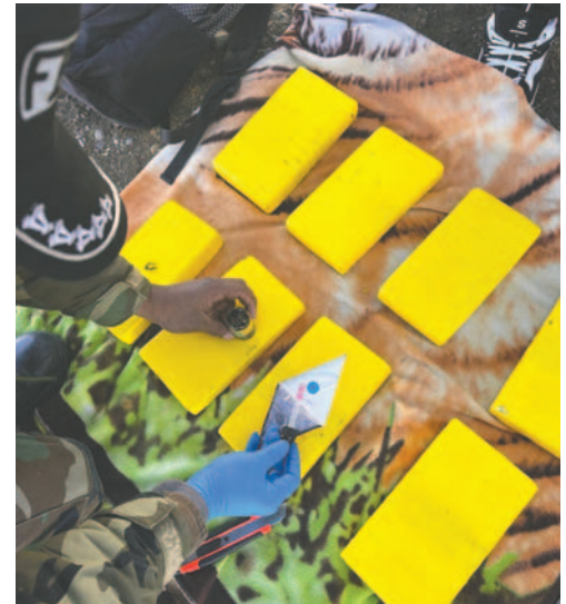
La prueba de narcotest dio positivo para clorhidrato de cocaína