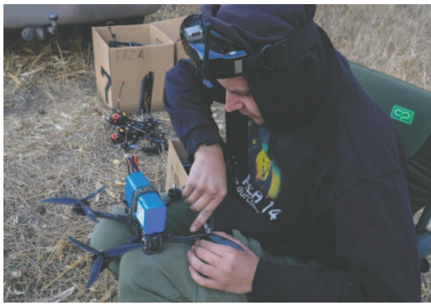
Especialistas ucranianos montan pequeños drones en Járkov este sábado 12 de octubre

Esta entidad de la Federación de Rusia sufre casi a diario ataques de drones y bombardeos de artillería desde Ucrania, lo que