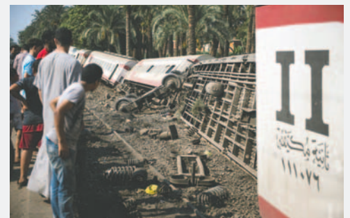
Imagen de archivo de un tren egipcio accidentado

El nuevo accidente se produce pocas semanas después de que cinco per-