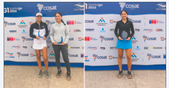
La tenista boliviana campeona en Dobles y Singles

"Una excelente semana en Santiago (Chile) torneo Grado-1 Cosat 16 años muy contenta de mi desempeño cada vez me siento mejor en busca de mis objetivos y siempre agradecer a los que hacen posible y me ayudan", escribió la joven tenista en sus redes sociales.