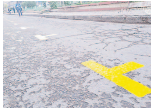
Demarcación de puestos de venta para las ferias de la temporada en la Montesinos