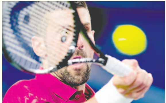
Novak Djokovic perdió el domingo contra el italiano Jannik Sinner

Sinner y Djokovic disputaron el domingo su octavo duelo. Hasta ahora, el serbio había ganado en cuatro ocasiones, por tres del italiano, que consigue igualarle por fin.