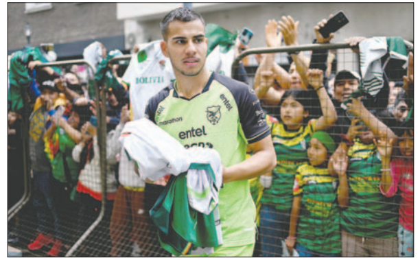
Los jugadores de la Verde fueron ovacionados por los bolivianos en Buenos Aires

por la campaña del "equipo de todos", que a la conclusión de la rueda de ida está sexto, con 12 puntos, en la zona de clasificación, con un boleto directo. Sin embargo, los jugadores y el cuerpo técnico saben que apenas llegaron a la mitad del camino, porque restan nueve compromisos, comenzando las revanchas como visitantes.