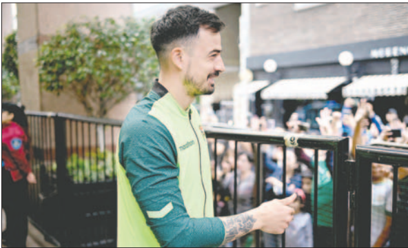
Guillermo Viscarra arquero de la selección boliviana