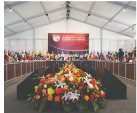
Archivo XI Conferencia de Ministros de Defensa de las Américas (CMDA) que se celebró en años anteriores en Arequipa

También se abordarán temas de suma preocupación global, como la guerra entre Rusia y Ucrania, los enfrentamientos con Hamás y Hizbulá en la Franja de Gaza y Líbano por parte de Israel, y la creciente tensión de este último con Irán, un