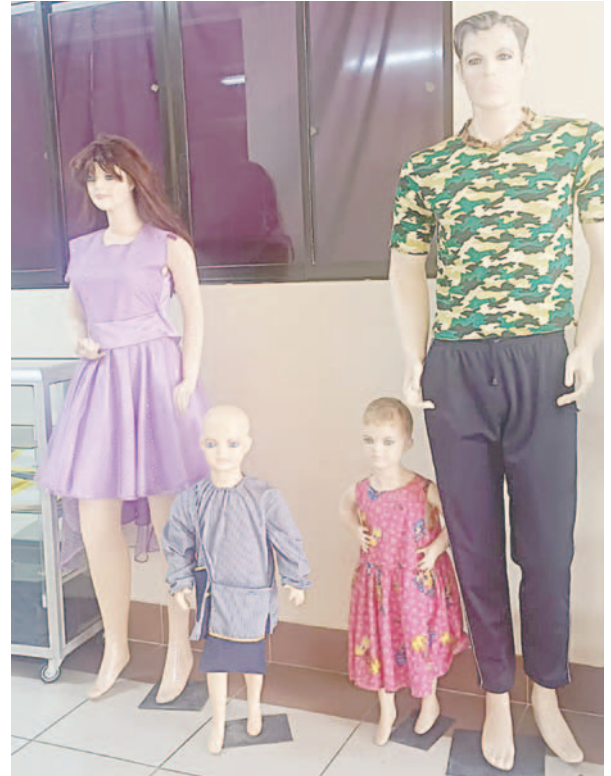
Prendas de vestir confeccionadas por estudiantes del área Técnica Tecnológica Productiva /LA PATRIA

Este modelo hace referencia a dos lenguas y dos culturas: la persona sorda primero debe desarrollar la lengua de señas boliviana y la lengua castellana escrita para poder comunicarse