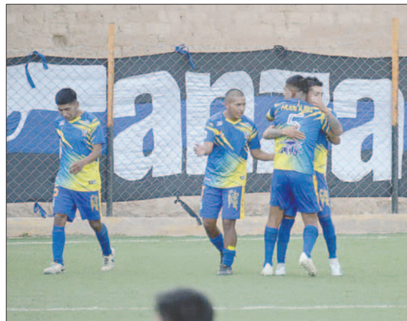
EM Huanuni fue efectivo al momento de marcar los goles