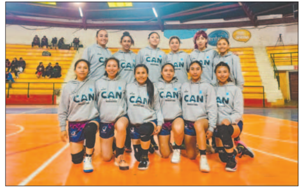
El cuadro orureño con el triunfo en Potosí, comparte el primer lugar de la tabla