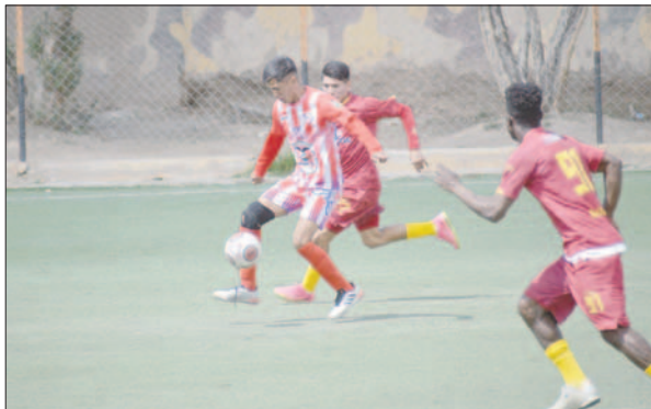
Corque FC se queda peligrosamente en zona de descenso