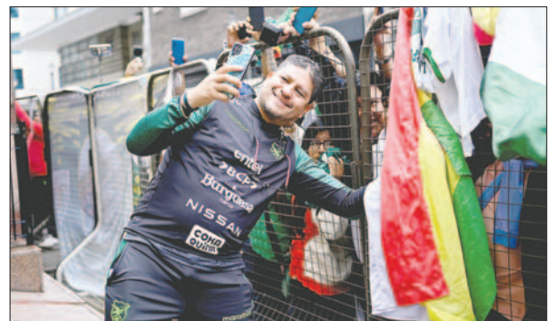
Mucha gente le pidió una selfie al seleccionador Óscar Villegas