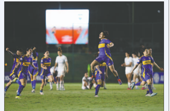
Boca Juniors apeló a los penales para clasificar a semifinales