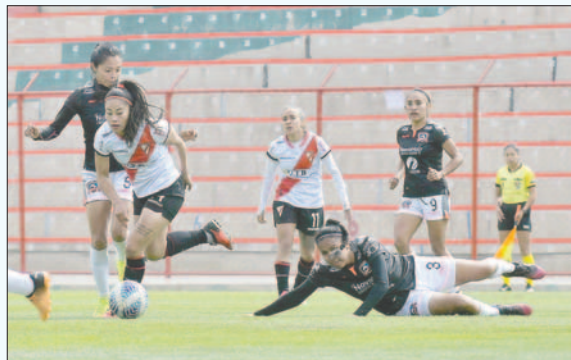
Los equipos de Always Ready y Astor aportan con tres jugadoras cada club a la selección boliviana