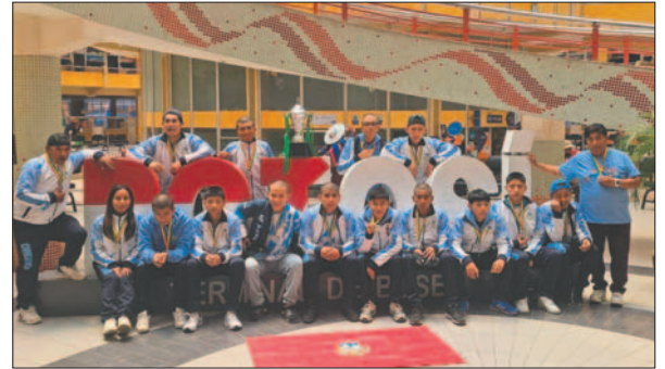
La selección orureña tuvo que pasar varias dificultades en su estadía en Potosí

Los dirigentes de las asociaciones municipal y departamental del futsal orureño rechazaron esta resolución, señalando que la misma tiene varias observaciones y que no se habría procedido según normativa, por lo que ya se hizo la apela-