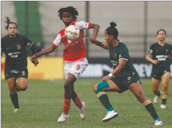
Independiente Santa Fe se metió también en semifinales tras vencer a Alianza Lima