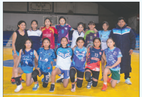
El seleccionado orureño retomó sus entrenamientos de cara a la Copa Bolivia

El cuadro orureño tiene un buen proceso en esta categoría, ya que la mayoría de las jugadoras son las mismas que en la temporada pasada lograron el primer lugar en una categoría inferior y ascendieron de división. Ahora, el propósito es el mismo: llegar al Nivel "A" y mejorar el juego de conjunto.