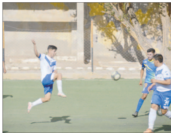
San José reaccionó un poco tarde y al final terminó perdiendo el partido