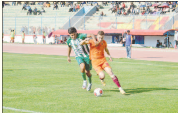
CDT Real Oruro que ganó 2-1 en la ida, visitará a Tiquipaya FC en el encuentro de vuelta

El otro punto negativo es que, a medida que pasan los días, los elencos van perdiendo ritmo futbolístico, algo que no se puede recuperar de la noche a la mañana. Por lo tanto, se espera que en estos días se pueda tener información más clara sobre la continuidad de la Copa "Simón Bolívar".