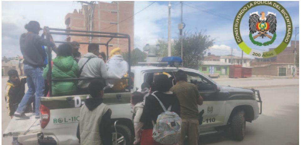
Extranjeros son trasladados a instalaciones de la Interpol en la zona Sur de Oruro

La acción fue parte de un operativo del "verde olivo", mediante el Comando Departamental de Policía Oruro, que busca garantizar la seguridad y el cumplimiento de las normativas migratorias en la región. La identificación y control de personas extranjeras es una medida que se ha intensificado en los últimos años debido al aumento del flujo migratorio en diversas zonas del país.