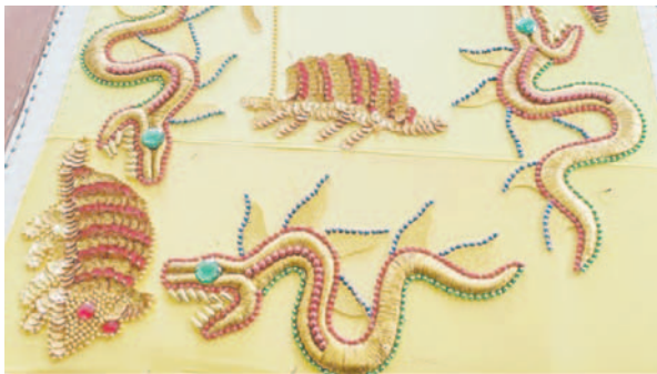
Trabajos de bordado realizado a mano

A medida que el tiempo avanza hacia una sociedad más inclusiva, es fundamental seguir apoyando a las personas con discapacidad auditiva mediante políticas públicas efectivas, educación accesible y programas que promuevan su integración en todos los ámbitos.