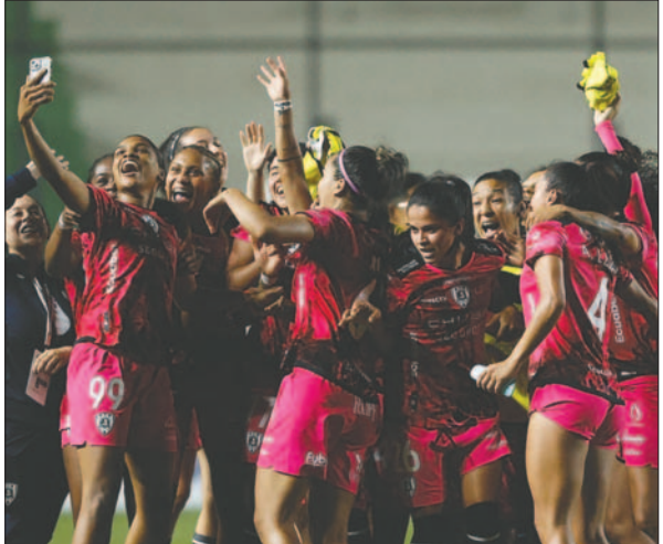
Celebran las jugadoras de Independiente del Valle por la clasificación a semifinales