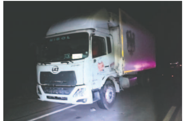
Presunta invasión de carril provocó el accidente de tránsito