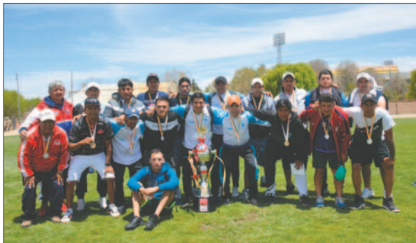
Meritorio segundo puesto para Municipal de Cochabamba

de Magisterio, que pudo sumar el punto necesario para ser inalcanzable en la tabla de posiciones quedarse con el título. Municipal de Cochabamba se quedó con un digno segundo puesto por todo el trabajo realizado a lo largo del torneo.