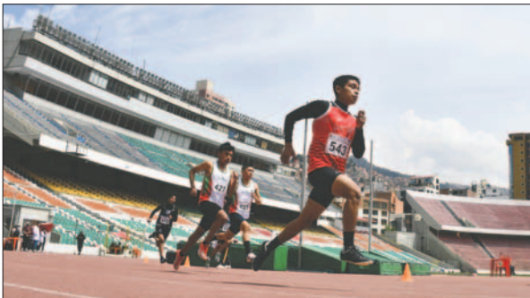
La prueba nacional se realizó con éxito en el estadio "Hernando Siles"

Luego de una evaluación a las marcas, de este torneo serán nominados los atletas que formarán el seleccionado boliviano, que participará en el Campeonato Sudamericano en San Luis (Argentina), a celebrarse en diciembre de este año.