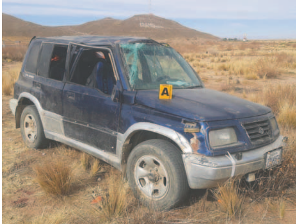
Vagoneta azul salió de la vía y sufrió un vuelco de tonel