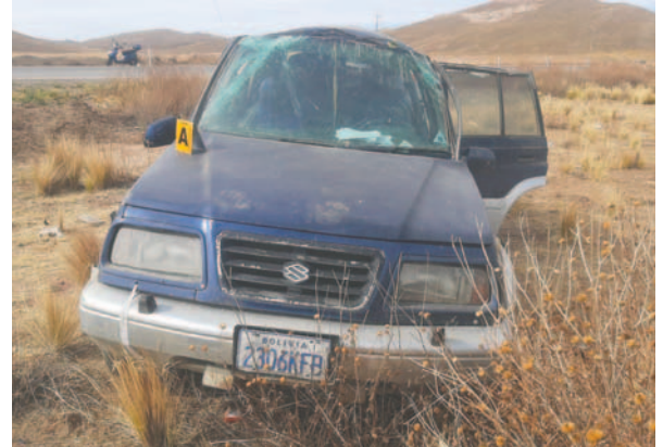
Debido al hecho de tránsito, cuatro personas resultaron lesionadas

Las personas heridas fueron auxiliadas por personal de la Dirección Departamental de Bomberos Calama y trasladadas al Hospital Oruro-Corea.