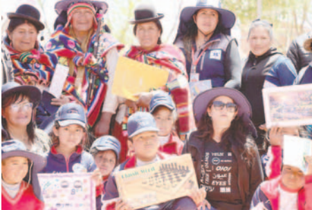
Toledo conmemoró el Día Mundial de la Visión