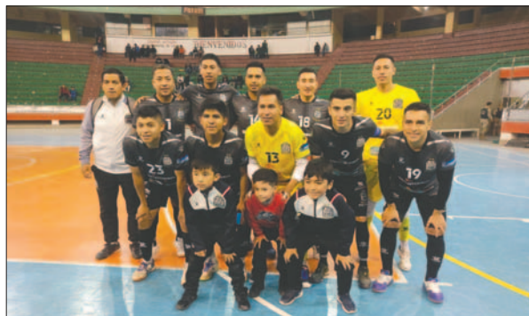
El equipo de Fantasmas Morales Moralitos que logró vencer en La Paz

Por el grupo "A" se jugaron los dos partidos que faltaban por la tercera jornada, mientras que en el "B" se disputaron los cuatro encuentros de la decimotercera fecha.