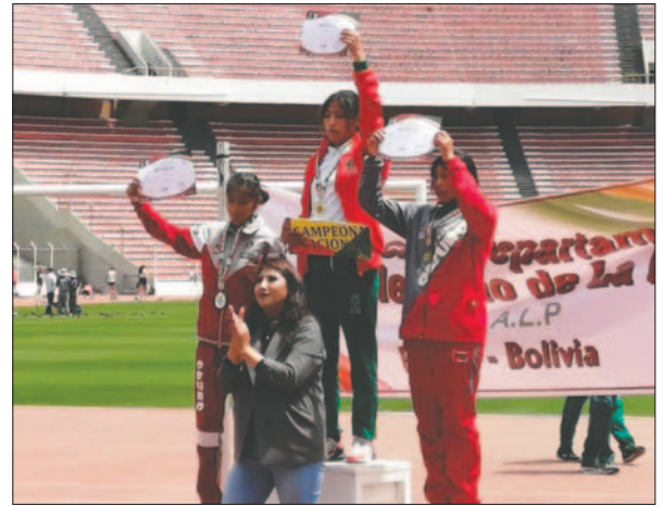
Dos orureñas en el podio femenino de los 3.000 metros

y el tercer puesto fue para Marioli Yujra de La Paz (05'49"80). En esta competencia también se tuvo la par-