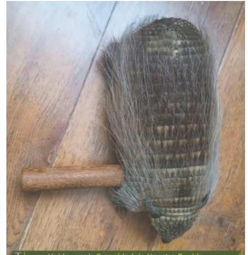
La Policía incautó el quirquincho durante la entrada del sábado precedente

La acción refleja un compromiso por parte de las autoridades para hacer cumplir las regulaciones ambientales. Se espera que estas medidas contribuyan a una mayor protección del medioambiente y promuevan prácticas culturales responsables entre los participantes en eventos públicos.