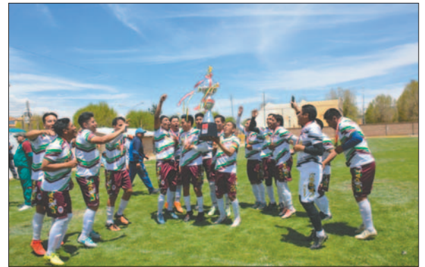
Magisterio celebró a lo grande la obtención del título /LA PATRIA

Al final, no se abrió la cuenta, quedando 0 a 0 y con ello la alegría