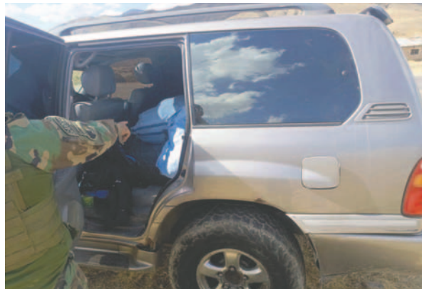
Agentes antidroga fueron atacados con arma de fuego por narcotraficantes en la carretera departamental

Según un boletín de prensa, en medio de controles antinarcóticos en la carretera Oruro-Potosí, a la altura del cruce Qaqachaca, identificaron un motorizado que, al notar la presencia policial, sus ocupantes decidieron efectuar maniobras de fuga para evadir a las fuerzas del orden.