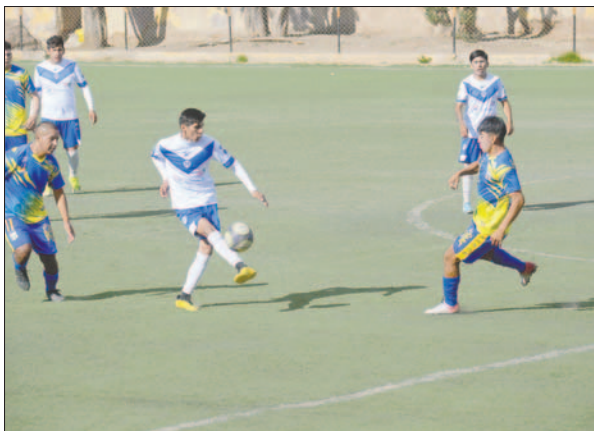
Los "santos" tuvieron la posibilidad de abrir la cuenta pero no tuvo efectividad

En el segundo tiempo, EM Huanuni tomó control del encuentro frente a un elenco de la "V" azul