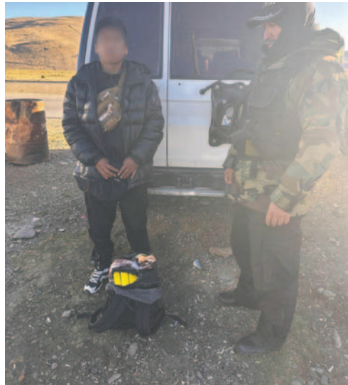
La intervención se efectuó en la carretera La Paz-Oruro

La incautación forma parte de una serie de operativos que buscan dismantelar redes dedicadas al tráfico de drogas. Las acciones del GIOE son fundamentales para reducir el impacto del narcotráfico en las comunidades locales y prevenir delitos asociados.