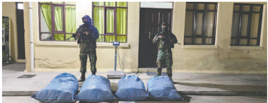
Incautaron 62 kilos con 250 gramos de sustancias controladas