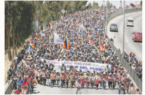
La “Marcha para salvar a Bolivia” reunió a más de 5.000 simpatizantes de Evo Morales