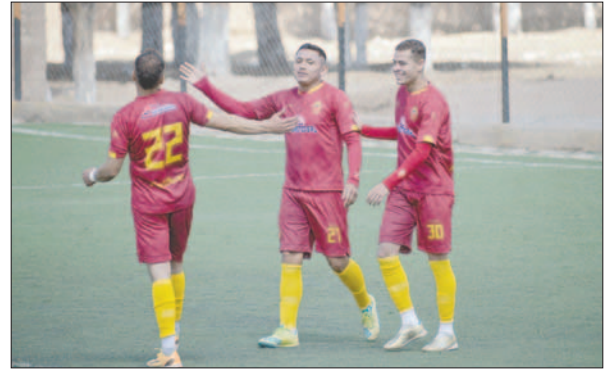
CDT Real Oruro con dominio pleno en el torneo de la Primera "A"

currián 2 minutos del agregado en el primer tiempo.