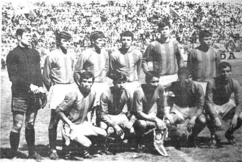
PARAGUAYOS: Jugadores del Cerro Porteño, del Paraguay, que esta noche enfrentarán al Deportivo Italia, de Venezuela en el partido de vuelta de la copa América. En la ida se registró empate, en Caracas.

Acerca del Deportivo Italia sostuvo que éste cuenta con una defensa fuerte con buen toque en medio campo con gran oficio en la ejecución del uno dos, pero adelante expuso solamente disparos de media distancia". Para la apreciación de ese periodista a Cerro Porteño "Le faltó personalidad y firmeza rindiendo por debajo de sus posibilidades", añadiendo finalmente, que el vice-campeón venezolano "estuvo más cerca del triunfo".