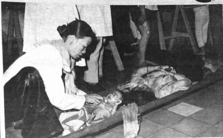
VIETNAM DEL SUR.— Destrucción y muerte sembraron los bombardeos con cohetes últimamente efectuados por tropas vietcong sobre poblaciones modestas cercanas a Saigón. En la fotografía puede apreciarse a una madre que llega a un puesto de auxilio llevando a su pequeño hijo. Al lado de una mujer herida espera turno para su atención.

Ahora, la Corte Suprema decidió que "la audiencia es un solo acto y de acuerdo con disposiciones legales es la justicia penal militar la que debe seguir conociendo por cuanto a términos que hayan empezado a correr".