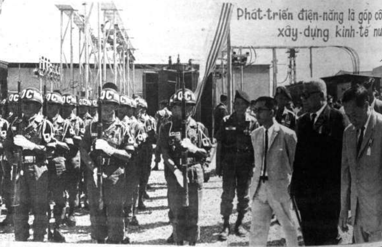
Acompañado del ministro de Obras Públicas, Luong The Siu y el director general Nguyen Trung Trinch, el primer ministro Huong (traje oscuro) visita la nueva planta eléctrica de Vung Tau, en Vietnam del Sur. Tiene tres generadores para cuadruplicar la energía de esa población.

Su propietario la puso en venta y recibió ofertas de Canadá, Alemania Oriental y Estados Unidos, decidiéndose finalmente por esta última.