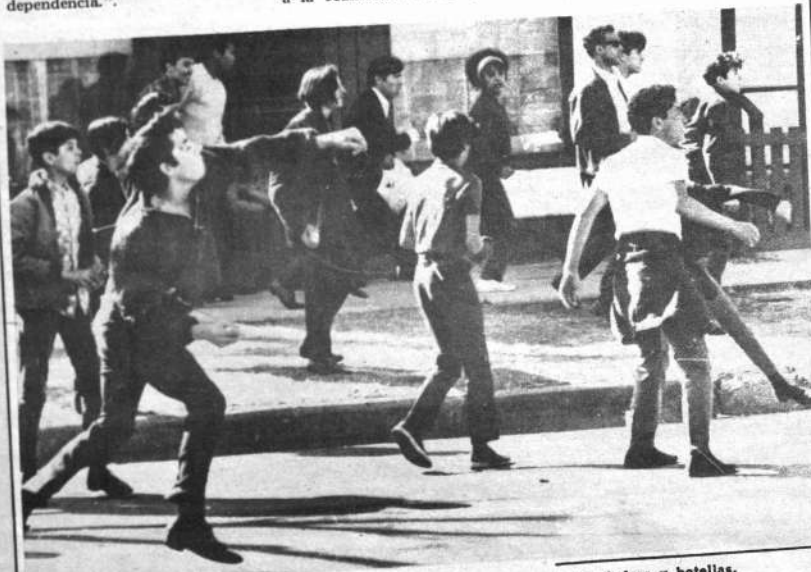
DENVER, Colo.— Estudiantes batallan con la policía arrojando piedras y botellas, durante el segundo día de demostraciones al este de Denver. Participaron alrededor de 700 personas en la manifestación. (AP Wirephoto).

La necesidad de abastecer de uranio al reactor de potencia que se está contruyendo en la localidad de Atucha, cercana a esta capital, ha llevado a la Comisión Nacional de Energía Atómica a incrementar los trabajos de prospección aérea y depósitos uraníferos.