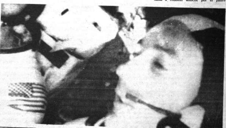
JAMES MCDIVITT, Comandante de Apolo 9, dijo que no habrá problema alguno en el desembarco lunar en julio ya que la prueba del Módulo y el acople de Apolo 9, fueron todo un éxito.