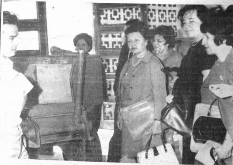
SANTA CRUZ.— Dirigentes de CONIF durante la visita que realizaron recientemente al Centro de Formación Artesanal de esta ciudad. El grupo de CONIF realizó actualmente una gira por diferentes distritos del país, acompañado por personeros de la Comisión Nacional de Alianza para el Progreso.

Tanto los campesinos como las autoridades invitadas a las demostraciones, mostraron satisfacción por las mismas.