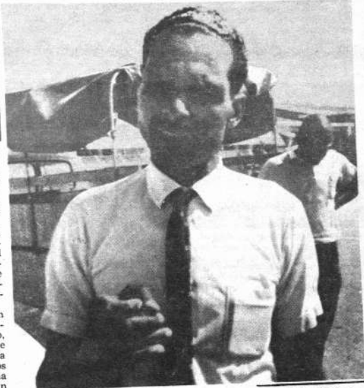
ANGUILLA.— Ronald Webster, presidente rebelde de Anguilla en oportunidad de hacer declaraciones a la prensa frente a su oficina. Mientras tanto, desembarcaban tropas inglesas ocupando la pequeña isla del Caribe.

Finalmente, el Sumo Pontífice agradeció la presencia de Felipe Herrera y el apoyo que dio a la realización del proyecto.