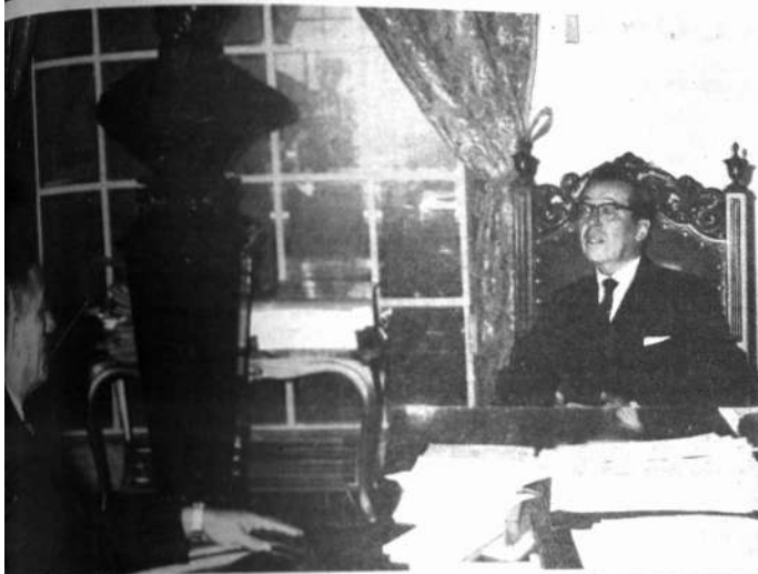
Burg, Ministro de Asistencia Social Israeli, dijo ayer a Barrientos que en su país la Intranquilidad se limita a las zonas fronterizas. Burg fue recibido por el Presidente antes de otras visitas a ministros de Estado.