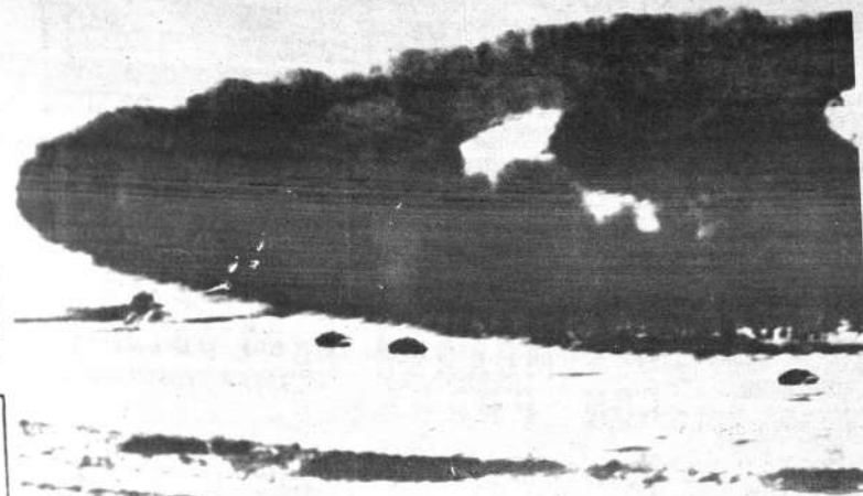
CHOQUE CHINO-RUSO. — La foto, una de las muchas que presentó China como prueba de la incursión rusa en su territorio, muestra, a decir de los chinos, a tanques soviéticos atravesando el hielo del que China reclama ser su territorio en el río Usuri. La curva del río alrededor de la disputada isla es llamada por los chinos Chen Pao y por los rusos, Damansky.

Observadores norteamericanos en líneas de avanzada informa- ron haber avistado a unos 10 soldados nortvietnamenses en la mitad sur de la zona desmilita- rizada cerca de la costa, al ano- checer del martes.