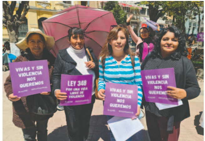
Activistas marcharon en todo el país exigiendo reformas a la Ley 348 para combatir la violencia de género

La autoridad dijo que los casos de violencia contra la mujer están aumentando en todas las regiones del país y ante esta situación, desde la Defensoría activaron campañas preventivas que pretenden reducir esta cifra. "Según el Ministerio Público, tenemos 28.876 casos de delitos comprendidos en la Ley 348 en este año. Este dato nos preocupa y esperamos que estos hechos vayan