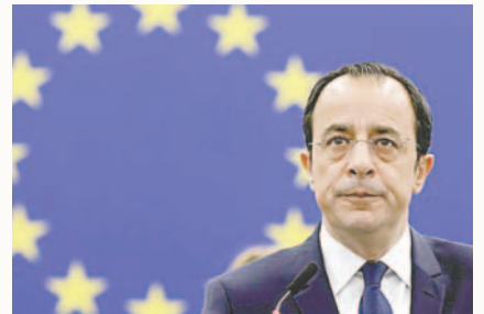
El presidente de Chipre, Nikos Christodoulides