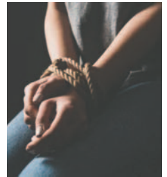
La reacción rápida de la amiga permitió el rescate /REFERENCIAL

El coronel Holguín también informó que el