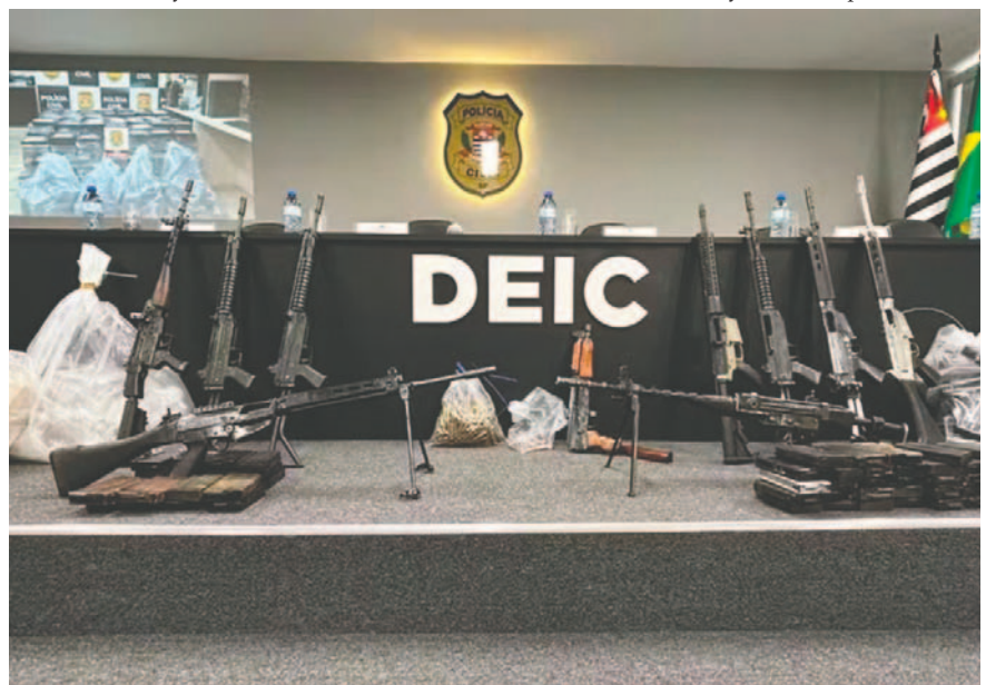
El cargamento de droga como de los 10 fusiles que fueron incautados en Brasil son elementos que presuntamente tendrían procedencia de Bolivia

Según los informes, los detenidos tienen 27, 31 y 42 años; dos de ellos tenían antecedentes penales, uno por tráfico de drogas y otro por posesión ilegal de arma.