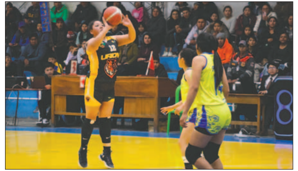
Uriona con la misión de ganar recibe a Leones de Potosí desde las 20:30

No menos importante fue lo que hizo Tarija Básquet, que en su debut logró derrotar en su propia casa a Leones de Potosí por la cuenta de 57 a 53. Si bien es la primera presentación de las tarijeñas en un torneo de estas características, tienen un elenco bien formado con estre-