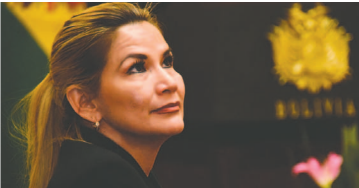
La expresidente Jeanine Añez denuncia sobre la desigualdad de género y el acoso que enfrentan las mujeres en Bolivia

femenina: "porque a las mujeres Dios nos dio la valentía necesaria para superar cualquier dificultad". También celebró la capacidad única de las mujeres para crear vida: "somos afortunadas porque tenemos la bendición de llevar una vida en nuestro vientre".