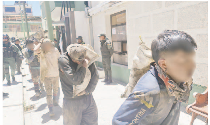
El grupo de jucus fue trasladado hasta dependencias de la Felcc de Oruro donde brindaron sus declaraciones