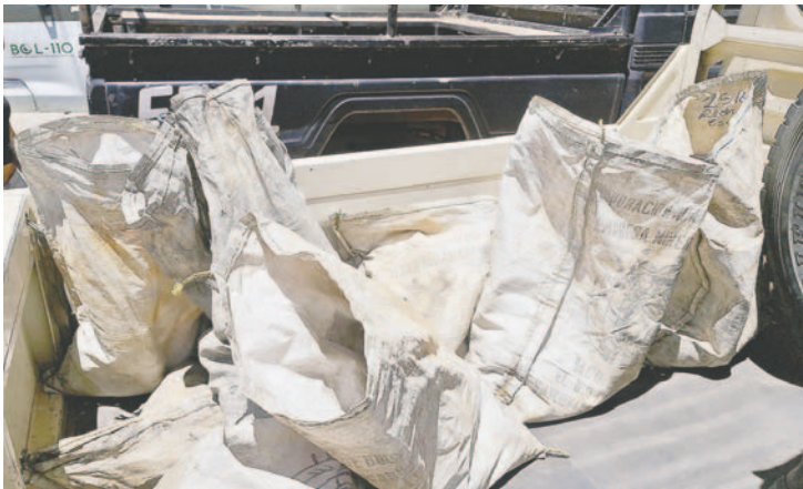
Los sacos donde se intentaba sustraer la carga mineralizada también fueron trasladados hasta Oruro