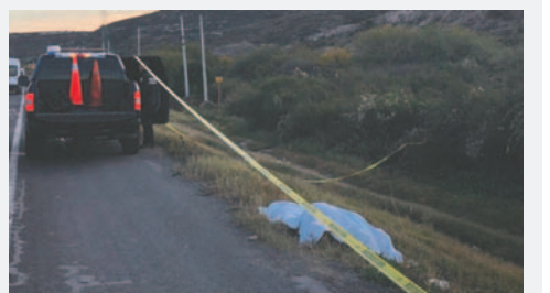
Las investigaciones señalan a la pareja como la principal sospechosa /REFERENCIAL

La aprehensión de la pareja y el levantamiento del cadáver han generado una ola de comentarios en la comunidad de San Lorenzo, donde los vecinos se muestran preocupados por la violencia en las relaciones de pareja. Las autoridades instan a los ciudadanos a denunciar cualquier situación de violencia y a buscar ayuda profesional en casos de conflictos en las