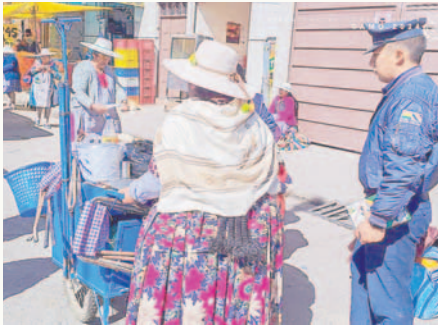
Defensa al Consumidor realizó el retiro de comerciantes informales