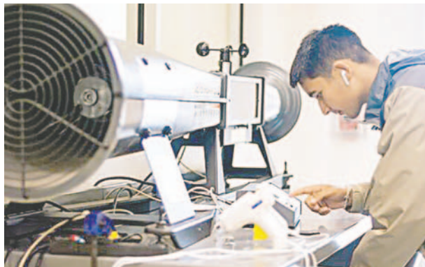
Los países iberoamericanos destacan la importancia de fortalecer la ciencia y tecnología en la Conferencia Ministerial de Valencia, previa a la Cumbre de Cuenca

Facilitar la movilidad de estudiantes universitarios, reducir las brechas tecnológicas, fortalecer la oferta formativa en español y en portugués e incorporar estas lenguas en el desarrollo de la inteligencia artificial