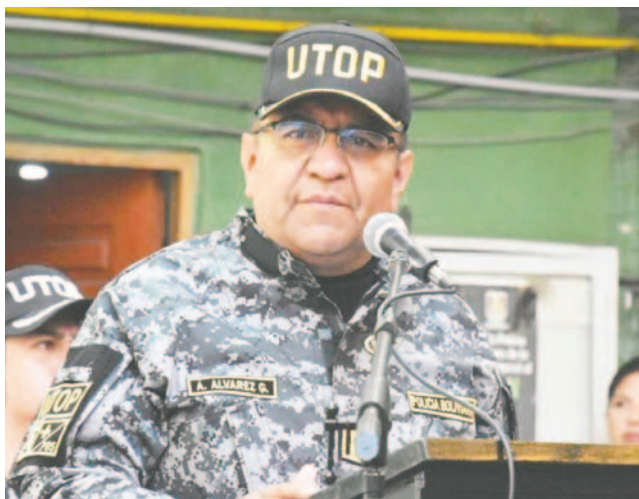
El Comandante General de la Policía informó sobre la aprehensión del padre de la menor de edad

Este caso ha generado gran repercusión en el país, mientras la Policía sigue avanzando en las investigaciones relacionadas con este delicado tema de trata y tráfico de personas.