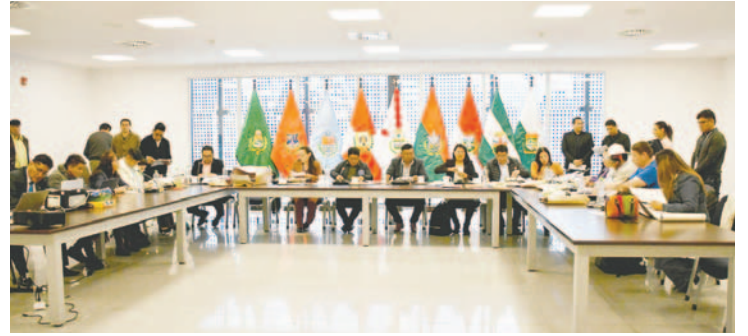
Hoy comienza la etapa de evaluación oral a los 38 postulantes

Son 80 puntos los que serán calificados este sábado. Para que los postulantes pasen a ser candidatos al cargo, deben obtener