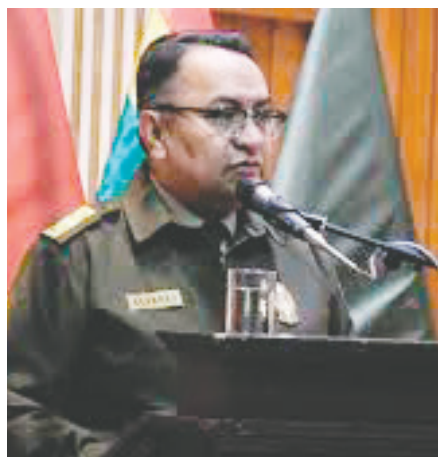
El Comandante Nacional de Policía, general Álvaro Álvarez

Por su parte, la Federación de coccaleros mantiene una vigilia en diferentes puntos de la ruta Cochabamba-Santa Cruz, ante la posibilidad de que se emita una orden de captura contra Morales.