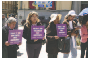
Mujeres exigen la implementación efectiva de la Ley 348 rendición de cuentas públicas.

Por otro lado, se conminó al Estado y a las Entidades Territoriales Autónomas (ETA) a asignar presupuestos suficientes para la implementación de políticas públicas de atención y prevención contra la violencia, así como a garantizar una ejecución efectiva de las mismas con