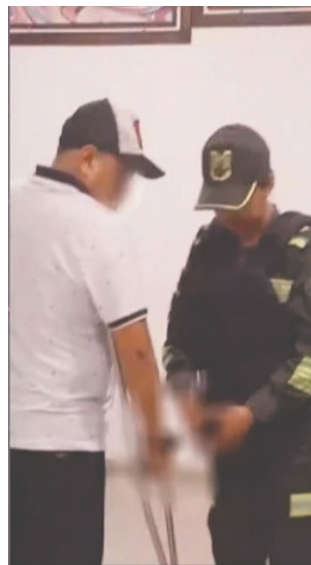
El estafador fue capturado por la Policía

ció cursos gratuitos a través de la cooperativa de agua, diciendo que eran para capacitar a nuestros hijos. Pagamos por los certificados, pero