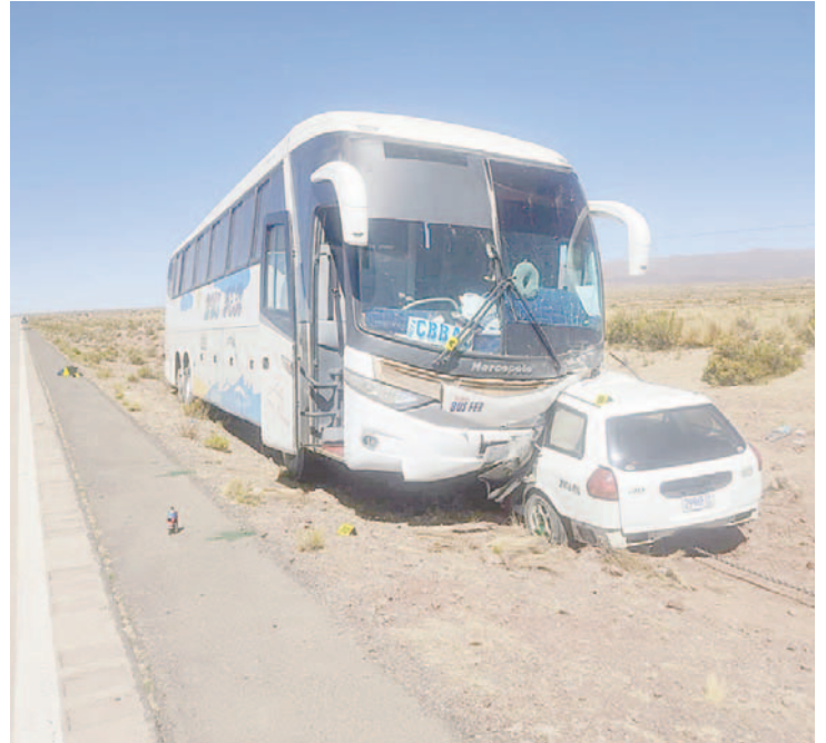
El ómnibus y la vagoneta tras el violento choque frontal en la carretera Oruro-Pisiga