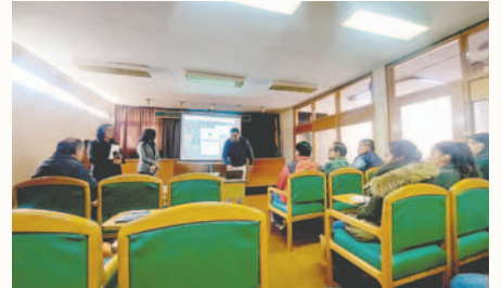
El taller tuvo lugar en la Federación de Empresarios Privados de Oruro /STPO