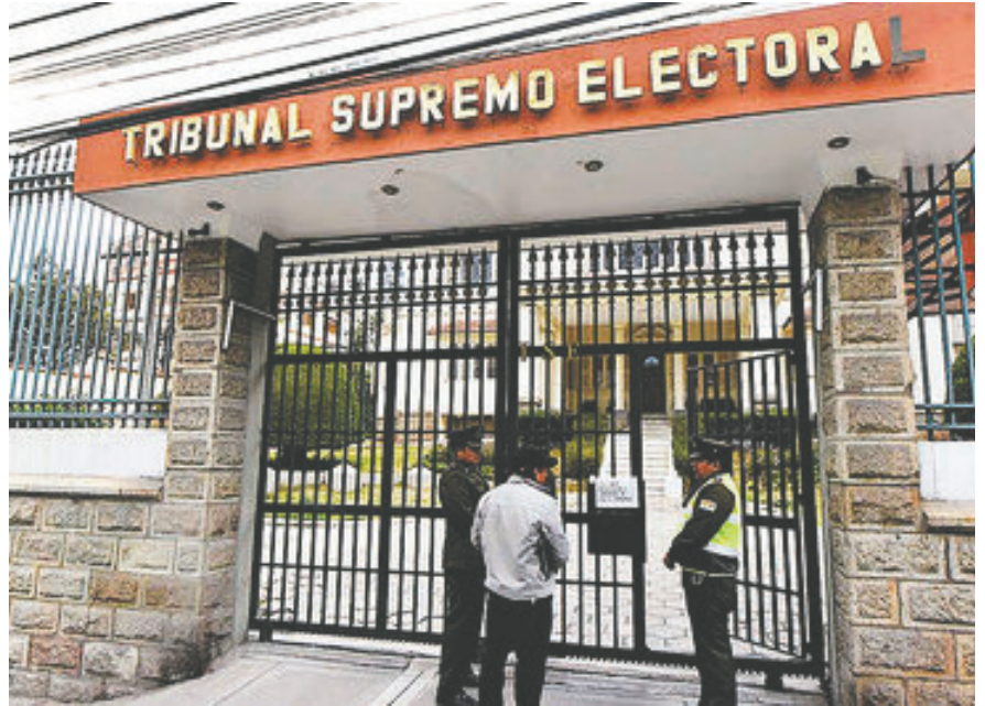
El TSE envió este viernes 11 de octubre un proyecto de ley a la Asamblea Legislativa Plurinacional

El TSE destacó que, en la última Elección General de 2020, solo una organización política cumplió con el principio de paridad y alternancia en las candidaturas a la Presidencia y Vicepresidencia del Estado entre las cinco que participaron en el proceso.