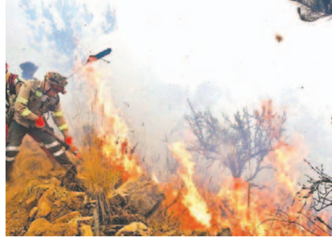
La reciente disminución de incendios en el país, gracias a las lluvias y al esfuerzo del Comando Conjunto de Respuesta

Según el informe, en detalle, estos incendios se concentran en siete municipios de Santa Cruz, Beni, Chuquisaca y La Paz, siendo el departa-