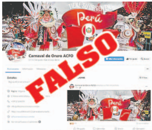
En las páginas hackeadas, se publicó material de Perú que es falso /CAPTURAS

El presidente de la FMCO, Gary Condori, informó que se recuperó el control de su