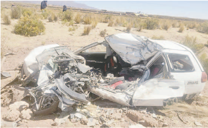
Así quedó la vagoneta donde el conductor perdió la vida y su acompañante resultó gravemente herida