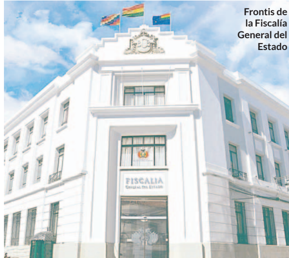
Frontis de la Fiscalía General del Estado