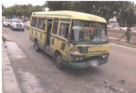
El micro involucrado en el incidente

La decisión está respaldada por el ordenamiento jurídico vigente, ya que el conductor dio negativo en el test de alcoholemia, lo que limita la posibilidad de solicitar prisión preventiva.