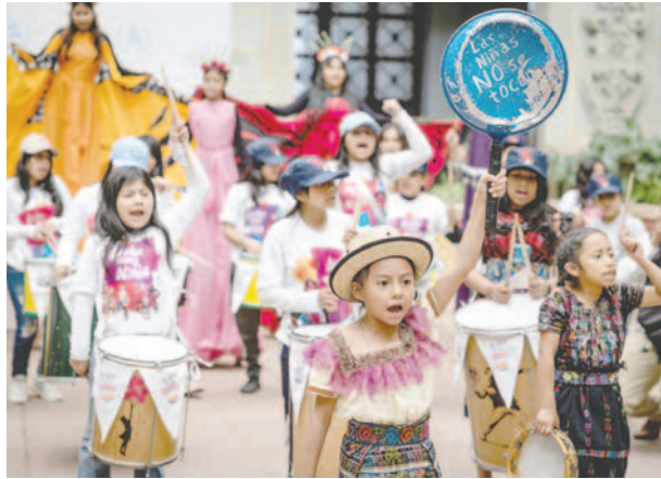
Niñas participan durante la presentación musical del grupo social Coincidir , este viernes en el Palacio Nacional de la Cultura, de la Ciudad de Guatemala (Guatemala)

El caso de Alta Verapaz, una provincia ubicada a 217 kilómetros de la capital guatemalteca, es el más