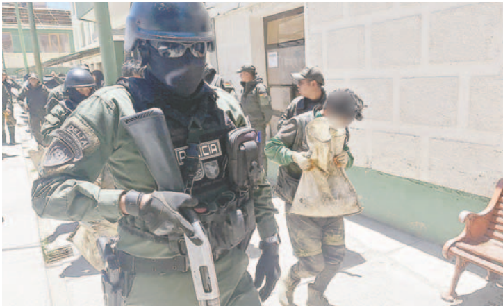
El adolescente de 16 años fue puesto a disposición de la Defensoría de la Niñez y Adolescencia (DNA)