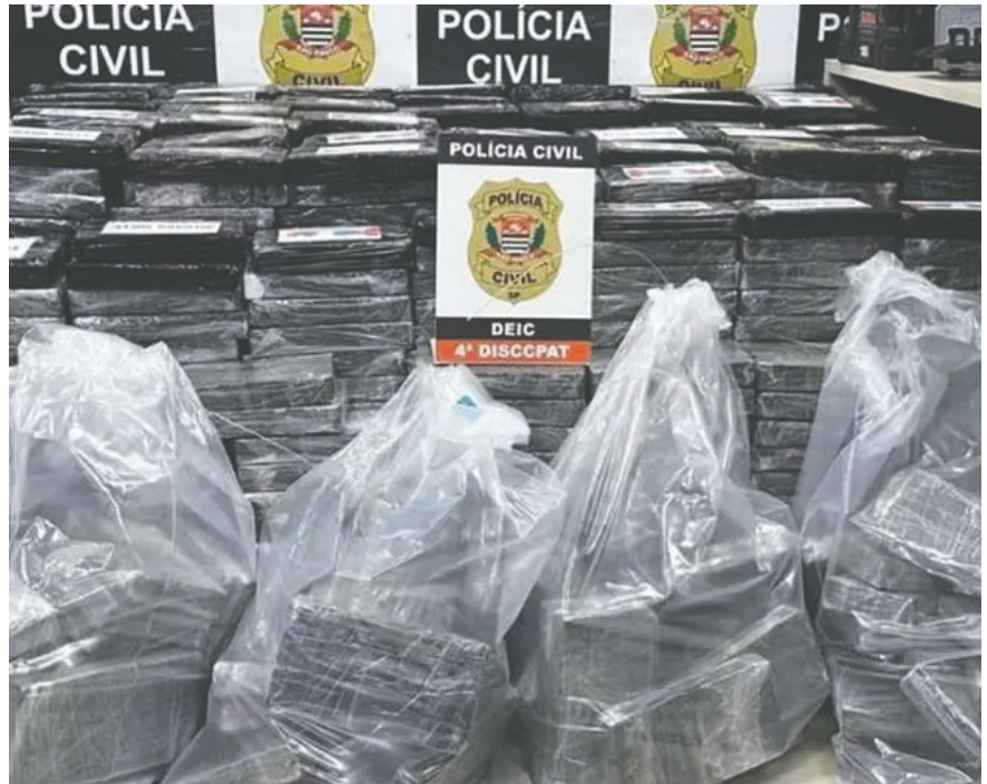
En Brasil se incautó un cargamento de droga y fusiles

Los agentes del DEIC montaron un operativo en el domicilio