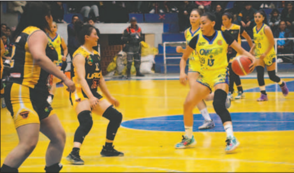
Carl A-Z visitará esta noche a Tarija Básquet

El grupo "A" se completará con el partido entre Club Tennis La Paz e Ingavi de Llalagua, el cual se jugará el domingo desde las 16:00 horas en la sede de Gobierno. Las actuales campeonas de la Libofem quieren volver a la senda del triunfo a costa de un elenco de Ingavi que no tuvo un buen debut, cayendo como local ante Alemán.