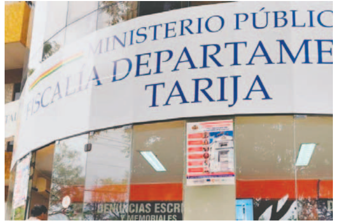
La Fiscalía guarda silencio pese al interés público del caso

Hasta las 20:00 horas del mismo día, no se había informado el paradero del padre de la presunta víctima, quien fue aprehendido en Yacuiba el jueves, según confirmó el comandante general de la Policía, Álvaro Álvarez. El hombre