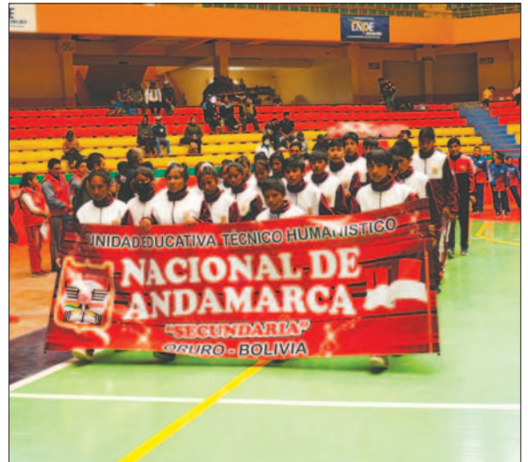
En la segunda fase, el número de participantes se incrementará en esta temporada

Al mismo tiempo, otro aspecto que se debe considerar es la alimentación de las delegaciones. Si bien