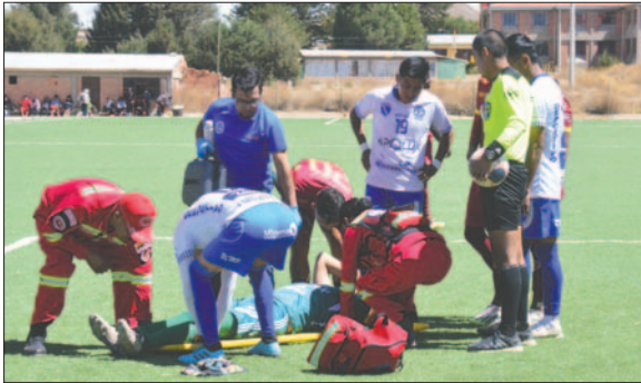
El arquero de CDT Real Oruro sufrió una grave lesión y no hubo ambulancia para trasladarlo a un centro médico

El pedido de los clubes de contar con un seguro para jugadores no es descabellado, por el contrario, ya se tienen antecedentes de que es posible. Por ejemplo, en agosto de 2019, durante la presidencia de René Huallata, se firmó un convenio con la empresa de Seguros y Reaseguros Unividá, donde fueron beneficiados deportistas de las categorías Primera "A", Primera "B" y las categorías de Ascenso, además de los árbitros que dirigen dichos encuentros. El convenio estuvo vigente hasta el final de dicho campeonato, pero no se pudo seguir adelante debido a la llegada de la pandemia por el Covid-19.