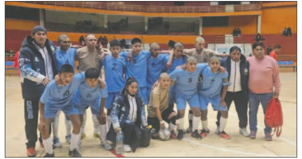
La selección de Oruro realizó una buena campaña a pesar de los problemas

Al final los organizadores procedieron con la premiación, La Paz