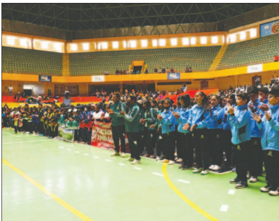
La inauguración de los juegos se realizará a fines de este mes de octubre

La fecha tentativa para la realización de la segunda fase de los Juegos Deportivos Estudiantiles está entre el 28 y el 31 de octubre.