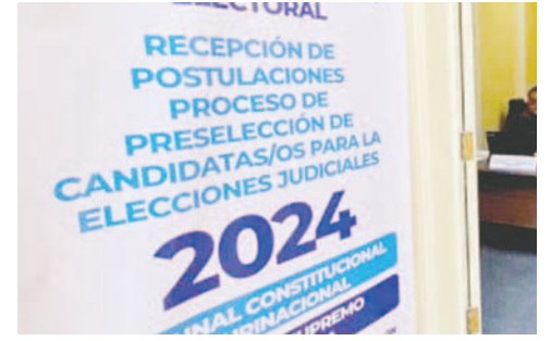
La audiencia fue reprogramada para el martes 15 de octubre

Legislativa han remitido las listas de aprobados y reprobados; incluso han ido más allá al realizar la preselección de los postulantes. No consideraron que este proceso debería estar a cargo del pleno de la Asamblea Legislativa. Deberían haber remitido únicamente las listas de todos los postulantes que obtuvieron un mínimo de 130 puntos, tal como lo establece la norma".