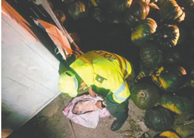
La familia del menor se encuentra mal herida tras el vuelco en la ruta