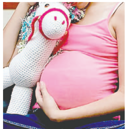
La menor fue llevada por sus familiares a un hospital por complicaciones del embarazo, desatando la preocupación del personal médico /REFERENCIAL

También será sometida a varias pruebas médicas que permitan establecer su estado de salud y el de la bebé que lleva en su vientre. Lo único claro hasta ahora es que se trata de una menor de 12 años que, realizando las cuentas pertinentes, quedó embarazada a los 11 años.