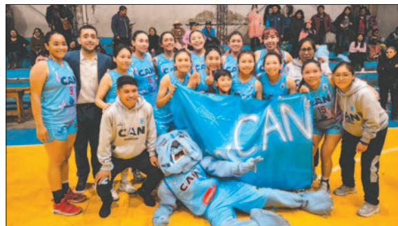
CAN jugará de visita ante San Pedro en Potosí el domingo