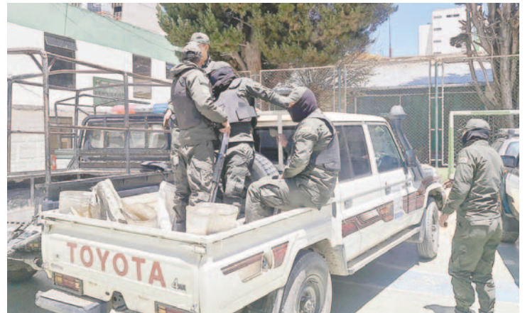
Varios funcionarios policiales escoltaron la carga mineralizada que fue recuperada y devuelta a la Empresa Minera Huanuni (EMH)