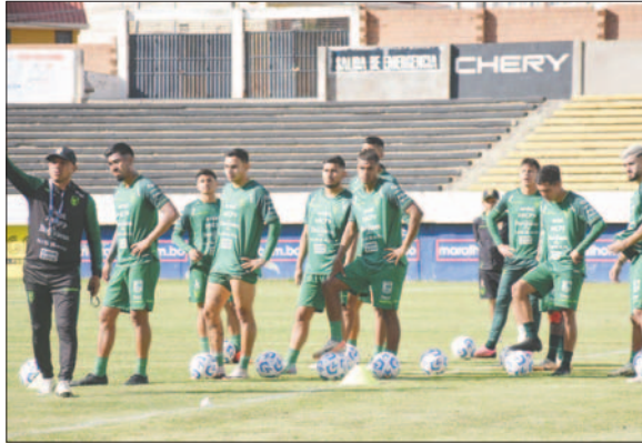
Luego del entrenamiento en Achumani, este sábado viajarán a Santa Cruz