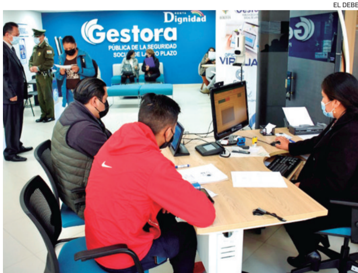
El sector dice que tiene el apoyo de 18.000 personas en Santa Cruz