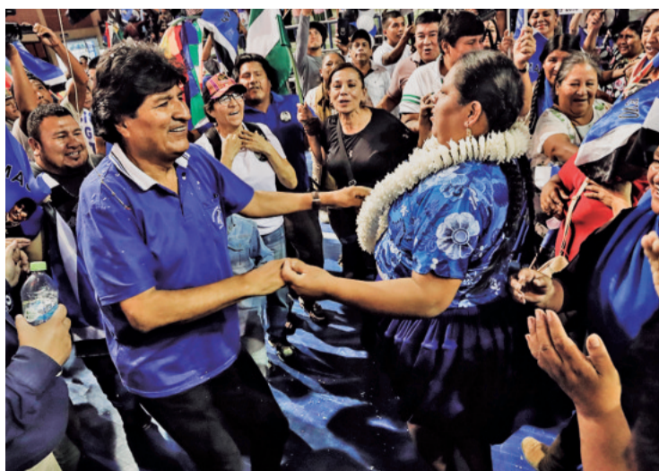
Evo Morales y sus sectores decidieron realizar un bloqueo de caminos

En plena pelea interna en el MAS, el bando de Evo presentó una denuncia ante la Fiscalía contra Arce, por supuesto abuso de poder y acoso sexual.