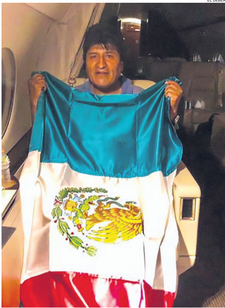
El 10 de noviembre de 2019, Evo Morales, salió de Bolivia a México.

"Nosotros, el gobernador y su equipo jurídico, estamos ansiosos porque comience el juicio, no tenemos ningún inconveniente (...)