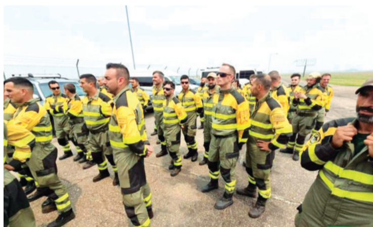
Apoyo. 41 bomberos y 8 especialistas llegaron desde España