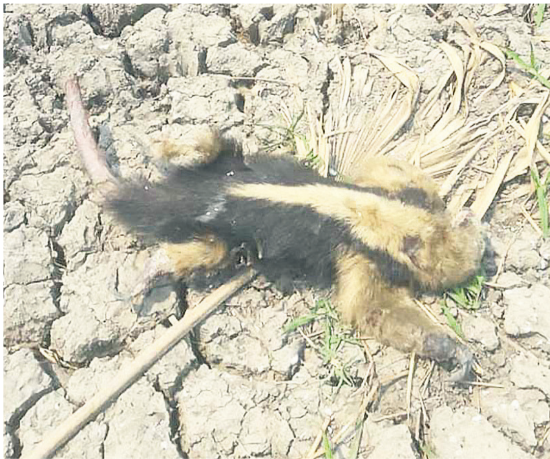
Los animales sufren el impacto de la extrema sequía. La situación puede empeorar

Fue el más cálido jamás registrado en América Latina y el Caribe