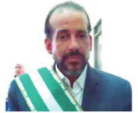
Camacho llegará a Santa Cruz

didia de presión, invitó a Evo Morales a una reunión. Los arcistas piden a la Policía garantizar el libre tránsito A4 Y 5