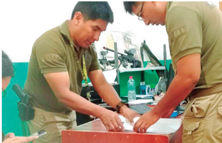
Los policías que elaboraron las diligencias por el delito de biocidio

La Fiscalía hizo notar que la norma -en este caso- establece