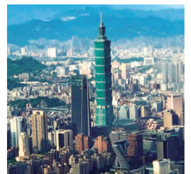
La isla es apetecida por China

El pasado viernes, China anunció sanciones contra tres empresas estadounidenses por la venta de armas a Taiwán./EFE