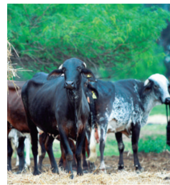
Supervisan zonas fronterizas

En Argentina, la reversión del Gasoducto Norte demandó una inversión de $us 710 millones y permitirá proveer a Córdoba, Tucumán, La Rioja, Catamarca, Santiago del Estero, Salta y Jujuy.