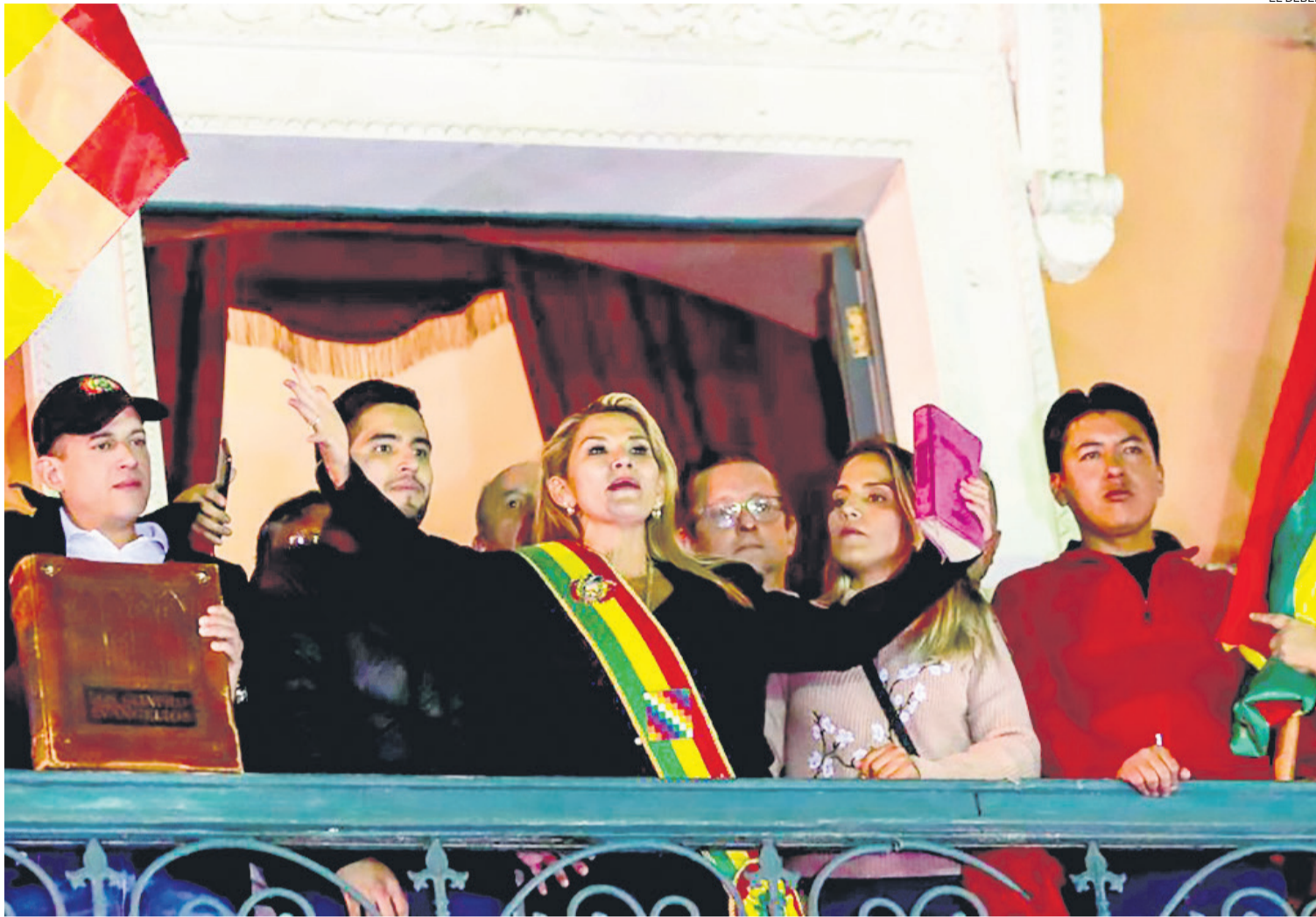
El 12 de noviembre de 2019, Jeanine Áñez, escoltada por Fernando Camacho y Marco Pumari, saluda desde Palacio Quemado en La Paz.

EL GOBIERNO TIENE LISTO TRES OPERATIVOS DE TRASLADO PARA LOS ACUSADOS