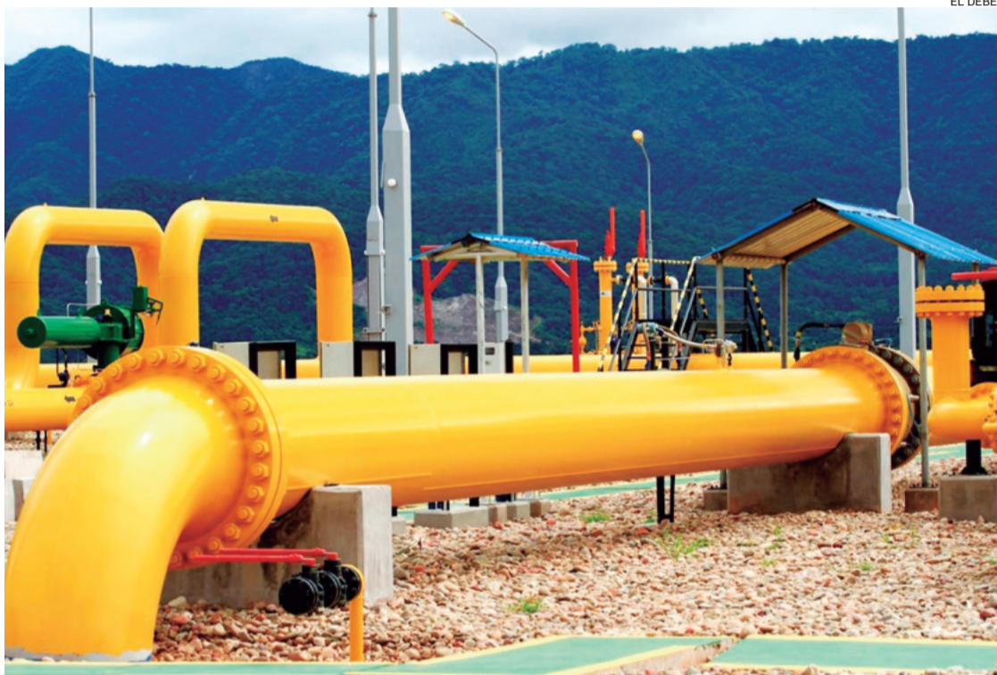
Tecpetrol exportará gas natural del bloque Fortín de Piedra hasta por 1,5 MMmcd por la red de Bolivia.

YPFB tiene planificado en 2025 encarar más obras para incrementar la capacidad de transporte de gas natural del megaya-