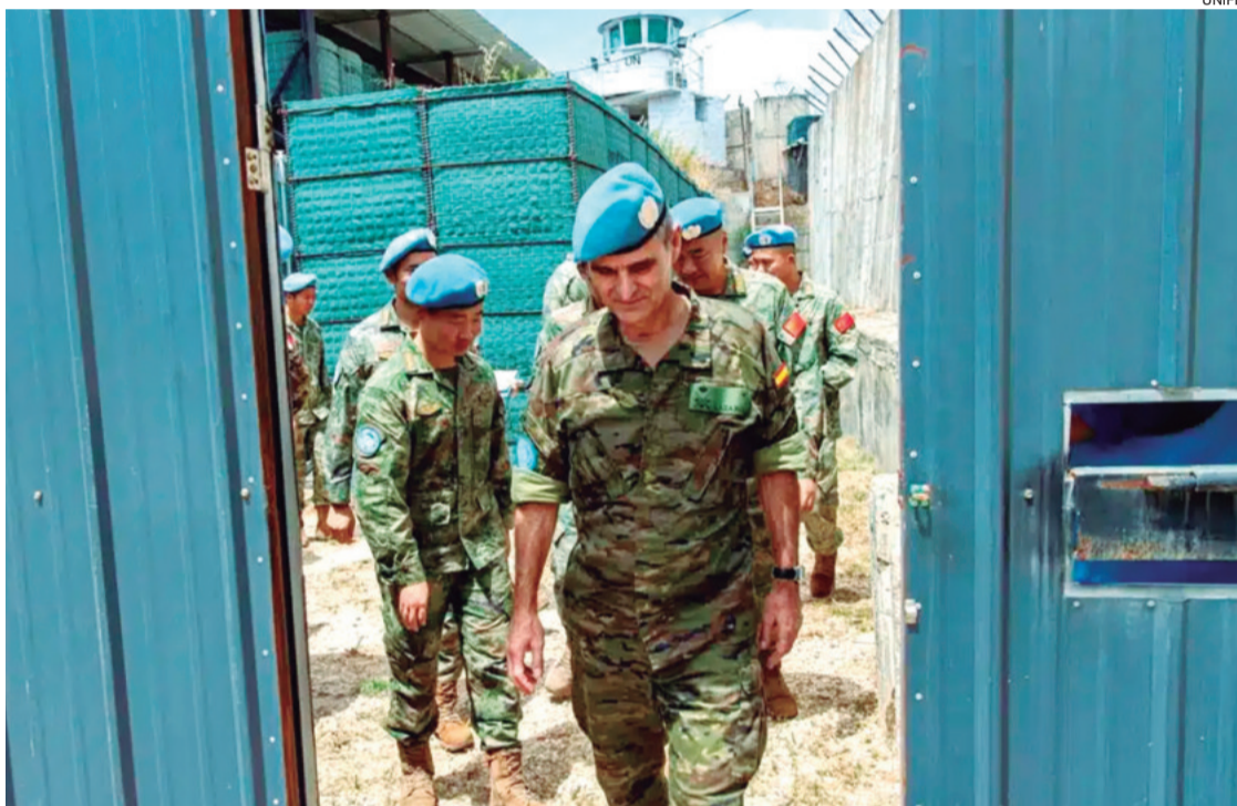
Sube la tensión en el Medio Oriente con los ataques que afectaron a los cascos azules

El Ejército de Israel intensificó ayer su avance en el sur del Líbano, en una jornada marcada por la citada entrada de dos tanques israelíes en la base de la Finul en el