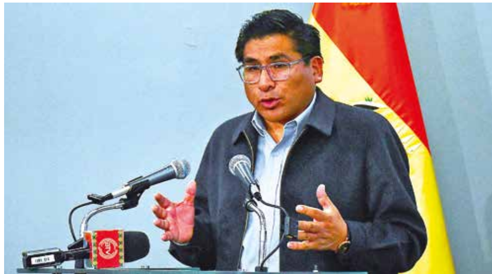
El ministro Néstor Huanca en conferencia de prensa, ayer.

La autoridad, en conferencia de prensa, explicó que el Consejo para el Desarrollo Fronterizo y Seguridad implementará una serie de medidas para prevenir y controlar el contrabando, según lo establecido en la normativa recientemente aprobada, cuya reglamentación comenzará a elaborarse en los próximos días.