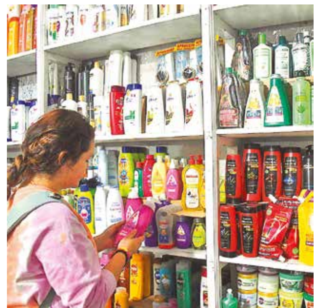
Venta de productos de aseo personal en un mercado. C.I.

Además, el Ministro resaltó que la eliminación temporal de aranceles no es un esfuerzo aislado, sino que se suma a otras medidas previas, como la reducción de aranceles para repuestos, maíz, alimentos e insumos médicos. "La política fiscal está orientada a generar un espacio de alivio en términos de presión de precios", concluyó Montenegro.