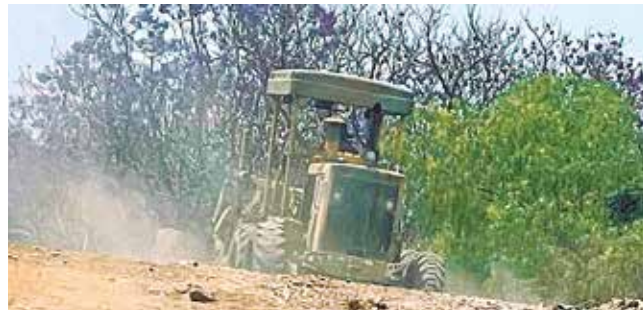
La apertura de camino que fue paralizada el sábado. LT

Asimismo, Ayala indicó que el pasado sábado en el municipio de Cercado se frenó el movimiento de equipo pesa-