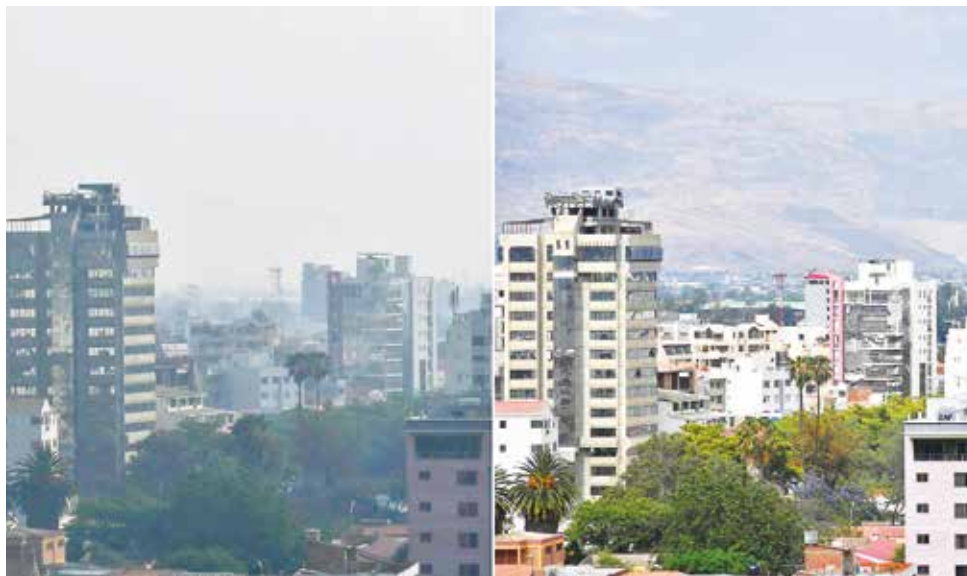
Imágenes comparativas del descenso de la contaminación en la ciudad.