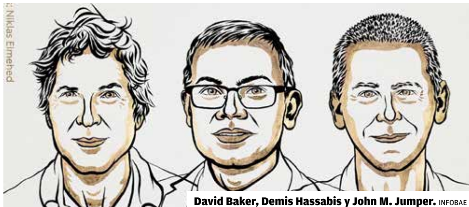
David Baker, Demis Hassabis y John M. Jumper.

Las proteínas son las moléculas que hacen posible la vida; los ladrillos que forman los huesos, la piel; los motores que