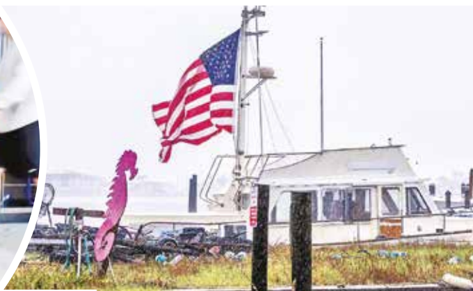
La bandera de Estados Unidos flamea en un puerto de Florida.