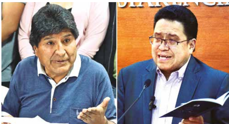
El expresidente Evo Morales en conferencia de prensa. El ministro de Justicia, César Siles.

El caso agravó la tensión política entre las dos alas del MAS, unos en defensa de Evo Morales y otros sumando denuncias en su contra.