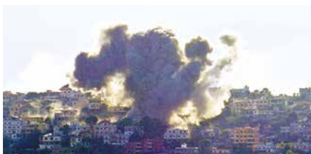
Los ataques aéreos de las fuerzas israelíes en Kham, cerca de la frontera entre Líbano e Israel.

de cerca de 200 misiles contra el país, y advirtió que será “letal” y “sorprendente”. “Nuestro ataque será letal, preciso y, lo más importante, sorprendente: (Irán) no sabrá qué sucedió ni cómo sucedió. Sólo verá los resulta-