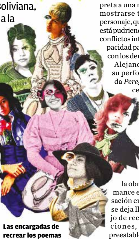
Las encargadas de recrear los poemas de Adela Zamudio en el teatro.

El evento también contará con una experiencia adicional a través de la exposición "La ruta inmortal de la esperanza", una muestra visual y sonora que estará disponi-