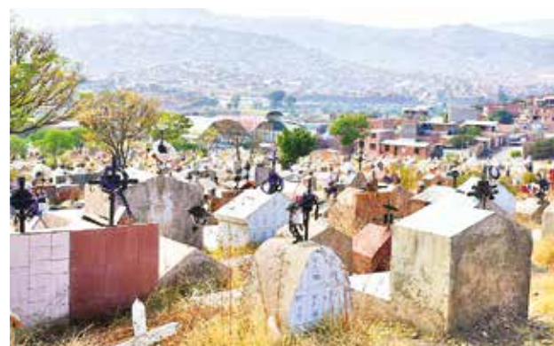
El cementerio de K'ara K'ara, en la zona sur.

Una vez concluida la obra, se lanzará la aplicación para teléfonos celulares, mediante la cual se anunciarán la agenda y la llegada de artistas nacionales e internacionales para la Fexco Arena. Se podrá realizar reservaciones o compras online.