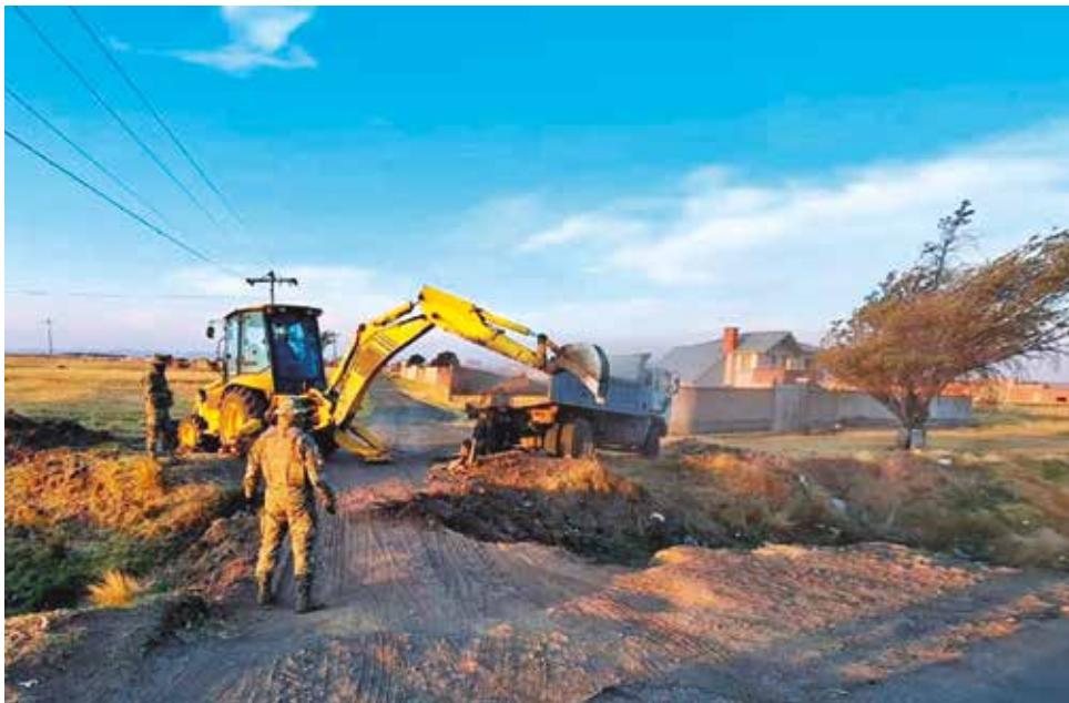
Militares, con ayuda de maquinaria, cavan zanjas cerca de la frontera con Perú.

La segunda línea de interdicción se ubica en las carreteras principales que conectan Bolivia con los países vecinos. En estos puntos, las fuerzas del CEO-LCC, junto con personal aduanero, realizan inspecciones exhaustivas. Durante operativos recientes, se incautaron 2 mil quintales de maíz, 580 quintales de azúcar y 1.400 quintales de arroz,