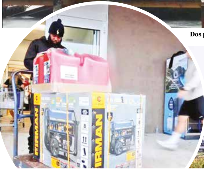
Una persona se aprovisiona ante la llegada del huracán Milton.