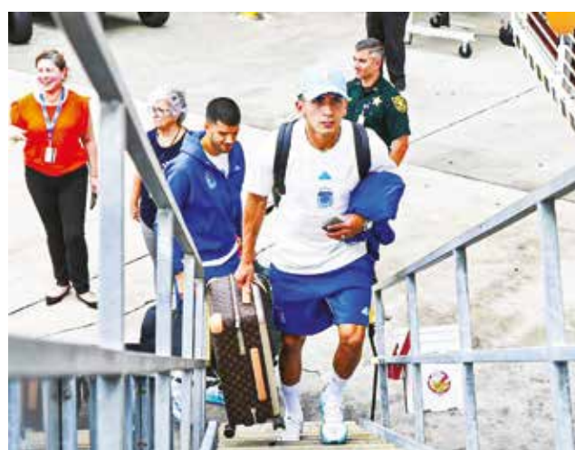
Jugadores de Argentina viajan de Miami a Colombia. D.A.

Sumado a que por lesiones Scaloni también tendrá que