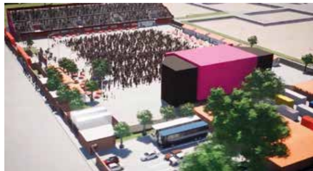
La maqueta del escenario de la Fexco Arena. GAMC

Dato. Fexco Arena estará lista para enero del próximo año y se prevé lanzar una aplicación para informa la agenda de diferentes eventos