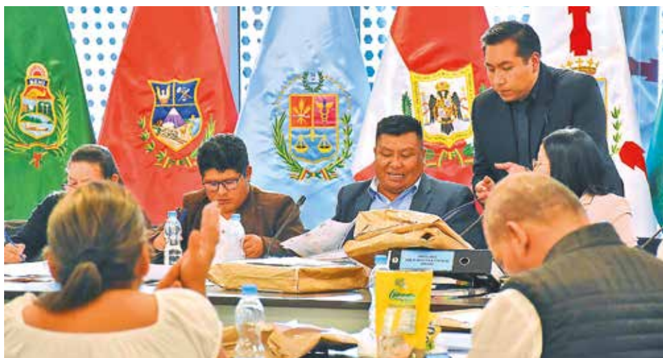
La Comisión Mixta durante el proceso de revisión de documentación de postulantes.

Esta primera parte de la evaluación y calificación de méritos se hizo sobre 120 puntos, ponderando el ejercicio y la experiencia profesional, la formación académica y la producción intelectual; mientras que la segunda parte, que incluye el examen oral y la presentación del plan de trabajo, se hará sobre 80 puntos, con un total de 200. Las preguntas y respuestas serán entregadas en un sobre cerrado el mismo día de la evaluación a la Comisión Mixta de Justicia Plural.