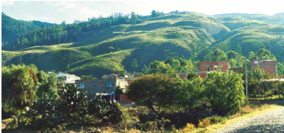
Las construcciones ilegales proliferan en el Parque Nacional Tunari. CARLOS LÓPEZ

fraccionar terrenos en el interior del parque y algunas veces llegan a vender a personas que vienen del departamento de Potosí, muchos de ellos han sido estafados”, añadió.