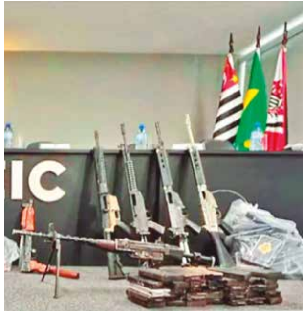
Las armas secuestradas en Brasil.

Tras conocer los hallazgos, el Ministerio Público inició una investigación del caso debido a que existe evidencia de que tres de los 10 fu-