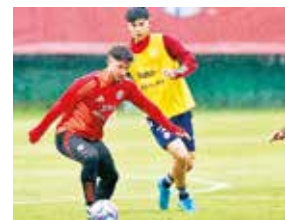
Práctica de la selección chilena.

derrotas en ocho encuentros, tres de estos a domicilio.