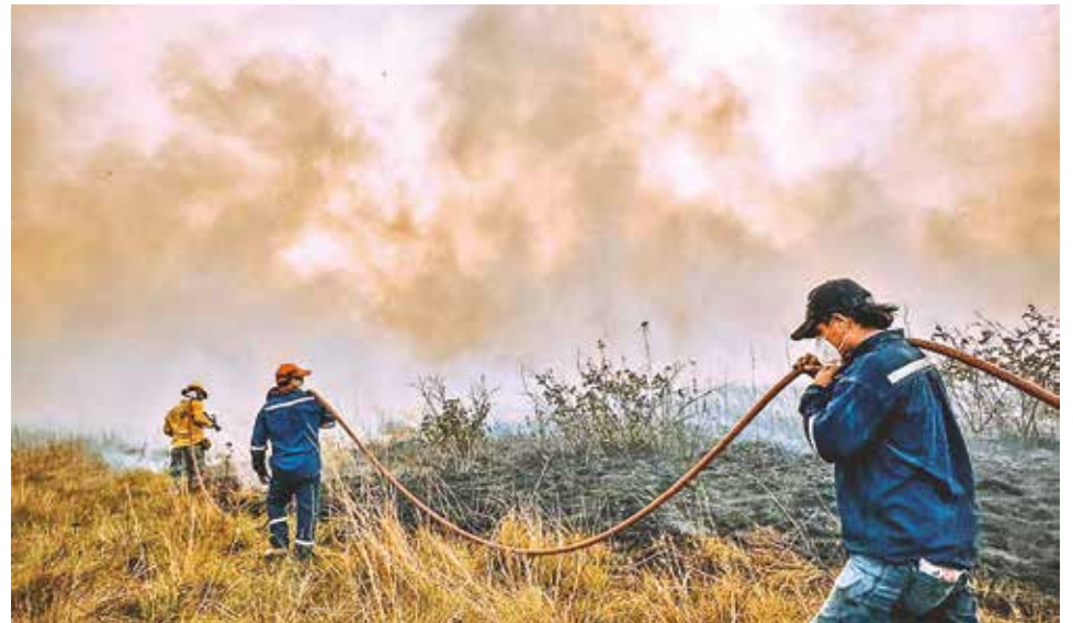
Los bomberos combaten incendios en un municipio de Santa Cruz.

“Con esa misión nos estamos preparando para combatir el fuego”, añadió el Viceministro en un acto llevado a cabo en Santa Cruz, donde la embajada de Japón donó 120 equipos completos para los bomberos forestales.