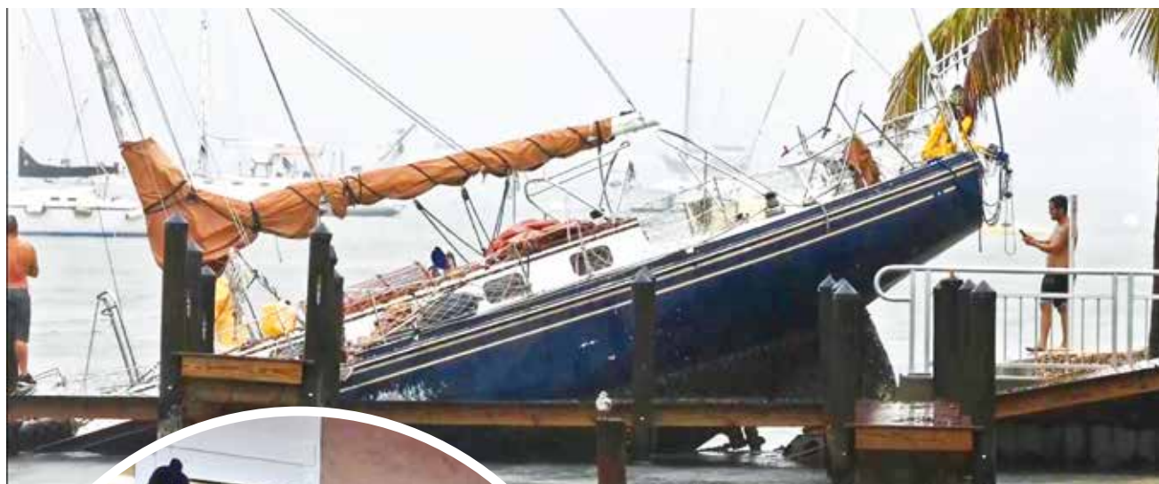
Dos personas hacen preparativos de último momento en Florida.

Destrucción. Helene, de categoría 4, dejó más de 220 muertes a su paso por Estados Unidos, y Milton, de categoría 5, apunta a aumentar la destrucción en el país en las próximas horas