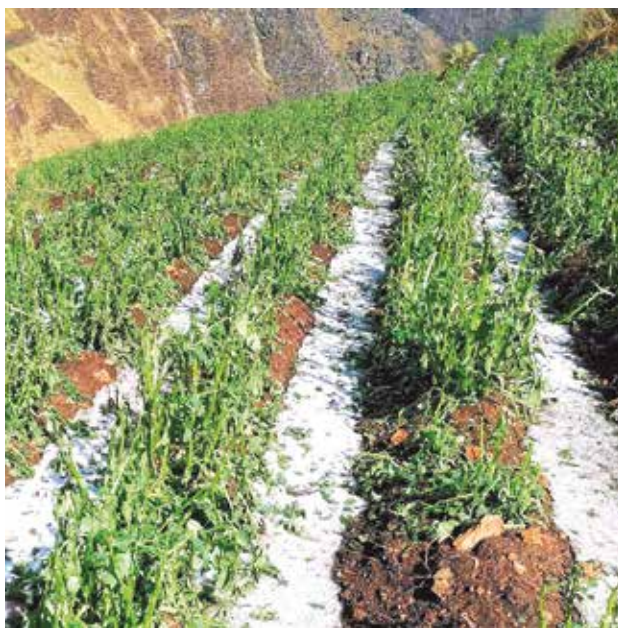
Cultivos afectados por la granizada en Palca.

Otro municipio que reporta pérdidas en la producción de