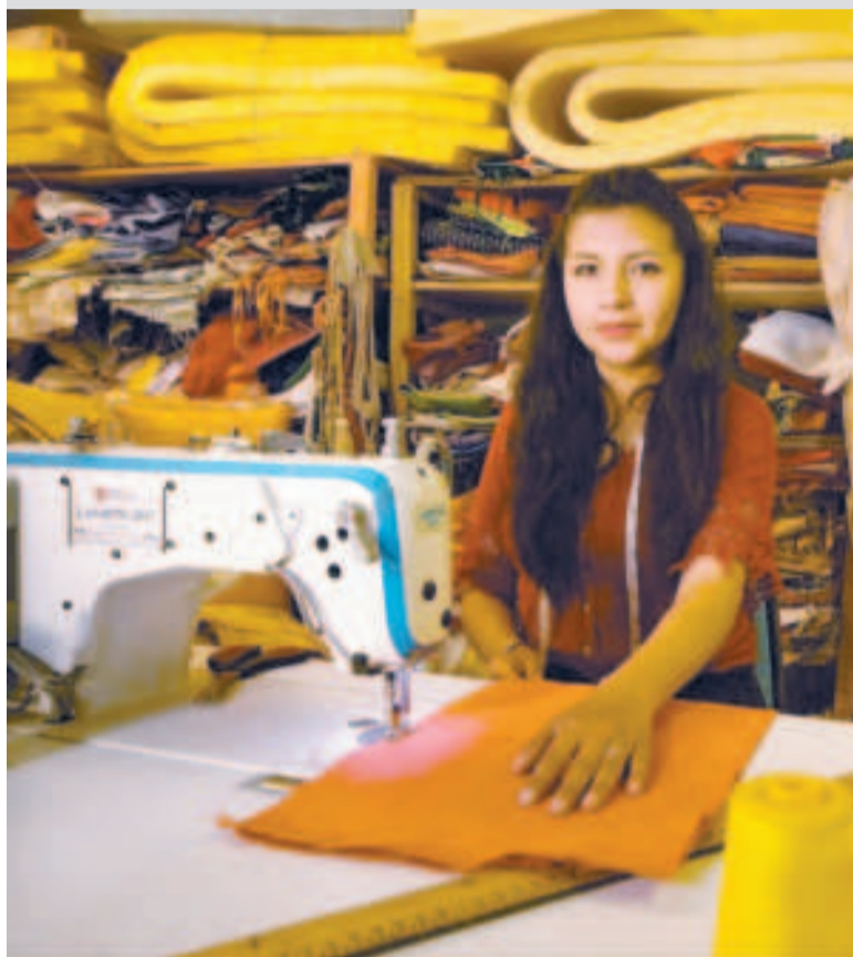
Cada vez más mujeres optan por formalizar sus empresas.