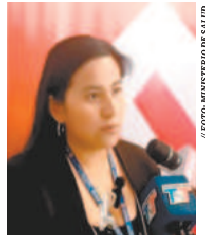
La responsable del Programa Nacional de Sangre.

Los organizadores invitan a toda la población a ser parte del Festival Gastronómico que se realizará el 20 de octubre. Para llegar se puede tomar un transporte desde la Terminal de Transporte Interprovincial de la ciudad de El Alto; el viaje dura aproximadamente una hora.