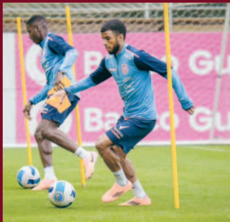
La selección ecuatoriana reanudó prácticas para el duelo del martes ante Uruguay.

Ambos equipos quieren llegar al Mundial y, para conseguir ese objetivo, es primordial sumar una victoria en este duelo entre sí en este partido por las Eliminatorias. El escenario será el estadio Centenario de Montevideo, que será juez del conflicto entre Bielsa y los jugadores.