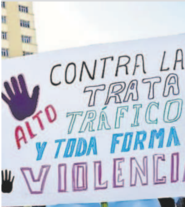
Una protesta en La Paz contra la trata y tráfico de personas.