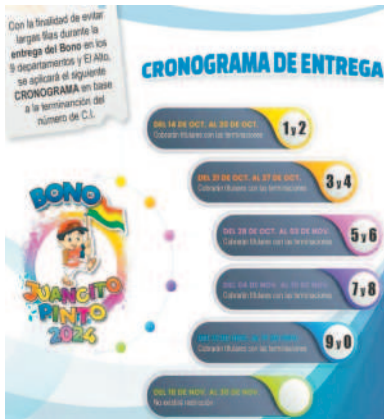
Cronograma de pago del Bono Juancito Pinto.

En tanto, para garantizar el pago del beneficio a los estudiantes de áreas rurales de difícil acceso se desplazarán brigadas móviles con el apoyo del personal del Ministerio de Defensa, Banco Unión y Entel, reportó ABI.