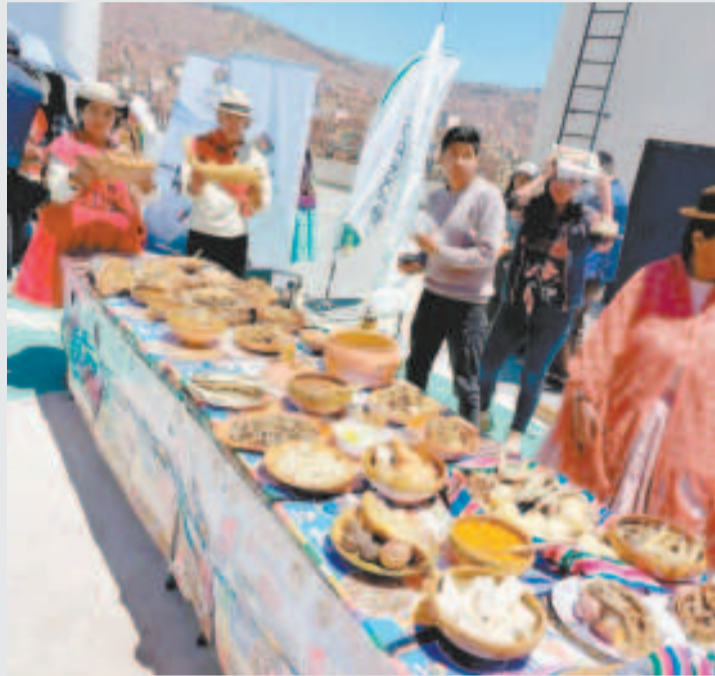
Una muestra de lo que será el Festival del Pescado.