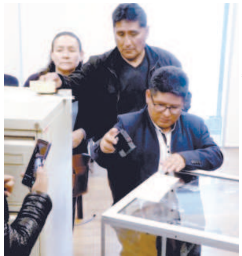
Sellan la urna de donde los aspirantes a fiscal general extraerán los bolillos.

Serán depositadas en un ánfora, de la cual cada postulante habilitado escogerá al azar diez bolillos y tendrá un tiempo máximo de tres minutos para desarrollar cada respuesta.