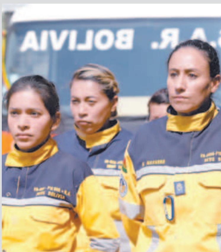
Mujeres que combaten los incendios.