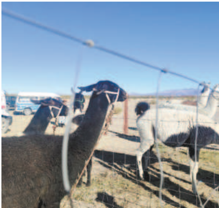
Los proyectos estatales fomentan la producción de carne de camélidos.