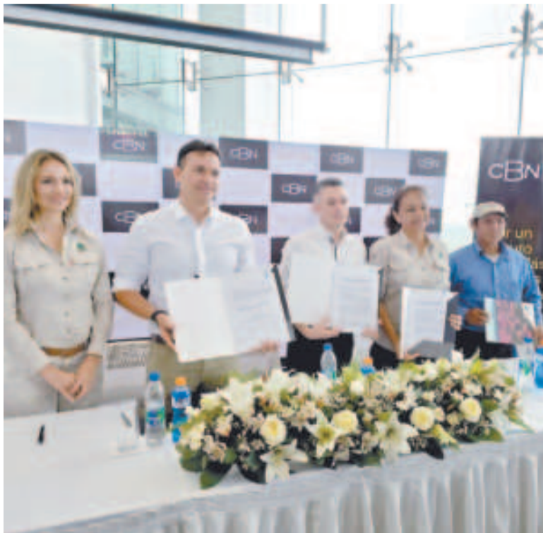
Los representantes de la CBN, de la FCBC y de la comunidad Santa Rita.