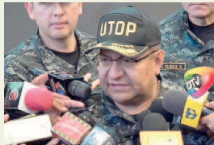
El comandante general de la Policía, Álvaro Álvarez.

El Comando General de la Policía Boliviana confirmó ayer la aprehensión, en Yacuiba (Tarija), del padre de la joven que supuestamente tuvo una hija con Evo Morales cuando era adolescente, que también está involucrado en el caso de trata y tráfico de personas y estupro agravado.