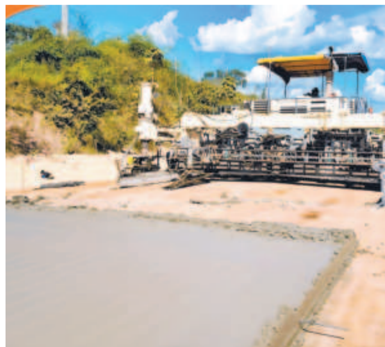
Los trabajos de pavimentación sobre el tramo carretero.

La obra abarca 10,80 kilómetros de carretera bidireccional, con un pavimento rígido de 20 centímetros de espesor y bermas laterales de 1,5 metros. Además, se efectúan trabajos de drenaje, movimiento de tierras, cunetas y mantenimiento.