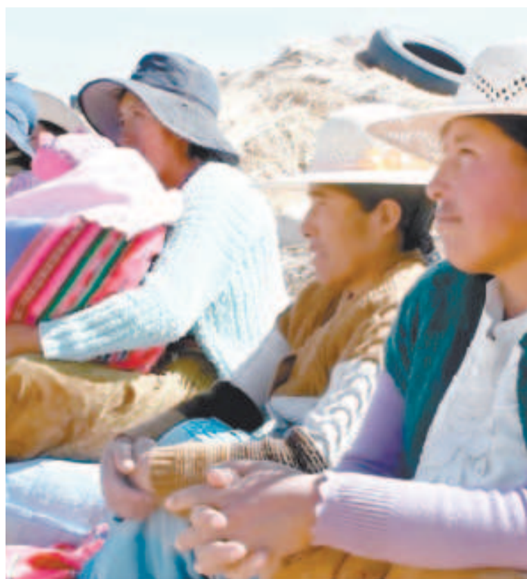
Algunas de las mujeres a las que beneficia el BDP.

El programa tiene dos componentes principales: Semilla Mujer, destinado a los nuevos emprendimientos; y Jefa de Hogar, para actividades económicas en marcha, lideradas por mujeres.