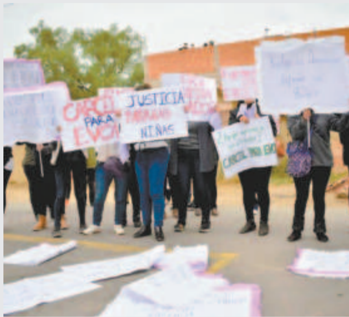
Mujeres protestan cerca de la Fiscalía de Tarija.

cel porque "goza de protección", pero espera que la justicia llegue tarde o temprano.