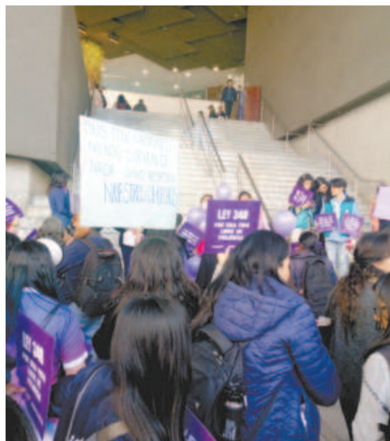
Protesta de redes de colectivos en la Asamblea Legislativa.

Exigieron la implementación plena de la Ley 348 con la asignación de presupuesto y que la ALP no cambie ni un artículo de la norma, como pretende el evismo.