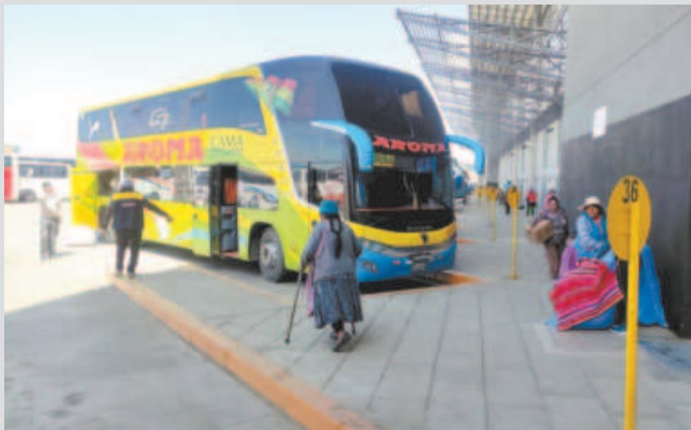
La Terminal Metropolitana de la ciudad de El Alto.