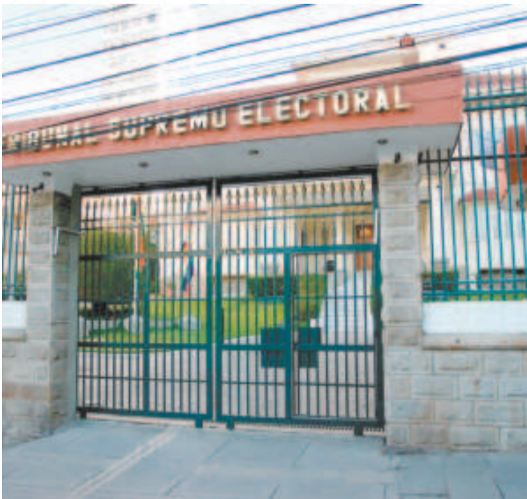
Frontis del TSE.