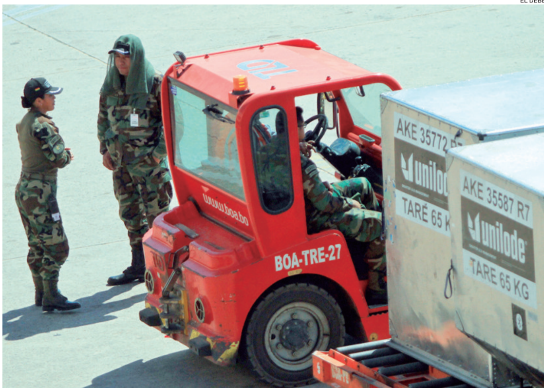
Dos funcionarios antidroga están en la plataforma de Viru Viru en un trabajo de vigilancia de rutina.

De este modo, el juez valoró los fundamentos planteados por los fiscales y ordenó detención para ambos exfuncionarios de Naabol por 180 días en la cárcel.