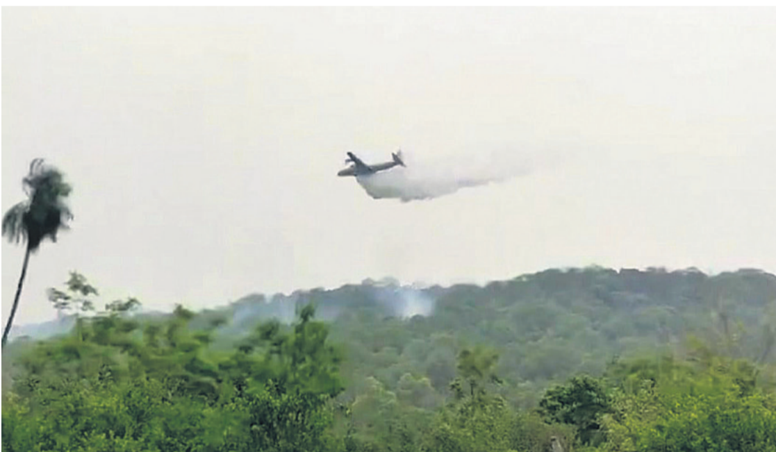
Las descargas de agua que se hicieron en el sector de Quitunuquiña, en Roboré