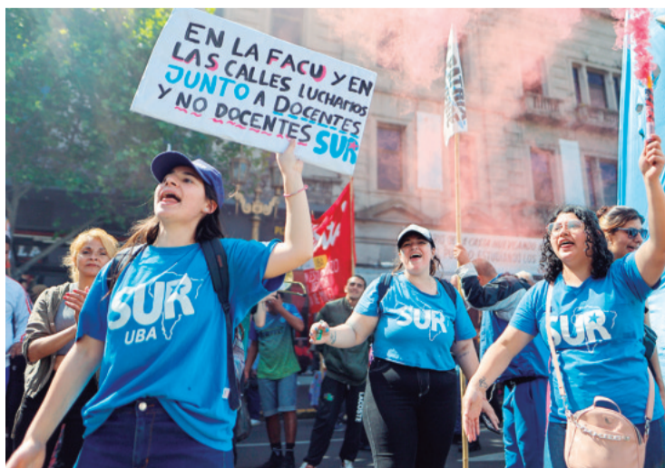
Los estudiantes universitarios argentinos protestan en las calles

El oficialismo, minoritario en el Parlamento argentino, consiguió sostener el veto presidencial gracias al apoyo de legisladores del partido de centroderecha Propuesta Republicana (Pro), que