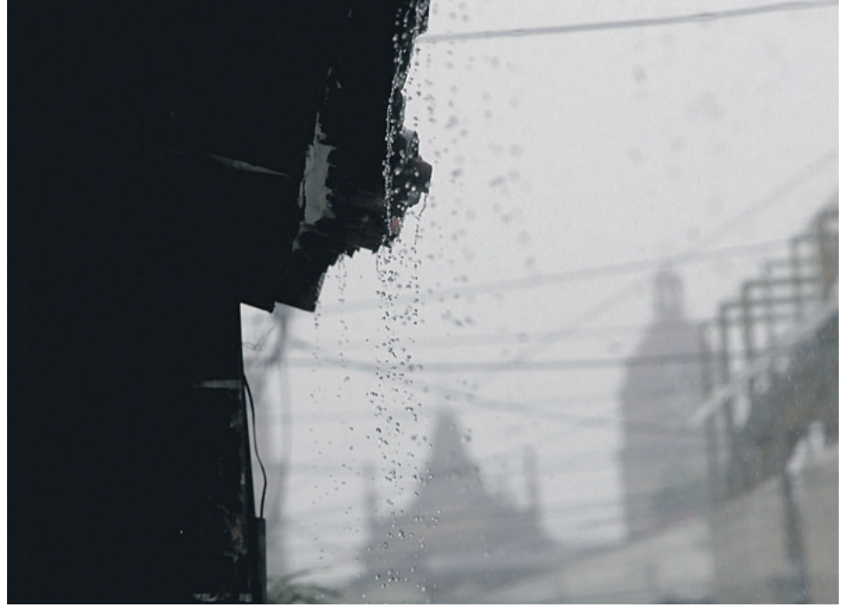
La lluvia mejoró el aire en la capital cruceña y también llegó a algunos municipios

tento a la casa, las familias están sufriendo, porque los hombres y las mujeres estamos combatiendo el fuego”, informó.