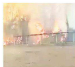
Así ardieron en Portachuelo

beneficios que los mantienen lejos de la cárcel. Ven que hay más incentivo que sanciones para los que inician el fuego. A4