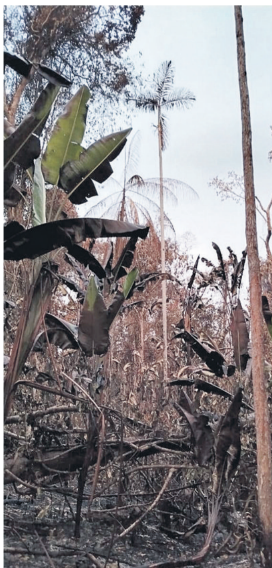
Los cultivos que se pierden en medio de los incendios

“Solo Dios puede salvarnos”, exclamaba un comunario, a punto de quebrarse en llanto ante la angustia por la gigantesca nube de humo y el crepitar del fuego que avanzaba hacia la comunidad.