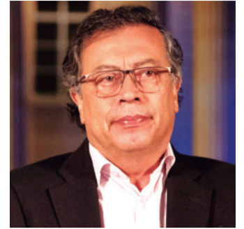
El mandatario colombiano

Según la Administración Nacional de Océanos y Atmósfera de Estados Unidos (NOAA), la temporada de huracanes en el Atlántico, que comenzó oficialmente el 1 de junio, podría tener una actividad "por encima" del promedio.