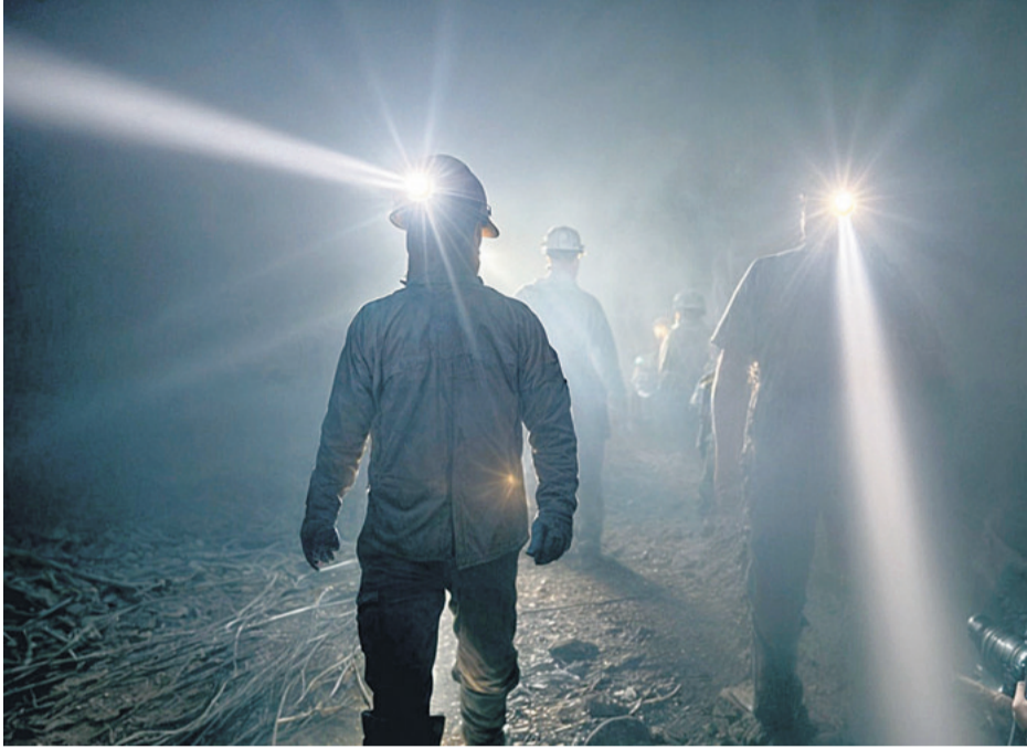
En Concepción se trabaja día y noche para controlar el fuego