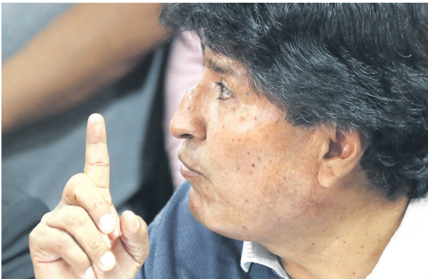
El expresidente Evo Morales debe acudir hoy a declarar a la ciudad de Tarija por un caso en contra por supuesta trata y estupro agravado.