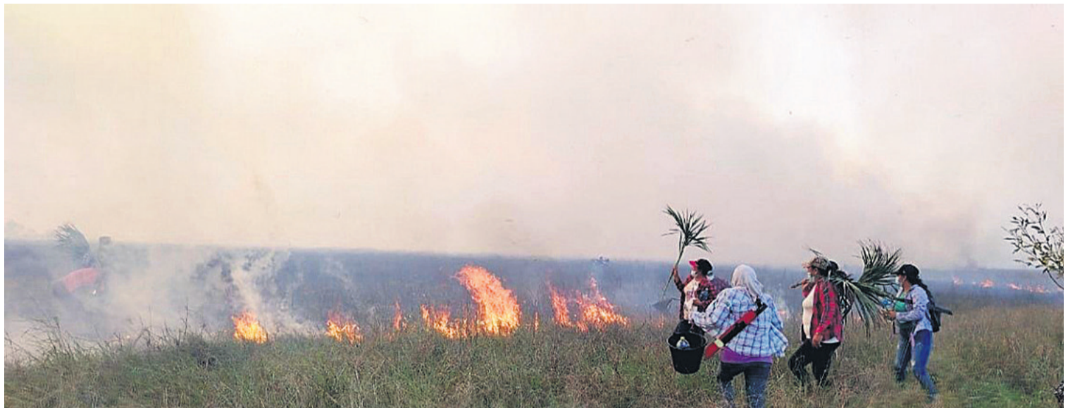
Las mujeres de la comunidad Porvenir se enfrentan a las llamas con palmas. Intentan resguardar sus planes de manejo de asaí

En Concepción, la noche del miércoles se evacuó a 30 personas de la comunidad Río Blanco de la TCO Monte Verde, la mayoría niños, porque los mayores se quedaron a ayudar en las tareas. Ignacia