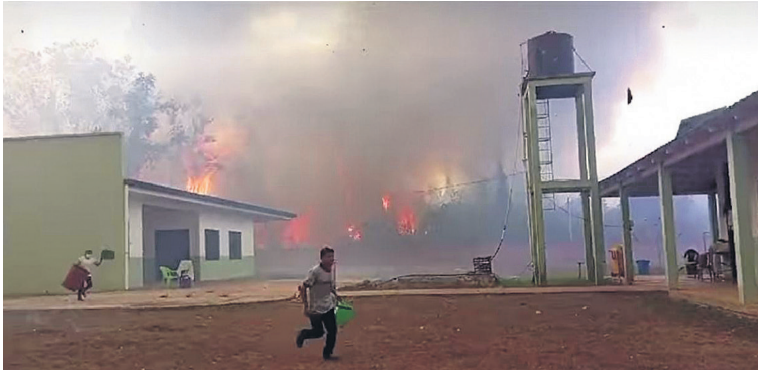
La desesperación que vivieron en Portachuelo, en el municipio de Puerto Gonzalo Moreno. Comunarios intentan resguardarse de las llamas