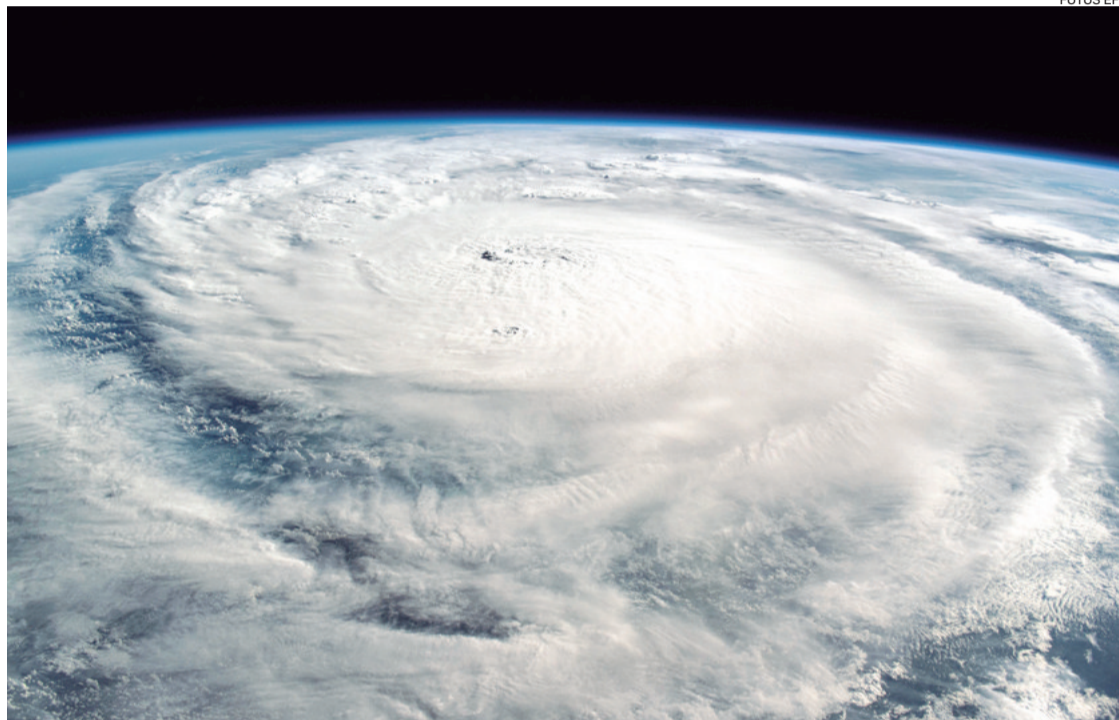
Imagen satelital de ojo del poderoso huracán Milton que llegó anoche a la turística zona de Florida

Milton es el segundo huracán que alcanza Florida en casi dos semanas, tras recibir el pasado 26 de septiembre el impacto del poderoso huracán Helene, que entró por el noroeste de este es-