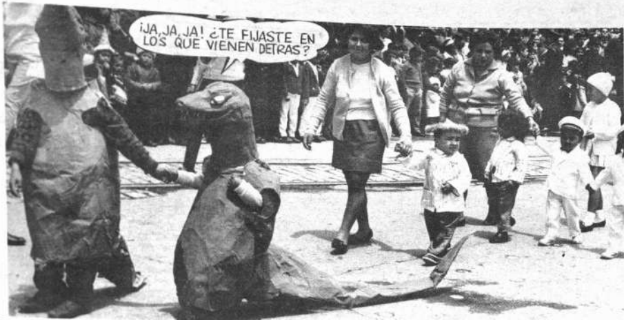
Preocupación de mamás; preocupación de papás.— El corso tiene un innegable valor y naturalmente gusta. Los niños interpretan sus papeles en forma correcta y deleitan a miles de espectadores.— El grabado muestra a los dos dinosaurios que obtuvieron el primer premio en categoría parejas.— Fue lo mejor. Después estuvo la pareja de HOY que ganó el segundo premio.