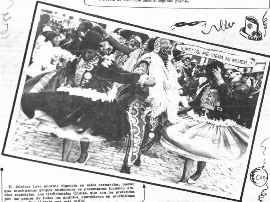
El folklore tuvo enorme vigencia en estos carnavales, puesto que muchísimos grupos autóctonos se presentaron luciendo atuendos especiales. Los tradicionales Chutas, que son los preferidos por las gentes de todos los ámbitos, aparecieron en muchísimas comparsas. Fue el traje que más brilló.