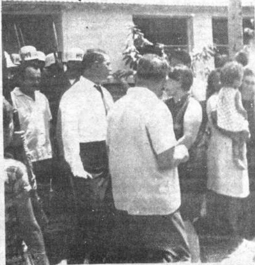
El Presidente Barrientos conversó extensamente con los habitantes de Magdalena, cuya población está nuevamente afectada por la fiebre hemorrágica.

Barrientos, en un teatro de la localidad de Magdalena se refirió a los esfuerzos que realiza el gobierno para poner fin a la epidemia e hizo entrega de 9 mil pesos para la construcción de una escuela en la población. Retornó a La Paz, a las 14 horas.