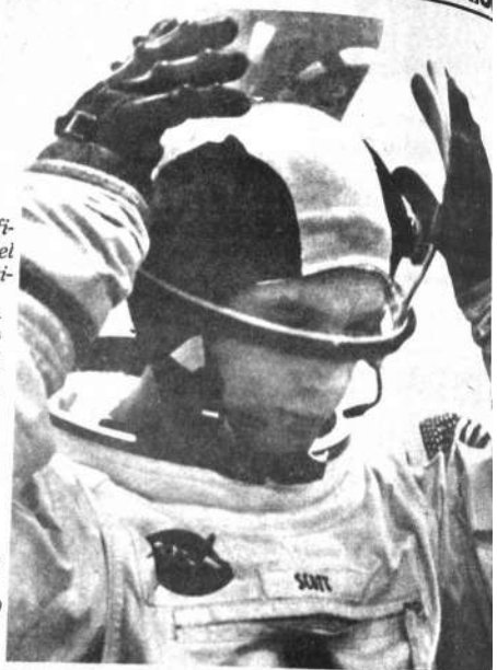
DAVID R. SCOTT, astronauta Comandante del Módulo, Titular de la Apolo 9 que iniciará su viaje de 10 días en órbita de la Tierra el 28 del presente mes. Los astronautas cumplieron exitosamente las pruebas previas al conteo definitivo.

empuje, y el Saturno 5 de tres etapas, quemando el mismo combustible, produce un total de 9.082.000 libras. Se hacía poco uso de los computadores en la cuenta regresiva de los días de Glenn.