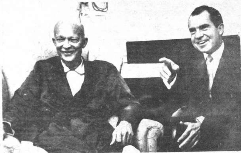
CARAS FAMILIARES.- El presidente Nixon durante la visita que hizo al ex-presidente Dwight D. Eisenhower en el Hospital Walter Reed de Washington, señala a los hombres de prensa que estuvieron en actividad durante la administración Eisenhower-Nixon, de 1953 a 1961. Conversaron aproximadamente dos horas sobre problemas del Medio Oriente, Europa y otros.

El gobernador de Nueva York adelantó que comenzará por México, en la segunda quincena de abril próximo, la misión que le encomendó el presidente Nixon en Latinoamérica. "Estoy seguro de que el incidente surgido con el Perú habrá sido solucionado para entonces, añadió Rockefeller, pues el presidente Nixon está empeñado en mantener las mejores relaciones posibles con América Latina".