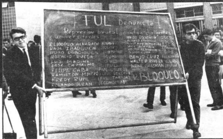
Los risueños universitarios iniciaron el bloqueo de la avenida Villazón, ayer a mediodía, como protesta por la detención de dirigentes estudiantiles. La juventud congregada en el atrio de la UMSA coreó fuertes estribillos contra el general Barrientos y condenó la actitud del Ministerio de Gobierno. No se produjeron incidentes porque a las pocas horas, por orden presidencial, fueron puestos en libertad todos los apresados. Denunciaron que no se les permitió comer, dormir e ingresar al baño, durante las veinte horas que duró la detención.

"Deben estar seguros que con estas maniobras no conseguirán sus objetivos y se adoptarán medidas que el caso aconseje" añadió.