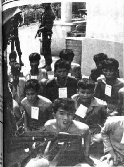
Un grupo de prisioneros Viet Cong, caídos en combate de las tropas sudvietnamitas, espera con sus tarjetas de identificación colgadas al cuello, ser trasladados por el frente de batalla.