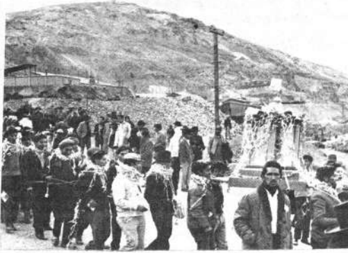
POTOSI, (HOY).— Un vista de la festividad pagano-religiosa del "día de los compadres", celebrada recientemente. La fiesta dejó un saldo de dos muertos.

SUCRE, 13 (HOY). El Presidente de la República llegará a esta ciudad el 25 de este mes para asistir al acto de entrega de obras de ampliación de la fábrica de cemento de Sucre. Barrientos, además, inaugurará los trabajos para la construcción de los servicios de agua potable y energía eléctrica.