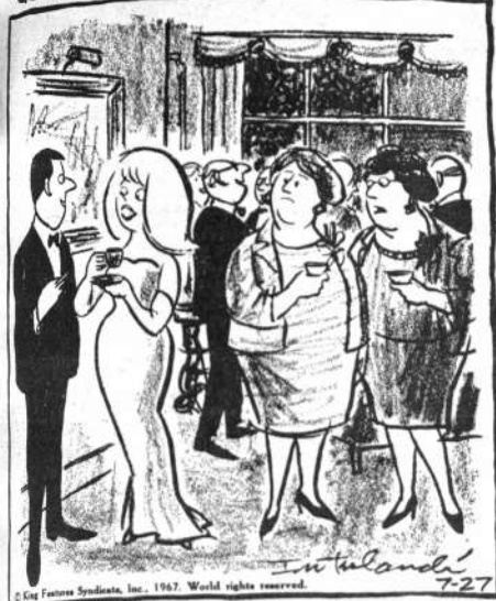
No me gusta admitirlo... pero creo que no nos hace falta el vestido, sino lo que va dentro de él...