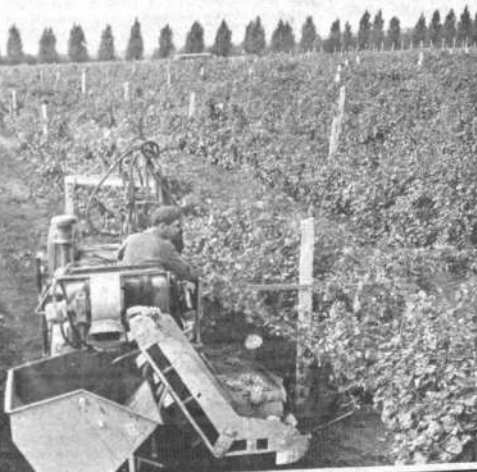
UNION SOVIETICA.— En plantaciones de la estación de pruebas de maquinaria de Moldavia, se verifica el funcionamiento de la cosechadora Moldova, que recolecta de 2 a 2 y media hectáreas en 7 horas.

El partido del congreso sufrió otra dura derrota en Penjab donde fue sumergido por la coalición nacionalista Sikh E. Hinde.