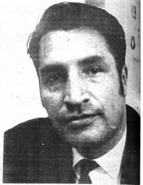
POTOSI.— Luis Ossio, jefe nacional del PDC, presidió la reunión de dirigentes de este partido realizada en la Villa Imperial. "Buscamos la formación de un frente popular de izquierdas", declaró al término de la cita democristiana.

—Es nuestra decisión buscar y formar un frente popular de izquierdas para las elecciones de 1970. De concretarse, concurriríamos con un binomio surgido de este frente. Caso contrario, formaremos una fórmula propia para esa contienda electoral. Iremos con un binomio de coalición, siempre que haya afinidad con nuestros principios. Aquí tenemos que enfatizar que las elecciones son incidentales, mientras que los principios son permanentes.