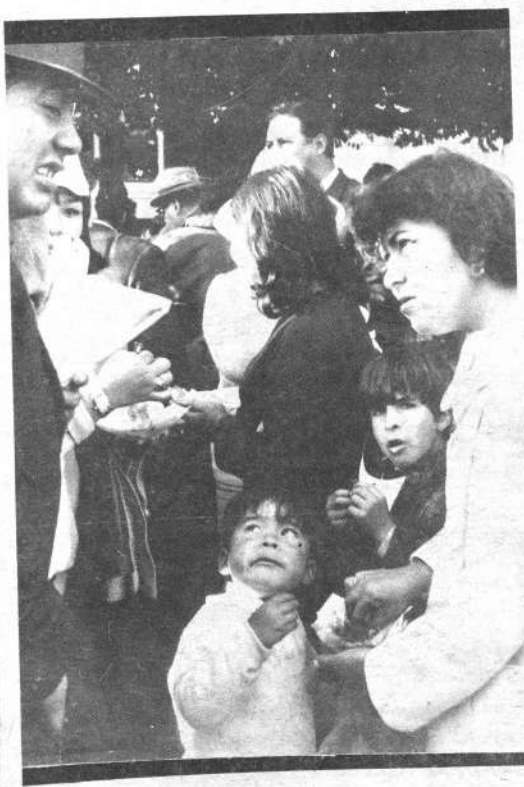
La familia en pleno le da "con todo" a los chicharrones. Quizá no hubo tiempo de cocinar en la casa o el partido era tan importante que había que "madrugar" para poder encontrar buena ubicación. De cualquier manera, la expresión en los cuatro rostros es por demás elocuente.