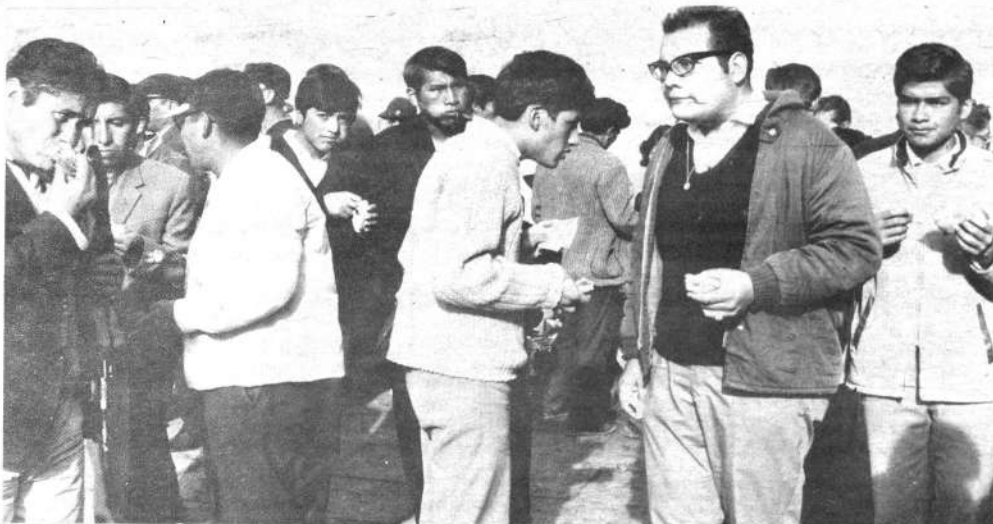
El lente fotográfico sorprendió a este grupo de entusiastas devotos de la comida casera. Entre ellos resalta el señor de anteojos que parece hacer un esfuerzo notable para deglutir el "bocadillo" mezcla de pan, carne y cualquier cantidad de condimentos.