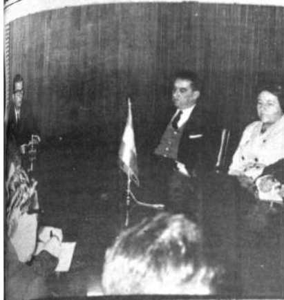
El gerente de la Pesuella ofreció la cooperación del BID frente al problema que sufre el país, a raíz de la baja de los precios del estaño.