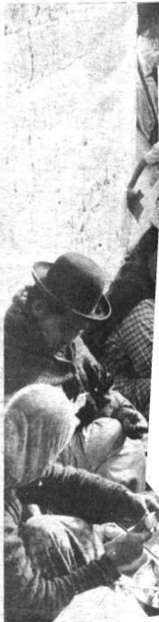
Las chicharronas ofrecen sus pintorescos. La presentación juega. El estómago vacío está. tión es saber donde er