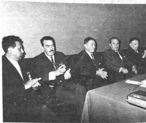
El presidente Barrientos, el Ministro de Salud y otras autoridades asis-

Por su parte, el Ministro de Salud, Jorge Rojas, dio la bienvenida a los participantes y di-