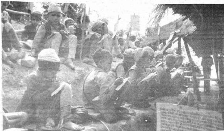
ESCUELA PRIMARIA EN NEPAL.— Una de las necesidades urgentes de los países en desarrollo es la instrucción de los adultos que pueden aplicar inmediatamente sus nuevos conocimientos. Muchos gobiernos se afanan por aumentar el número de escuelas primarias y eliminar el analfabetismo de raíz.

Jerusalén, febrero 11 (AFP).— El Primer Ministro israelí Levi Eskhol siguió tratando hoy de evitar una crisis gubernamental mientras con-