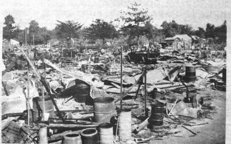
TERRORISMO.— La fotografía muestra el estado en que quedó el villorrio My. Can A., en Vietnam del Sur, después de un ataque terrorista del Viet Cong. El sector quedó destruido, y 150 familias sin hogar.

La declaración de Caldera hace prever que su primer gabinete será monocolor, o sea social-cristiano, matizado por algún independiente. De ello se deduce los acuerdos que el partido social-cristiano logre con otras agrupaciones políticas para asegurar una mayoría en el congreso.