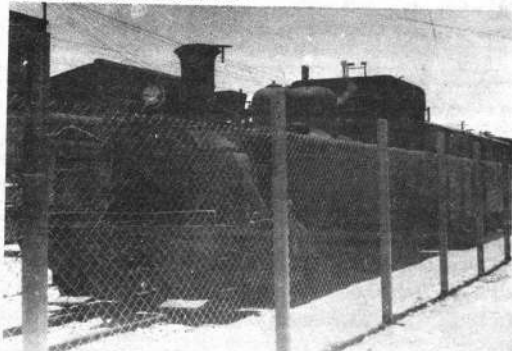
ORURO.— La Alcaldía Municipal, en labor conjunta con la Empresa Nacional de Ferrocarriles, entregaron al servicio público la malla de protección de la avenida 6 de Agosto, arteria cercana a la vía por donde transitan locomotoras de la entidad estatal.

Finalmente, también se estima factible la construcción de una "Ciudad del Niño", incluida en el plano de esta obra de gran envergadura en materia de progreso urbano.