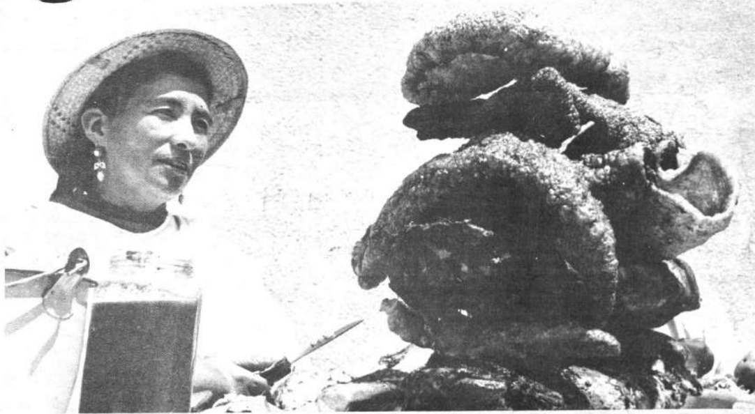
Tal fue el insistente pedido del "cuero", después de un sandwich, que las vendedoras no tuvieron más alternativa que "fabricarlo" en cantidades industriales. Pero lo extraño del caso es que el volumen del "cuero" no está de acuerdo con el

de la carne. Se empieza a dudar sobre la elaboración de este complemento y hay quien afirma que existe una elaboración sintética del mismo.