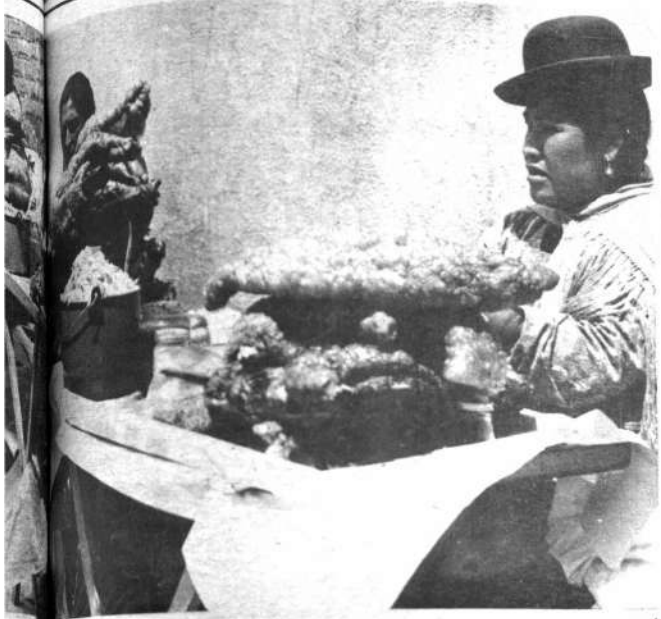
... minutos para que termine el partido, después vendrá la "avslancha" dispuesta a terminar con la bien nutrida existencia comestible.

Las vendedoras de comida en el Estadio Hernando Siles constituyen un gremio pintoresco.