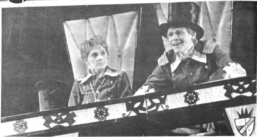
Espectáculo "El rey Mátiush Primero"