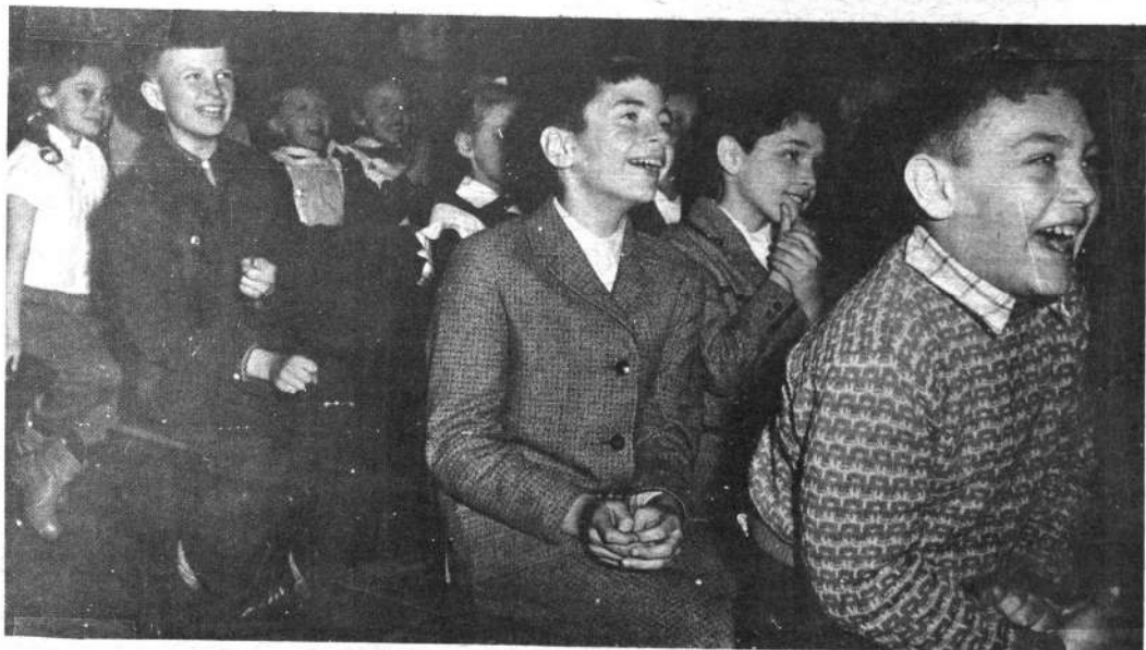
En el Teatro Central Infantil se escuchan sonoras carcajadas de los asistentes.

l é li p de tri co. me fieri lar el r Lá res, sino antip tos pe El p vez: "S den, ha vocan! Elevars los".