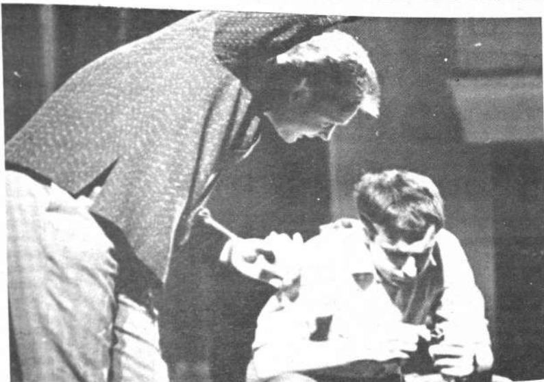
Escena del espectáculo "Antes de cenar"