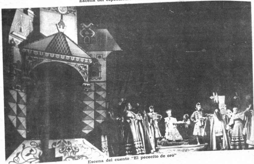
Escena del cuento "El pecesito de oro"

espectáculos infantiles. varios meses se considera del 15 de Leningra- totalidad a espectador. grada de parte cuando representa-