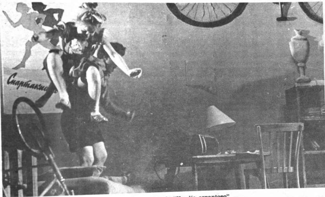
Escena del espectáculo "Un día espantoso"