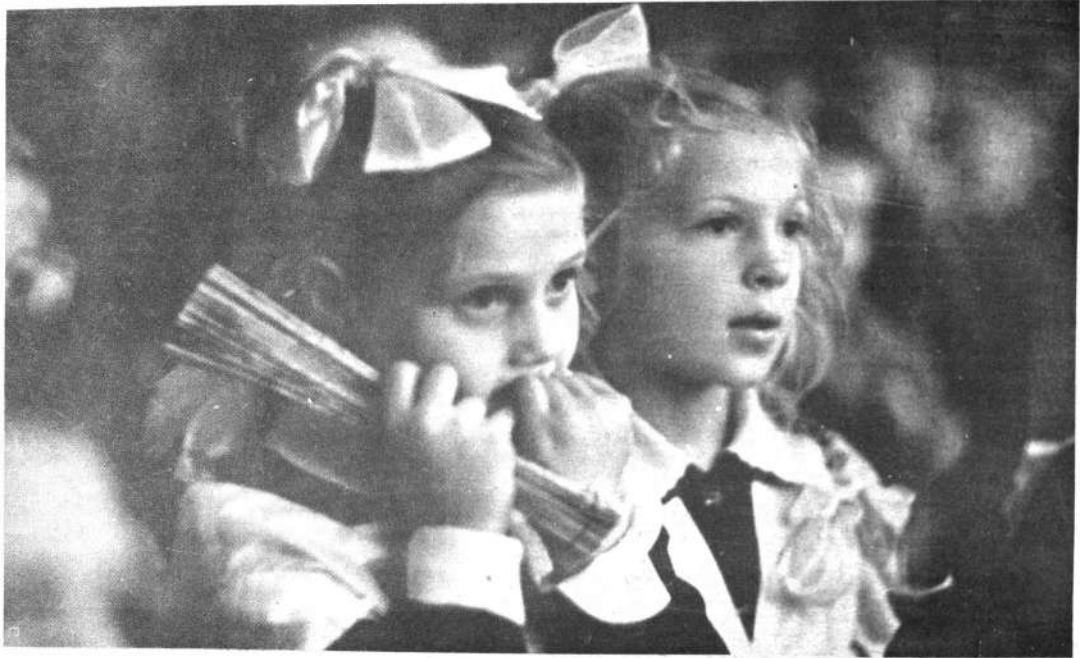
Emocionados espectadores del Teatro Central Infantil.