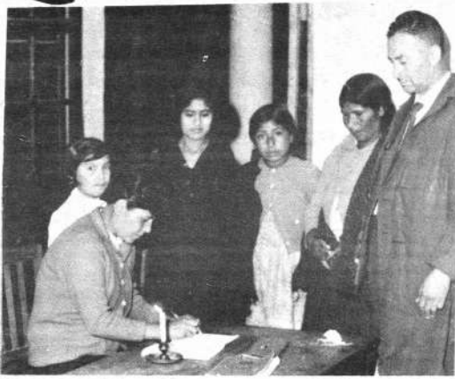
Sucre. — La falta de luz en locales escolares, determinó que las inscripciones se realizaran con vela, como lo ilustra la foto. Mujeres del pueblo concurren a registrarse para los cursos de alfabetización.