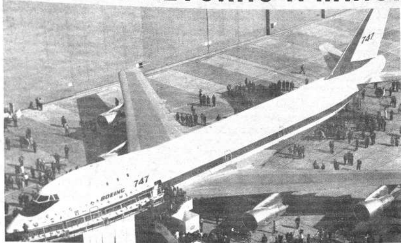
JET GIGANTE. — El avión más grande del mundo, el Boeing 747, hizo su primer vuelo de prueba. Su tamaño, en posición vertical, alcanza la altura de un edificio de 20 pisos y sus cuatro gigantes motores son asombrosamente silenciosos. Tiene capacidad para 490 pasajeros y una velocidad de 1.000 kilómetros cruceros por hora.

Tho desmintió los rumores de que podía llevar a Hanoi una nueva proposición de la delegación norteamericana. La impresión general fue de que iba a Hanoi para nuevas consultas. Esta es la tercera de sus partidas para tales propósitos desde que llegó al pasado junio. En cada viaje se ha detenido en Moscú y Pekín para hablar con dirigentes rusos y chinos. Se presume que esta vez hará lo mismo.