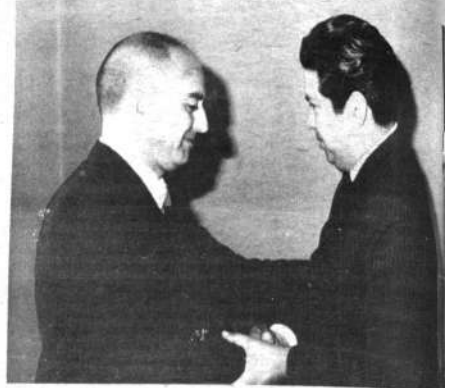
El nuevo Ministro de Hacienda, al ser posesionado, insistió en la necesidad de fomentar las tributaciones al Estado.