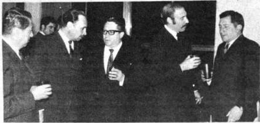
El ministro de Agricultura ofreció un cóctel a los Ejecutivos del B.I.D. en el Restaurante Las Vegas. Concurrieron el canciller boliviano y ministros de Estado. En la nota gráfica un aspecto de la reunión.