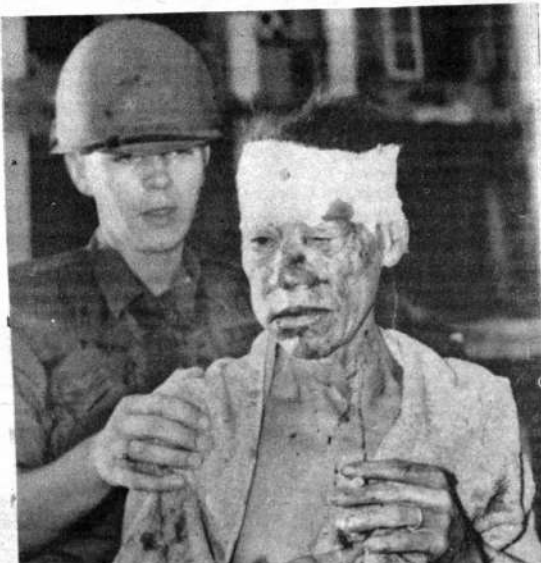
SAIGON.— Un soldado norteamericano ayuda a un poblador sudvietnamés después de haber recibido curación de las heridas producidas por un reciente acto terrorista en esa capital.

"Estamos dispuestos a sentarnos de nuevo con los israelíes, después de la evacuación de los territorios árabes ocupados, como lo hicimos después de la guerra de 1948 y hasta la guerra de 1956", indicó Nasser.