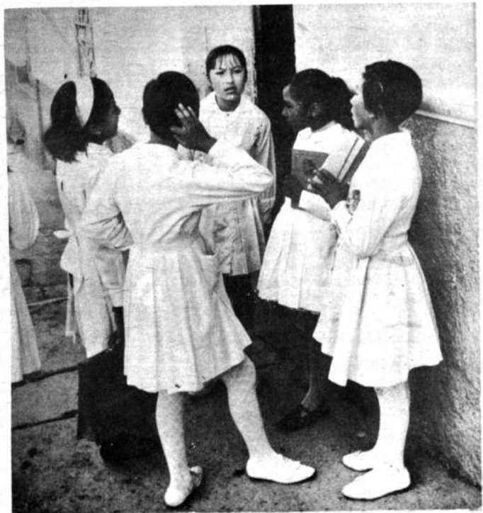
Después de una prolongada vaca- ción, son tantas las cosas que tienen para contar las compañeras de escuela. Unas viajaron, otras leyeron algún li- bro interesante, quizás algunas, las mayorcitas, tuvieron la oportunidad de conseguir sus primeros amigos. Todas estas cosas, naturalmente, interesan sobremedida a las "viejas" amistades del colegio.