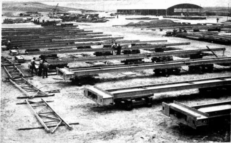
ORURO.— A ritmo acelerado continúan los trabajos de las obras civiles que culminarán con la instalación de los hornos de fundición de estaño en Vinto. Se trata de la primera planta estatal que fundirá este mineral en el país. En esta obra, una de las más importantes que encara el Gobierno, trabajan ingenieros, técnicos y obreros bolivianos. Los hornos de fundición serán una realidad a breve plazo.

El anuncio de este proceso ha creado un ambiente de tensión en los sectores laborales de Cochabamba.