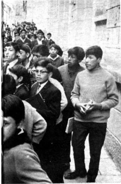
aglomerados en las esquinas, comentan- tencias de su "primer enfrentamiento" con pes.