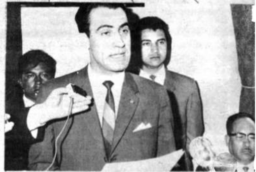
Los ministros de Educación y Asuntos Campesinos inaugurando ayer el año escolar 1969.

"El bachiller —dijo— en tantos casos, ya no será el que familiar que tiene sólo metas, el fracaso o la frustración, al contrario, será un hombre de provecho, logrando para un quehacer cotidiano".