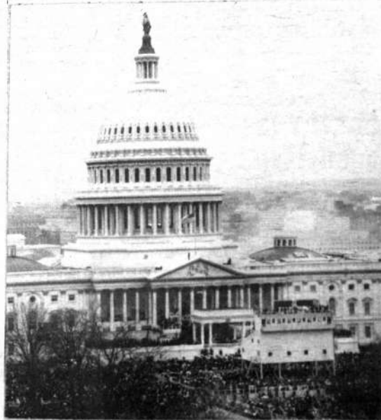
WASHINGTON.— Delante del Capitolio, desde una tribuna especialmente adaptada, Richard Nixon pronuncia el discurso inaugural de su gobierno.

La condición de Washington será sin duda que la colaboración de los cuatro consista e-