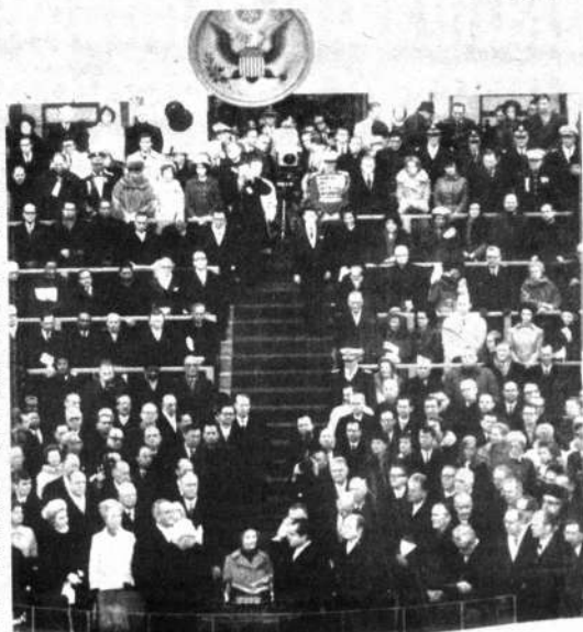
JURAMENTO.— Vista parcial de la escalinata del Capitolio de Washington, cuando el Presidente Richard Nixon prestaba juramento el 20 de enero pasado.

"Time" concluye recordando que Wahabing ton ha dicho ya que considera el plan Allon como carente de toda probabilidad de aportar una paz verdadera al Oriente Medio y que ha pedido a Israel la propuesta de "un plan más realista".