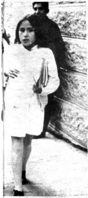
arse. Inmediatamente, vienen esas de estudiar mucho y de curso con notas elevadas.