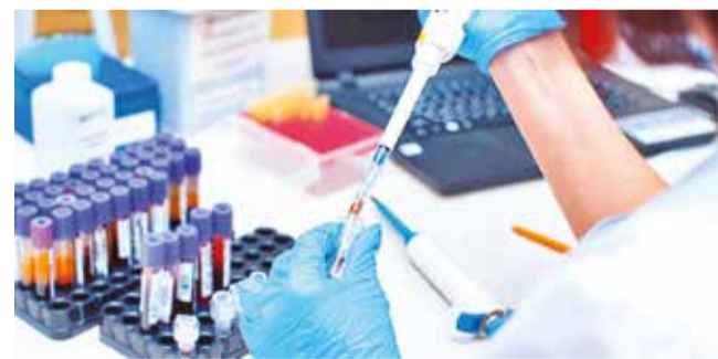
Análisis de las muestras en controles antidoping.

Polideportivo. La Federación Atlética de Bolivia invirtió más de 3 mil dólares para realizar pruebas durante esta temporada