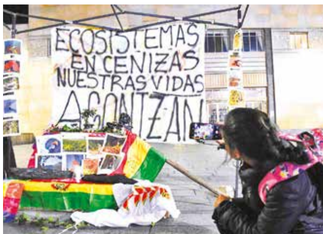
Activistas promueven la consulta medioambiental.

Además, 41 viviendas en tres departamentos fueron arrasadas por el fuego, según el Viceministerio de Defensa Civil, que prometió que estas casas serán reconstruidas por el Gobierno.