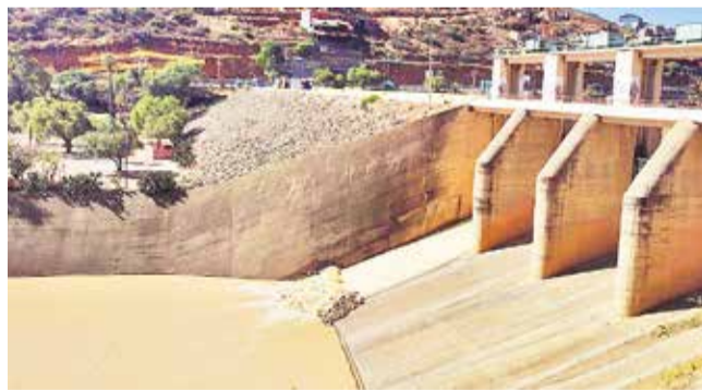
El desfogue de agua de la represa de la Angostura.

Mitigación. La Gobernación gestiona una quinta estimulación de nubes para combatir la crisis hídrica que afecta a 19 municipios