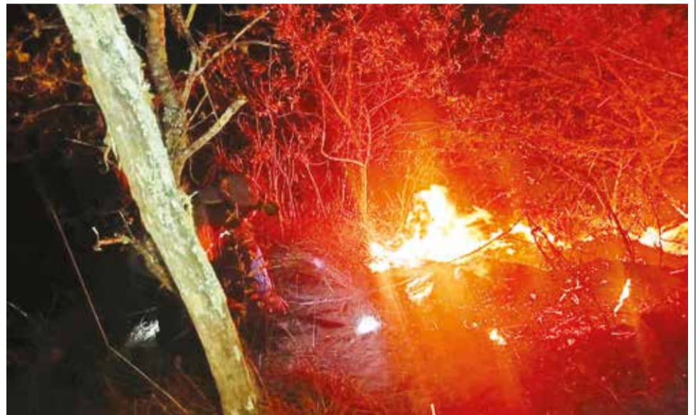
El fuego persiste en las áreas forestales del municipio de Roboré. GADSC

Recomendó la aplicación inmediata y rigurosa de la ley, sin ningún tipo de injerencia política para identificar y sancionar a los responsables. Asimismo, instó de manera urgente a las autoridades y a la población a iniciar un proceso de "construcción de un pacto social por los bosques" para evitar un nuevo desastre en 2025.