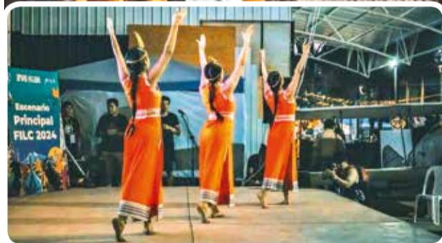
Postales de las presentaciones artísticas que se realizan en la FILC.

horarios, los niños aprenderán sobre el valor de la naturaleza, la diversidad cultural y la importancia del cuidado del medioambiente.