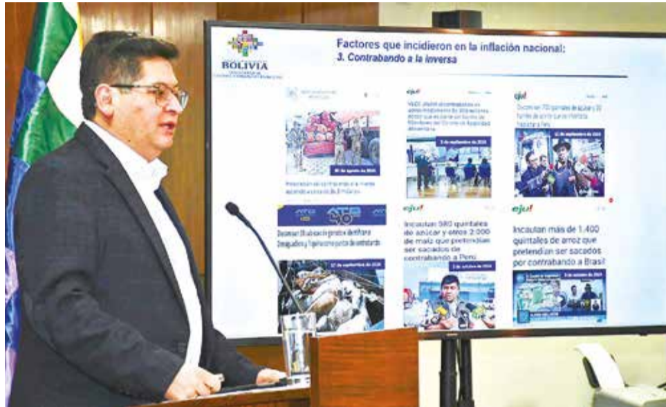
El ministro de Economía y Finanzas Públicas, Marcelo Montenegro, ayer.

“El poder adquisitivo respecto al dólar puede tener un parangón de ese nivel (del 40 por ciento), pero si observamos el índice de precios, el Gobierno ha logrado mantener una notable estabilidad en el costo de vida”, afirmó el ministro, subrayando la fortaleza del Modelo Económico Social Comunitario Productivo, que ha permitido a