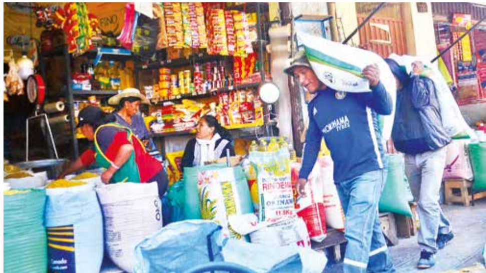
Productos de la canasta familiar en un mercado de Cochabamba. DANIEL JAMES

“Estamos tomando decisiones firmes para proteger nuestros productos nacionales. No podemos permitir que alimentos esenciales para nuestra población salgan del país de manera ilegal y encarezcan el costo de vida de los bolivianos”, declaró Arce. La militarización incluye el despliegue de efectivos de las Fuerzas Armadas en los puntos fronterizos más vulnerables, así como la implemen-