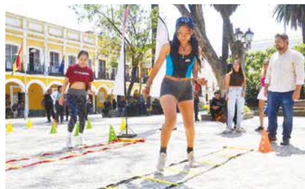
La presentación de la carrera Power, ayer. HERNÁN ANDÍA

“Hemos reiterado en muchas oportunidades que se debe priorizar la seguridad alimentaria y no otras cosas”, añadió. Claros remarcó que el tribunal definirá también el caudal mínimo de la represa.