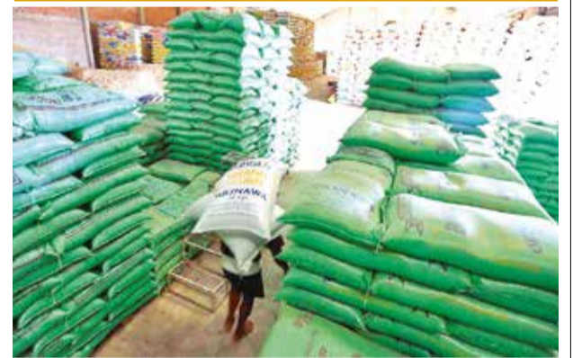
Uno de los ingenios arroceros en Santa Cruz. APG

En Cochabamba, también se observaron largas filas de vehículos esperando diésel, a pesar de que el combustible llegó en la mañana, prolongándose las filas hasta pasado el mediodía.