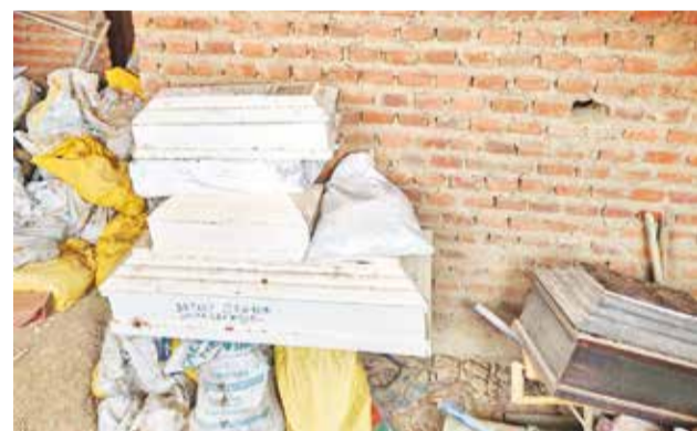
Los restos hallados en un ambiente precario.

Entre tanto, desde el Servicio Nacional de Meteorología e Hidrología (Senamhi) se pronosticó el ascenso de temperaturas en los valles sin precipitaciones hasta este jueves, lo que podría incidir en que la contaminación persista en los próximos días en la región metropolitana.