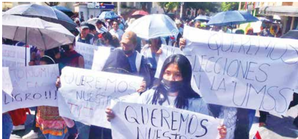
Estudiantes de la UMSS protestan por trámites postergados ayer.

“La universidad ha quedado en un serio problema de funcionamiento. No tenemos ocho decanos de las 14 facultades. Para hablar más estrictamente, los diplomas académicos que sacan los profesionales de la universidad son firmados por los decanos y, como no hay autoridades des-