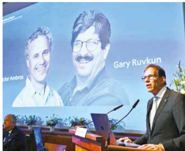
Los científicos estadounidenses Víctor Ambros y Gary Ruvkun.

El Comité Nobel recordó que la información genética