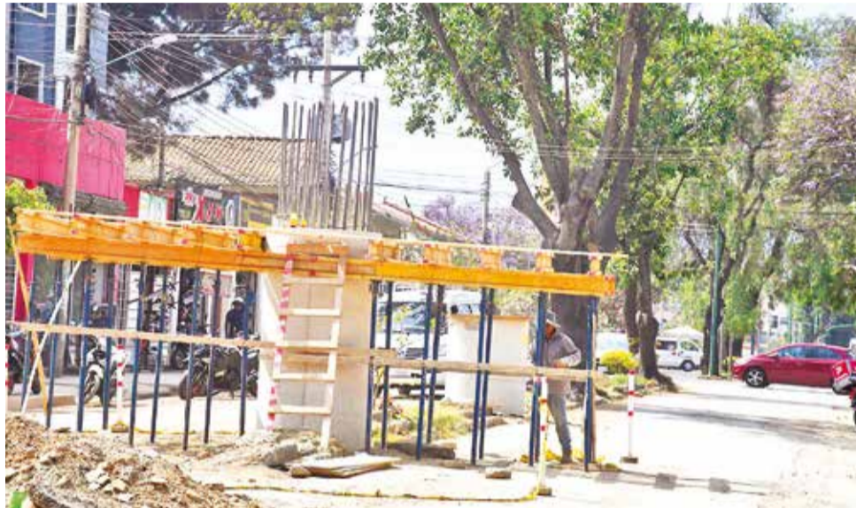
Los trabajos del distribuidor de la avenida Perú y Blanco Galindo. CARLOS LÓPEZ

La obra se inició en junio de este año con más de 40 perforaciones de 20 metros de profundidad y el cierre de vías, según antecedentes del tema.