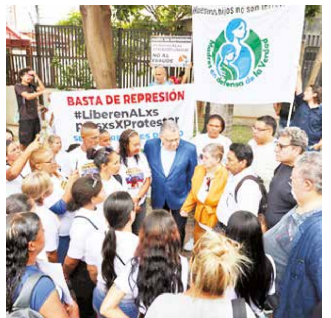
Familiares de los adolescentes detenidos en Venezuela.

Italia y Argentina reiteraron “la necesidad de que la Oficina del Alto Comisionado de las Naciones Unidas para los Derechos Humanos regrese inmediatamente a Caracas”.