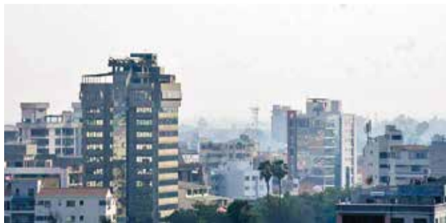
Una vista de la ciudad contaminada por el humo.

Agravantes. La q'oa del primer viernes y el reporte de una quema de magnitud incidieron también en el aumento de la contaminación