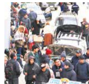
Colas en la venta física de las entradas en El Alto.

parte de estas entradas cayó en manos de revendedores, quienes venden las mismas hasta en más del triple del costo original.