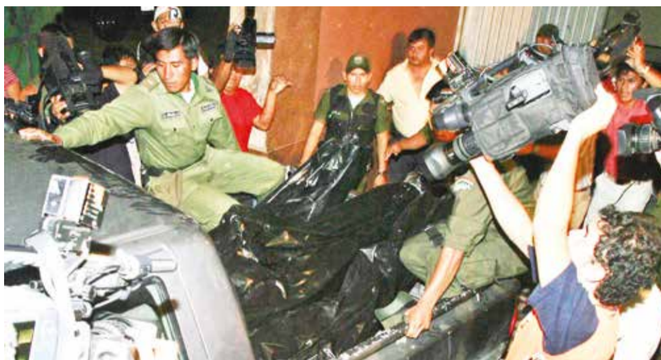
Acciones policiales en 2009 en Santa Cruz contra presuntos "terroristas".