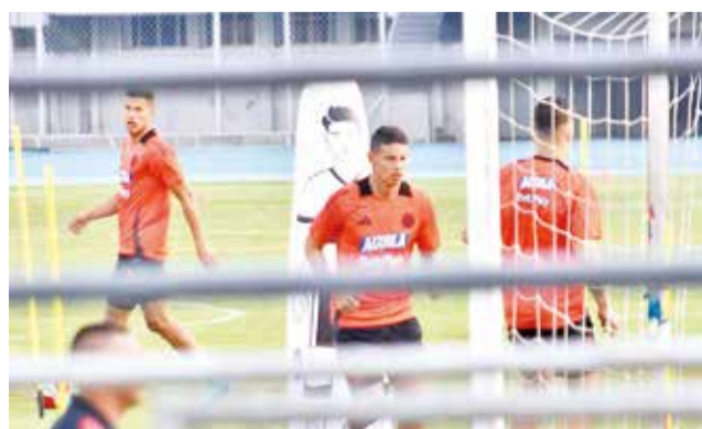
James Rodríguez en la práctica de Colombia, ayer.