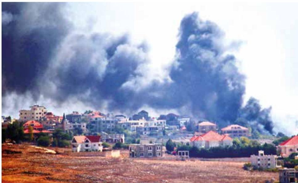
El humo se eleva tras un ataque aéreo israelí cerca de las aldeas de Kham y Kfar Kila, en el sur de Líbano.

A pesar del rápido aumento del ritmo de las operaciones militares israelíes, Hezbolá también disparó decenas de