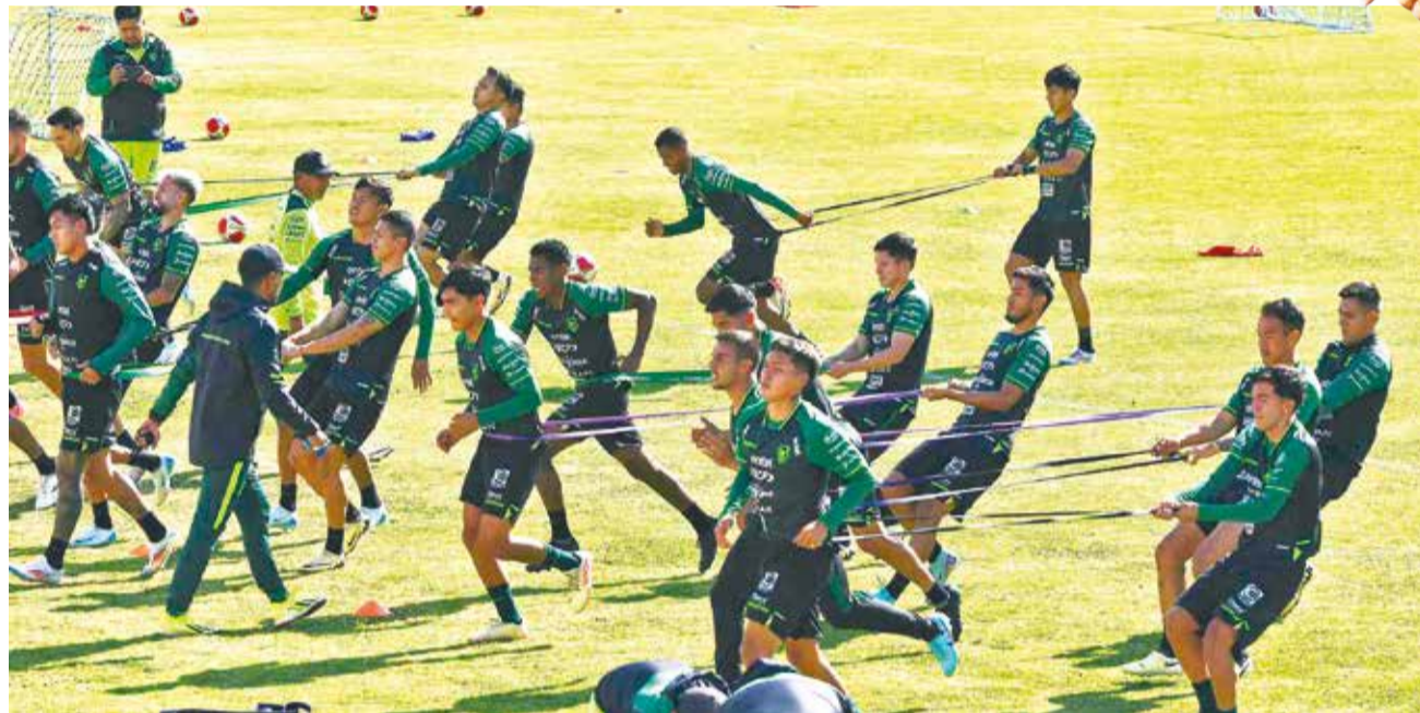
Entrenamiento de la Selección Nacional.

Selección. El director técnico de la Verde sostuvo que el equipo está preparado para brindar un buen fútbol y a partir de ello intentar ganar. Bolivia recibirá a Colombia este jueves desde las 16:00 en El Alto