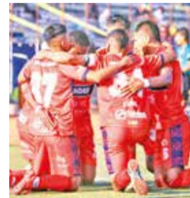
El equipo de la U de Sucre festeja la victoria. U.S.