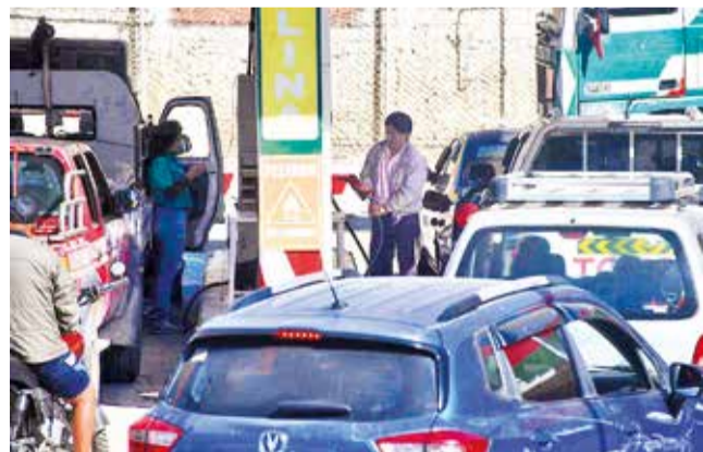
Vehículos hacen fila en un surtidor de Cochabamba. C.L.

Preocupación. Durante el fin de semana se observaron largas filas en algunas ciudades, generando inquietud entre los usuarios