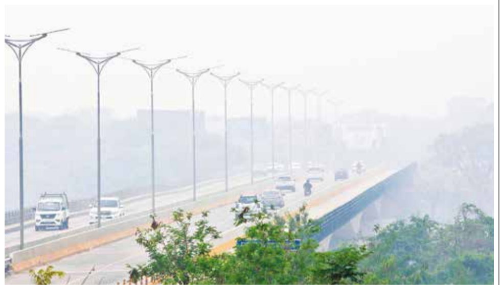
La densa humareda de los incendios en Santa Cruz.