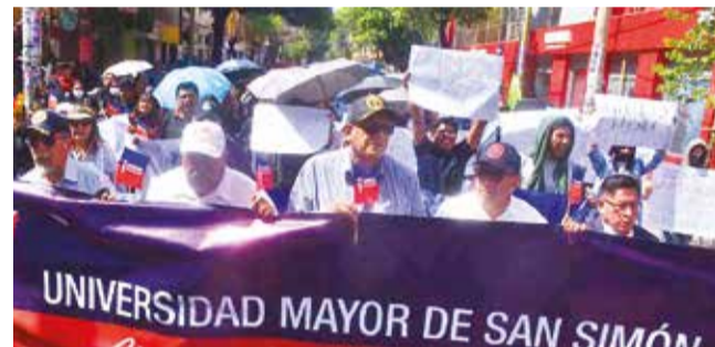
Docentes y administrativos marchan por la autonomía.