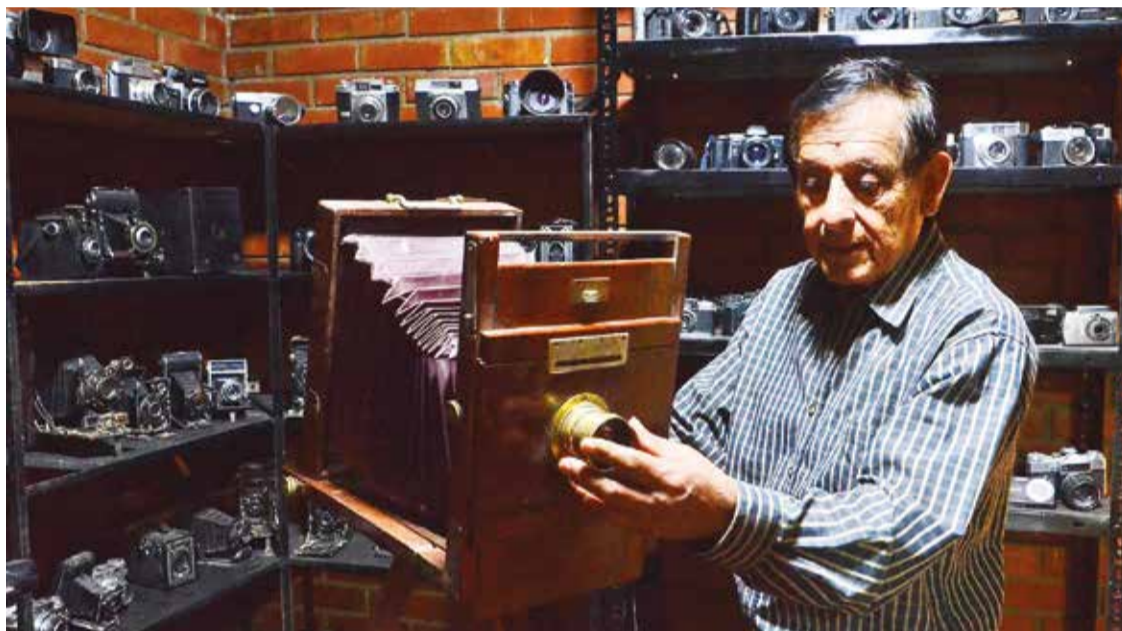
La galería exhibe más de mil fotografías de Quillacollo.

Posteriormente, su hijo Tito Terán Ledezma siguió los pasos de su padre y se apasionó por la fotografía y des-