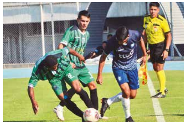
Incidentes de un encuentro del club cochabambino Tiquipaya FC. HERNAN ANDIA

Cabe recordar que los ganadores de las llaves de esta fase avanzarán a cuartos de final, razón por la que los equipos disputarán sus encuentros sin margen de error.