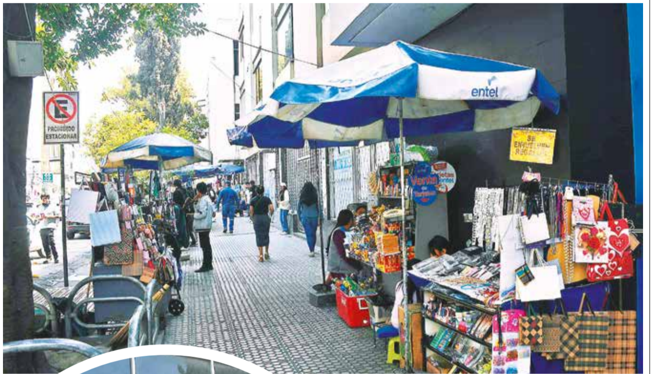
Algunos comerciantes asentados por El Correo.