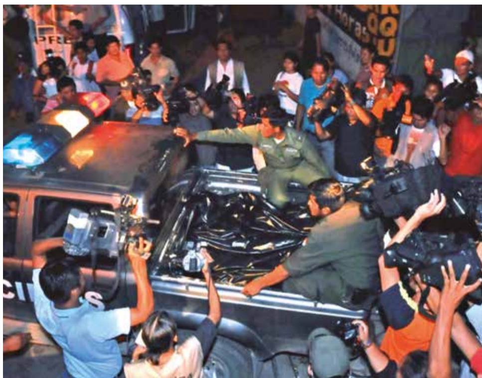
Operativo en el Hotel Las América, en Santa Cruz, en 2009.

En su Informe de Fondo 394/21, la CIDH remarcó “la falta de investigación y esclarecimiento sobre la muerte de Dwyer y atribuyó al Estado la