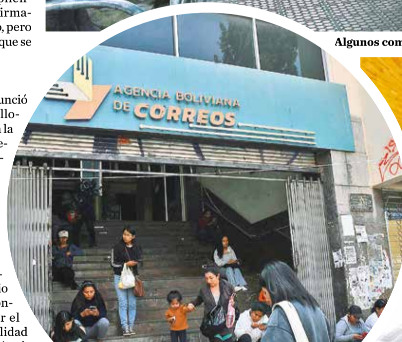
Vendedores proliferan en la puerta del Correo. C. LÓPEZ