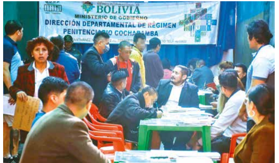
El inicio del plan de descongestión en las cárceles de Cochabamba. JOSE ROCHA

En cuanto a la vivienda, si esta es apta o no para una detención domiciliaria, según los vocales, los jueces toman en cuenta el informe del Ministerio Público.