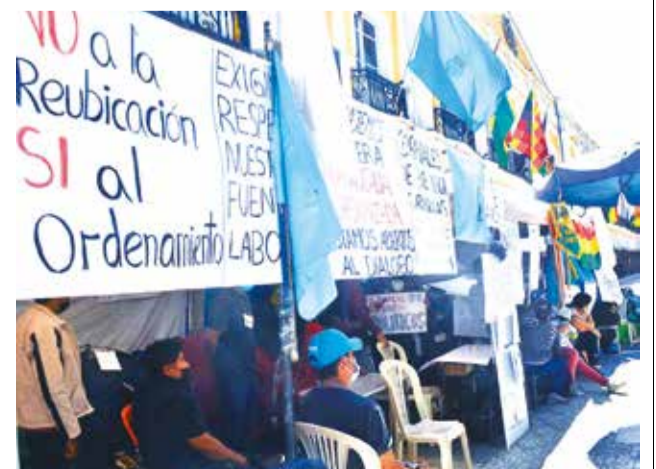
La huelga de comerciantes en 2022. JOSÉ ROCHA