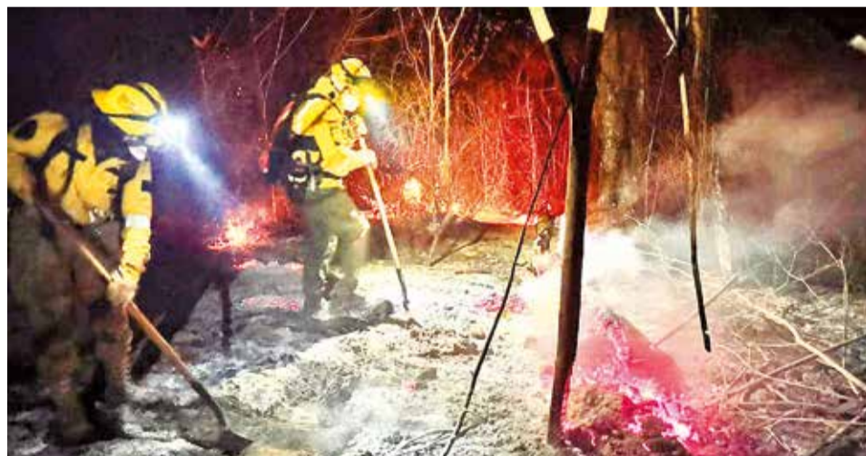
Bomberos sofocan el fuego en la Chiquitania.

Desde ayer, un helicóptero Airbus H145 con capacidad de descarga de 1.230 litros de agua se suma a la lucha aérea contra los incendios forestales, principalmente, en la Chiquitania boliviana. “Queremos agradecer a la República de Chile por su colabo-