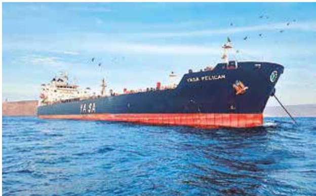
Descargue de petróleo en Arica. YPFB