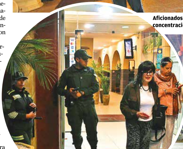
Efectivos policiales custodian la entrada al cuartel general del cuadro cafetero.