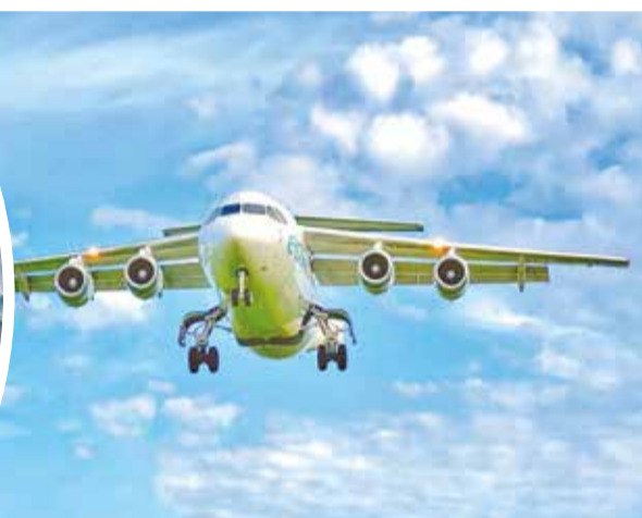
El avión cuatrimotor tripulado por sólo mujeres. ECOJET