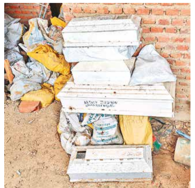
Los restos hallados en condiciones precarias.