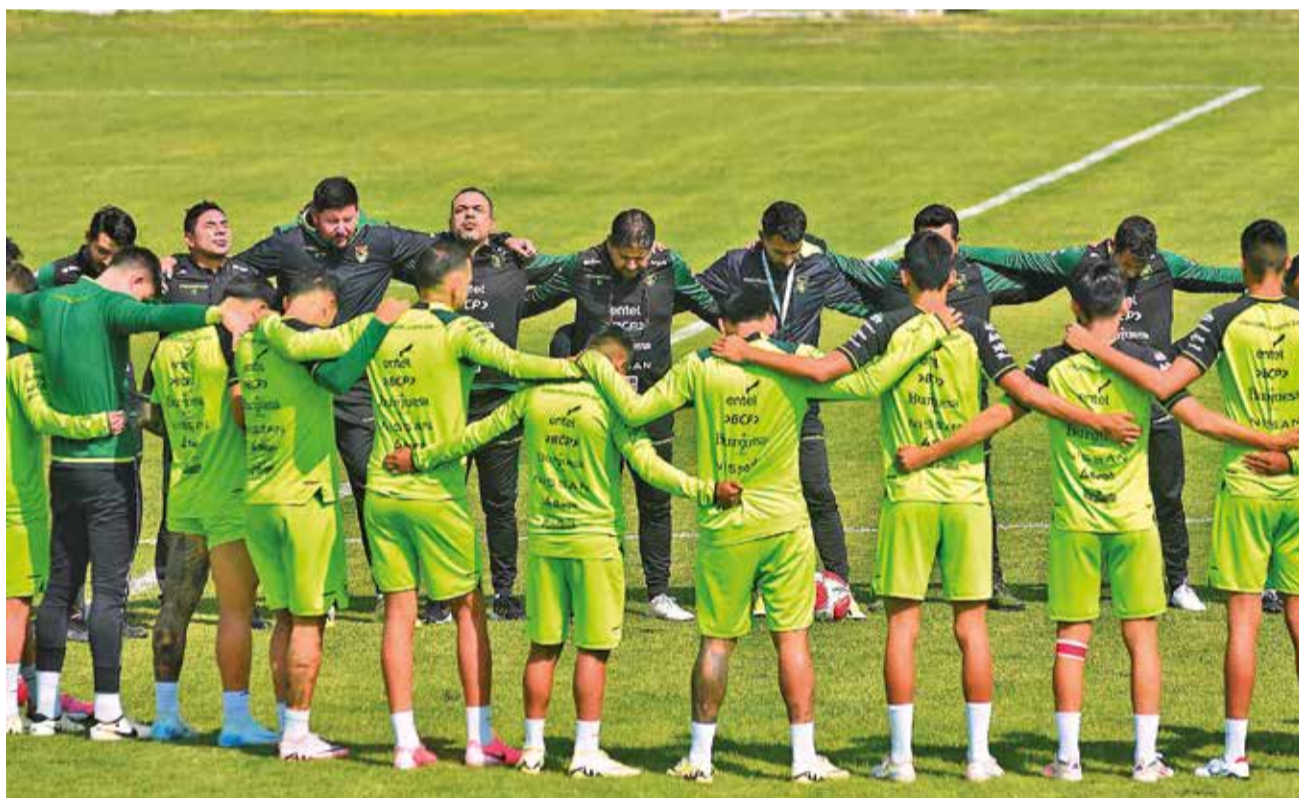
Integrantes de la Verde antes de iniciar la práctica en el estadio Rafael Mendoza Castellón, ayer. APG