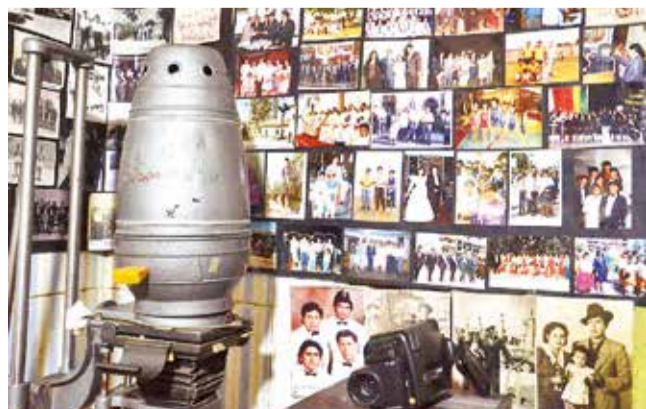
El sitio resguarda la historia de Quillacollo en fotografías.

“Las imágenes se convirtieron en un testimonio visual invaluable que ha preservado momentos únicos que, de otro modo, se habrían perdido”, dijo.