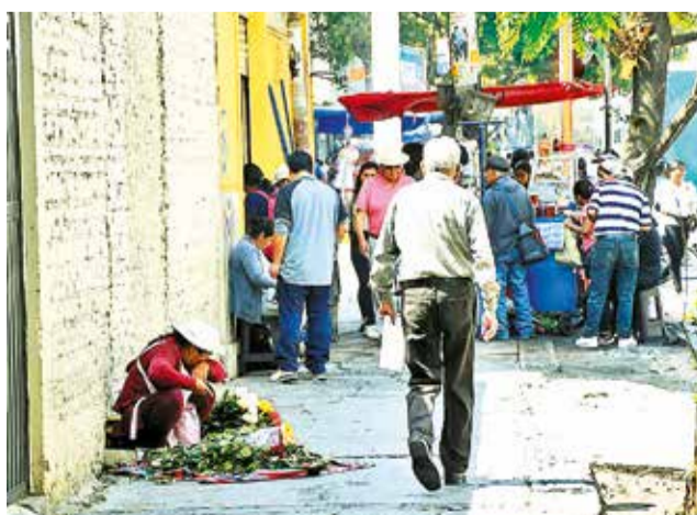
El comercio informal en la zona. CARLOS LÓPEZ