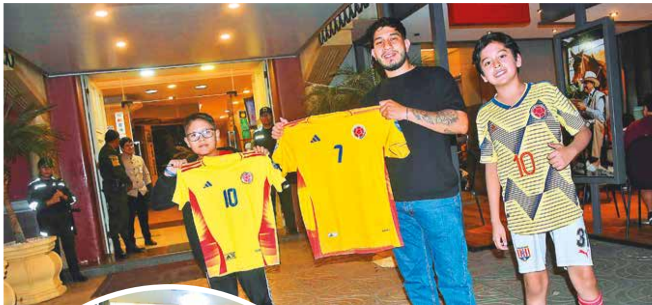
Afanados del equipo colombiano en la puerta del hotel de concentración, ayer.

En ese contexto, la primera sesión de la selección de Colombia se desarrollará hoy