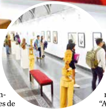
Los salones donde se exponen las obras de varios artistas plásticos. HERNÁNDEZ ANDÍA

Camacho plasma su fascinación por la naturaleza viva, casonas de antaño y paisajes de diferentes regiones de Bolivia.