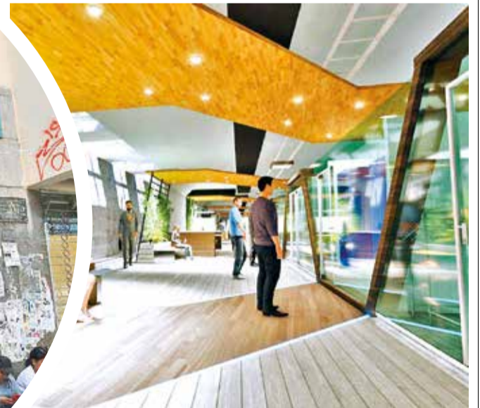
El diseño del proyecto de la galería subterránea. GAMC