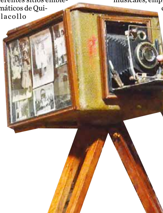
El museo fotográfico Federico Terán Cherry.

El museo fue inaugurado el domingo 22 y se encuentra ubicado cerca del puente Panamericana, en Quillacollo.