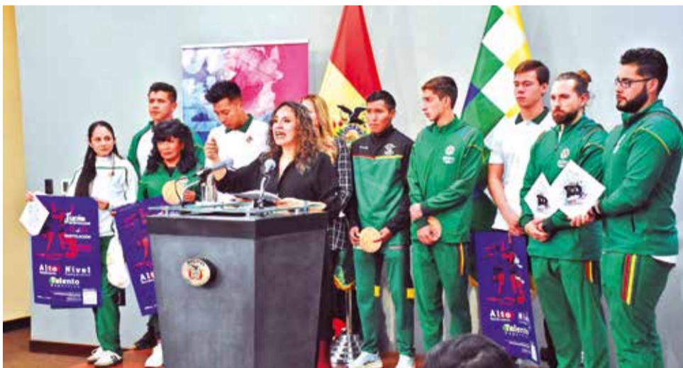
Presentación de las becas económicas Sueño Bicentenario.