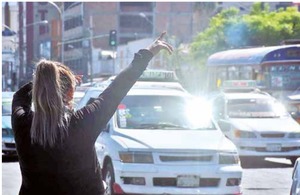
Algunos autos del transporte libre de Cochabamba que prestan servicio público.

El dirigente del transporte libre enfatizó que el 2023 el ministro de Gobierno, Eduardo Castillo y el viceministro de Seguridad Ciudadana sus-