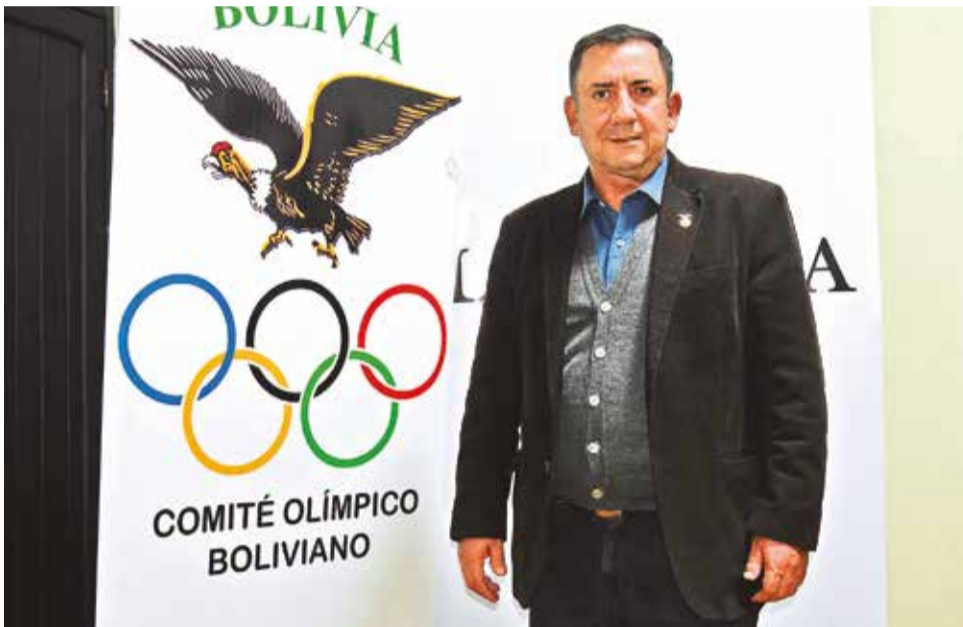
El presidente del Comité Olímpico Boliviano (COB), Marco Arze. AFPZXCVCZCV

Las federaciones nacionales no reciben un presupuesto económico del Estado desde marzo de 2014.