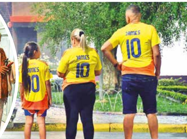
Residentes colombianos en Cochabamba lucen la casaca que identifica a James Rodríguez.

(16:00) en el estadio Félix Capriles a puertas cerradas.