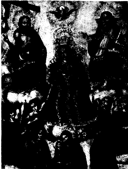
"Virgen del Rosario" de Gaspar Miguel de Berrío. Oleo sobre lienzo que corresponde al siglo XVIII.

Pese a la desaparición de varias obras del citado maestro, museos de Bolivia, Argentina, Chile y España conservan muchos de sus lienzos. La Casa Nacional de Moneda guarda la mayor colección en la que se admiran, entre otras, San Pedro de Alcántara, San Francisco en Oración, San Mateo, La Sagrada Familia, Cristo Salvador del Mundo, La Adoración del Niño y otros.