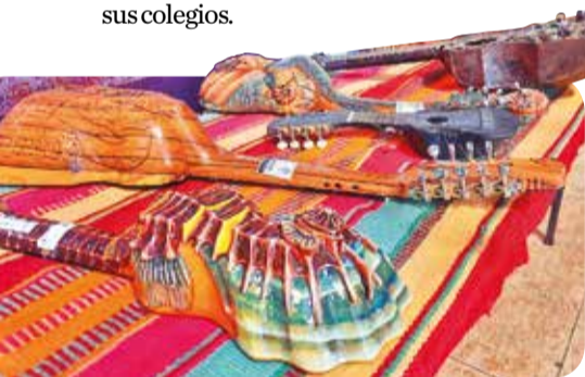
Exhibición de charangos. LOS TIEMPOS

Estas actividades serán difundidas cada día a través de las redes sociales del diario Los Tiempos.