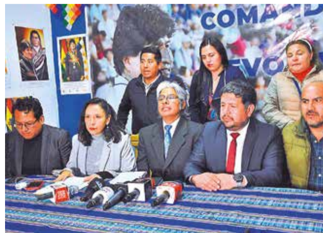
El grupo de abogados que apoya a Evo Morales.

"El Grupo de Puebla expresa su profunda preocupación por