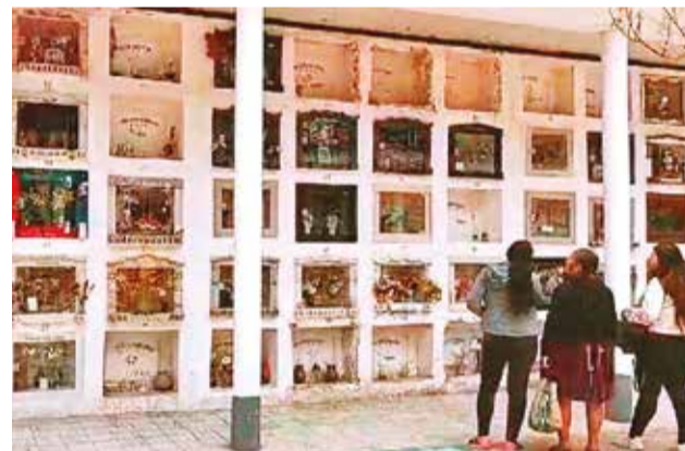
Los nichos notificados en el cementerio. PEDRO FIGUEROA

El Alcalde enfatizó que en el recorrido se empleará una boleta con cinco preguntas sencillas para conocer cuántos integrantes hay en una familia, la cantidad de personas fallecidas, la cifra de nacimientos y migrantes.