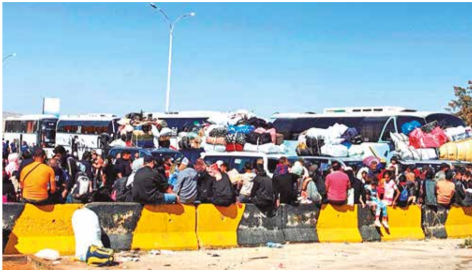
Desplazados libaneses que huyen de los bombardeos esperan en la frontera con Siria en una imagen reciente.

A la terrible situación se suma que Líbano lleva años inmerso en una profunda crisis económica y social, una crisis humanitaria a gran escala en la que dos de cada tres personas viven en la po-