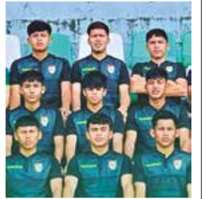
Prácticas del seleccionado nacional. FBF