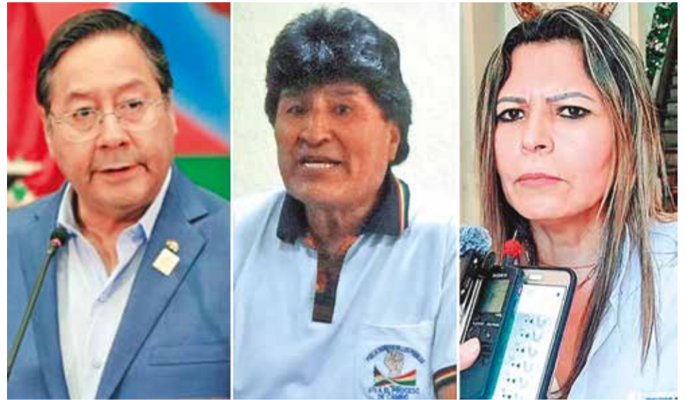
El presidente Luis Arce, Evo Morales y la fiscal destituida Sandra Gutiérrez.

El Ministro también cuestionó al fiscal general Juan Lanchipa, por haber destituido a la fiscal departamental de Tarija, Sandra Gutiérrez, y otros dos fiscales de materia que estaban a cargo de la investigación contra Morales.