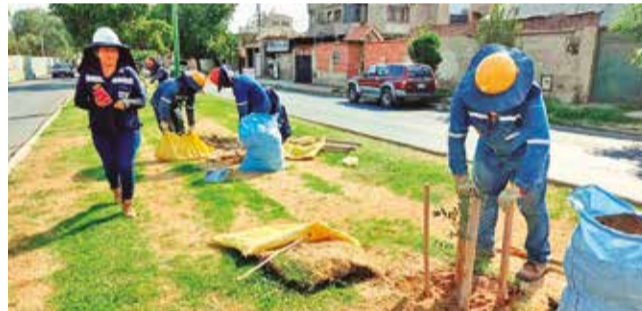
La reforestación de 30 plantines en la zona. P. FIGUEROA

“Tienen que presentar un cronograma de qué área van a intervenir para que la Alcaldía, mediante la Unidad Fo-