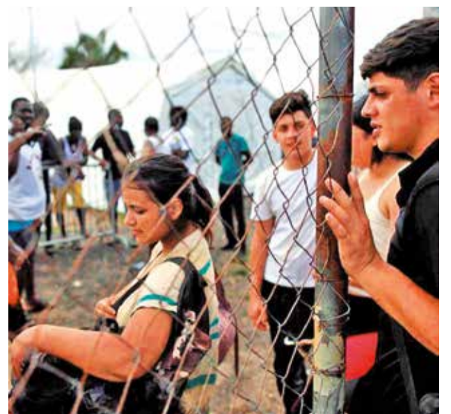
Un inmigrante venezolano intenta inscribirse en el registro del refugio San Vicente, en la selva del Darién, Panamá.

“Dentro del grupo de 18 a 30 años, el 50 por ciento tiene la intención de migrar, y eso agrava muchísimo el tema de esta ola migratoria en términos de que el país se queda desolado y además con gente mayor de edad”, dijo Ríos. Los jóvenes quieren irse porque en Venezuela no están encontrando pocas oportunidades para salir adelante.