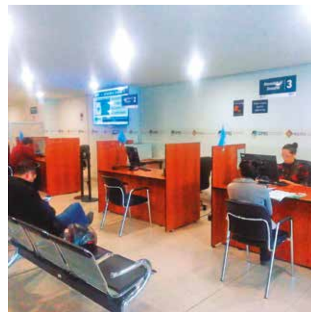
Las oficinas del Seprec en Cochabamba. WINDSOR SALAS

Hasta agosto de 2024, el Seprec ha registrado un total de 383.484 unidades económicas en todo Bolivia. Del total, el 77,9 por ciento corresponde a empresas unipersonales, el 20 por ciento a Sociedades de Responsabilidad Limitada (SRL) y sólo el 1 por ciento a Sociedades Anónimas, lo que evidencia el predominio de los emprendimientos individuales en la economía boliviana.