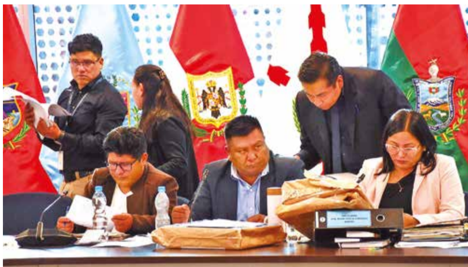
La Comisión Mixta de la ALP revisa la documentación de los postulantes a fiscal.

Esta primera parte de la evaluación se hizo sobre 120 puntos, ponderando el ejercicio y la experiencia profesional, la formación académica y la producción intelectual. En la segunda etapa, se harán el examen oral y la presentación del plan de trabajo por 80 puntos.