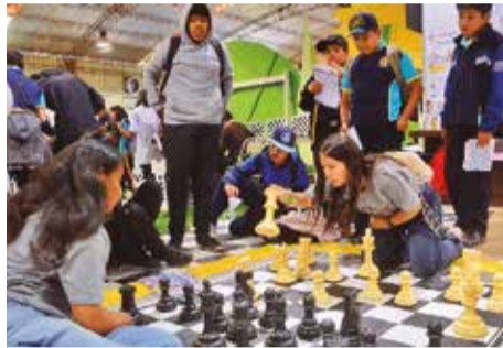
Estudiantes de diferentes unidades educativas visitan el nuevo pabellón.

La Sociedad Numismática de Bolivia también tiene un espacio en el pabellón, donde se exponen monedas, billetes y meda-