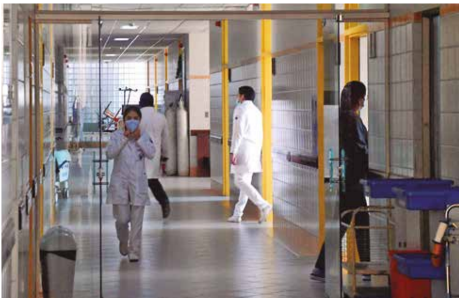
Las instalaciones del hospital pediátrico Manuel Ascencio Villarroel. CARLOS LÓPEZ

brote? Copana explicó que uno de los factores que podría haber incidido es la proliferación de focos de contaminación por la acumulación de basura en las calles durante el bloqueo de 11 días