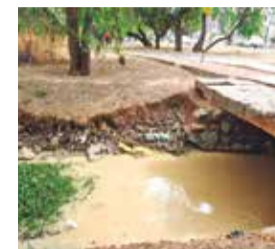
El ingreso de agua a la laguna Alalay. C. LÓPEZ