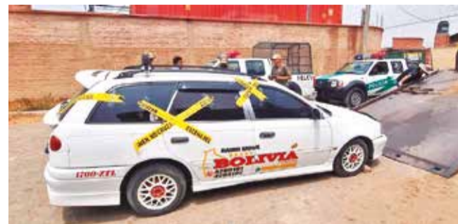
El vehículo que fue secuestrado en Sacaba.

Investigación. La Policía y la Fiscalía tienen programados varios actuados y rastreos para esclarecer el caso y recolectar evidencias