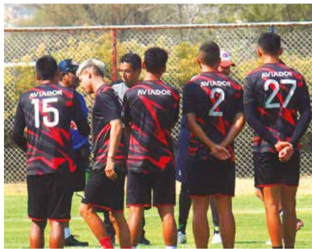
Jugadores de Wilstermann en entrenamiento.

En cuanto al partido amistoso que Wilster ganó por 5-0 ante Nuevo Amanecer, disputado ayer en el complejo aviador, Villegas aseguró que