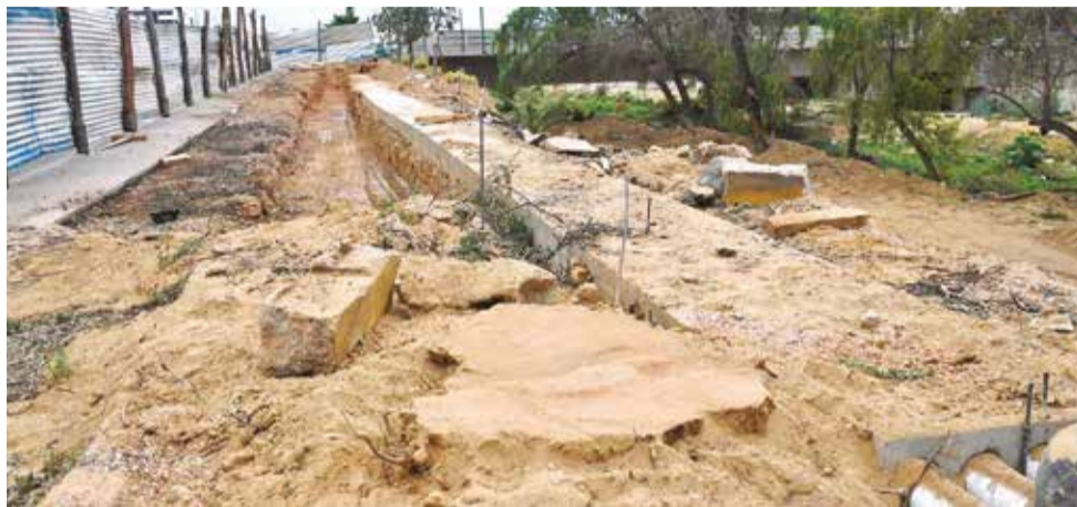
El tronco de un molle talado por las obras de la línea amarilla del tren, ayer.

“La recomendación es que, si están dentro de su licencia ambiental, se haga un trabajo coordinado, porque