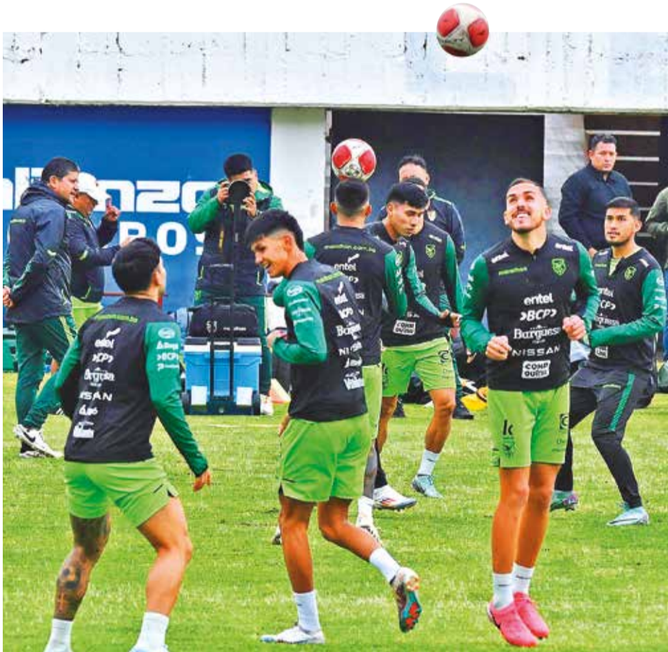
Entrenamiento de la selección nacional.

to de comprar la entrada el hinchas debe escoger no sólo la tribuna, sino la butaca específica donde se sentará, la venta no fue ágil, algo que ge-