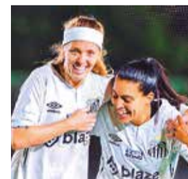
Partido entre Always Ready y Santos. CONMEBOL

Always Ready cae por goleada ante Santos en la Libertadores