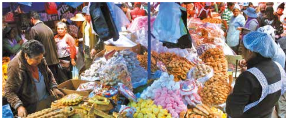
La oferta de productos para Todos Santos, en la calle Brasil. JOSÉ ROCHA

Cochabamba suma ya 14 casos de feminicidios en lo que va del año, según datos oficiales.