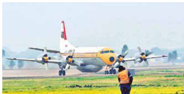
El avión cisterna que ya opera para combatir incendios. APG

Tratamiento. La ley ahora pasa al Senado para su sanción o rechazo. El Gobierno anunció la llegada de nuevo avión cisterna