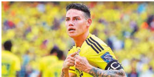
El volante colombiano James Rodríguez.