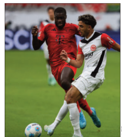
Acción del Bayern-Eintracht.

"Con el Real Madrid ha ganado 26 títulos en 427 partidos: 6 Champions League, 5 Mundiales de Clubes, 5 Supercopas de Europa, 4 Ligas, 2 Copas del Rey y 4 Supercopas de España. Carvajal es uno de los cinco jugadores que han logrado ganar 6 Copas de Europa", destacó el club.