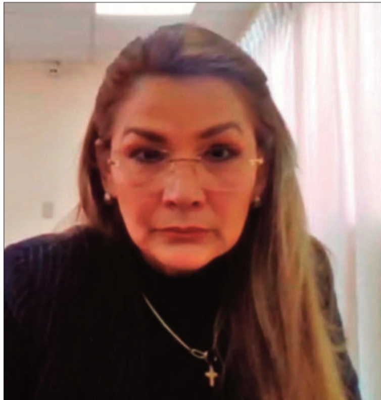
INVESTIGACIÓN. La expresidente Jeanine Áñez, en prisión