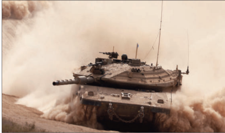
CONFLICTO. Hoy se cumple un año del inicio de la guerra en Gaza.

Netanyahu, que pronunciará hoy un discurso para conmemorar el letal ataque, también dijo que el ejército había logrado transformar la “realidad de un extremo al otro”. “El mundo entero está impresionado por los golpes que están asestando a nuestros enemigos”, aseguró. Tras haber debilitado a Hamás en Gaza, Is-