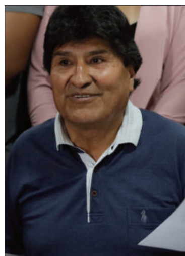
El expresidente Evo Morales.

Jeanine Áñez dijo que el 'lawfare' que denunció Evo Morales lo sufre ella