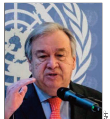
António Guterres, de la ONU.

Guterres expresó también su preocupación por la extensión del conflicto a Líbano, donde Israel bombardeó en los últimos días objetivos del grupo Hezbolá, aliado de Hamás.