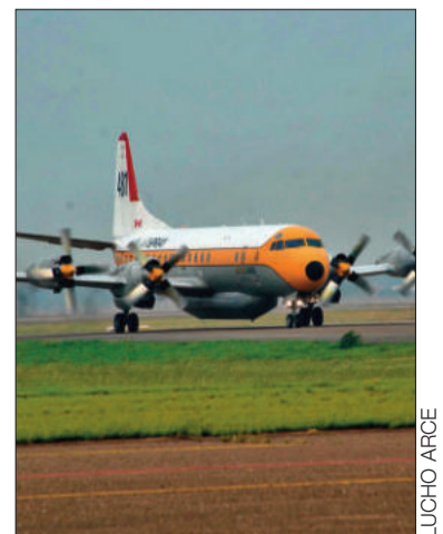
Electra Tanker que está en el país.

Además de esta aeronave, un helicóptero se suma a las operaciones gracias a la cooperación del Gobierno de Chile. En tierra se incorporarán al menos 1.600 efectivos militares, además de nuevos motorizados, para seguir el combate.