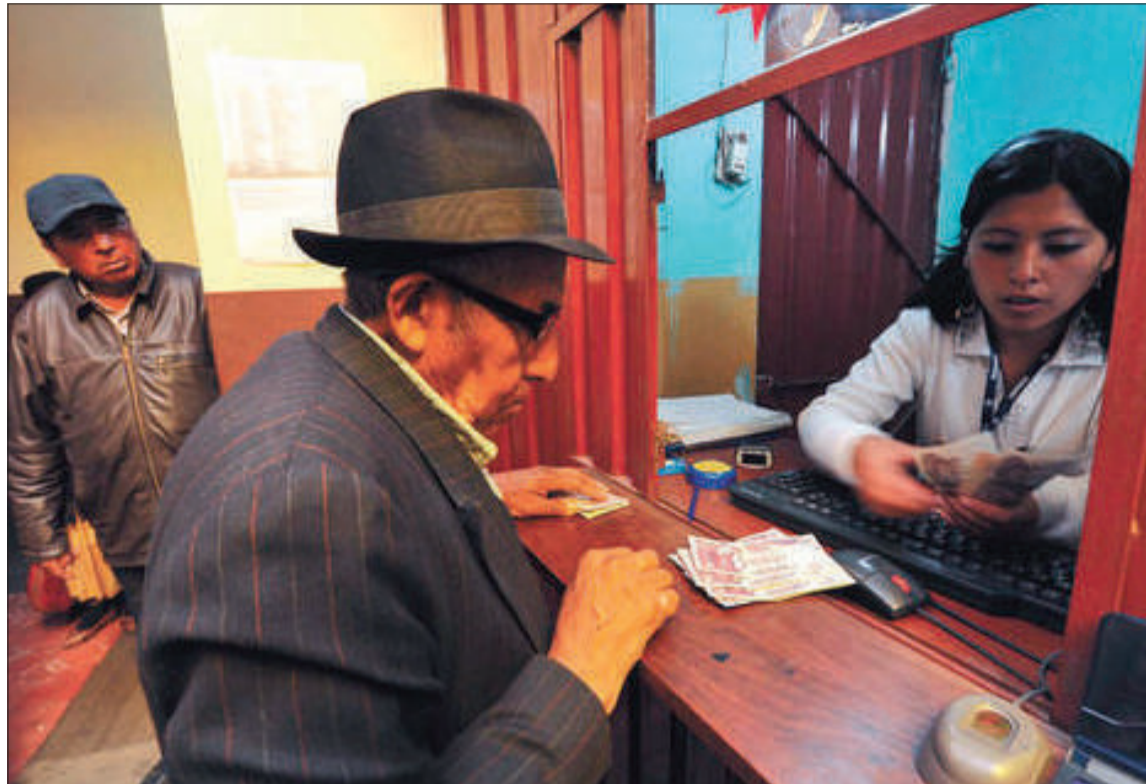
JUBILACIÓN. Un adulto mayor cobra su renta de vejez en una entidad bancaria de la ciudad de La Paz.

Recordó que, con la anterior ley, una persona que tenía 10 años de aportes se jubilaba con Bs 640, “pero ahora, con la nueva norma, ese límite inferior sube a Bs 720 bolivianos, que, sumados a la Renta Dignidad (Bs 300), da Bs 1.020”.