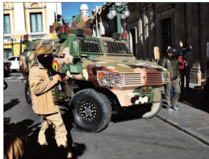
ASONADA. Un vehículo de asalto en la plaza Murillo, en La Paz.

Eduardo Rodríguez Veltzé es expresidente del Estado