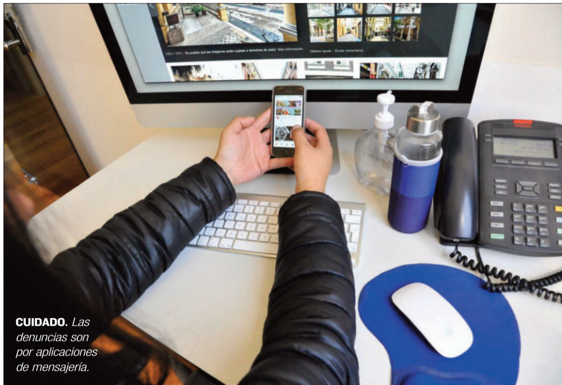
CUIDADO. Las denuncias son por aplicaciones de mensajería.

De acuerdo con información de la ATT, estos delitos se cometen principalmente a través de aplicaciones de mensajería como WhatsApp, Telegram y Messen-