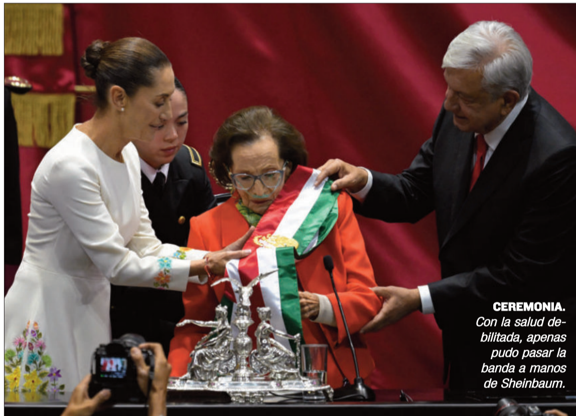
CEREMONIA. Con la salud debilitada, apenas pudo pasar la banda a manos de Sheinbaum.

En 1960 fue nombrada investigadora del Instituto de Investigaciones Económicas de la UNAM y en 1967 fue la primera mujer directora de la Escuela Nacional de Economía de la misma universidad, que defendió en 1968 después de que el Ejército ocupara el campus de Ciudad Universitaria de la capital mexicana. Destacó en la lucha por la democratización de México primero como dirigente de la llamada ‘corriente