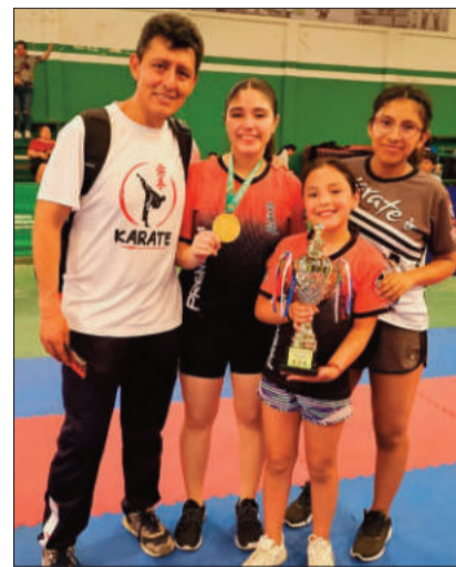
Algunas karatecas con sus premios.

La clasificación se completó con Santa Cruz con 26 oros, 34 platas y 45 bronce, Chuquisaca (6-4-4) y Beni (4-4-15).