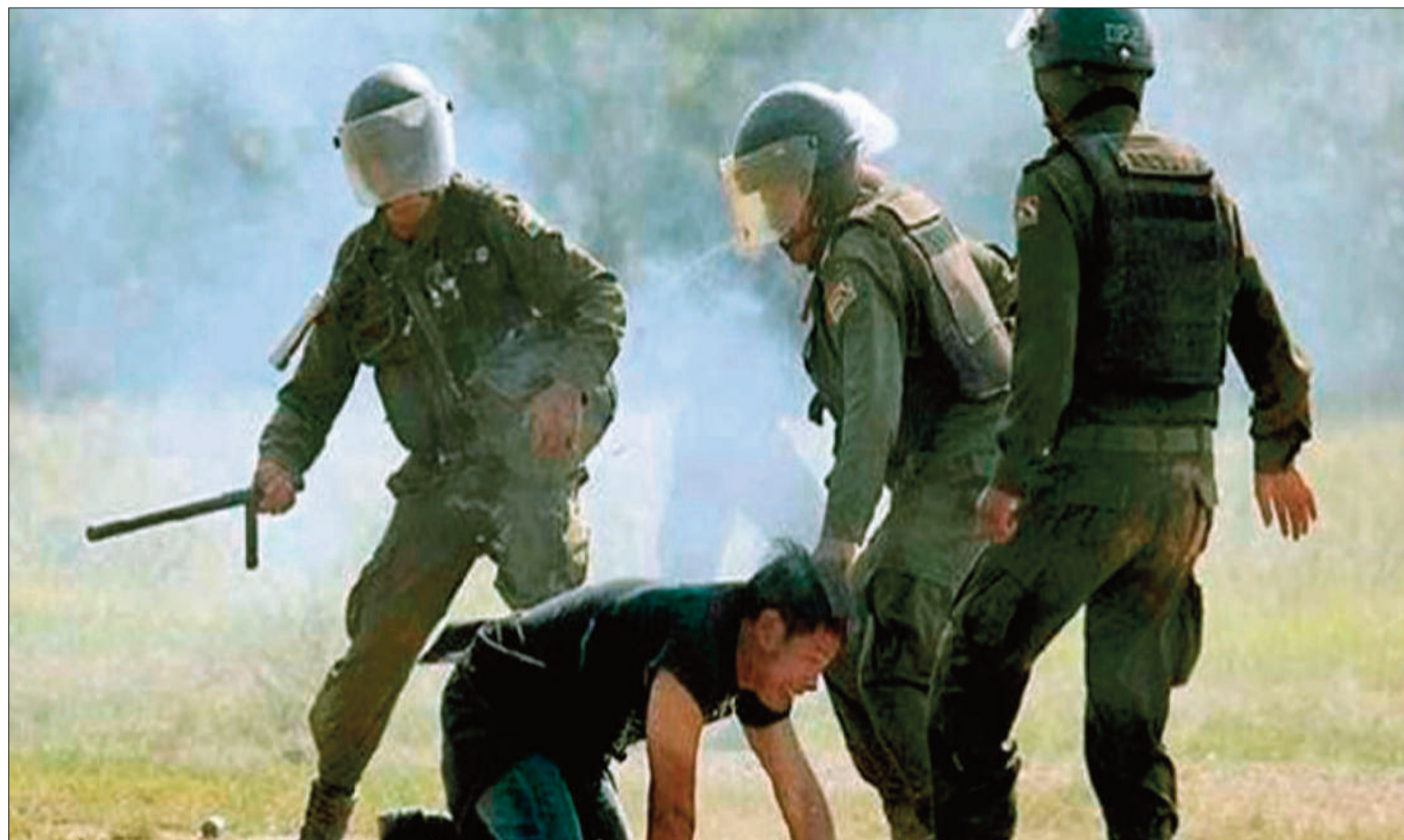
REPRESIÓN. En 2011, las fuerzas del orden ejercieron violencia contra un grupo de movilizados que defendían el Tipnis, en el Norte paceño.

Ganó las elecciones Víctor Paz Estenssoro, del MNR, y su política de shock ante la crisis fue la promulgación del Decreto Supremo 21060, del 29 de agosto de 1985, a las semanas de haber llagado a su cuarto mandato.