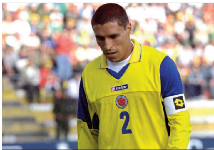
APENADO. El capitán colombiano Iván Ramiro Córdoba se va triste.