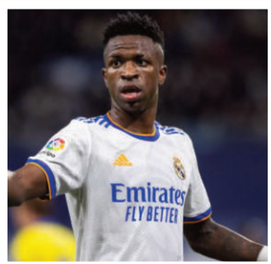
El delantero brasileño Vinicius Junior.