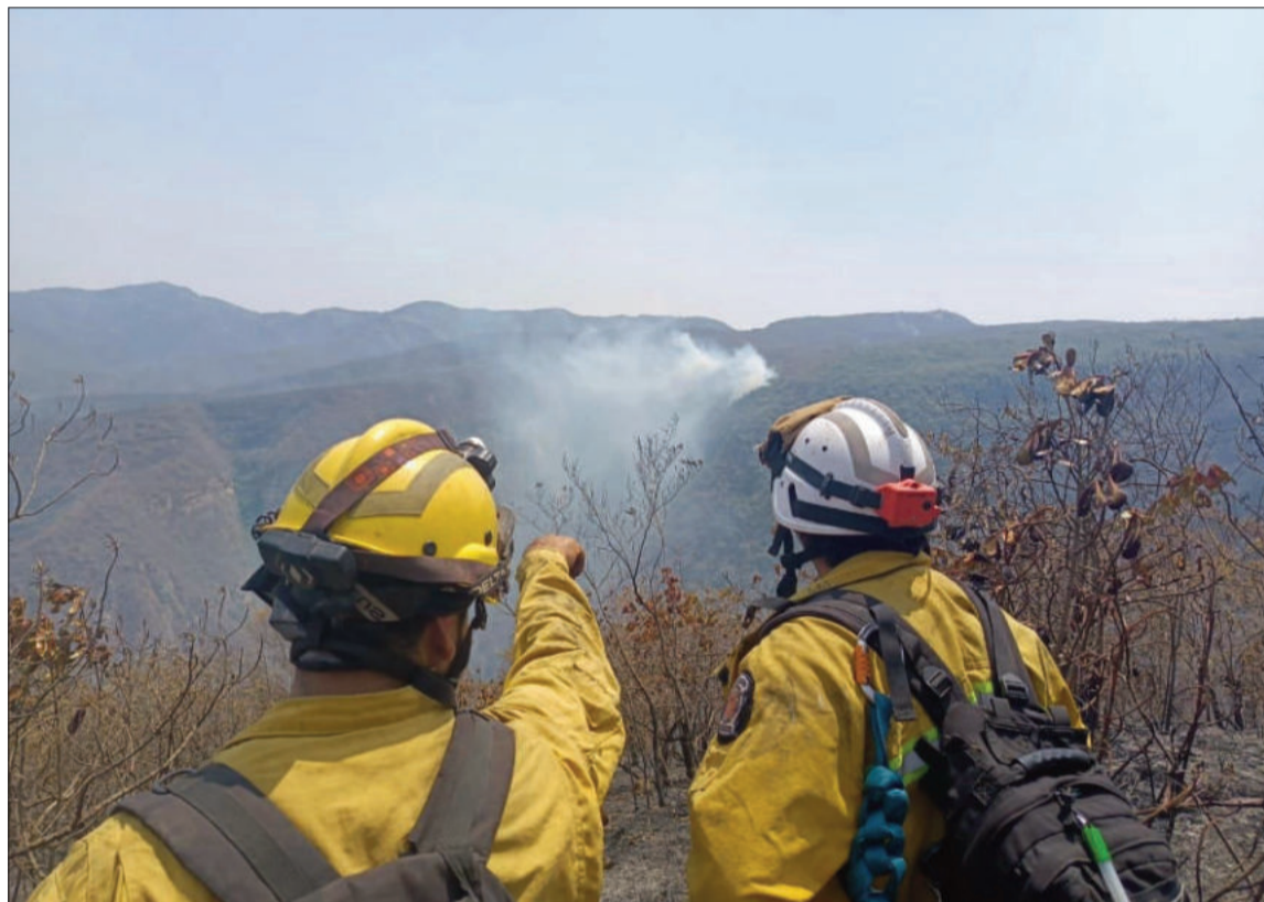
DAÑOS. Los incendios forestales afectan sobre todo a regiones del oriente del territorio nacional.

En cambio, ahora, indicó la autoridad, las quemaduras han disminuido; no obstante, el estrago del fuego permanece dentro las zonas de