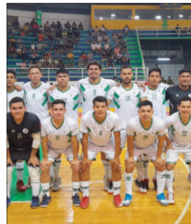
Los representantes de CRE.

El martes 1 de octubre debía jugarse el partido reprogramado de la tercera jornada del Grupo A entre Córdova y Petrolero en Potosí, pero se lo cambió para este martes 8 de octubre. Todavía no fue designado con fecha y hora el Deportivo Amistad y Concepción.