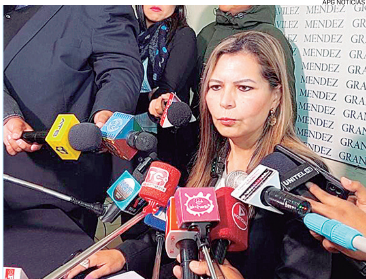
La fiscal de Tarija reactivó el caso pero luego fue echada del cargo.

mento de los hechos se involucra a una menor de edad de 15 a 16 años que fue abusada sexualmente; fue obligada por los padres para obtener favores específicos", sostuvo.