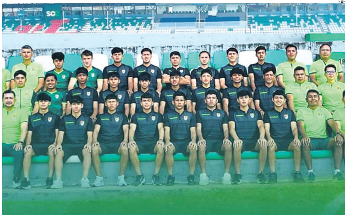
Esta es la selección nacional sub 15 que jugará el Sudamericano. Todos los partidos de este torneo se jugarán en el estadio Tahuichi

Se juega desde las 19:30 en el Tahuichi. El torneo tiene el sello de Conmebol y participan las 10 selecciones afiliadas a esta institución