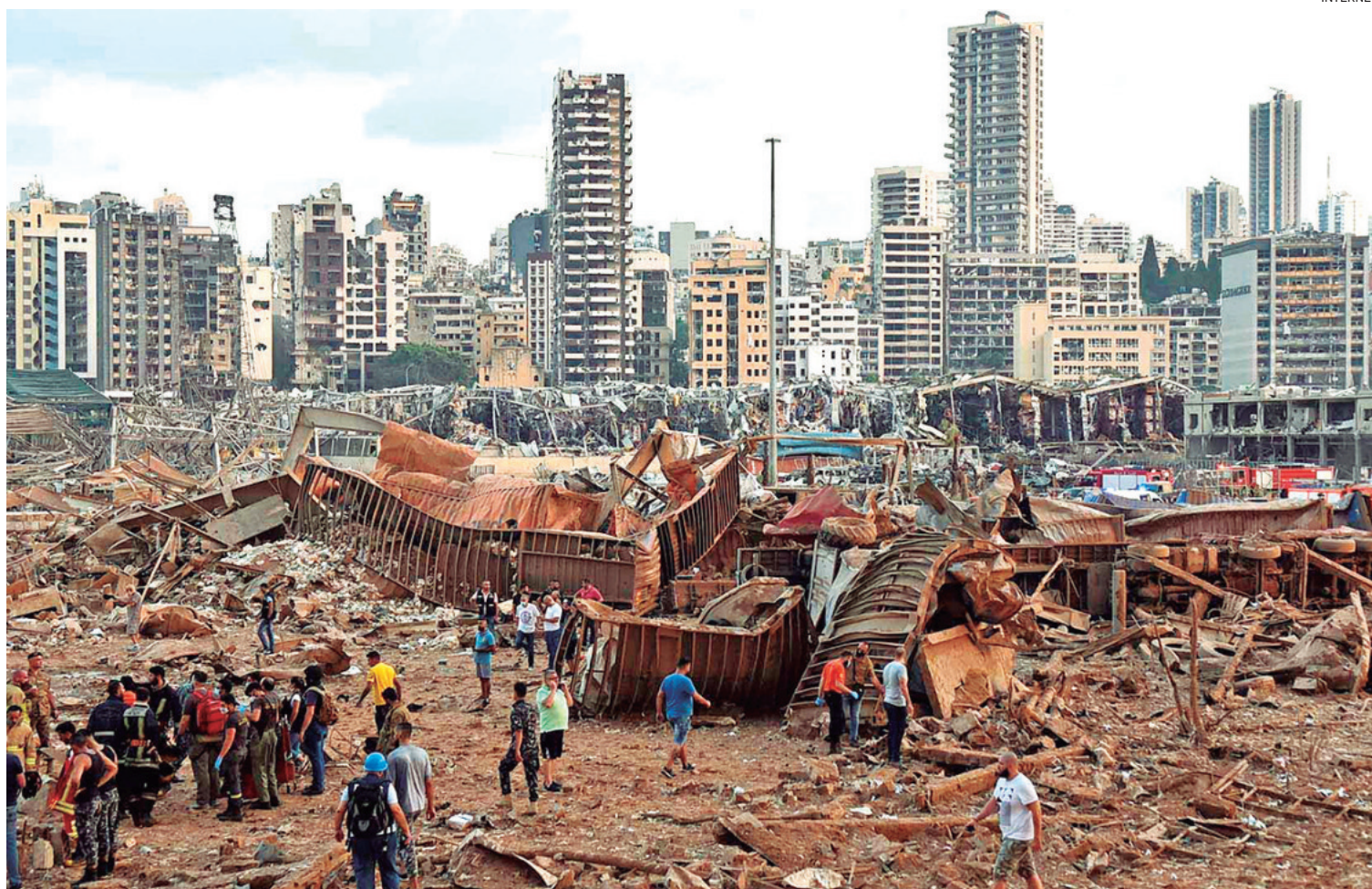
Edificios enteros han sido destruidos por los bombardeos ejecutados los últimos días por la aviación israelí en Beirut, la capital de Líbano