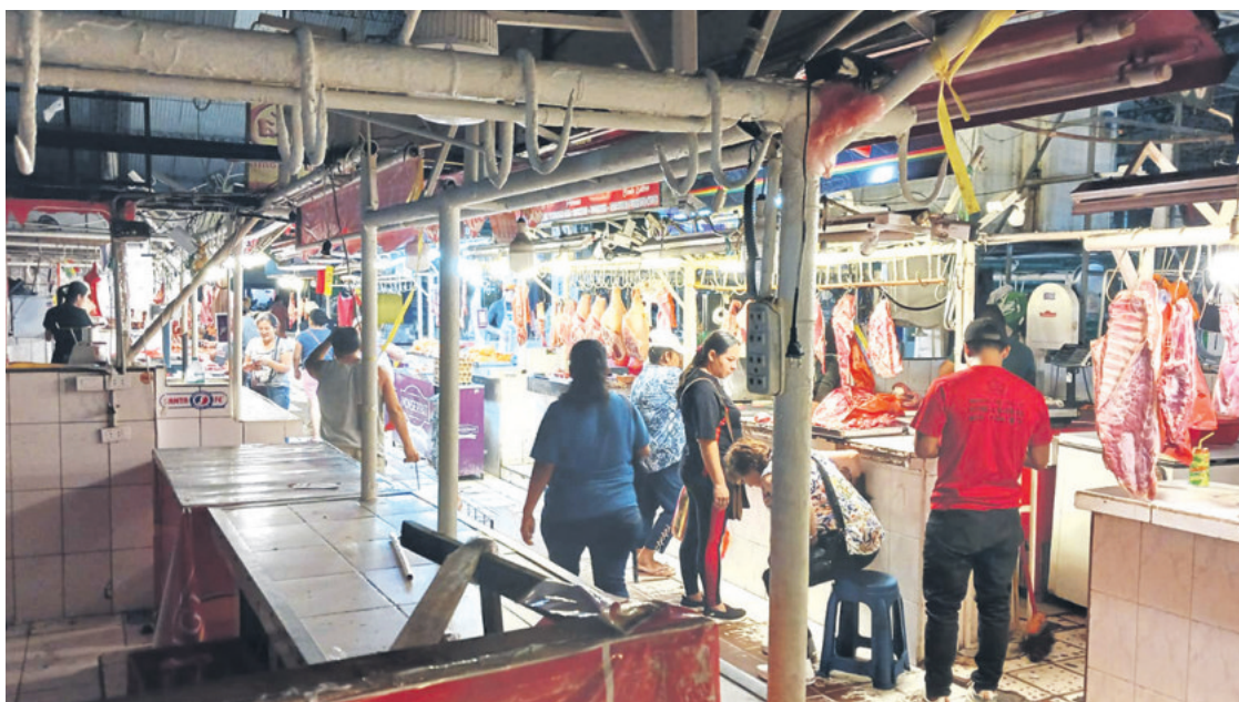
En lo mercados de la capital cruceña, la oferta de carne de res fue normal durante la jornada de ayer