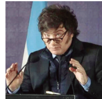
El mandatario argentino

Con todo, el ejército ruso sigue sin poder expulsar a las tropas ucranianas que penetraron el pasado 6 de agosto en la región de Kursk.