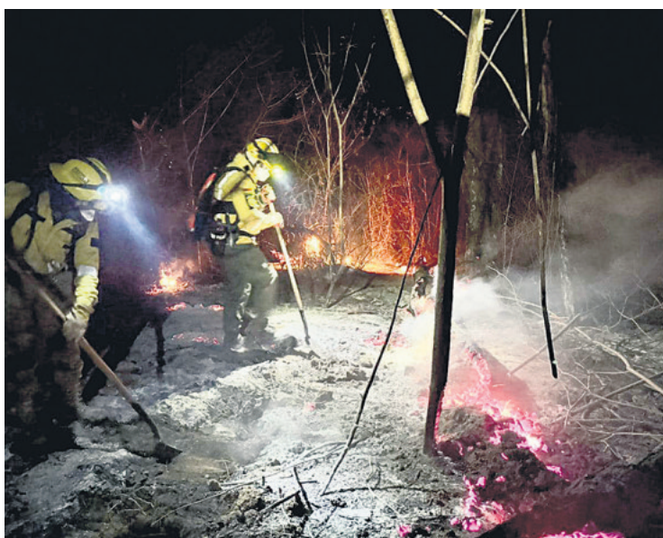
Las tareas de combate también se realizan durante la noche

incendios se siguen expandiendo. Concepción lleva tres meses combatiendo las llamas y hay familias que se han visto obligadas a dejar sus viviendas. Pobladores de seis comunidades han evacuado y se encuentran albergados en casas comunales, pero el fuego sigue avanzando. Por lo tanto, necesitan combustible y transporte para poder continuar con las tareas que realizan en primera línea.