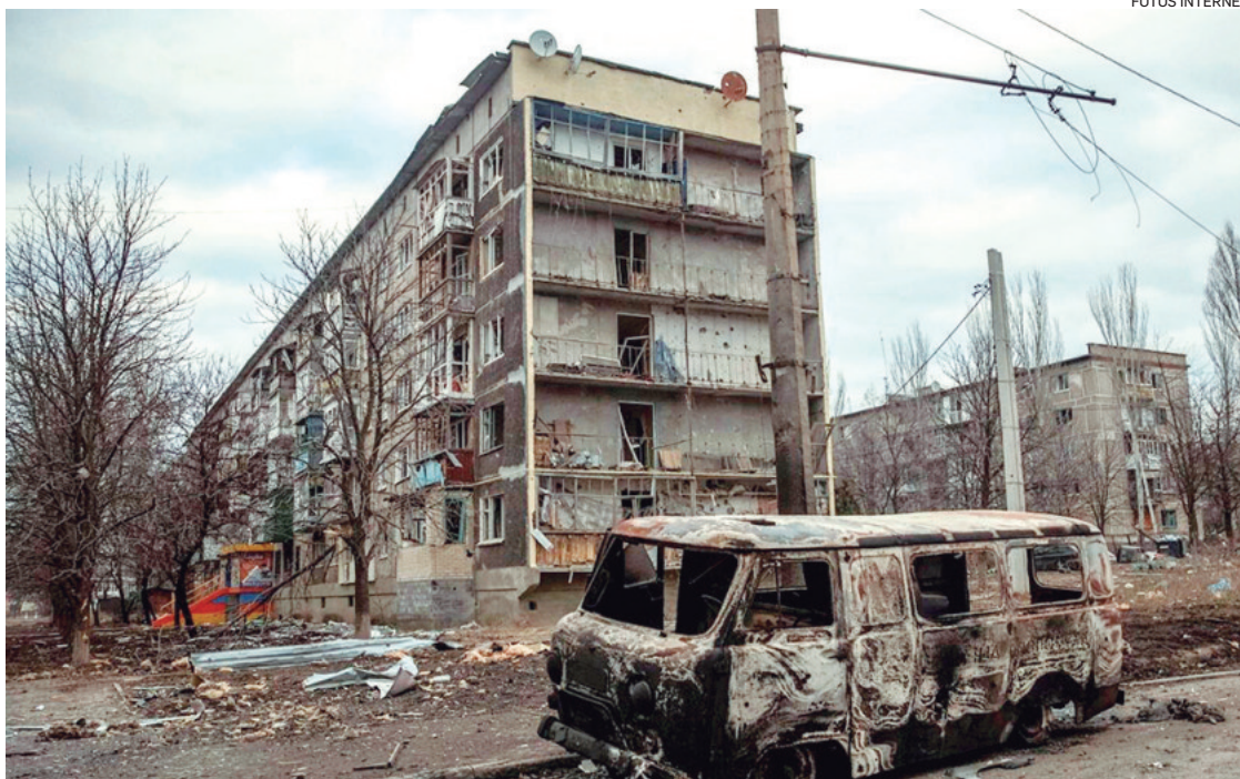
La ciudad ucraniana de Vugledar fue tomada por las tropas rusas en su avance por el sur de Donbás

Al mismo tiempo, vinculó la pérdida de Vugledar con la im-