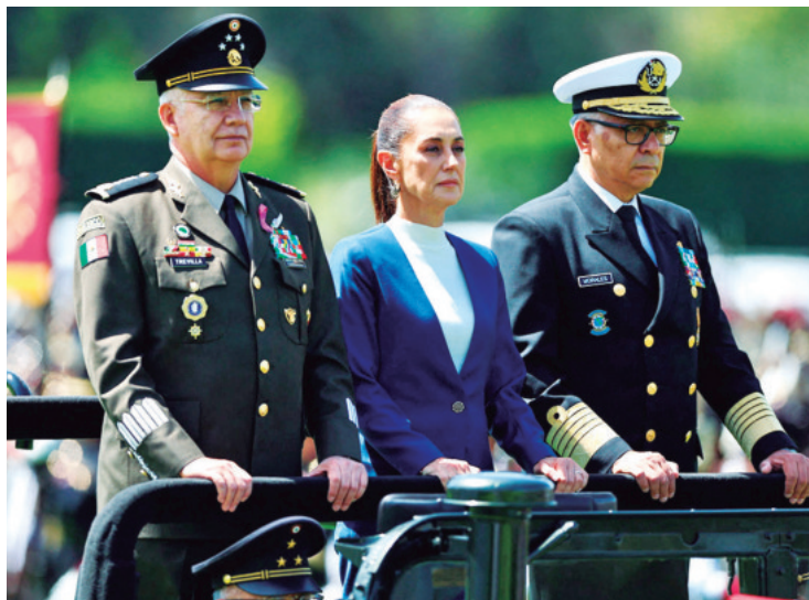
Claudia Sheinbaum saluda a la tropa junto con los jefes militares

La mandataria fue saludada por una escolta del Heroico Colegio Militar y posteriormente -a bordo de un vehículo oficial- pasó revista a todos los integrantes de