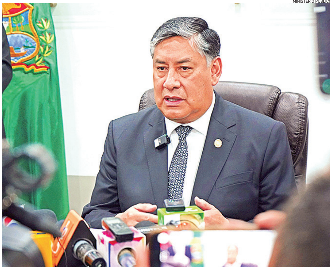
El fiscal general, Juan Lanchipa, negó ayer que haya paralizado el caso de estupro contra Evo Morales.

La denuncia contra Morales por la supuesta comisión de los delitos de trata de personas y estupro agravado, cuya víctima es una adolescente de 16 años, incluye a los padres de ésta.