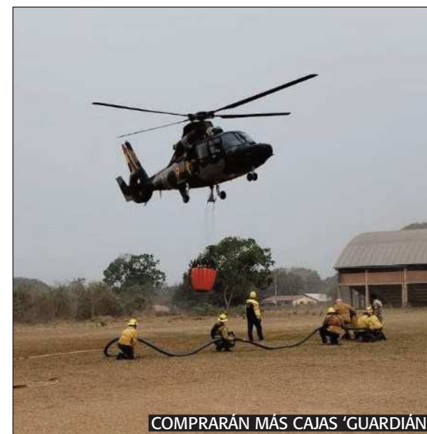
COMPRARÁN MÁS CAJAS 'GUARDIÁN'

"Vamos a seguir haciendo el esfuerzo mayor, si los 15 días no es insuficiente y no logramos sofocar vamos a contratar por otros 15 días más el Elactra Tanker, probablemente hasta fines de octubre que se tiene previstas las lluvias", manifestó el Ministro.