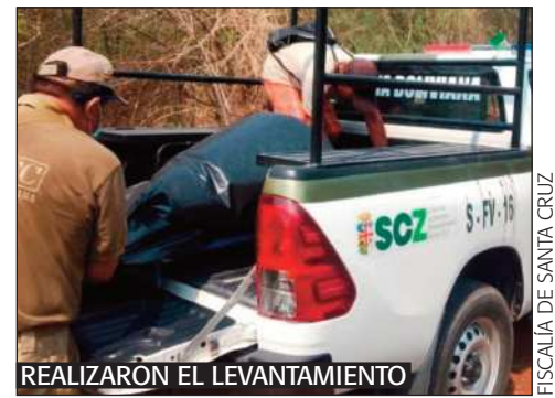
REALIZARON EL LEVANTAMIENTO

Tras el examen forense, se develó que la víctima perdió la vida hace 10 o 15 días, y producto de la descomposición “fue decapitada por animales”, según un reporte institucional.