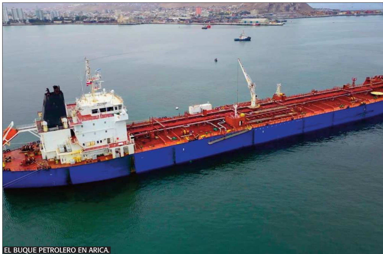
EL BUQUE PETROLERO EN ARICA.

Descarga. Un buque descargó el combustible en la Terminal Sica Sica en Arica, Chile y piden tranquilidad a la población