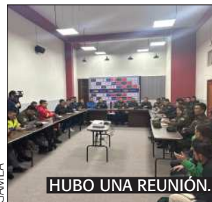
HUBO UNA REUNIÓN.

1.800 policías serán desplegados en tres anillos de seguridad