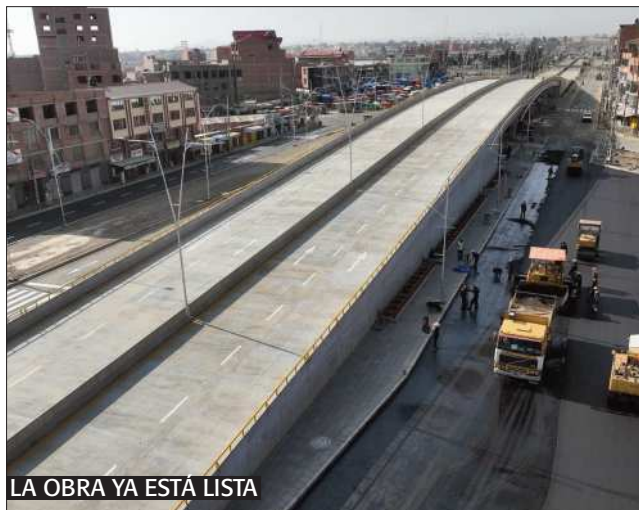
LA OBRA YA ESTÁ LISTA