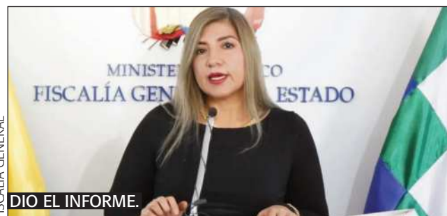
DIO EL INFORME.

El departamento con más casos es Santa Cruz con 13.073 denuncias