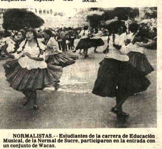
NORMALISTAS.- Estudiantes de la carrera de Educación Municipal, de la Normal de Sucre, participaron en la entrada con un conjunto de Wasas.

El miércoles de carnaval, todas las comparsas al contrapunteo, solían ir al Tejar, para un día de campo. La costumbre disminuyó al