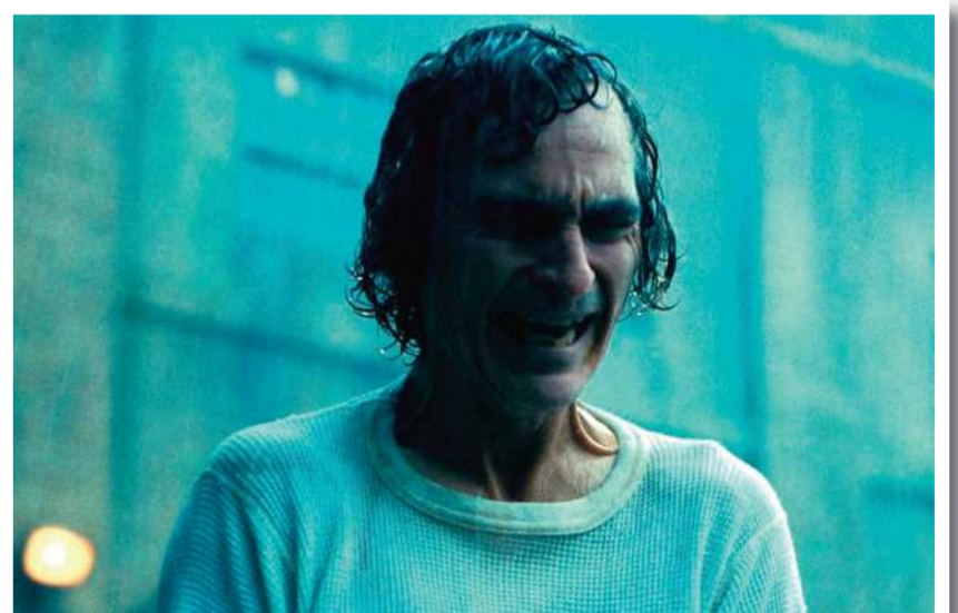
PERSONAJE. Arthur Fleck, el comediante que se convirtió en Joker .