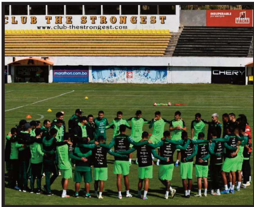
ORACIÓN. La Selección Boliviana en pleno se reúne en círculo para orar antes de la práctica.