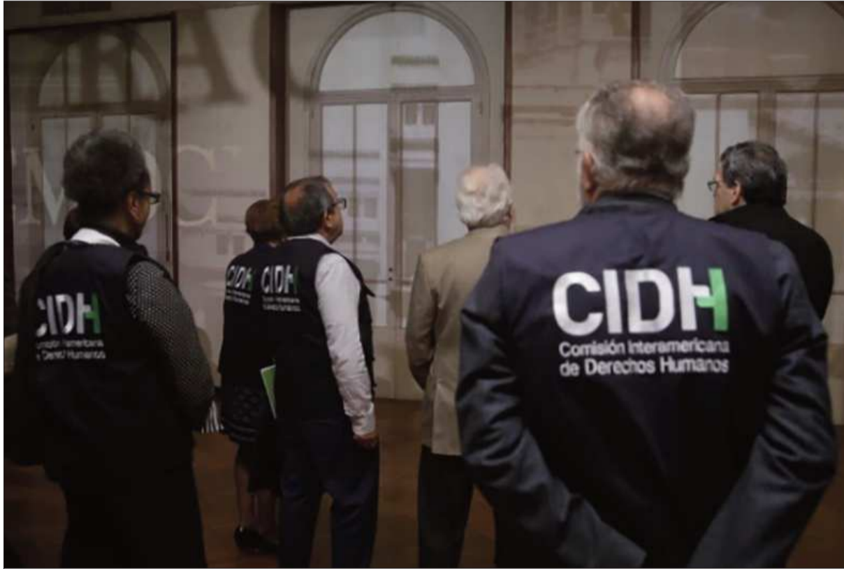
INSTITUCIÓN. Personal de la CIDH durante una visita pasada que realizó en el país.