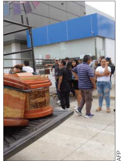
Fallecidos en el tiroteo.

Debido a la guerra entre bandas narco por el control de las rutas ilegales y el mercado, los homicidios crecieron en Ecuador.