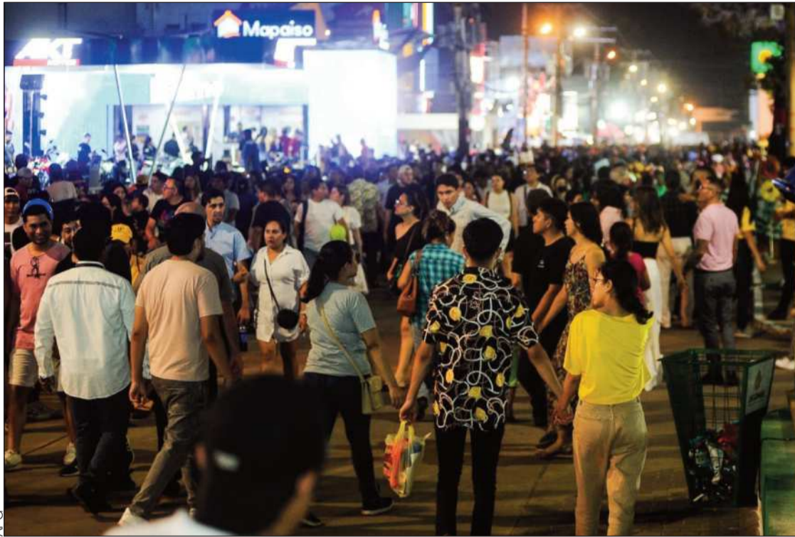
CLAUSURA. El domingo finalizó la feria exposición más importante de Santa Cruz y del país.