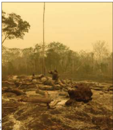
Tierras quemadas en incendios.

La norma amplía de 5 a 10 años la restricción de asignación de tierras