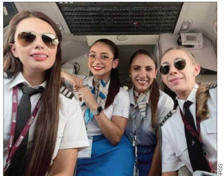
HISTÓRICO. Cuatro mujeres estuvieron a cargo de la tripulación de Ecojet.