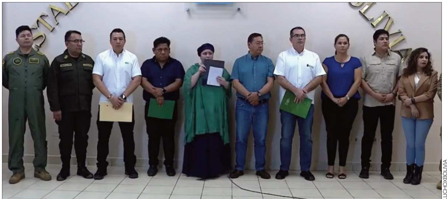
CONFERENCIA. El presidente Luis Arce, parte de su gabinete y autoridades regionales durante el anuncio de declaratoria de desastre nacional.