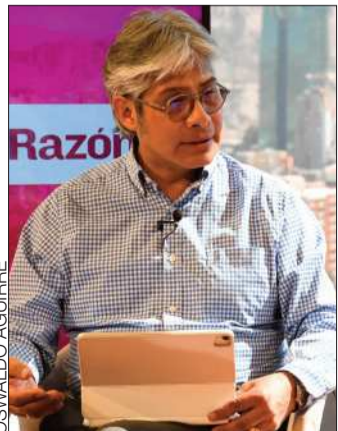
Wilfredo Chávez, exprocurador.

Por ello, aseveró que no hay impedimento constitucional para que Evo Morales sea candidato en las elecciones de 2025.