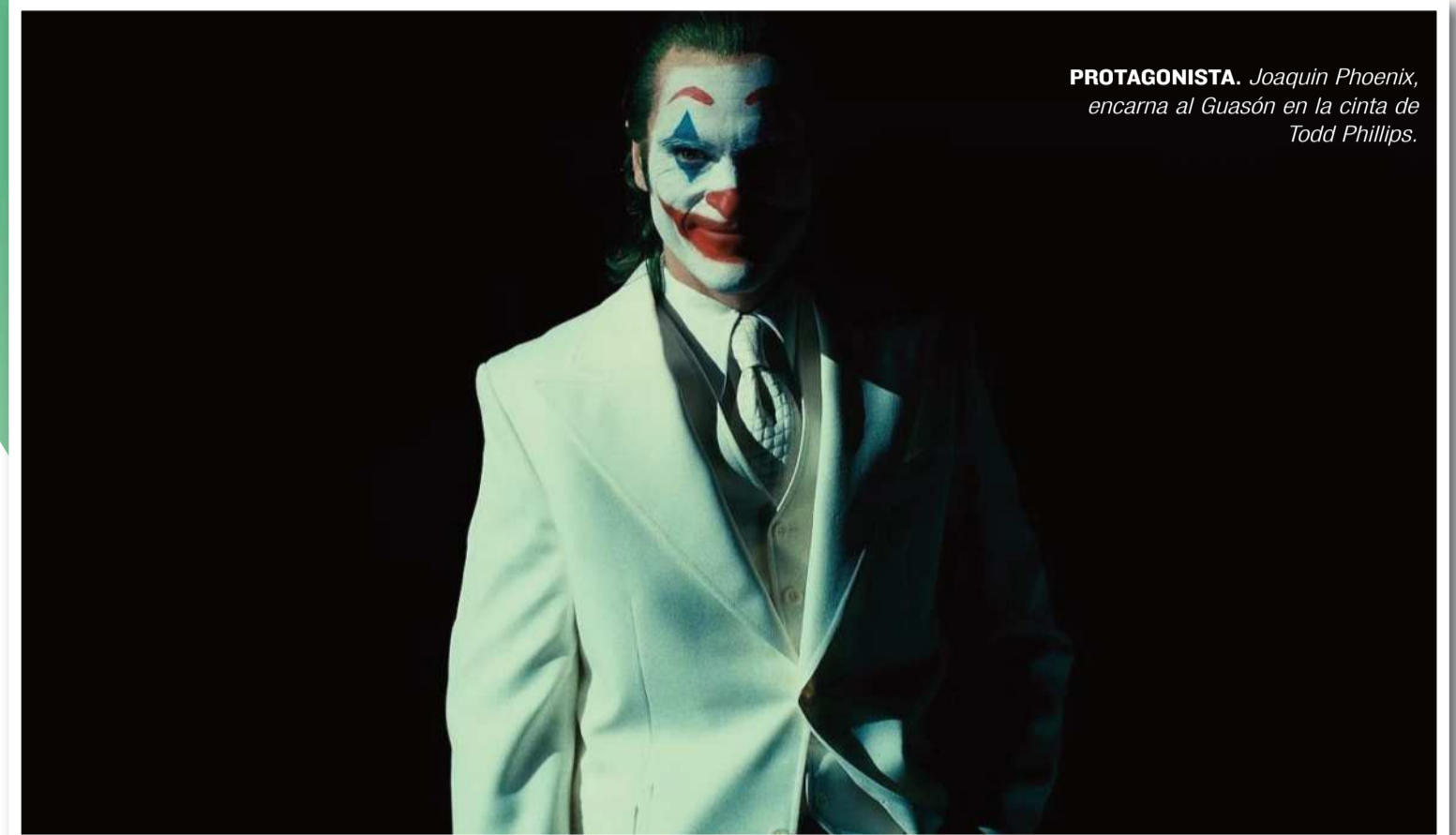
PROTAGONISTA. Joaquin Phoenix, encarna al Guasón en la cinta de Todd Phillips.

Phoenix regresa a la gran pantalla como el Joker o Guasón, aquel eterno villano antagonista de Batman. Según las primeras