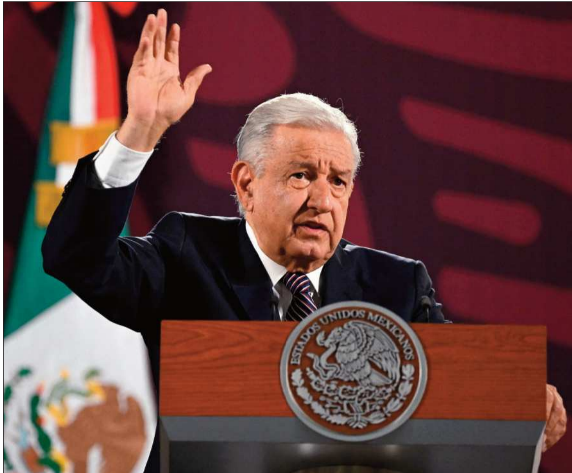
MÉXICO. Andrés Manuel López Obrador (AMLO) termina su mandato con un 70% de popularidad.

Pasar “a formar parte de la secretaría de la Defensa le va a dar (a la GN) solidez, permanencia, disciplina y un manejo honesto, sobre todo el que no se vincule con la delincuencia organizada”, argumentó el mandatario, que termina su mandato único de seis