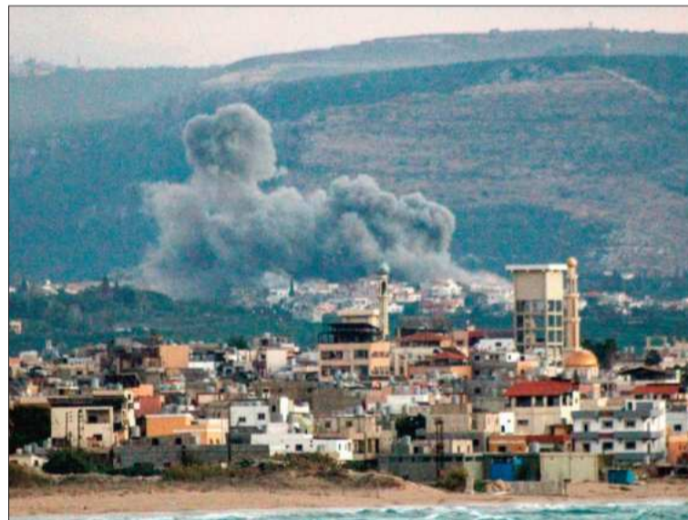
BEIRUT. Ataques del ejército de Israel, el lunes en suelo libanés.

Mundo. Según el gobierno libanés, 95 personas murieron en bombardeos