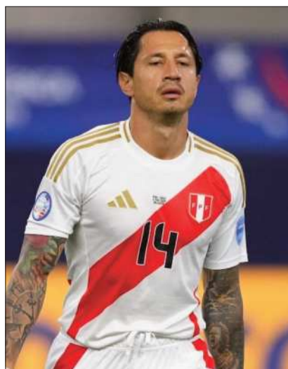
El ítaloperuano Gianluca Lapadula.

El cuadro bicolor se enfrentará a Perú en Lima y Brasil en Brasilia