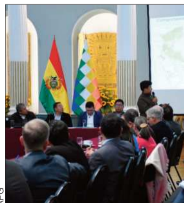
AFG Reunión Gobierno y diplomáticos.

Tras declarar desastre, el Gobierno se reunió con el cuerpo diplomático