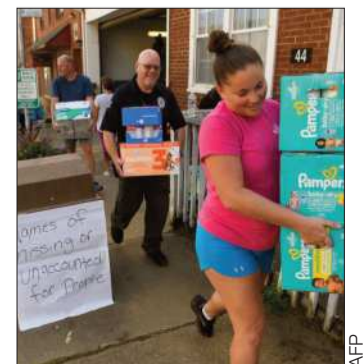
Evacuaciones en EEUU.

El temible Helene tocó tierra el jueves por la tarde cerca de Tallahassee, Florida, como un huracán de categoría 4 en una escala de 5 con vientos de 225 km/h. Posteriormente se degradó a ciclón postropical.