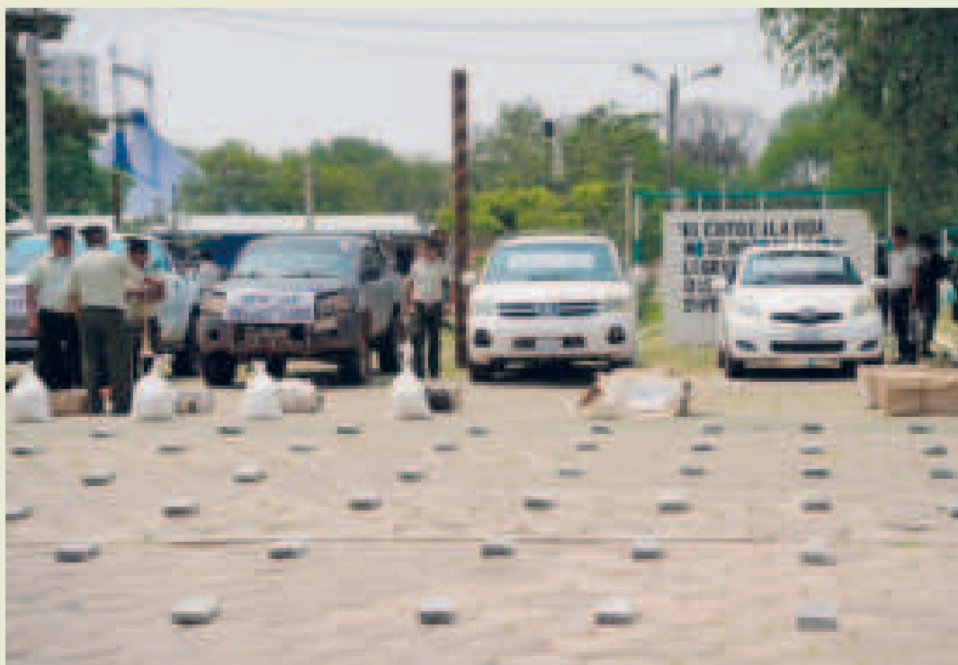
El Gobierno presenta la droga secuestrada y los vehículos incautados al narcotráfico.

El viceministro cuestionó duramente el manejo de la situación por parte de los asambleístas: “Lo que quiero decirles es que desbloqueen estos créditos. Si nos hubieran otorgado esos fondos, hoy contaríamos con más recursos para enfrentar los incendios, que además tienen un claro componente político”, agregó, de-