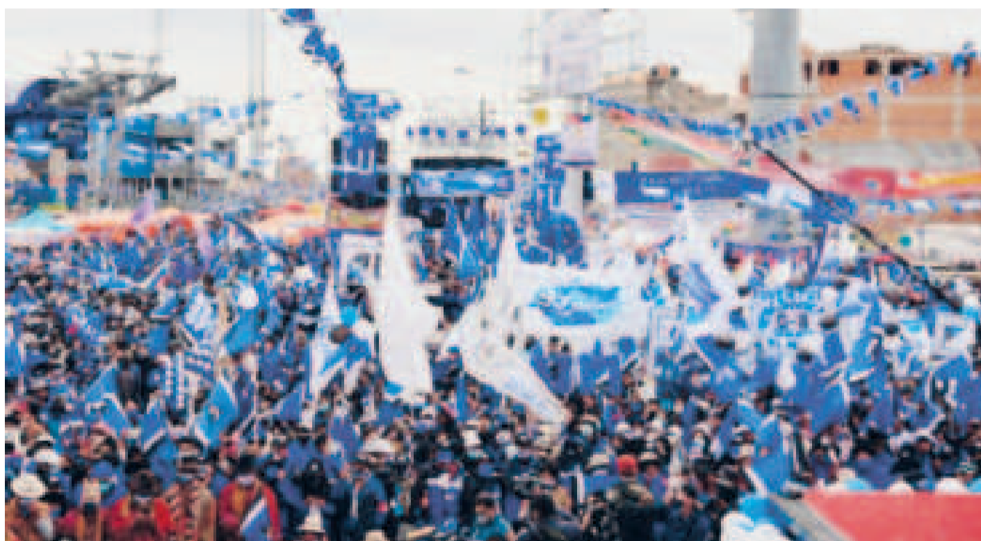
La militancia del MAS-IPSP ondea las banderas del Instrumento Político.

La marcha de Evo y la violencia de esa movilización puso en riesgo la estructura de esta fuerza política y puede afectar a la intención de voto, según un exdirigente campesino.