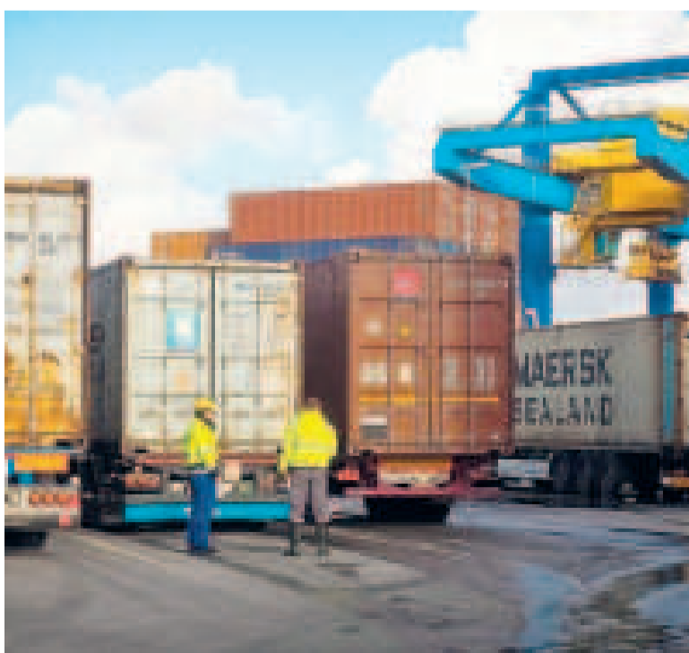
Contenedores de exportación e importación.