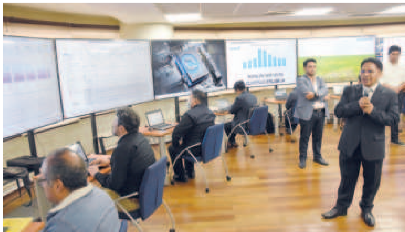
El Comité de Seguridad Alimentaria está conformado por instituciones del Gobierno, en alianza con los municipios, para asegurar los controles.

Durante la reunión, se analizará el impacto de los bloqueos y marchas evistas de la semana pasada, que repercuten en la economía de las familias bolivianas.