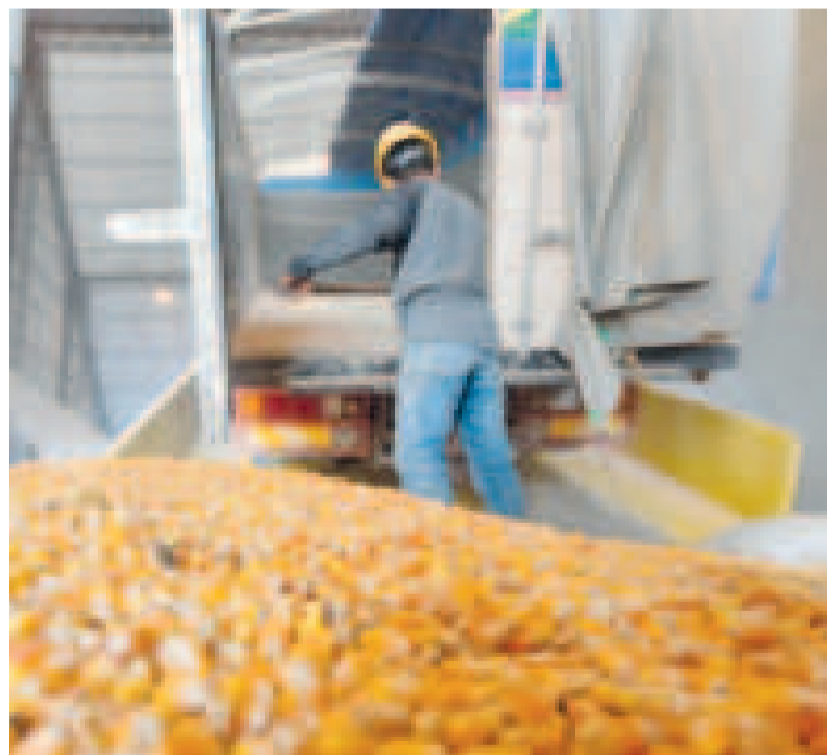
El acopio de maíz en Emapa.

Gerente General de la Empresa de Apoyo a la Producción de Alimentos