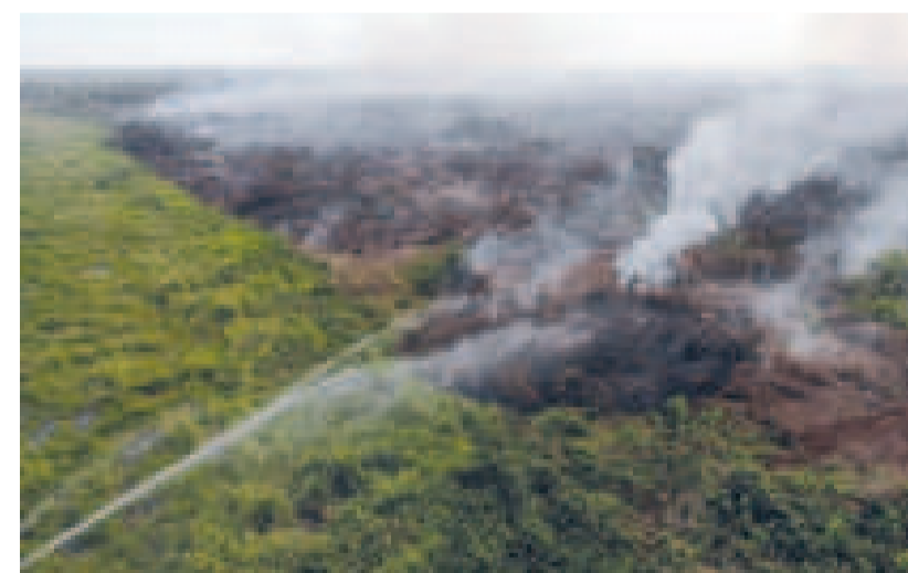
Los incendios forestales afectaron a miles de hectáreas en el país.

emergencia activó el respaldo internacional esastre no incrementaría el nivel de ayuda.