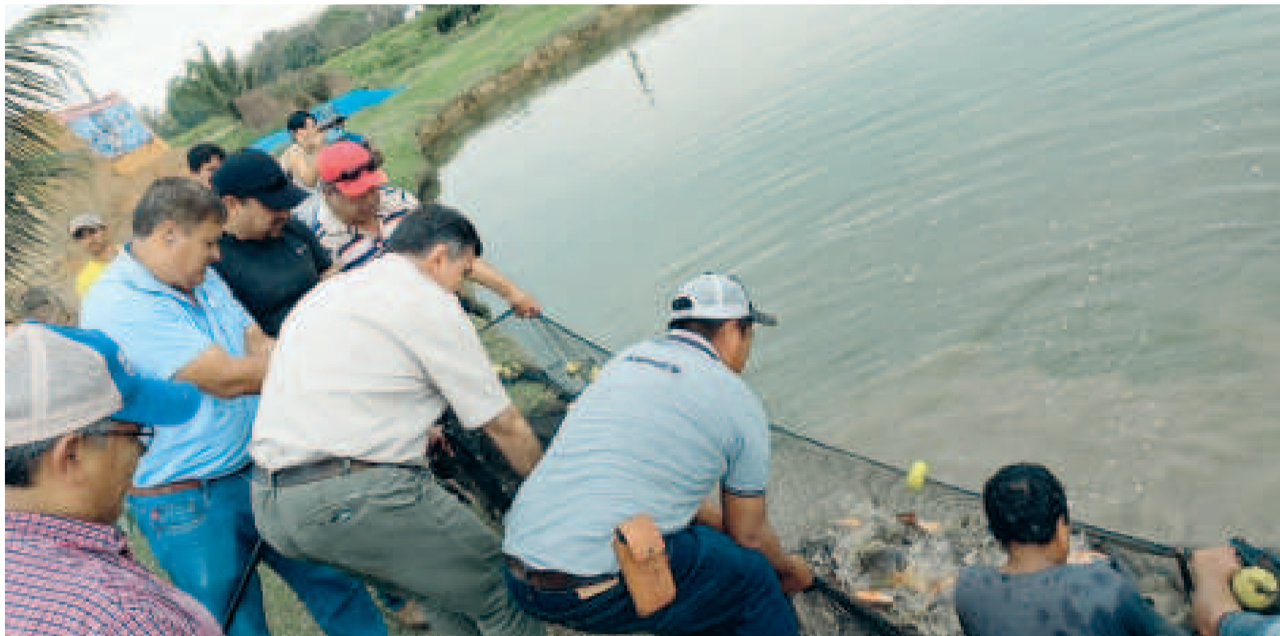
El Ministerio de Desarrollo Rural y Tierras potencia la producción piscícola en Santa Cruz.