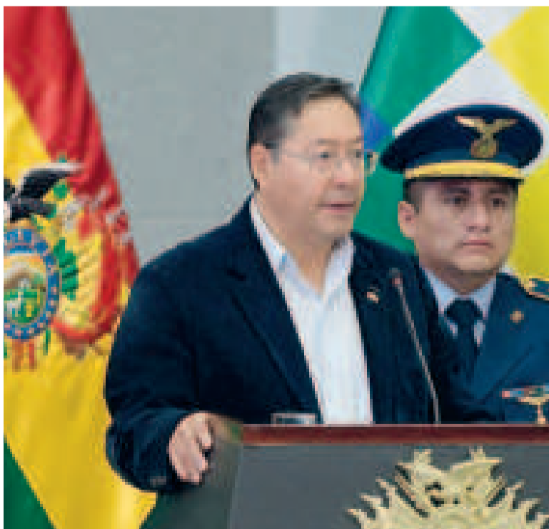
El presidente Luis Arce.

El presidente de China, Xi Jinping, también felicitó a su par boliviano por su cumpleaños 61 y expresó su disposición de trabajar de manera conjunta para llevar a la asociación estratégica China-Bolivia “a nuevas alturas” y en mayor beneficio de ambos pueblos.