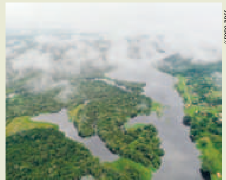
La Reserva Bajo Paraguá, en el municipio cruceño de San Ignacio de Velasco.