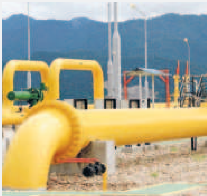
Los gasoductos de exportación de Bolivia.

menes de gas a Petrobras (de Brasil)”, explicó Dorgathen, en entrevista con Bolivia TV.