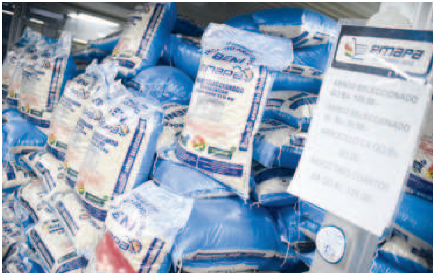
La arroba de arroz es ofertada por Emapa a Bs 50,50; mientras que en el mercado convencional se mantiene en Bs 92,50.

En cuanto al pollo, Emapa lo oferta a Bs 13,50 el kilo, mientras que en el mercado se encuentra a Bs 14,50. El maple de huevos cuesta Bs 28, igual