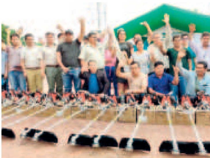
Productores de cacao reciben una dotación de equipos e insumos.

En un contexto global marcado por la crisis climática y