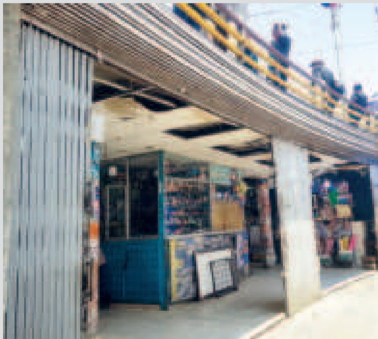
El techo de las casetas se cae a pedazos.