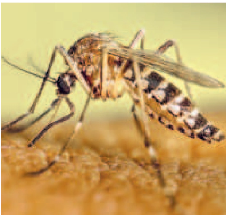
El mosquito transmisor del dengue.