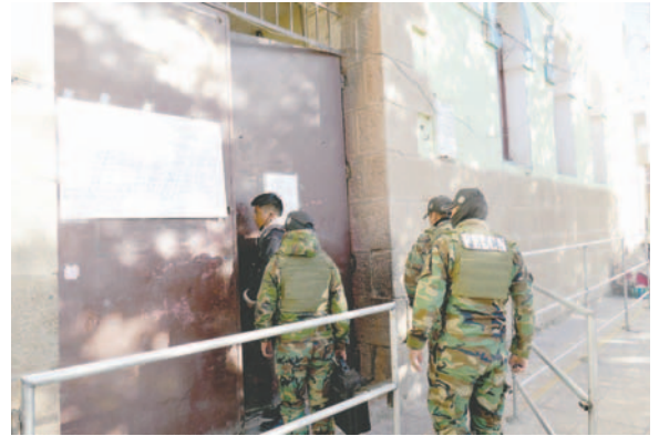
Efectivos antinarcóticos confirmaron que las pastillas son sustancias controladas

Asimismo, dentro de las pesquisas consiguientes, el fiscal a cargo informó que pedirá un informe al centro penitenciario