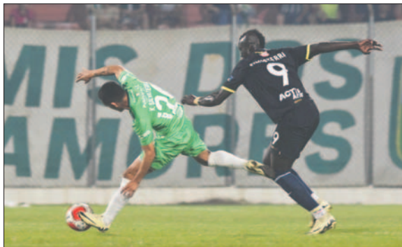
Los de Aurora no encontraron la forma de frenar a los "verdolagas"