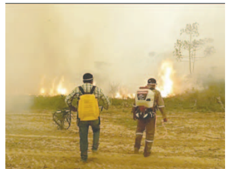
La emergencia nacional declarada por el Gobierno boliviano no ha sido suficiente para controlar los incendios

Desde el Gobierno informaron que encaran un ataque "masivo y seguido" en la "cabecera de los incendios", aseveró el viceministro de Defensa, Juan Carlos Calvimontes. Sin embargo, los bomberos y voluntarios aseguraron que las tareas son insuficientes. En Urubichá, en Ascensión de Guarayos, en el norte cruceño, el fuego está a unos 3 kilómetros