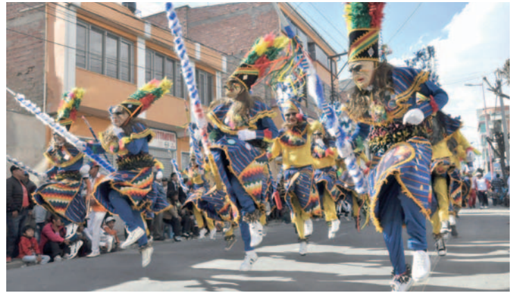
Este domingo se vivirá la XXX Entrada VISO en Oruro

En el municipio de Oruro, se sancionó a algunas personas que fueron encontradas en flagrancia y se los sancionó con la multa económica, pero además la reposición de la especie según los años de vida que tenía el árbol.