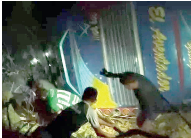
Bus Trans Chaqueti volcó en Chimasi

Una pasajera que sufrió la pérdida de una pierna fue trasladada a la ciudad de La Paz para recibir atención médica especializada. Las autoridades locales y de salud están trabajando para atender a los afectados y se espera que se brinde más información sobre el estado de los