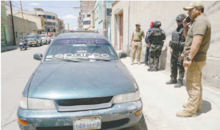
El “autero” traba de robar objetos de valor de la vagoneta