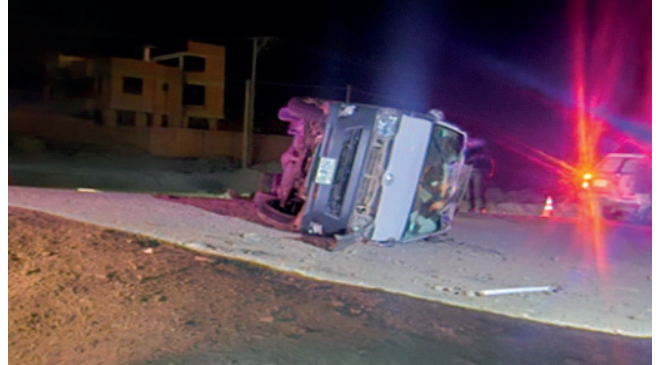
El minibus terminó volcado tras la colisión con el ómnibus

Por el impacto, el minibus volcó lateralmente y salió de la ruta principal, dejando cuatro personas lastimadas y daños materiales en ambos