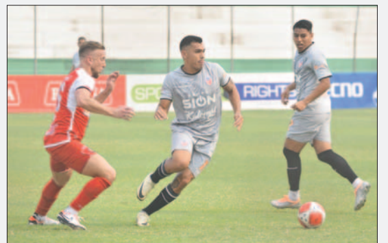
El cuadro "inmobiliario" no pudo de local en Montero