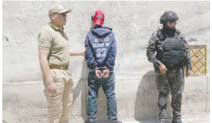
Personal de GTS redujo al implicado al mediodía de ayer