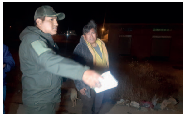
Se presume que el conductor de la vagoneta estaba en estado de ebriedad

Con base en la apreciación preliminar, el conductor de la vagoneta presuntamente estaba en estado de ebriedad; no obstante, se aguarda un informe oficial de Tránsito para esta jornada.