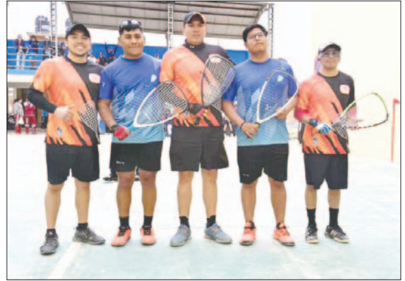
Señor de Lagunas y La Unión llegaron a la final en la categoría Primera