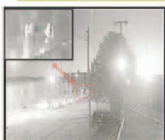
CUATRO PERSONAS DÁNDOSE A LA FUGA

Inmediatamente personal del D.A.C.I. procedió a realizar tareas de inteligencia así también la colección de información, logrando identificar un vehículo tipo vagoneta marca Toyota IPSUM color plateado con placa de control 2190 - GXL utilizado para darse a la fuga posterior al hecho delictivo, dando inicio a la identificación de los presuntos autores.