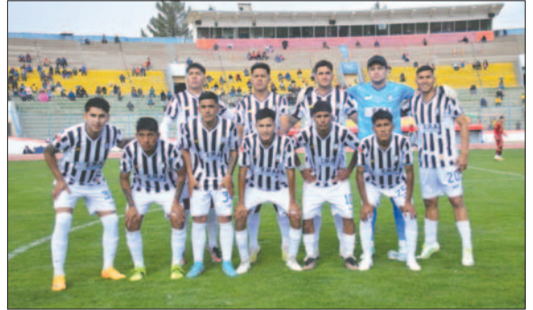
Oruro Royal escala al tercer puesto tras vencer por walk over técnico

Lo llamativo de este partido es que en la banca de suplentes no se encontraba ningún miembro del