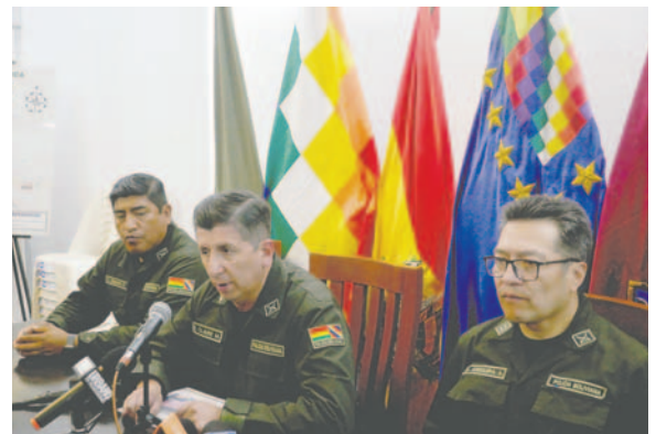
Las autoridades del Comando de Policía brindaron detalles del exitoso operativo /LA PATRIA

Las pesquisas permitieron identificar el motorizado y la patente para capturar a los autores /LA PATRIA