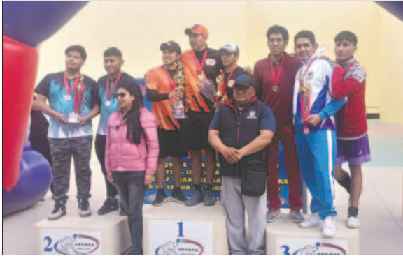
El campeonato finalizó con la respectiva premiación a los campeones