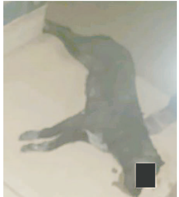
Cuatro canes fueron asesinados por los implicados