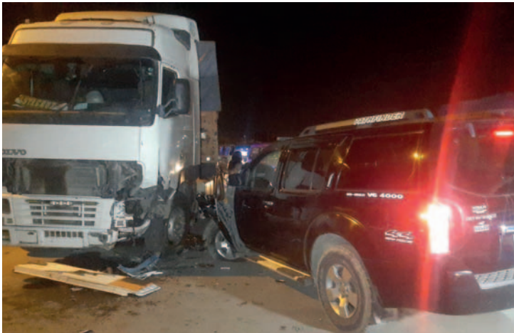
El conductor de la vagoneta invadió carril y chocó con el tractocamión