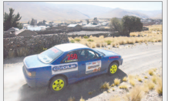
La competencia automovilística llegará hasta el templo de Cala Cala

La prueba, si bien tiene un matiz devocional, los competidores no pierden de vista los puntos en disputa que los pueden catapultar a los primeros puestos del ranking departamental. Para la ocasión se están habilitadas las categorías RB1, RB2 y Promocional.