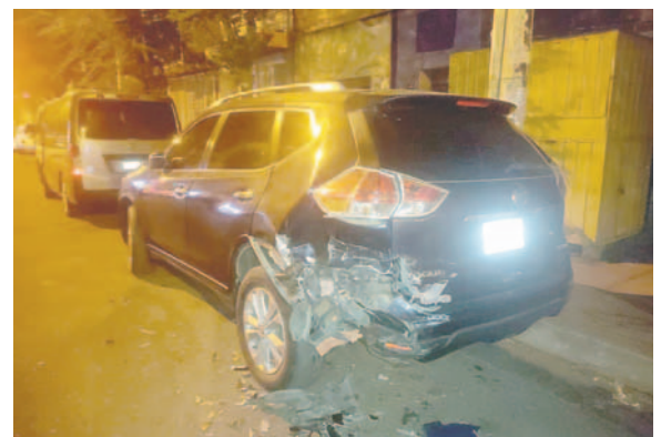
Tres vehículos resultaron dañados /TRÁNSITO

estado en que se encontraba el conductor, chocó inicialmente al vehículo Nissan estacionado. Posteriormente, este último impactó al vehículo que estaba delante de él en la misma calle.