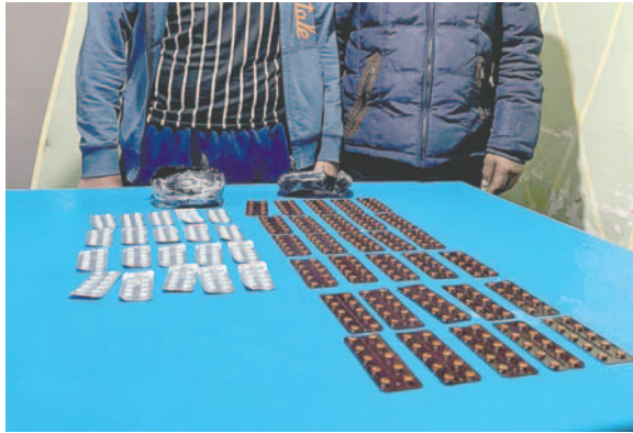
Incautaron cerca de 500 pastillas de psicotrópicos en una celda