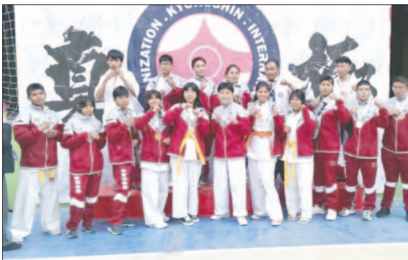
La delegación de Oruro cumplió un buen papel en el torneo nacional

Luego siguieron Tarija, con tres de oro, cuatro de plata y dos de bronce; Santa Cruz, con una de oro, cinco de plata y una de bronce; Potosí, con una de oro, dos de plata y cuatro de bronce.