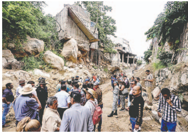
Autoridades municipales y habitantes recorren el canal del río del Camarón donde supervisan la limpieza de los canales por las lluvias del huracán ‘Jhon’, este lunes, en la ciudad de Acapulco, México