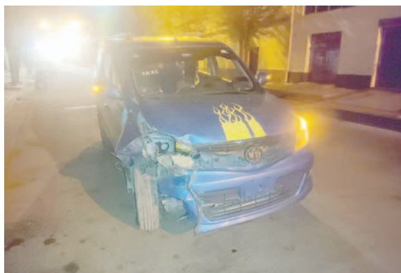
El chofer implicado dio positivo para consumo de alcohol /TRÁNSITO

El jefe de la División Accidentes de Tránsito, teniente coronel Rommel Valdez, informó que el accidente ha sido clasificado como choque a vehículos estacionados. Los vehículos involucra-