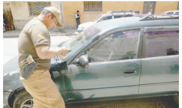
Agentes de Diprove se hicieron cargo del caso

Los agentes del GTS arrestaron al sujeto y lo entregaron a uniformados de la Dirección de Prevención e Investigación de Robo de Vehículos (Diprove), especialistas en este tipo de delitos. Se espera que Diprove realice la investigación preliminar y determine si tiene antecedentes policiales por robo de autopartes u otros delitos.