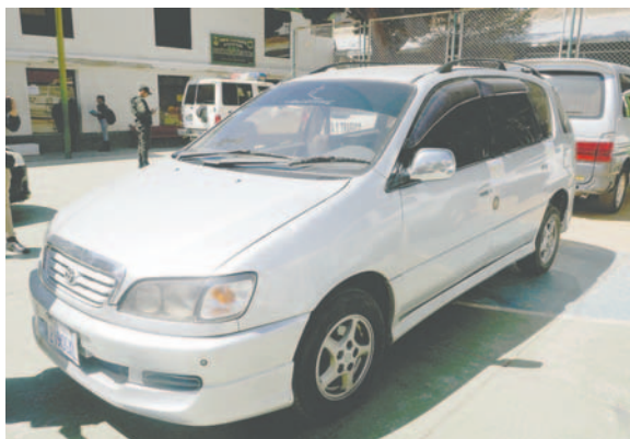
El motorizado en el que huyeron fue secuestrado para fines investigativos