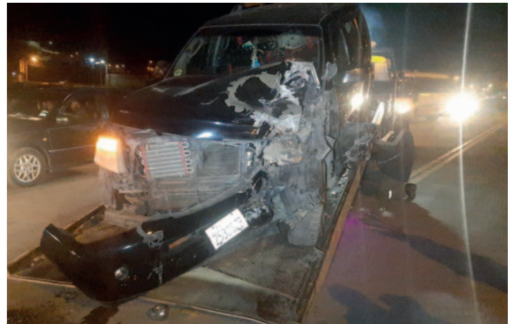
El motorizado reportó daños materiales en su estructura