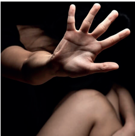
El galeno vejó sexualmente durante una consulta a la víctima /REFERENCIAL