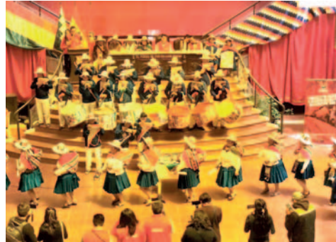
Demostración previa para en presentación del VII Festival Nacional de la Sikureada rumbo al 28 de septiembre

El festival que fue declarado como “Patrimonio Cultural Inmaterial a la Música y Danza de la Sikureada” con su capital Pantaleón Dalence, del departamento de Oruro, mediante la Ley departamental N° 152 del 24 de mayo de 2018, busca la declaratoria nacional a través de la Asamblea Legislativa Plurinacional de Bolivia (ALP), rumbo a 2025, año que se cumple el Bicentenario del país.