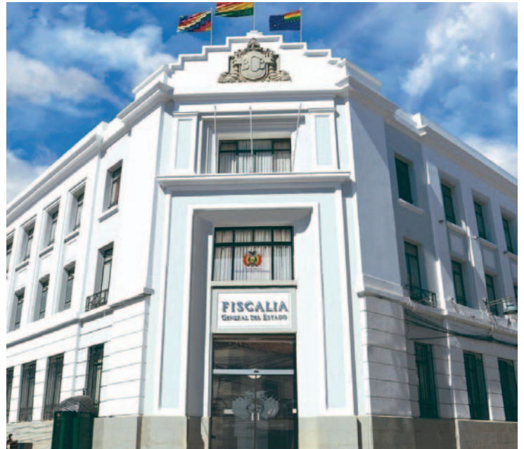
Frontis de la Fiscalía General del Estado /MINISTERIO PÚBLICO