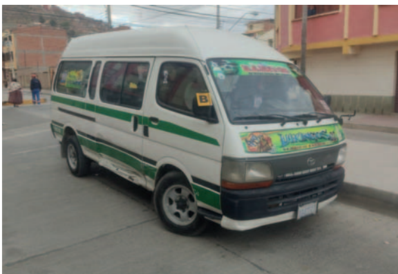
El minibús fue colisionado en la parte lateral derecha de su estructura

sito no tenemos personas heridas", indicó el teniente coronel. Añadió que, en la prueba de