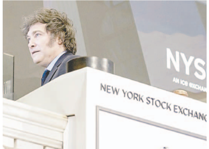
El presidente de Argentina, Javier Milei, durante su visita a Nueva York

Asimismo, considera que esa acción de la Justicia argentina forma parte de “los continuos ataques orquestados por los Estados Unidos y otras potencias extranjeras y sus satélites en el continente para agravar, para mancillar, la soberanía” venezolana. El tribunal argentino también ordenó la captura del ministro de Relaciones Exteriores, Justicia y Paz de Venezuela, Diosdado Cabello, y de otros miembros del Ejecutivo chavista. La decisión fue adoptada por la Cámara Federal de la Ciudad de Buenos Aires en una causa abierta a inicios de 2023, por una denuncia contra Maduro presentada por el Foro Argentino para la Defensa de la Democracia (FADD), basada en el principio de jurisdicción universal, que permite a los países procesar graves