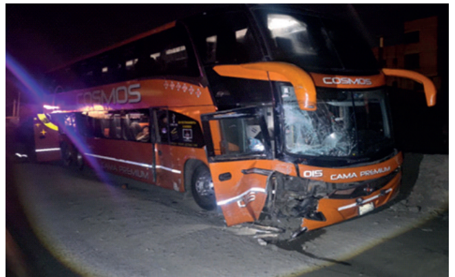
Cuatro personas resultaron lastimadas a causa del accidente

motorizados. Además del conductor del minibus, también resultaron heridos dos mujeres de 41 y 74 años, y