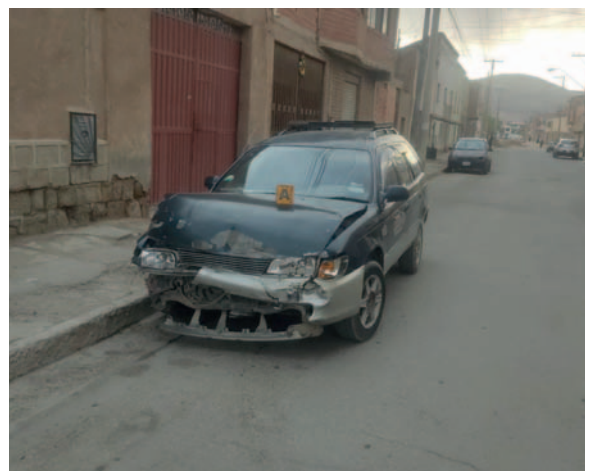
Tránsito indaga las circunstancias del accidente vial

"Dejando como consecuencia daños en la estructura de ambos vehículos; de este hecho de trán-