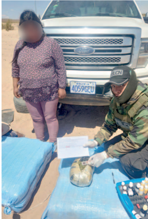
La implicada fue enviada al penal La Merced con prisión preventiva

El fiscal antinarcóticos, Felipe Mamani, explicó que los efectivos de