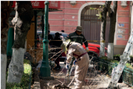
A nivel departamental buscan aprobación de normativa para proteger árboles