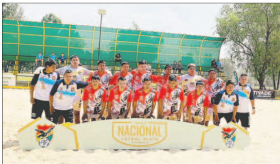
El plantel orureño obtuvo una victoria en el inicio del torneo

Este miércoles se disputará la segunda fecha del torneo nacional. Atlético Pumas jugará ante el elenco de Salud Santa Cruz desde las 09:00 horas.