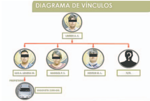
El DACI desbarató a la banda criminal en Cochabamba y los trasladó a Oruro

Los delincuentes, supuestamente, utilizaron carne de pollo para envenenar a los cuatro canes que apoyaban como guardias en la empresa; pos-