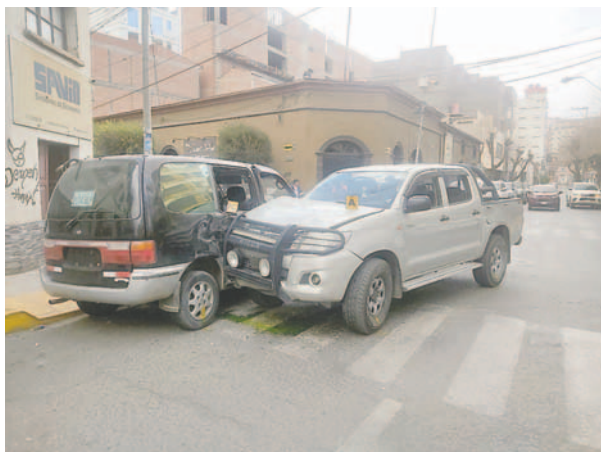
El accidente se registró en la intersección de la Potosí y Montesinos / TRÁNSITO

Según el informe, la camioneta, que se desplazaba de Oeste a Este por la calle Montesinos, no redujo la velocidad al llegar a la intersección y colisionó frontalmente