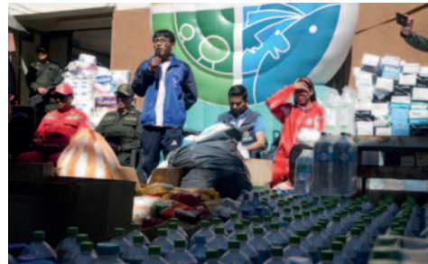
Entregan insumos a la Policía

La entrega consistió en botellones de agua, paque-