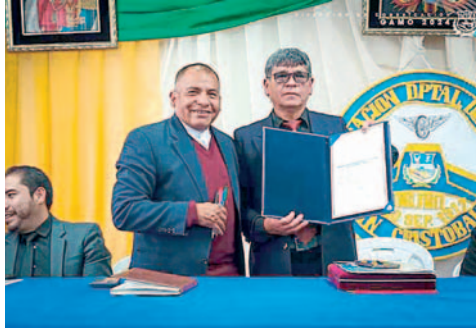
Alconz señaló que se debe aplicar el estudio de costos a través de una socialización

Alconz señaló que un parámetro fundamental para la aplicación de nuevas tarifas es el confort y la calidad de servicio que se ofrece a la ciudadanía; donde todos están conscientes de que el costo de vida ha subido en este tiempo, pero también que el servicio que se brinda a través de los operadores de