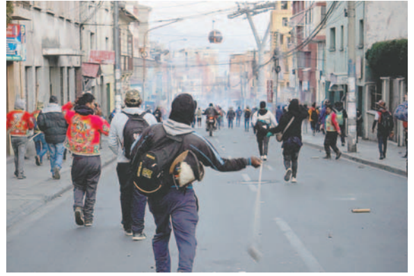
Los enfrentamientos iniciaron al ocaso de la jornada