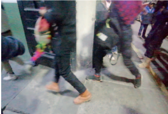
Los adolescentes estaban con vestimenta para pelear durante el evento