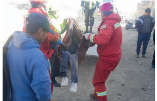
El cadáver es trasladado a la morgue del Cementerio general

la División Investigaciones Especiales de Tránsito, con el objetivo de identificar al conductor y al motorizado.