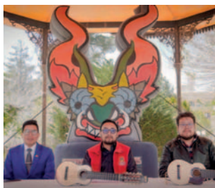
Presentación de la convocatoria para Concurso Departamental de Intérpretes de Charango rumbo a Festival Aiquile 2024 /GADOR

"Este concurso será en el Teatro Internacional donde se va a hacer una preselección de todos los intérpretes e invitar a toda la población departamental que quieran ser parte de la delegación que se puedan presentar el 10 de octubre", invitó el secretario departamental de Cultural