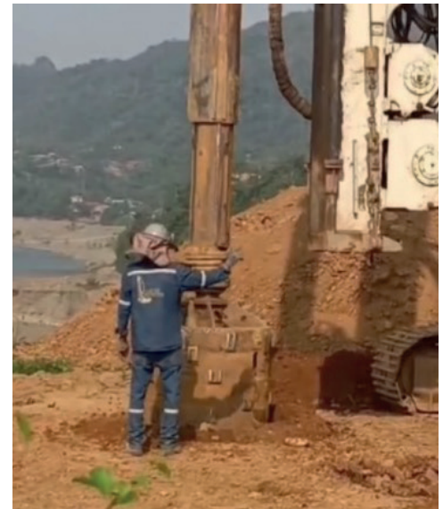
El proyecto ya inició su construcción

el altiplano paceño como parte de una estrategia de desarrollo para lograr servicios de transporte eficientes y seguros por la Red Vial Fundamental rumbo a la industrialización del país.