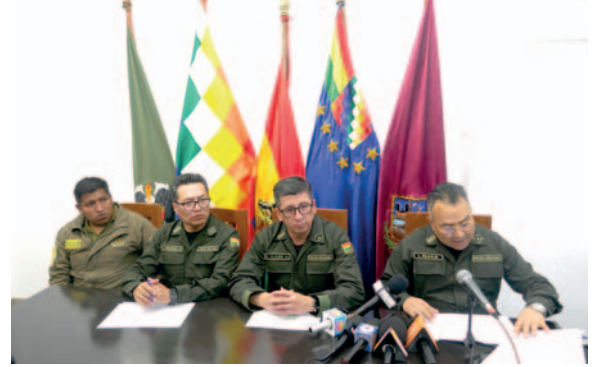
Las autoridades del "verde olivo" informaron sobre la aprehensión de ambas personas