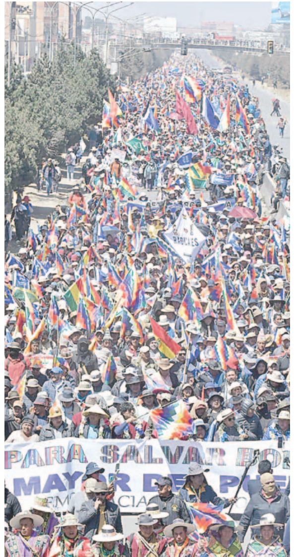
La marcha llegó a El Alto ayer por la mañana y luego descendió a La Paz

Asimismo, durante la marcha en la Plaza Murillo, un grupo de autoconvocados y organizaciones sociales que respaldan a Arce resguardaron el lugar con escudos caseros y petardos. Al concluir los disturbios, el Presidente tenía que salir a dar declaraciones en la puerta del Palacio Quemado; repentinamente, el personal del gobierno levantó los parlantes que se estaban armando y dijeron que ya no haría ninguna declaración ni un mensaje.