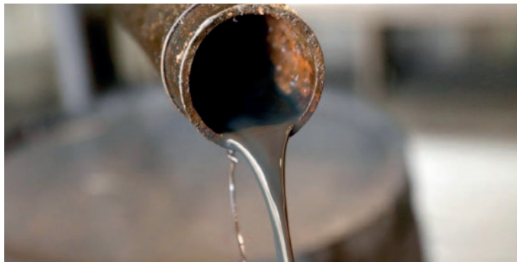
La producción ha caído drásticamente desde 2006 /REFERENCIAL

ca ha escuchado a representantes de empresas estatales referirse a temas políticos y subrayó que “la presidencia de YPFB debería ser técnica y orientada