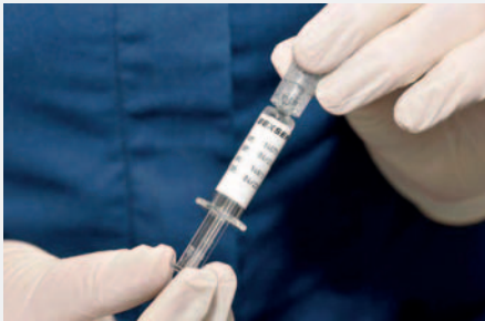
Dos casos fueron confirmados / PREFERENCIAL