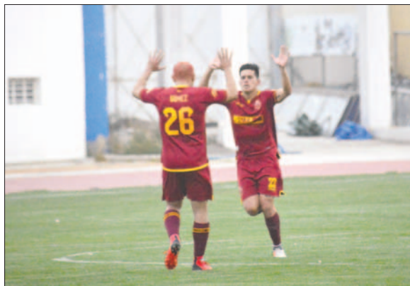
CDT Real Oruro a pesar de varios triunfos, quedó en la segunda casilla

este miércoles, ocasión en que se realizará el sorteo a cargo de la Comisión Organizadora de Competiciones de la Federación Boliviana de Fútbol (FBF). En la ocasión también