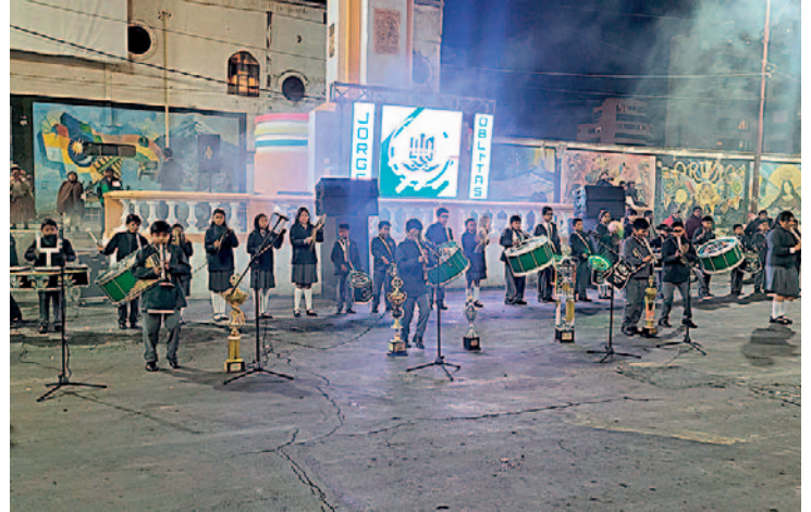
La música de la banda autóctona llenó la Avenida Cívica ayer por la noche