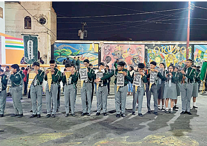
Las zampoñas retumbaron la noche orureña