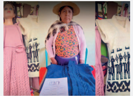
Mujeres exponen potencial en textiles tras capacitación en el rubro