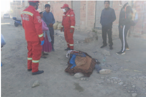
Buscan al conductor que atropelló y mató a un joven en la zona Este de Oruro

Los vecinos pidieron ayuda a la Policía para socorrerlo; sin embargo, al arribo de Bomberos "Calama", el joven yacía muerto. Fue la madre del joven quien señaló que su hijo salió con