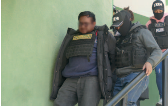
El principal implicado es custodiado por efectivos policiales