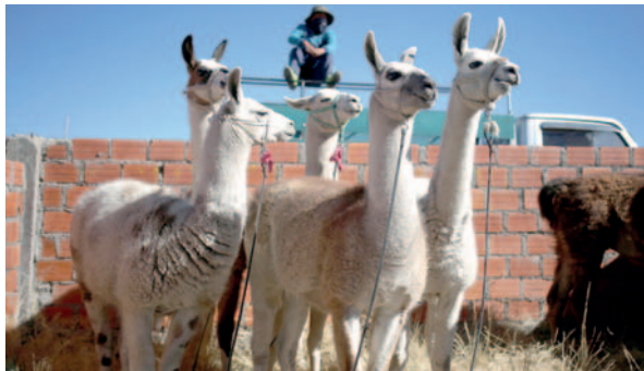
Los camélidos son la fuente principal de ingresos de varias familias

“Este año (...) por familia ha debido morir unas tres a cuatro crías, pero el año pasado (...) por lo me-