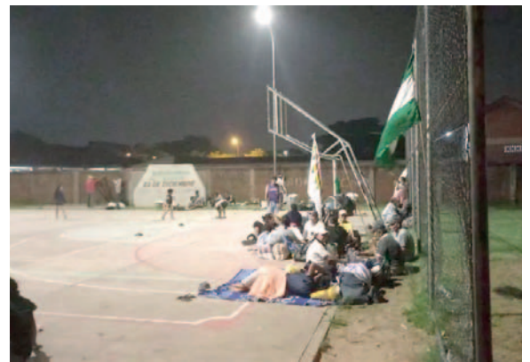
Enfrentando adversidades, los indígenas pasaron la noche en una cancha

La situación ha generado preocupación no solo entre las comunidades indígenas, sino también entre diversos sectores sociales que ven amenazados los recursos naturales y el equilibrio ecológico en la región.