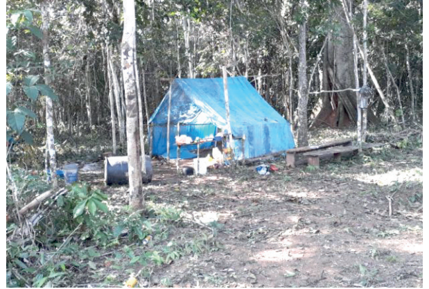
Los avasalladores construyen viviendas temporales para realizar el desmonte en las áreas protegidas /REFERENCIAL

Los habitantes denunciaron que grupos organizados conocidos como interculturales están construyendo brechas y caminos para facilitar desmontes y asentamientos ilegales, poniendo en riesgo tanto la integridad del territorio como la supervivencia misma de la nación chiquitana.