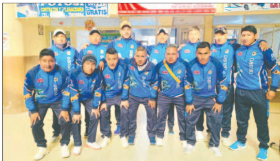
Integrantes del equipo orureño antes de viajar a la sede del torneo