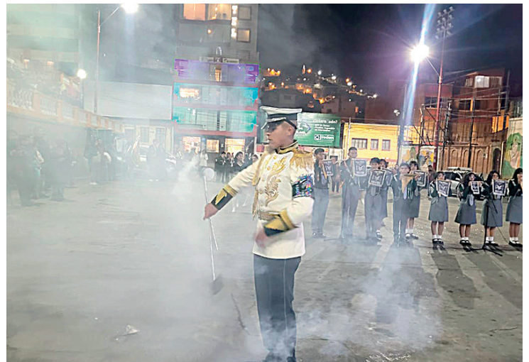
El guaripolero lució todo su talento ayer