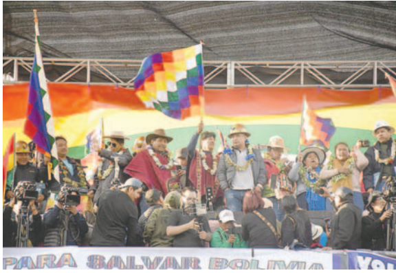
Morales encabezó la concentración que se realizó tras la marcha

La movilización inició desde el municipio de Caracollo hasta la ciudad de La Paz. Este lunes, la movilización partió desde la localidad de Achica Arriba a tempranas horas para descender hasta la sede de gobierno. En El Alto, hubo varias personas concentradas que dieron la bienvenida a Morales y se unieron a su movilización.