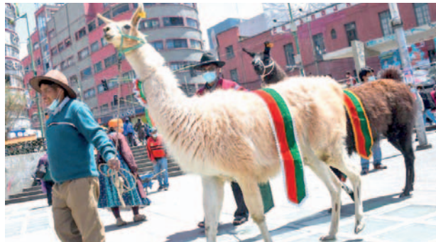
Los productores están enfrentando graves dificultades