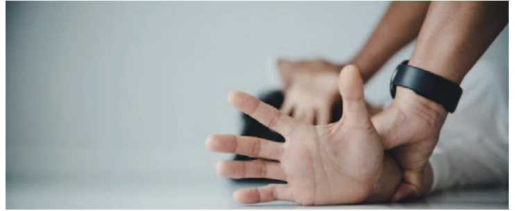
Una joven fue hallada inconsciente tras una fiesta en la Villa Imperial

En este caso también se investiga si otras personas han estado implicadas en este hecho, y no se descarta que haya sido una violación grupal.