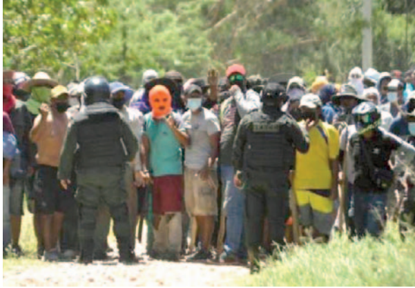
Habitantes de Bajo Paraguará denuncian la presencia de avasalladores armados que bloquean ayuda humanitaria /REFERENCIAL

Los avasalladores se presentaron nuevamente con armas y demandaron que les devuelvan 1.700 litros de combustible, una motocicleta y otros artículos que fueron decomisados por invadir la reserva forestal y el Área Protegida Municipal (APM). Ante esta emergencia, los habitantes llevaron a cabo una asamblea extraordinaria en Piso Firme, donde acordaron comunicar a las autoridades que la comunidad ha habitado la zona de manera sostenible desde tiempos inmemoriales. resguardando el APM que