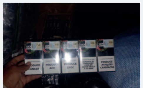
Los pasos fronterizos Boyuibe y Yacuiba se destacan como puntos clave en la lucha contra el tráfico ilegal

De acuerdo con las normas vigentes, para que la mercancía sea legal, cada cajetilla debe incluir información del país de fabricación, el nombre del productor e importador, el Número de Identificación Tributaria y advertencias sobre los efectos en