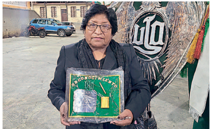
Los profesores encargados de guiar a los estudiantes de las bandas fueron reconocidos

La celebración se cerró con una emotiva felicitación por los 35 años de historia y dedicación al arte musical de la Unidad Educativa Jorge Oblitas.