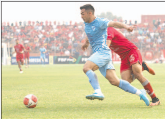
Bolívar después de ganar de visita a Guabirá se alejó con cinco puntos de su perseguidor

De ingreso a la rueda de las revanchas, el calendario se inclina del lado de la "academia", porque este miércoles (20:00) recibirá a Independiente en el estadio "Hernando Siles", con los capitulinos están fuera de la pelea por los premios. Mientras, The Strongest tendrá una visita difícil a la Villa Imperial, donde espera Nacional Potosí, que lucha por llegar a la zona de clasificación.