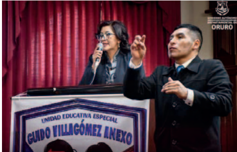
El lenguaje de señas es importante para la población con discapacidad auditiva