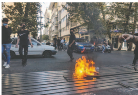
Imagen de protestas en Teherán en octubre de 2022 por la muerte de Mahsa Amini

A principios de agosto, la justicia iraní redujo a la mitad la sentencia de tres años y ocho meses de prisión dictada contra el artista en marzo pasado por propaganda contra el siste-