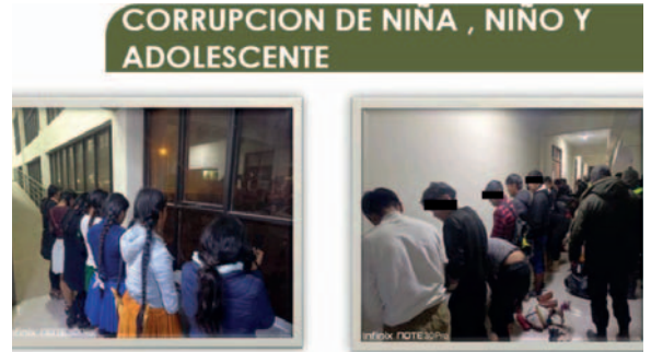
17 varones y siete mujeres fueron remitidos a la DIO

El jefe policial precisó que siete adultos fueron aprehendidos por el presunto delito de corrupción de niña, niño y adolescente. “Actualmente, estamos