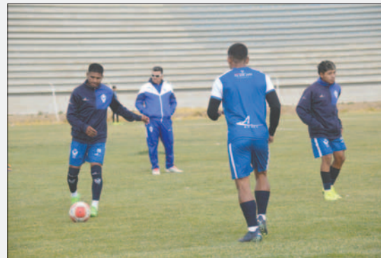
Baldívieso espera que el tema económico se solucione y no se repitan más paros

La dirigencia, de momento, no ha brindado un comunicado oficial sobre la solución del problema de salarios en GV San José.