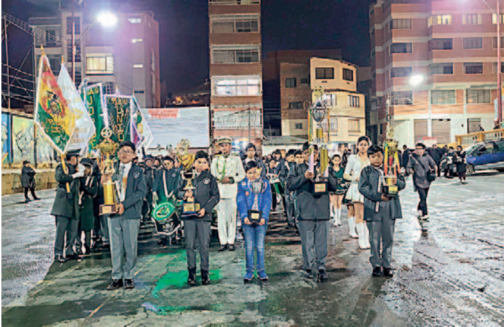
Estudiantes portan los premios logrados por las bandas del Oblitas