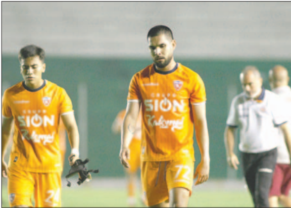
Royal Pari necesita recuperarse lo antes posible, cayó al último lugar de la tabla

están cerca de la zona del descenso indirecto por su pésima producción. Más temprano (18:00), Wilstermann jugará contra Real Santa Cruz, elenco comprometido con la pérdida de categoría, marcha último en la tabla acumulativa.