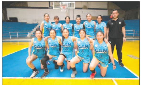
CAN debutará frente a Alemán en la Libofem