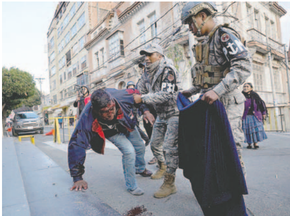
Una persona herida recibió el auxilio de uniformados

Descendieron por la autopista que conecta El Alto con La Paz para llegar hasta el puente de la Cervecería y realizar una concentración encabezada por el exmandatario, donde dieron el plazo al gobierno para cumplir con sus peticiones.