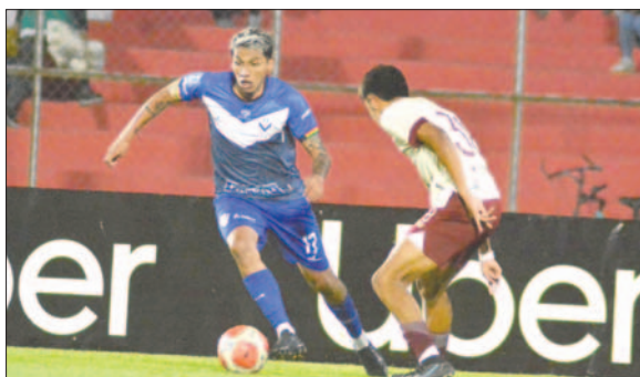
GV San José quiere cobrarse la revancha, en la ida perdió 2-0 en Tarija

dos sectores estarán habilitados para este cotejo, con un costo de 40 bolivianos para la Preferencia y 30 bolivianos para la General, además de medias entradas para niños y adultos mayores.