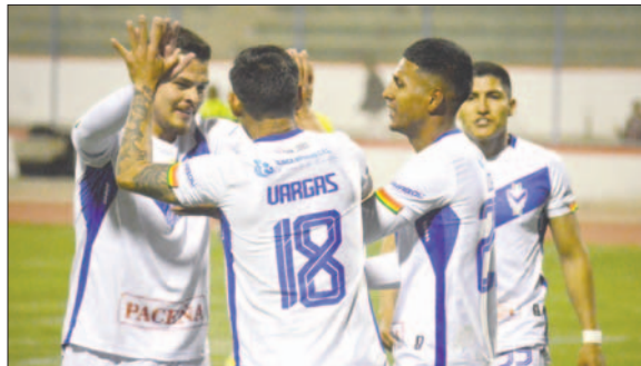
El cuadro orureño pasa por un buen momento futbolístico

dos sectores estarán habilitados para este cotejo, con un costo de 40 bolivianos para la Preferencia y 30 bolivianos para la General, además de medias entradas para niños y adultos mayores.