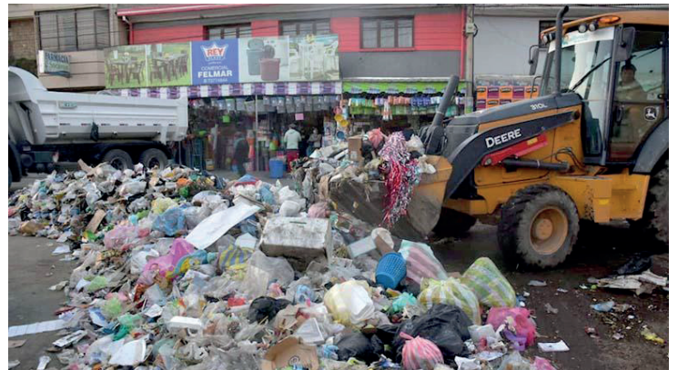
Maquinaria pesada retira la basura que se acumuló en las calles de Quillacollo por el bloqueo del botadero