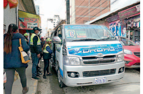
De momento no hay variación en las tarifas del transporte urbano