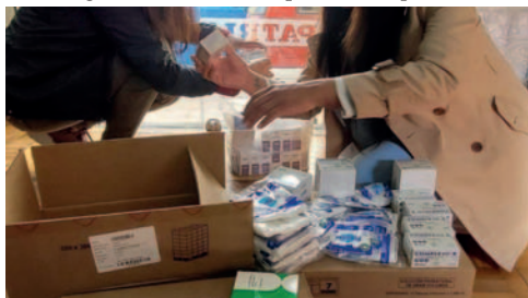
Medicamentos entregados por el Campo Ferial 3 de Julio

De esta manera, esta institución descentralizada de la Universidad Técnica de Oruro (UTO), encargada de organizar Expoteco, entre otras ferias importantes del departamento, se suma a la campaña iniciada la anterior semana, "Actúa Bolivia", demostrando su compromiso con el país y el combate del fuego que en este momento afecta a varios municipios en el oriente boliviano.