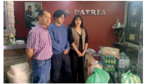
Estudiantes de la Unior y el representante de los profesionales hicieron la entrega de la donación