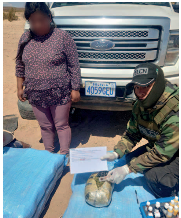
Una mujer fue aprehendida con los 69 paquetes de droga

Desde la Felcn detallaron que secuestraron la droga y el motorizado; el caso fue remitido al Ministerio Público para continuar las investigaciones por tráfico de sustancias controladas.