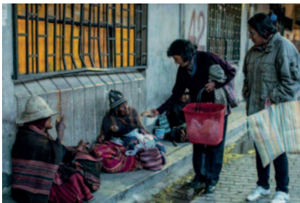
El Gobierno niega altos índices de pobreza