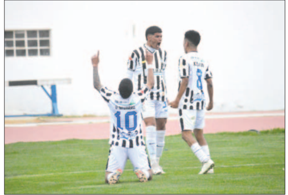
Oruro Royal finalizó como primero de su grupo en la segunda fase

En el caso de Oruro Royal, ganó de visita (3-2) a Río San Juan Humi y de ese modo, sumó 12 unidades, clasificando como primero del grupo "E", por lo que está en el bolillero 1. CDT Real Oruro logró un triunfo de local (3-0) a Destroycers, que quedó al margen de la competencia, sumando 11 unidades;