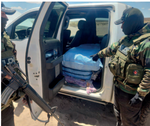
Agentes antinarcóticos hallaron la sustancia controlada dentro la camioneta

Durante la persecución, lanzaron “miguelitos” (púas de metal) con el objetivo de evitar ser capturados; sin embargo,