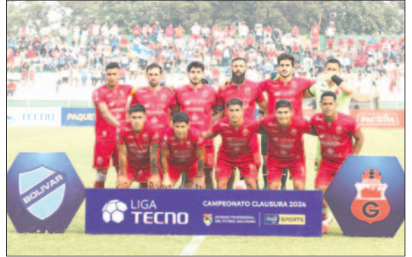
Guabirá jugará contra San Antonio el estadio de Montero en el cual también jugarán de local Oriente Petrolero, Blooming y Real Tomayapo

Ese día, el puntero, Bolívar tendrá la oportunidad de ampliar su diferencia de cinco puntos en relación a The Strongest, en el juego contra Independiente, en el estadio "Hernando Siles", desde las 20:00. Dos horas antes, el "tigre" estará visitando a Nacional Potosí, en otra prueba arriesgada, procurando remediar sus recientes errores futbolísticos.