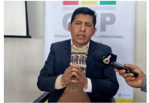
El vocal del TSE, Tahuichi Tahuichi Quispe

lo cual podría tener repercusiones en su estructura organizativa y su capacidad para participar efectivamente en procesos electorales futuros.