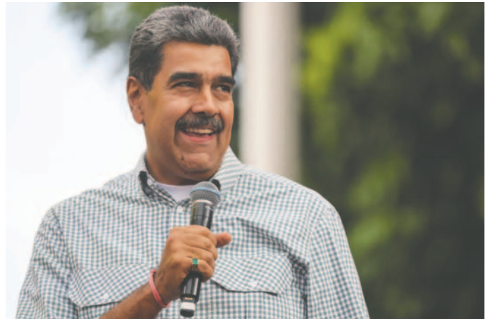
Foto de archivo del presidente de Venezuela, Nicolás Maduro

“Esta decisión de la Justicia argentina envía un fuerte mensaje al fiscal de la CPI, Karim Khan, de que ya es el momento de hacer lo que corresponde y avanzar con órdenes de captura internacional para poner fin a la impunidad en Venezuela. Se debe castigar a los responsables por los delitos de lesa hu-