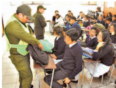
Se han detectado casos de estudiantes bajo los efectos del fentanilo en al menos tres unidades educativas

Según Peñaranda, "la droga se está vendiendo de manera sigilosa, oculta en alimentos aparentemente inofensivos como pasteles, brownies y otros". Además, expresó su preocupación al afirmar que "es alarmante que los menores ya saben de dónde van a comprar".