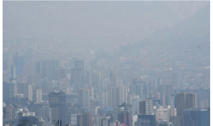
El Índice de Contaminación Atmosférica en La Paz alcanza niveles preocupantes

El ICA del sábado 21 en la ciudad de La Paz fue de 99 y el domingo de 91, lo que significa un rango “regular” de calidad del aire. Esto refleja una variabilidad en los niveles de contaminación que puede