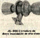
JS-800 Cerradura de acero inoxidable de alta calidad