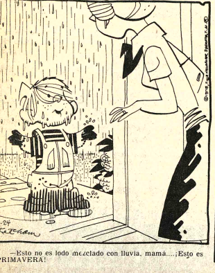
—Esto no es lodo (mezclado con lluvia, mamá...; ¡Esto es PRIMAVERA!