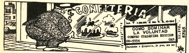
DANIEL EL TRAVIESO