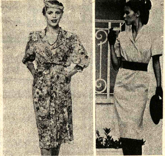
MODA DE VERANO. - De izquierda a derecha: - La línea recta se despliega en manga-murciélago hasta el codo, en este modelo de Balenciaga, en seda beige, motivo exclusivo. - La mayor sencillez y comodidad en este vestido beige y blanco, de lantia Wurmsler, para este modelo de Michael Gorná. - Modelo de Pauline, en seda estampada estilo tapicería antigua. - En piqué de algodón amarillo, un vestido en línea estrecha que afina la silueta.