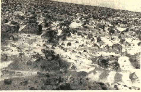
HIELO. Una delgada película de hielo aparece en las piedras de Marte en esta vista de los llanos de Utopia tomada por el Viking Lander 2. Esta capa corresponde a una acumulación de escarcha durante un año marciano (USICA).