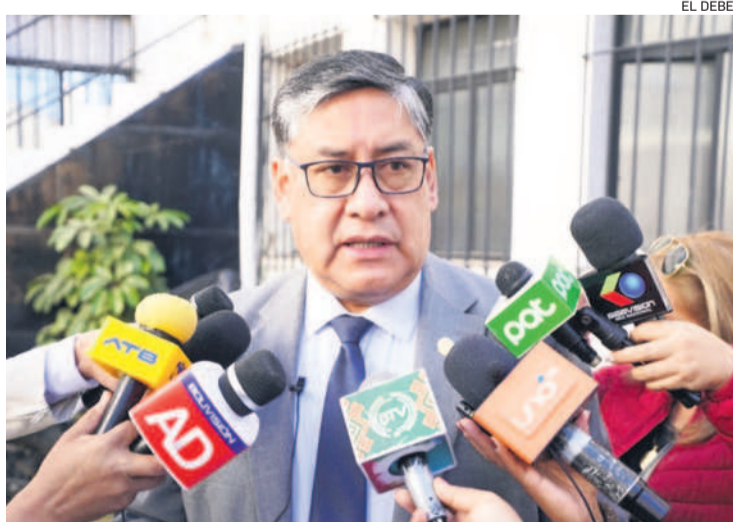
El fiscal general, Juan Lanchipa, dejará su cargo el 22 de octubre.

“Hasta julio del presente año, se realizó una inversión de Bs 18,3 millones para el fortalecimiento de la infraestructura del Ministerio Público que se tradujo en la implementación de 32 plataformas de atención en las nueve Fiscalías Departamentales, IDIF