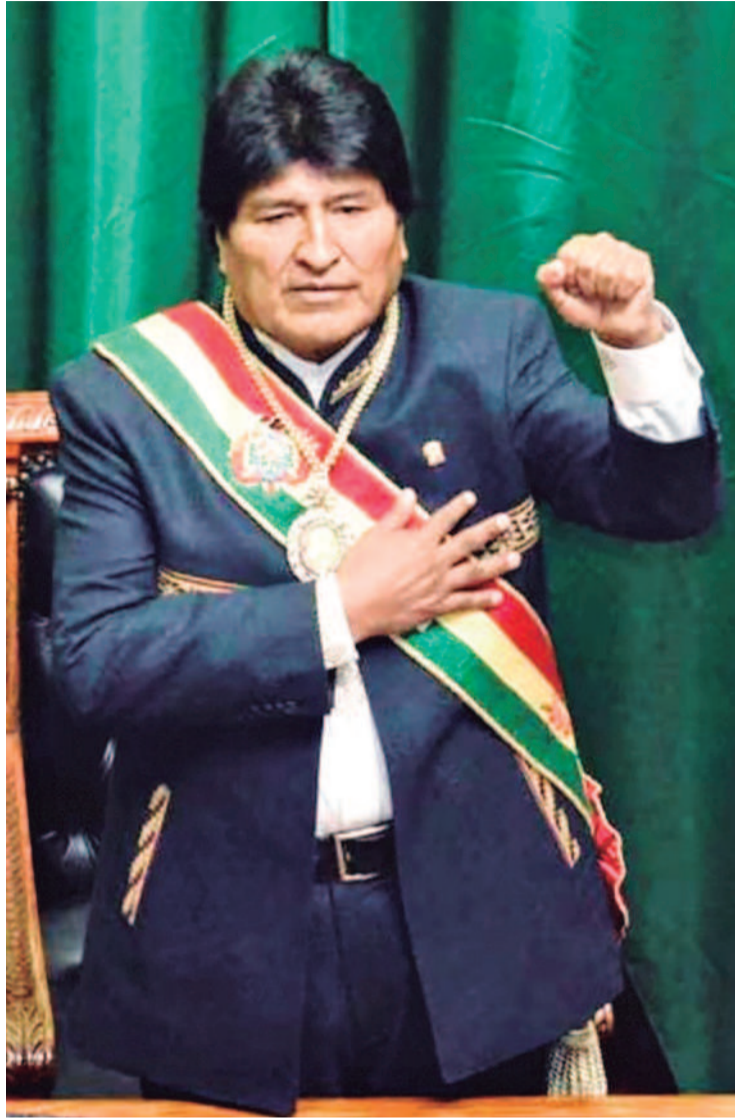
Evo Morales jura como presidente en su tercer mandato. Fue en 2015.

En esta marcha, Morales emite un discurso a la defensiva no sólo contra el Gobierno al que responsabiliza de un posible enfrentamiento, sino también se estrella contra la prensa. “Algunos de ustedes (periodistas) dicen que uso un tenis de 500 dólares, repito nuevamente: todos los tenis que tengo son regalados. Algunos de ustedes son tan irresponsables en difamar. No están difamando al Evo, sino a todo el movimiento, quiero que sepan y les miro de frente, sabemos quién está metido ahí”.