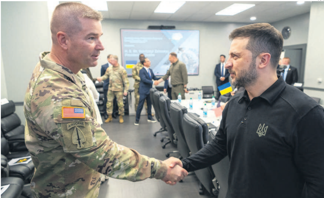
Volodymyr Zelenskyy dijo que en las próximas semanas se decidirá cómo terminar con el conflicto bélico