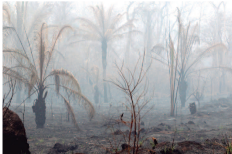
El humo ha convertido a la ciudad y los pueblos en lugares irrespirables y peligrosos para la salud humana y de otros seres

Para la concejala Lola Terrazas, quizás septiembre es el mes cuando se recibe el golpe más duro con los incendios, pero también es el desafío de seguir luchando y defendiendo esta re-