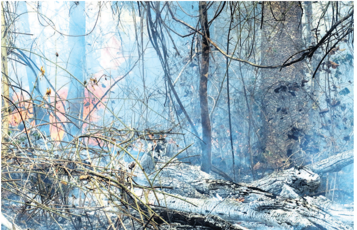
Los territorios indígenas están entre los más afectados por los incendios, que son provocados, según las mismas autoridades y habitantes