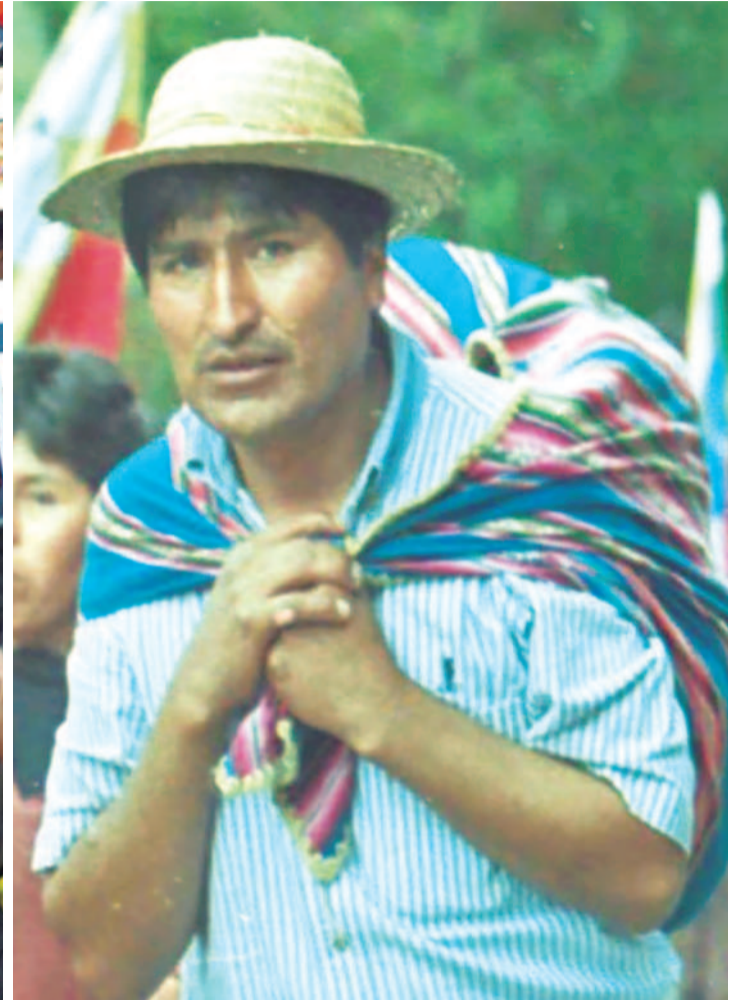
Dos momentos en la vida política de Evo Morales. En la derecha se ve a Evo joven en una marcha en la década de los 90 y en la izquierda, Morales en la reciente marcha a La Paz.