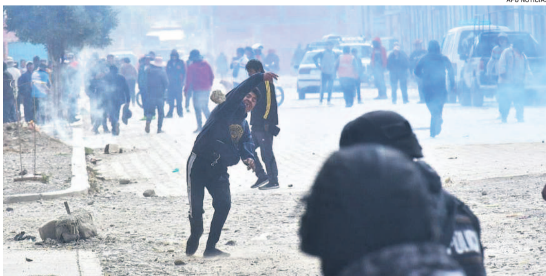
Los grupos afines a Luis Arce y Evo Morales se enfrentaron ayer en la zona de Ventilla de El Alto

Vecinos de la zona de Ventilla de la ciudad de El Alto cerraron la noche de ayer las vías principales e instalaron una vigilia. Un contingente policial permanece en la zona en apronte ante cualquier hecho de violencia.