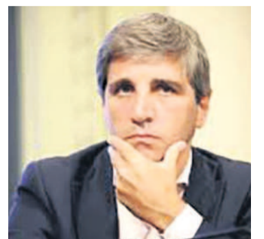
Caputo espera adelantar con FMI

cionales se dará gracias a la disciplina fiscal. En cuanto al FMI, Caputo busca que el organismo permita adelantar a este mes la última revisión pendiente del programa iniciado en 2022, extenderlo hasta octubre, y que desde noviembre puedan comenzar a negociar un programa nuevo.