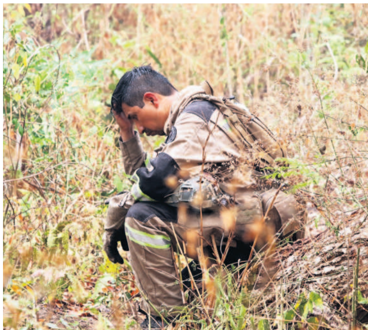
El cansancio de apodera de los voluntarios que no tienen tregua

Lamentaron no estar en los planes de la ayuda aérea, a pesar del humo