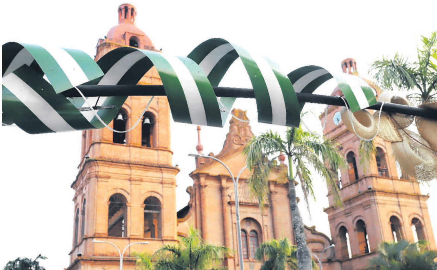
La verde y blanco pone color a los espacios públicos, pero también los hacen los tajibos y alcornoques

Parafraseando a Raúl Otero Reiche, remarcó “¡cuánto sentimiento de amor despilfarrar!”. Pa-