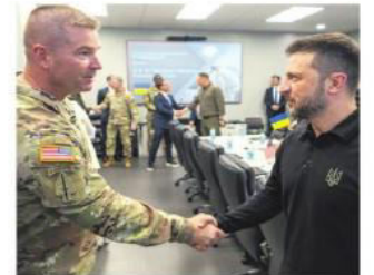
El líder ucraniano llegó a EEUU

jó un poco en Beni, pero creen que sin la ayuda aérea se complica la mitigación y liquidación de los incendios. A4