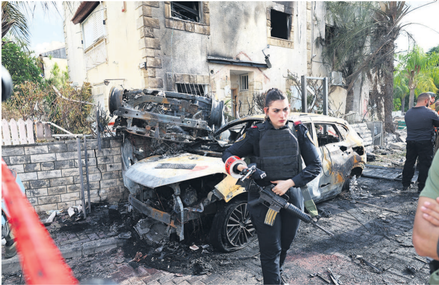
Un miembro de las fuerzas de seguridad israelíes hace guardia en zona acordonada, en Kiryat Bialik, blanco de un ataque el pasado 22