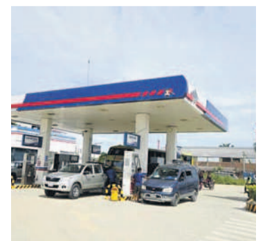
Una gasolinera en Santa Cruz.

Los vehículos objetivo se proyectan entre 61.818 a 125.409 entre camionetas, motorizados deportivos y automóviles. Inicialmente se comercializará el producto en aproximadamente 15 estaciones de servicio de La Paz y Santa Cruz, para posteriormente expandirse al resto del país.