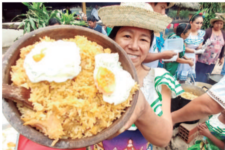
Los emprendedores se dan modos para seguir adelante con sus negocios, a pesar de las malas señales de la economía nacional

ra ella, en septiembre Santa Cruz florece como un corazón, porque la generosidad de esta tierra y su gente es tan grande que olvida que, como dijo también Otero Reiche, en su relato La Guerra no perdona: “la suerte es como la perra, hasta el cuero se lo lleva”.