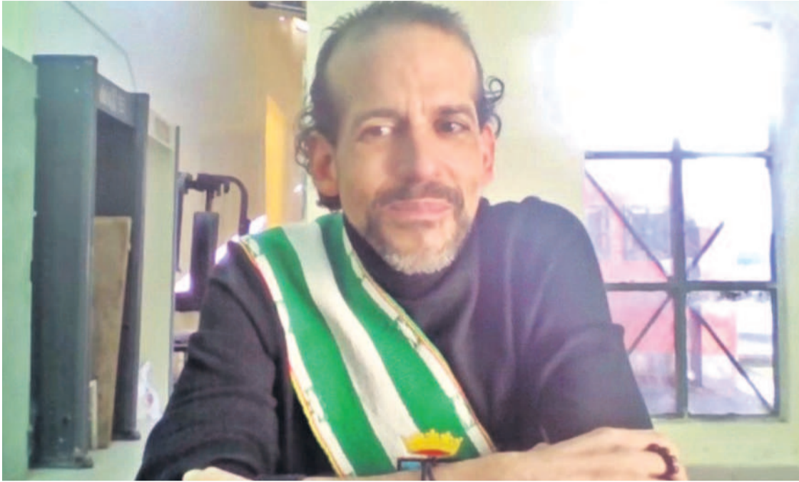
El gobernador electo de Santa Cruz será de citado ante una nueva denuncia del Ministerio de Educación