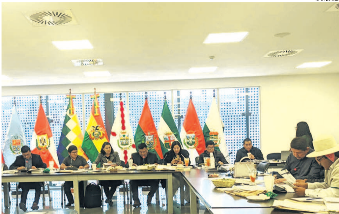
La comisión mixta de Justicia Plural procederá a recibir las impugnaciones a los aspirantes habilitados.