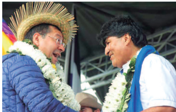
Luis Arce y Evo Morales, en 2021 cuando todo era sonrisas.