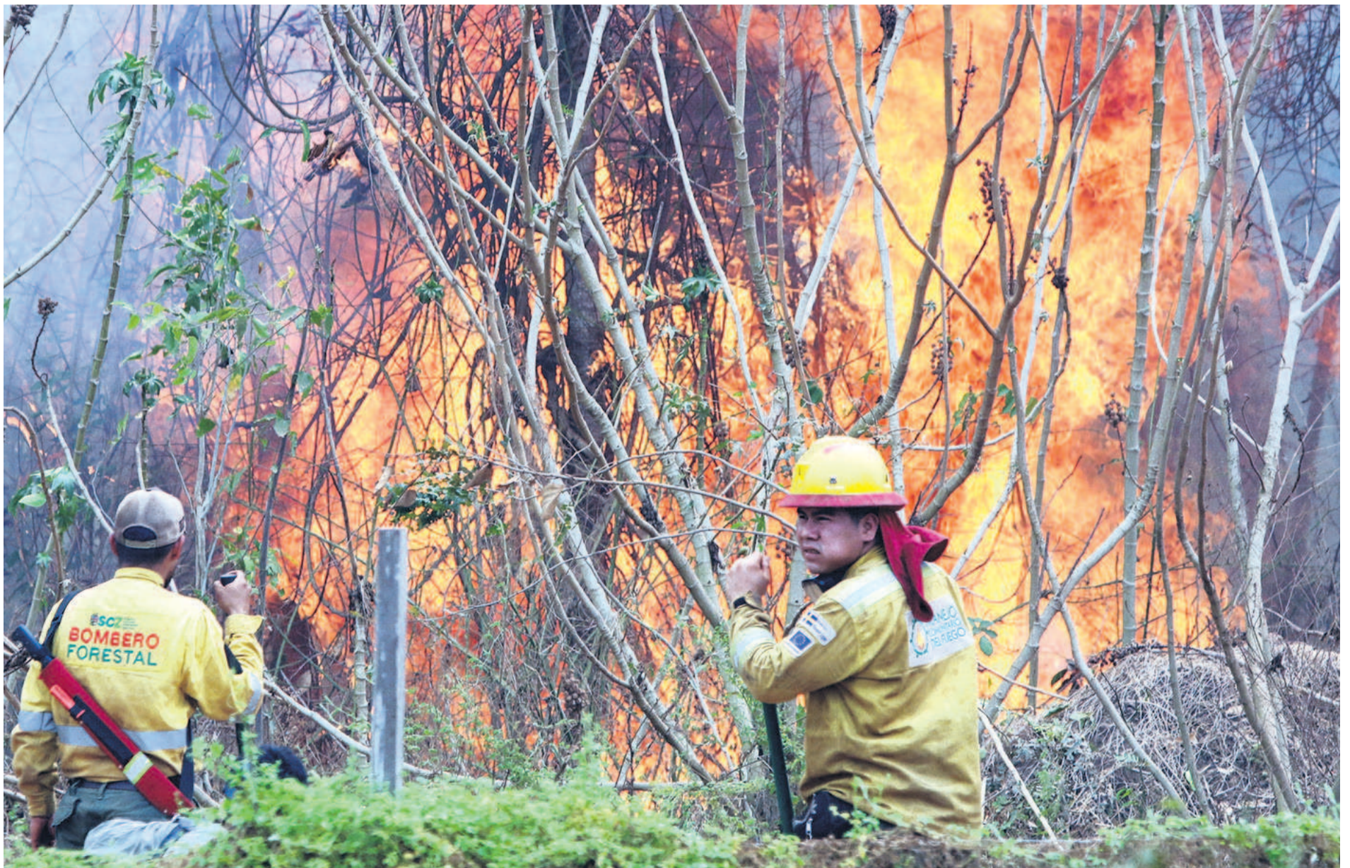
Los incendios forestales han devastado zonas emblemáticas de Santa Cruz, como la Chiquitania. Fauna y flora sufren embates de las llamas, a pesar de esfuerzos de voluntarios