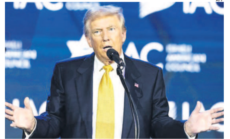
Trump dijo que no se imagina en lo absoluto postulándose otra vez

El republicano espera tener éxito en las urnas el 5 de noviembre para liderar EEUU