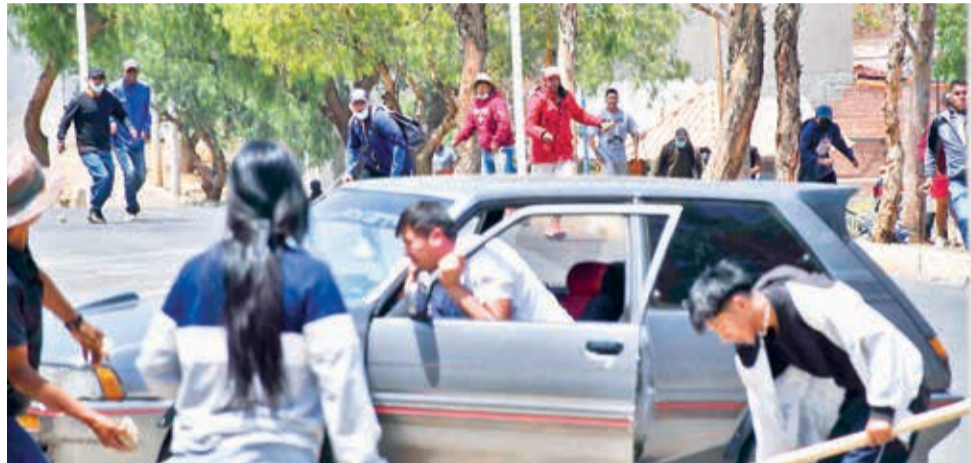
Vecinos de la OTB Primavera se enfrentan a un grupo de avasalladores, ayer.

mitirá el asentamiento de loteadores. "Hemos constatado que hubo un intento de avasallar predios del municipio de Sacaba. Se trata de un área verde, por eso estamos interviniendo y decomisando todo lo que trasladaron los avasalladores: encontramos petardos, picotas, clavos y granadas de gas", dijo. Por su parte, el subcalde del