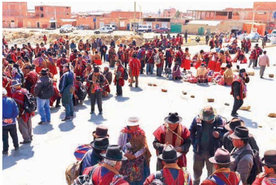
Uno de los puntos de bloqueo en la carretera al santuario de Copacabana.

Según los datos del Viceministerio de Turismo, las pérdidas diarias en La Paz provie-