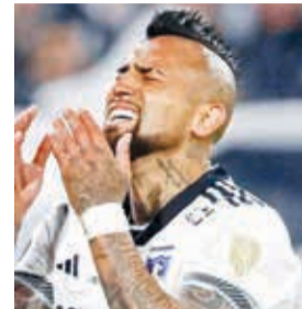
Arturo Vidal, jugador de Colo Colo.