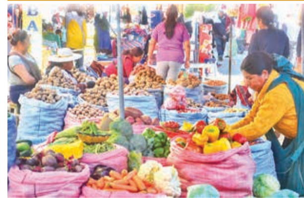
Productos de la canasta familiar a la venta. DANIEL JAMES

Finalmente, la FEPC destacó la necesidad de abordar problemas estructurales como la inflación, la devaluación del boliviano, la caída de las exportaciones de hidrocarburos, la crisis en la balanza de pagos, la disminución de las reservas internacionales y el déficit fiscal, frente a los cuales no se han implementado soluciones efectivas.