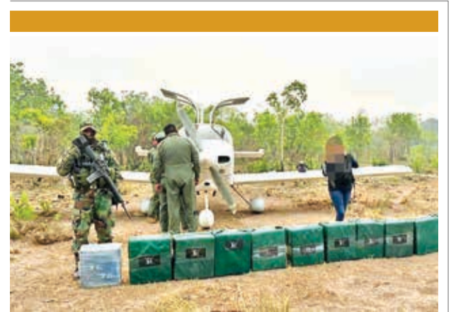
La avioneta en la que se encontró la droga.

escopetas entre semiautomáticas, calibre 12; seis carabinas, marca Akdas, calibre 9 milímetros, y seis fusiles de asalto, marca Akdas, modelo Semx 55K, calibre 5,56 milímetros, según datos oficiales.