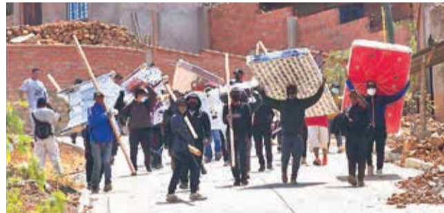
Personas desalojadas se retiran con sus pertenencias.

mitirá el asentamiento de loteadores. "Hemos constatado que hubo un intento de avasallar predios del municipio de Sacaba. Se trata de un área verde, por eso estamos interviniendo y decomisando todo lo que trasladaron los avasalladores: encontramos petardos, picotas, clavos y granadas de gas", dijo. Por su parte, el subcalde del