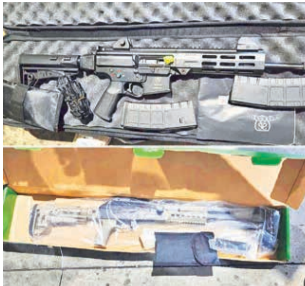
Una de las armas secuestradas.

El ministro de Gobierno, Eduardo del Castillo, señaló que un grupo de inteligencia de la Policía logró detectar el cargamento de armas en el almacén 20 de depósitos aduaneros bolivianos (DAB), en el sector encomiendas del aero-