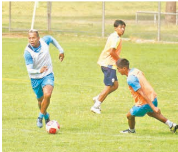
Entrenamiento de Aurora en el complejo de la laguna Alalay. CARLOS LÓPEZ