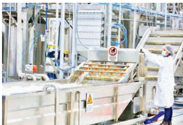
La planta de transformación de papa en La Paz.

Entre los principales productos que se procesarán en la planta destacan 3.094 toneladas de papa prefrita congelada, 1.027 toneladas de puré de papa, 478 toneladas de hojuelas de papa y 312 toneladas de almidón de