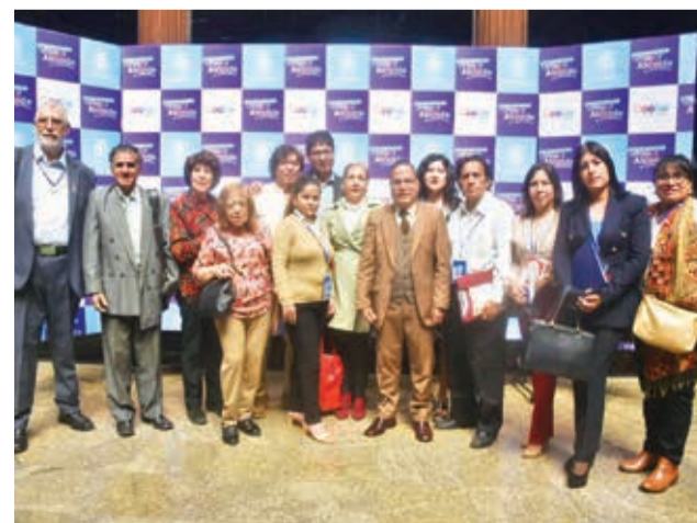
Lanzamiento del congreso junto a los artistas participantes, ayer.

El congreso es también una oportunidad para que los asistentes conozcan más sobre la cultura cochala, sus tradiciones