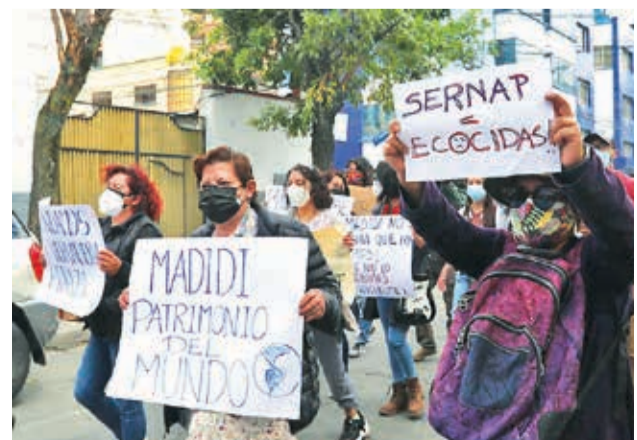
Una marcha de protesta contra la minería ilegal.