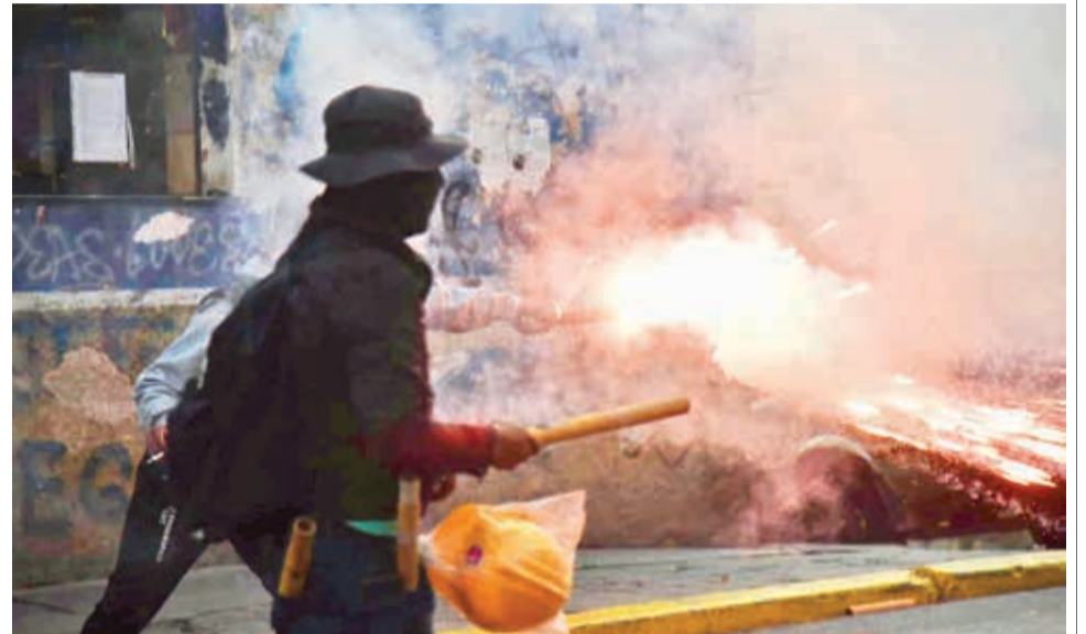
Enfrentamientos en La Paz entre evistas y arcistas, ayer.

En tanto, ante la llegada de la marcha, los seguidores del presidente Arce colocaron barricadas y rodearon la plaza Murillo, donde se encuentra la sede del Ejecutivo, por temor a que los afines a Morales se intentaran tomar la Casa de Gobierno.