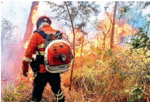
Los incendios continúan en áreas forestales del oriente. IPA

Sin embargo, los bomberos y voluntarios aseguraron que las tareas son insuficien-