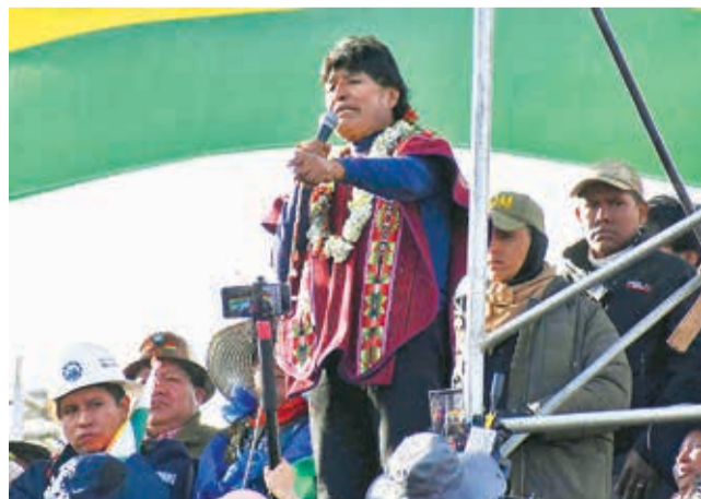
Evo Morales durante su discurso ayer en La Paz.

Morales tiene mucha experiencia política, a diferencia de Arce; en tanto el man-