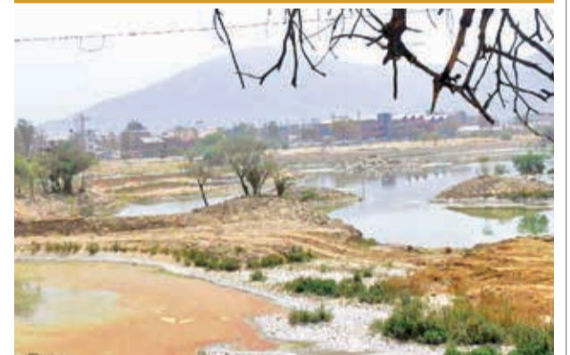
El nivel de agua disminuye en la laguna Alalay.