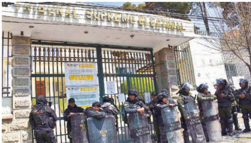
Policías resguardan el inmueble del Tribunal Supremo Electoral, ayer en La Paz.