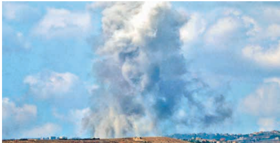
El humo se eleva tras un ataque aéreo israelí contra una aldea libanesa, visto desde la Alta Galilea, en el norte de Israel.

“¡Por favor, salgan de la zona de peligro ahora!”, instó el mandatario en un videomensaje. “Tomen en serio esta advertencia. No permitan que Hizbulá ponga en peligro sus vidas y las de sus seres queridos”, añadió.