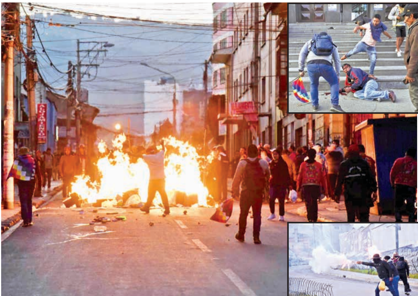
Los arcistas y evistas sostuvieron duros enfrentamientos alrededor de la plaza Murillo al finalizar el cabildo, con explosivos, golpes y petardos, ayer.