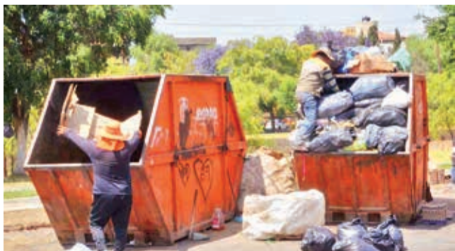
Personal de EMSA levanta basura acumulada, ayer. H. ANDIA

Administración. Promany EMSA se harán cargo de las operaciones durante seis meses mientras se realiza una nueva contratación