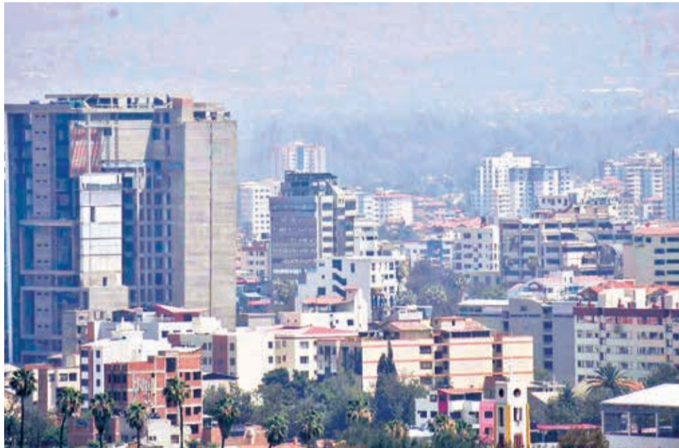
Una capa de humo cubre nuevamente el centro de la ciudad ayer. CARLOS LÓPEZ

Los expertos de la UMSS y de la Red MoniCA aseguraron que las lluvias ayudarían a disipar la humareda.