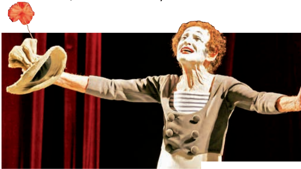
Marcel Marceau como Bip, su personaje más emblemático.