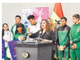
Presentación de las becas Sueño Bicentenario.

Hasta el jueves 19 de septiembre, según informó el Viceministerio de Deportes, 197 deportistas presentaron la documentación exigida.