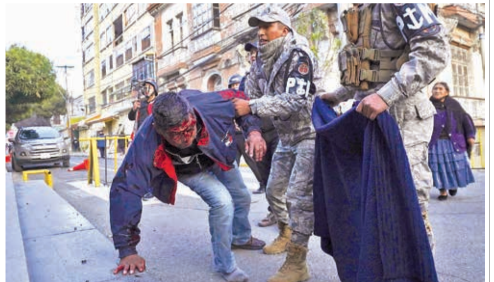
Luego de la marcha de Morales, ayer hubo peleas entre bandos masistas.