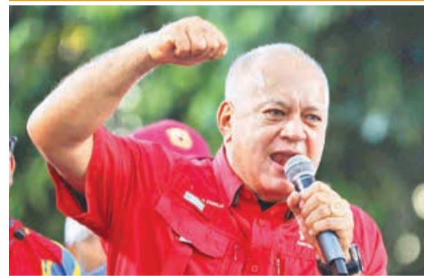
Diosdado Cabello, primer vicepresidente de Venezuela.

El viernes, el portavoz de Milei, Manuel Adorni, ridiculizó el embate venezolano. “Es todo una ridiculez. Una dictadura no tiene por qué entender la división de poderes, pero la decisión del avión es una decisión judicial de Argentina y no del presidente del país”, afirmó Adorni.