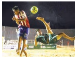
Pasaje de un partido de fútbol de playa.

El complejo del club Aurora recibirá desde hoy (9:00) el primer torneo nacional de fútbol playa, evento que reunirá a ocho elencos nacionales que buscan clasificarse a la Copa Libertado-