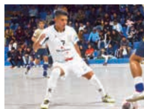
Un partido Muriel vs. Fantasma. HA

El club valluno Víctor Muriel encajó su segunda derrota en el grupo B de la Liga Nacional de Futsal, al cabo de la jornada 10 que además definió la clasificación anticipada del bicam-