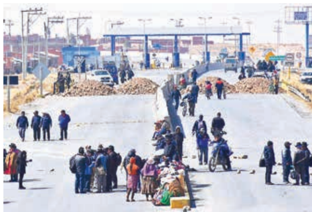
Un punto de bloqueo en el occidente boliviano.

Preocupación. Las amenazas de instalar medidas de presión buscando la salida del presidente Luis Arce ponen en vilo al sector empresarial