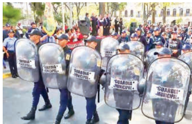
El desfile de la Guardia Municipal ayer.

El dueño demandó a ocho personas por robo, biocidio y daño a la propiedad privada, luego de que una turba ingresara de forma violenta a su granja.