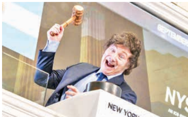
El presidente de Argentina. Javier Milei.

Conflicto. El régimen chavista pide la captura del Presidente argentino, de su hermana y de la Ministra de Seguridad por el caso del avión venezolano entregado a EEUU