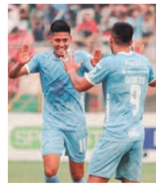
El festejo de los jugadores de Bolívar.