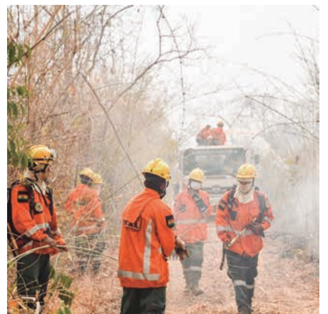
Bomberos combaten el fuego.

Los incendios continúan por más de dos meses, y se reportan aún activos en Santa Cruz, Beni y La Paz, precisó Calvimontes.