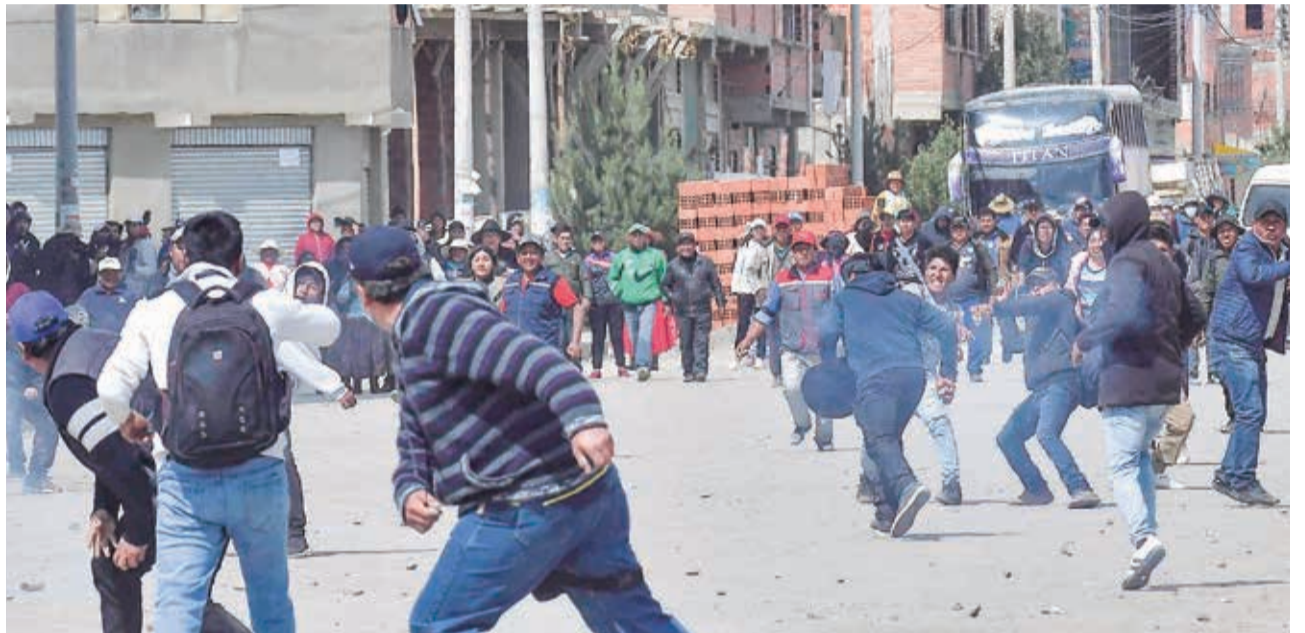
Enfrentamiento entre “arcistas” y “evistas” en la zona de Ventilla, en las afueras de El Alto.

Hasta el cierre de ayer no había vistos de que el diálogo entre Evo y Arce se instalara, y para hoy se espera la llegada de la marcha.