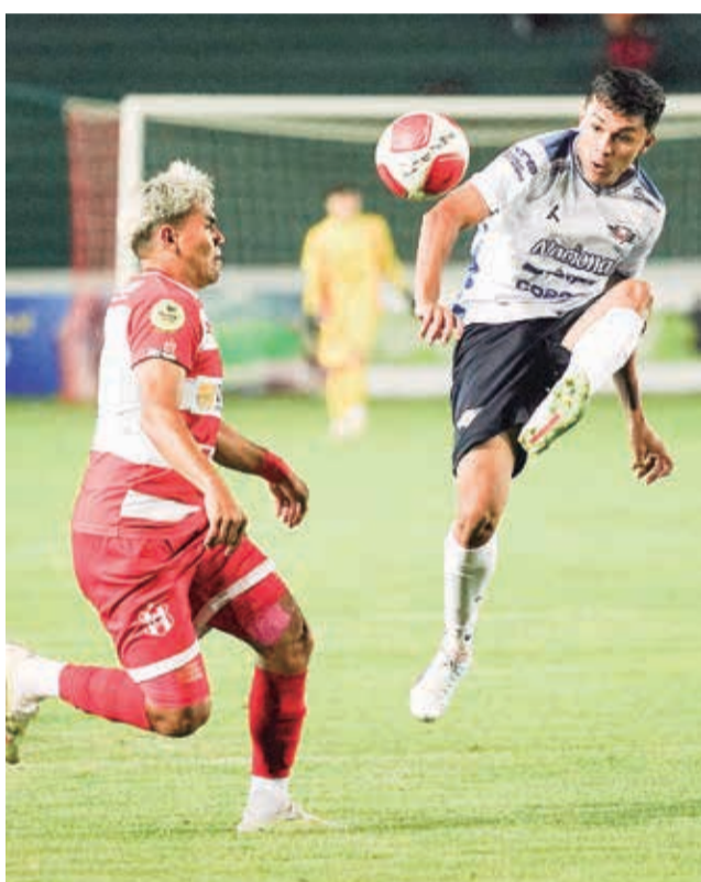
Una acción del partido que se jugó ayer en el estadio Patria, en Sucre.