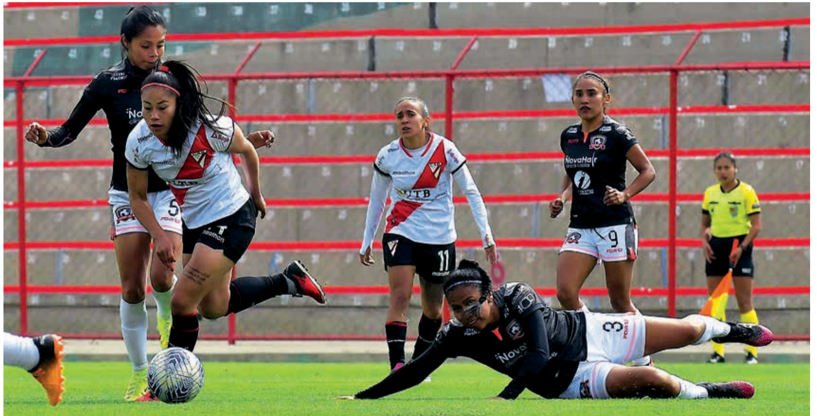
Pasaje de la final de la Liga Femenina del Fútbol Boliviano, con Always Ready y Astor FC en el estadio Municipal de Villa Ingenio, el domingo 8 de septiembre pasado.

En Cochabamba, sin ir más lejos, el fútbol damas se fortaleció, a mediados de la década de los 2000, con ocho clubes. Hoy, 54 clubes forman parte de la División Femenina de