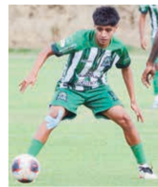
Tiquipaya celebró ayer la clasificación en el torneo. HA

El sorteo está previsto para esta semana,