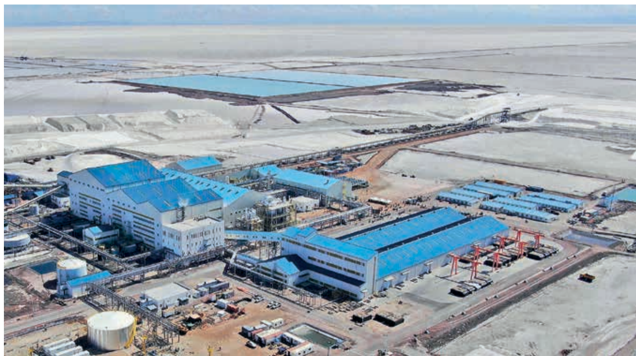
Inauguración de la planta industrial de carbonato de litio en el salar de Uyuni, en diciembre de 2023.