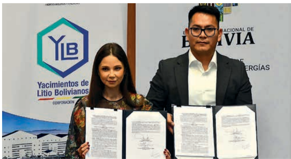
Firma del contrato entre YLB y Uranium One Group.

El 11 de septiembre, Yacimientos de Litio Bolivianos (YLB) y Uranium One firmaron el contrato por 970 millones de dólares, que contempla la construcción de una planta de extracción directa de litio (EDL) en el salar de Uyuni. La planta, según los planes oficiales, comenzaría a operar en dos años