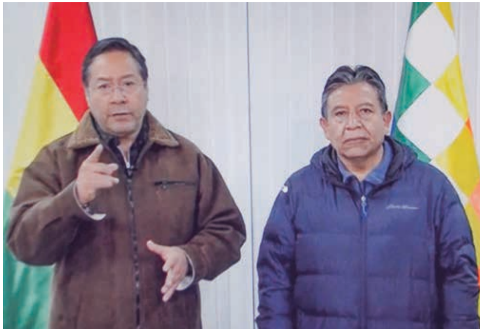
El presidente Luis Arce junto al vicepresidente David Choquehuanca, anoche.

En ambos carriles de la carretera a Oruro, altura cruce Ventilla, permanece interrumpido al tráfico vehicular. Esta carretera es la principal vía de conexión con la Ceja, frontera entre El Alto y La