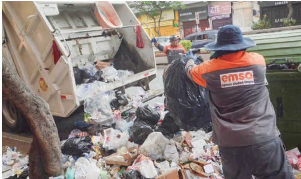
Personal de EMSA, Obras Públicas, Semapa y Emavra limpian la ciudad. HERNÁN ANDÍA

La Alcaldía ha proyectado que el proceso de reco de basura en la ciudad se regularizará en un plazo de entre 24 y 48 horas a partir de la tarde del domingo, lo que permitirá comenzar a despejar los puntos críticos.