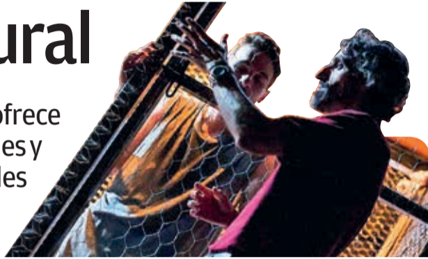
“Tebas Land” es la primera obra del Festival Peter Travesí que se presentará en el teatro Achá. Está dirigida por Alejandro Maraño. FACEBOOK

Actividades. Esta semana, Cochabamba ofrece una diversa agenda cultural con exposiciones y el inicio del Peter Travesí, uno de los festivales teatrales más importantes del país