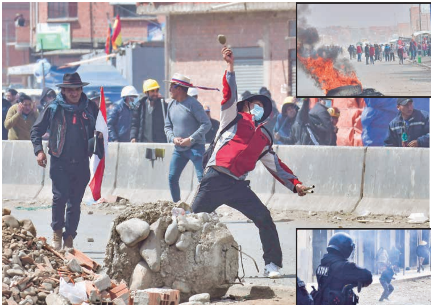
El enfrentamiento entre arcistas y evistas en Ventilla con piedras, petardos y dinamitas, ayer. Unos 100 policías gasificaron y dispersaron a los manifestantes.

Pedido. En el cabildo en Ventilla, los arcistas dieron su apoyo al Gobierno y exigieron aprehender a Morales. La marcha evista se acerca a La Paz. Págs. 2-3