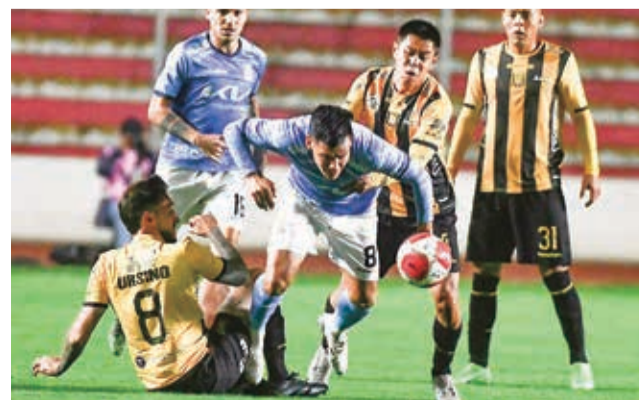
Una incidencia del partido entre The Strongest y Blooming, ayer. APG

Era el 1-1 y en más dependía de cada equipo irse sobre el arco rival para intentar anotar