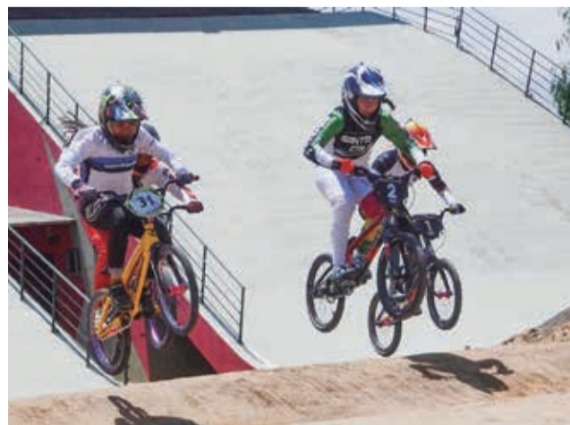
La jornada de competencia del BMX, ayer.