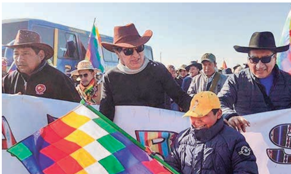
El expresidente de Bolivia, Evo Morales, encabeza la marcha hacia La Paz.

Asimismo indicó que Evo busca "acabar con Bolivia a través del dolor, la muerte y el luto".