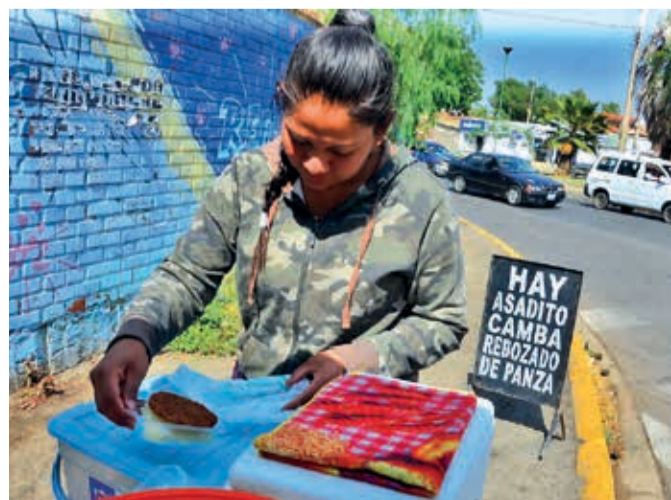
Negocio de comida cruceña en la avenida D'Orbigny.