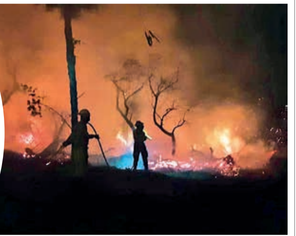
Incendios que persisten en la Chiquitanía. APG