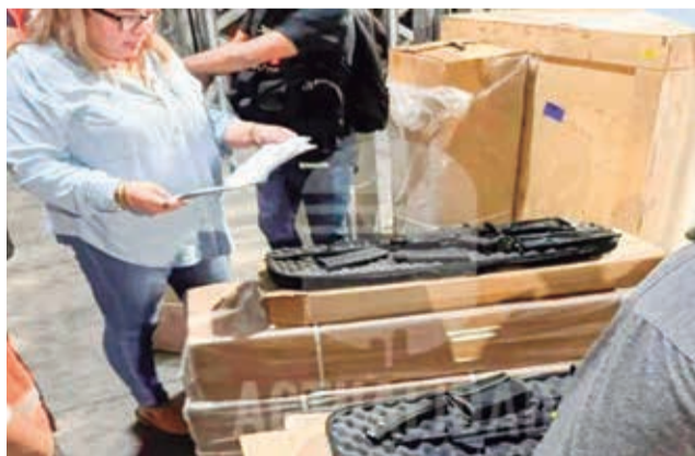
Parte del armamento incautado en el aeropuerto.

La Policía Boliviana y la Fiscalía incautaron la noche del viernes casi 200 armas de fuego de uso militar y policial que llegaron desde Colombia al aeropuerto de Viru Viru, Santa Cruz. Se abrió una investigación sobre el destino y uso de este armamento, aunque el Gobierno presume que serían para generar convulsión en el país o actos delictivos.