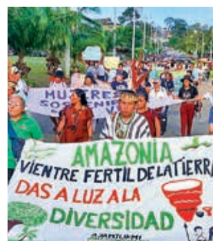
Indígenas exigen respeto al Amazonas.

El daño ambiental en Bolivia por eventos climáticos extremos como incendios, inundaciones, granizadas, sequías y heladas en los últimos 22 años fue cuantificado en 2.954 millones de dólares, de acuerdo con una investigación realizada por la Plataforma Boliviana Frente al Cambio Climático