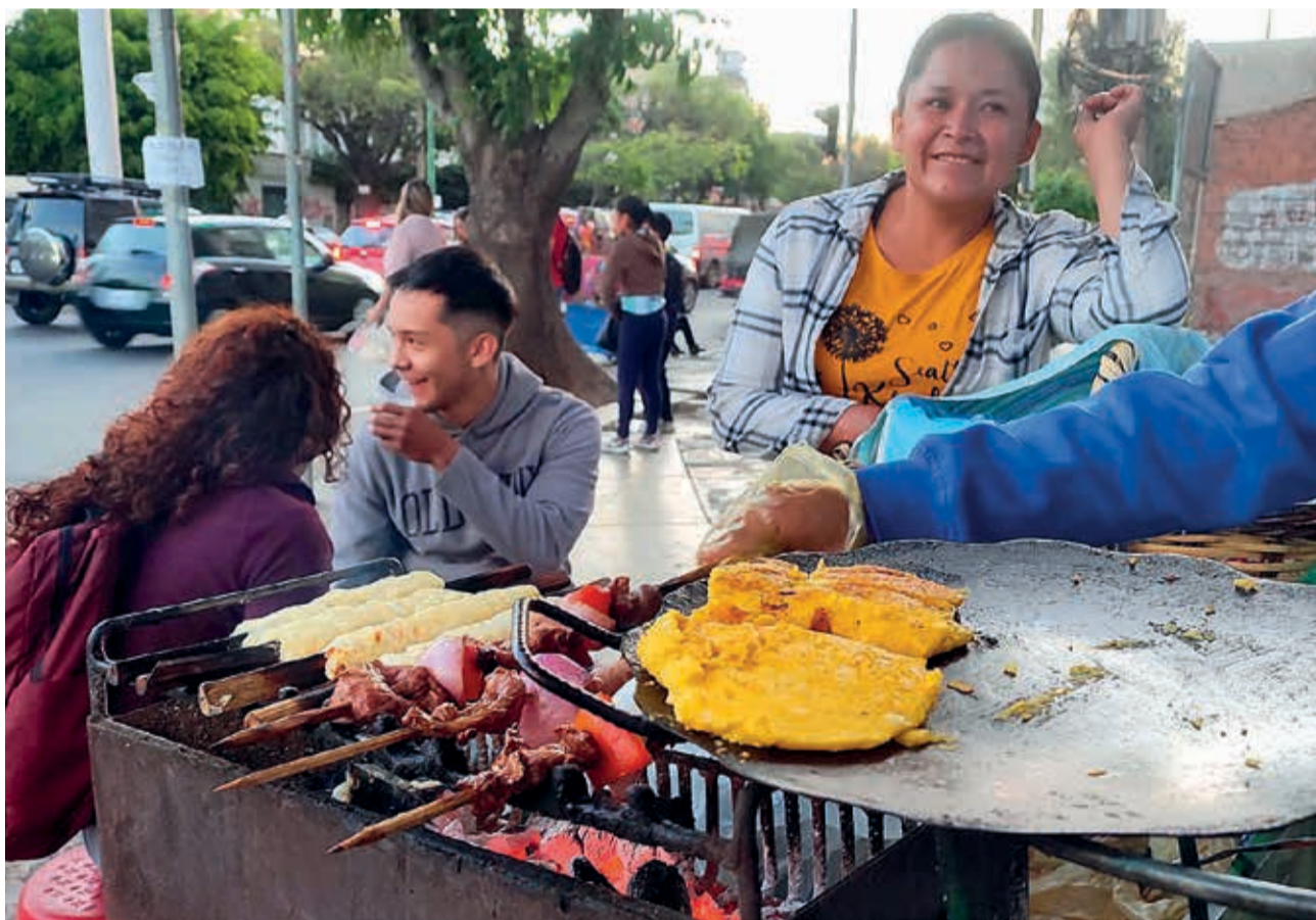
Un emprendimiento del llamado sonso, un manjar típico de la gastronomía cruceña.