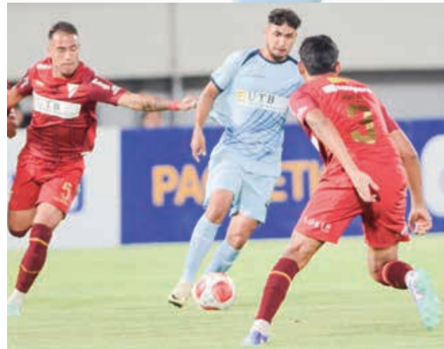
Tres jugadores de Always Ready intentan detener a Sejas.