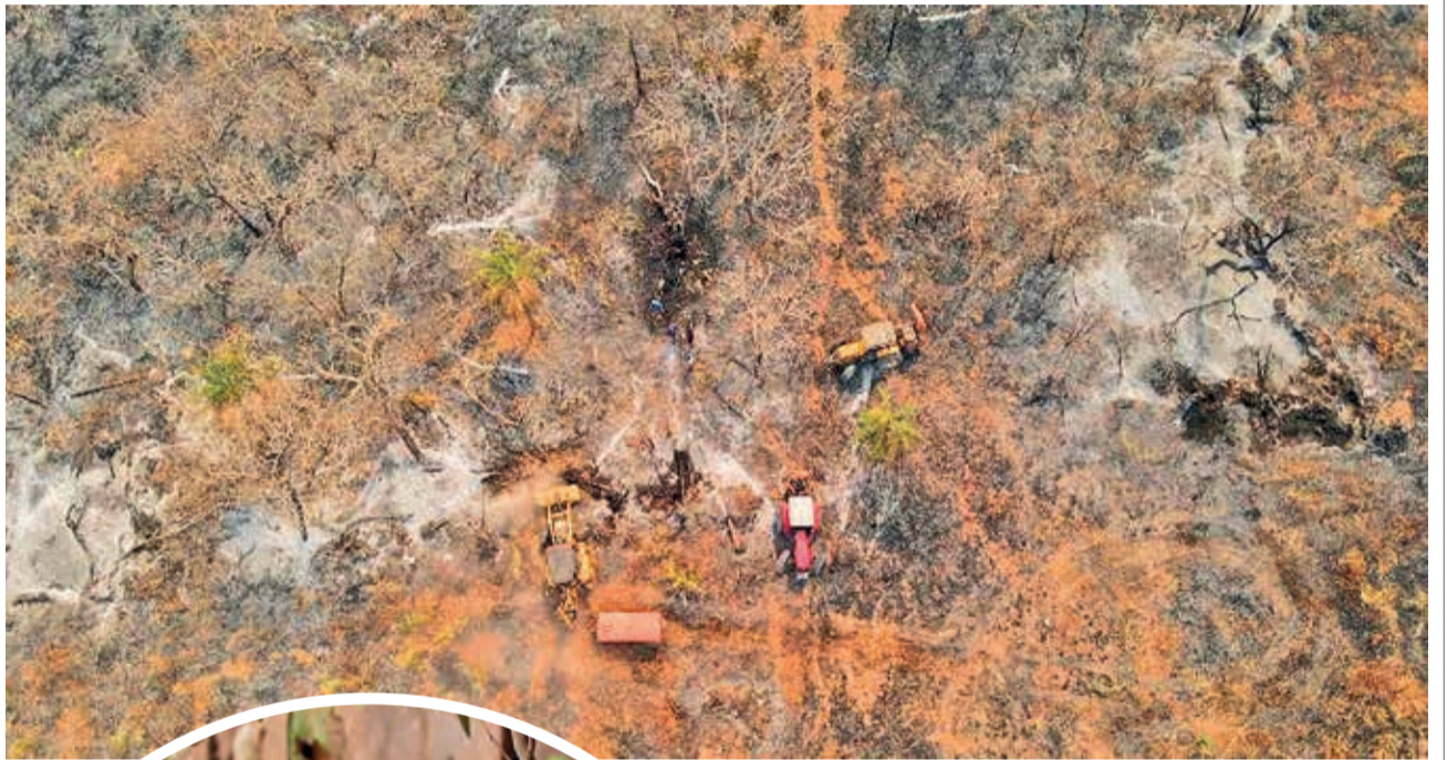
Área boscosa consumida por el fuego.