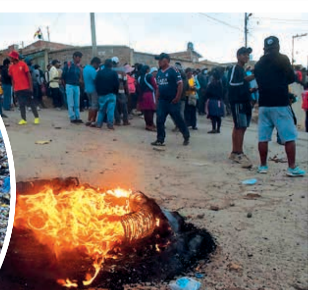
El bloqueo de los vecinos del Distrito 15 en el ingreso al botadero. JOSÉ ROCHA