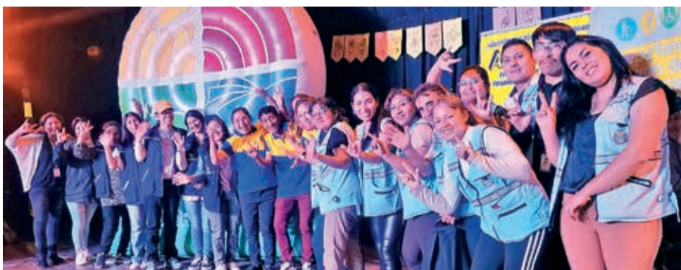
Participantes del Festiseñas 2024, realizado el 13 de septiembre pasado.

en coordinación con la Federación Boliviana de Sordos y la Asociación de Intérpretes de Lengua de Señas de Bolivia, realiza diversas actividades para promover los derechos lingüísticos y culturales y fortalecer la identidad de la comunidad sorda, buscando concientizar a la sociedad sobre la importancia de esta lengua para la inclusión de esta población.