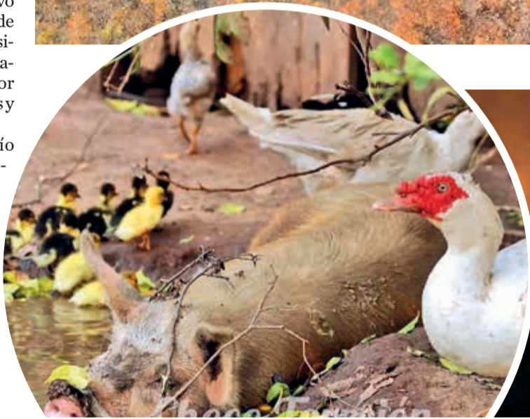
Comunidades indígenas pierden sus animales. GADSC