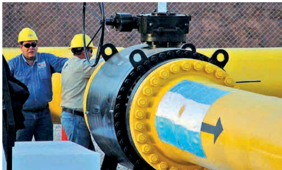
El ducto por el cual Bolivia aún sigue exportando gas al mercado argentino.

que en su apogeo operaba a plena capacidad, ahora funcionará a menos de la mitad, generando ingresos mediante el alquiler de ductos.