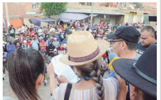
La comisión y los vecinos dialogaron más de 3 horas.