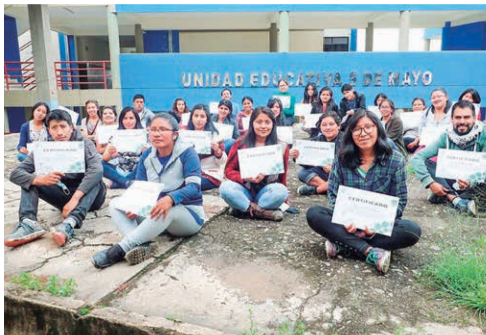
Participantes del programa de ExB en una unidad educativa de La Paz.