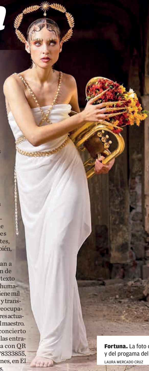
Fortuna. La foto del afiche y del programa del concierto.

Este es el tercer concierto de la OFC este año, las entradas están a la venta con QR mediante el móvil 78333855, y desde mañana, lunes, en El Portal, de 9 a 19 horas.