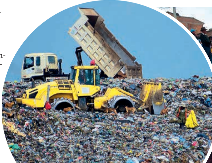
La disposición de basura sin clasificación en el relleno de K'ara K'ara. CARLOS LÓPEZ