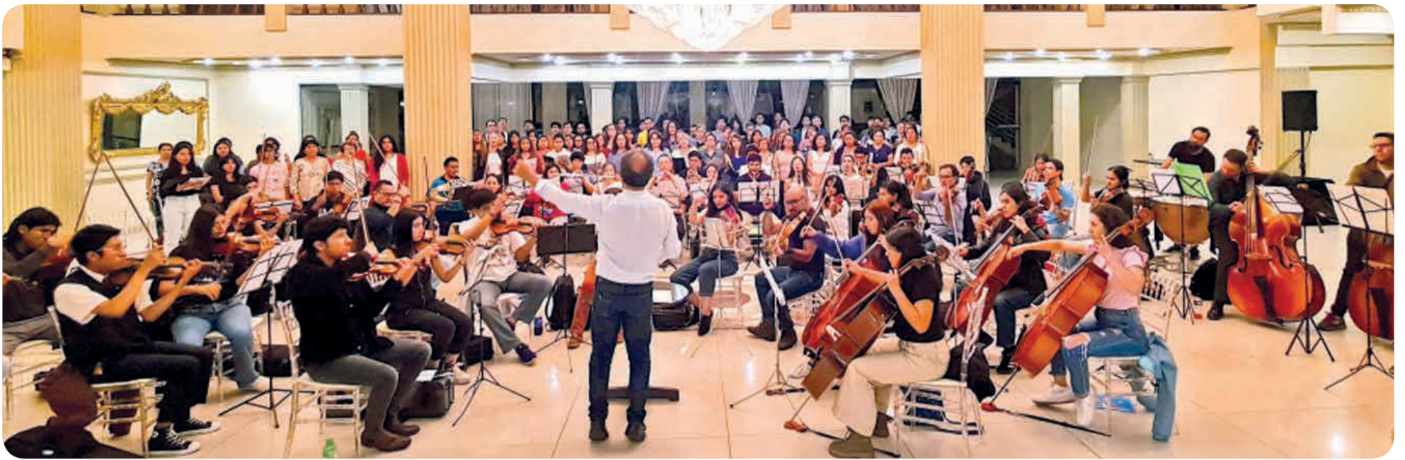
Ensayo de la sección de cuerdas de la Filarmónica de Cochabamba y la Coral Boliviana, el martes último en un salón del hotel Avanti. OFC