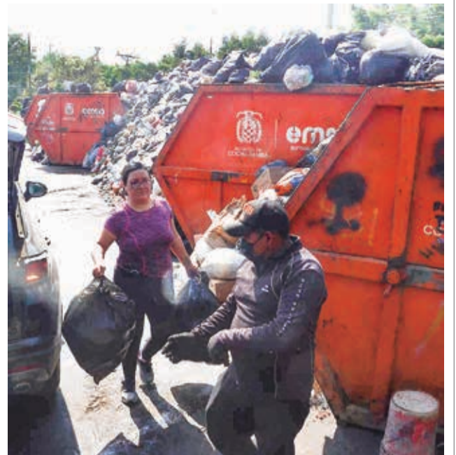
Los contenedores colapsaron en la ciudad.

Tras la salida de la empresa Colina, que gestionaba el relleno sanitario, la Alcaldía asumirá temporalmente la administración del botadero. Según Camargo, las empresas Proman y Emsa se encargarán de las operaciones durante seis meses, mientras se inicia un nuevo proceso de contratación para adjudicar la administración a una nueva empresa.