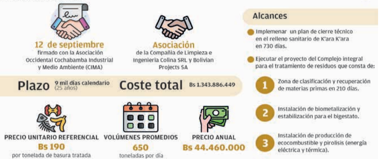
GRÁFICO: Los Tiempos

FUENTE: Contrato suscrito entre CIMA y la Alcaldía de Cochabamba