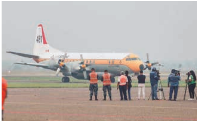
El avión cisterna llegó a Viru Viru, Santa Cruz.

De acuerdo a un reporte de prensa, el presidente Luis Arce además entregó equipos a