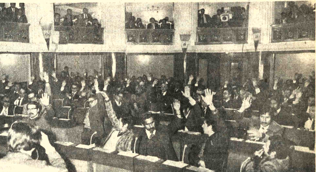
CONCILIACION. - Las representaciones de la Alianza del Movimiento Nacionalista Revolucionario (MNR) y de la Unidad Democrática y Popular (UDP) conciliaron criterios ayer, después de cinco jornadas congresales, durante las que discrepaban ab-

elección de Guevara, aprobada en las sesiones de ayer, es la siguiente: "Primero. En conformidad al último párrafo del artículo 93 de la Constitución Política del Estado, se encomienda el ejercicio de la Presidencia de la República al Presidente del Honorable Senado Nacional, ciudadano Walter Guevara Arze, el cual asumirá las funciones de Presidente interino de la República, a partir del 8 de agosto de 1979. Segundo. El Presidente interino de la República convocará a elecciones nacionales para Presidente y Vice-Presidente de la República para el domingo 6 de mayo de 1980. Tercero. El Presidente interino de la República ejercerá sus funciones de acuerdo con el título segundo de la Constitución Política del Estado y tendrá todas las atribuciones que la Carta Magna y las Leyes le confieren como Jefe de Estado. Cuarto. La investidura del Presidente interino de la República se llevará a cabo en el salón de sesiones del Honorable Congreso Nacional el día 8 de agosto de 1979, a las 11.00. La resolución fue redactada por una comisión mixta del Congreso de la que participaron representantes de la mayoría de las fuerzas políticas. Se abstuvieron los congresales del Partido Socialista Boliviano y el MITKA. En el proyecto se habían incluido cinco puntos. Fue eliminado uno de ellos por considerar que la Constitución y las Leyes facilitarían automáticamente al presidente a someter todas las disposiciones que considere conveniente, al Congreso.