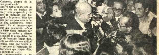
CON SILES ZUAZO. - Después de haber sido elegido presidente interino del país, el Dr. Walter Guevara Arze estuvo con el Dr. Hernán Siles Zuazo, luego que éste levantó una huelga de hambre realizada junto con Jaime Paz Zamora, su compañero de fórmula en las elecciones pasadas.

realizar ninguna alianza con las fuerzas representativas de la derecha ni de la empresa privada, puesto que su compromiso era con el pueblo y con las clases desvalidas. Puntizó recordando de que se abra en el país un (Pasa a la página 5)