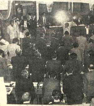
HOMENAJE A LA PATRIA. - El Congreso Nacional, en su reunión meridiana de ayer, rindió homenaje a Bolivia al celebrarse los 154 años de vida independiente. Representantes de los sectores parlamentarios pronunciaron discursos alusivos a la

La Junta Militar decretará mañana feriado nacional con motivo de la posesión del Dr. Walter Guevara Arze como Presidente de la República. El anuncio fue hecho ayer por el Presidente de la Junta Militar de Gobierno, General David Padilla Arancibia. Para hoy se prevé la aprobación de respectiva disposición oficial, que tendrá como propósito que el pueblo pueda seguir la ceremonia de la transmisión del mando presidencial, fijada para mañana a las 11 horas en el Palacio Legislativo.