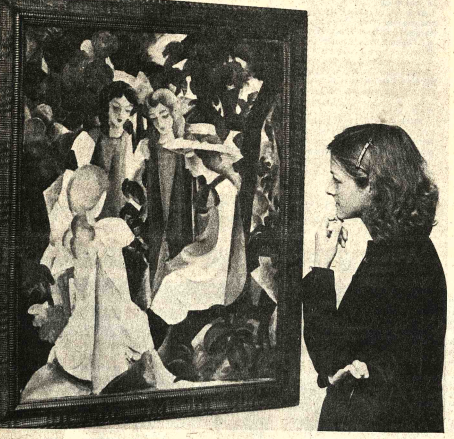
BONN (INP). "Las mejores obras del expresionismo alemán, entre ellas el óleo de August Macke 'Cuatro muchachos' de 1914 (foto), ha presentado el Museo Municipal de Arte en Bonn en una extraordinaria exposición; para ello fue necesario abrir un edificio nuevo de museo. Abarca 150 obras de 14 artistas, habiendo vivido todos ellos próximos a August Macke. August Macke y sus amigos pintores" es el título de la exposición. Constituye aquí un hito en la historia del arte se conoce bajo el concepto de "expresionismo renano" siendo presentado como tal por primera vez en una exposición de la liberación Coln en Bonn. Los esculturas renanas no se caracterizan tanto por el entrenamiento teórico, no poseían una "conciencia de grupo" tan clara como los otros dos círculos de expresionismo, siemprevé "Die Brücke" en Múnich y "el puente" en Dresde. El arte alemán el hecho de que el círculo renano fue más importante y más visible que hasta la fecha se había supuesto. Se exhiben en la exposición de Bonn. Ahora puede considerarse de un tercer centro del expresionismo alemán un extremo escultórico, que en breve se publicará en forma de libro, el documento científico, "Las características de los escultores de amigos en torno a August Macke, Franz Hanemann, Carlo Mencke, Heinrich Nasse, Hans Tharaud, sus sus seguidores, y sus obras, que se exhibirán, están a punto de la publicación, imprentabilidad, indaga, obra de una vida y gran sensibilidad.

Y es más, es el caso de América de que en algunos países tienen más de una mujer en su Academia, como en el Uruguay que hay tres, Esther de Cáceres, Clara Silva y