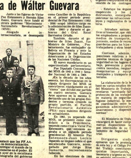
Walter Guevara Arce, presidente constitucional e interino de Bolivia, pertenece a la "vieja guardia" política que introdujo en la década de los años 50, drásticas transformaciones en la sociedad de este país.