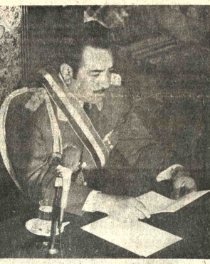
EN MENSAJE A LA NACION. - En mensaje dirigido ayer a la nación, con motivo del aniversario de la Independencia nacional, el presidente de la Junta Militar, Gral. David Padilla Arancibia, demandó una acción conjunta del pueblo boliviano para solucionar los problemas nacionales. Mañana entregará el poder al Presidente Walter Guevara Arze.