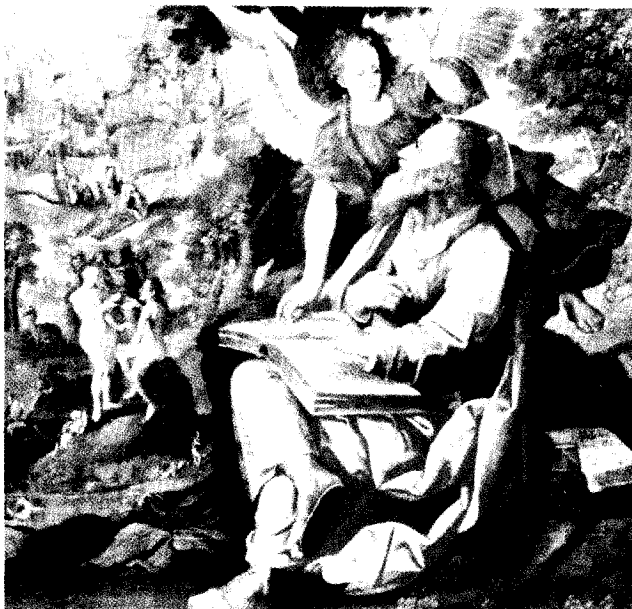
'San Mateo Evangelista' de Melchor Pérez Holguín.

La Fundación Cultural del Banco Central de Bolivia se unió al 70 Aniversario del Instituto Emisor con la presentación de una importante muestra del arte colonial mestizo que pertenece a la Casa de Moneda de Potosí, en el salón "Guillermo Núñez del Prado" del Museo Nacional de Etnografía y Folklore.