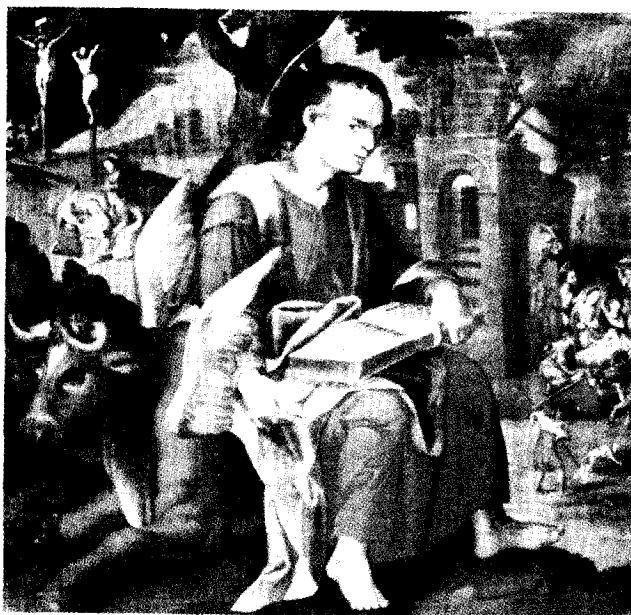
'San Lucas Evangelista' de Melchor Pérez Holguín.

En la nueva Ley del BCB N° 1670, aprobada el 31 de octubre de 1995, se estipula la creación de una fundación, la cual inició sus labores en abril de 1997 y asumió la totalidad de la administración de los centros mesológicos en julio del mismo año. Está regida por un Consejo de Administración constituido por 7 personalidades de reconocida trayectoria, que permanecen en sus cargos por un período de cinco años.