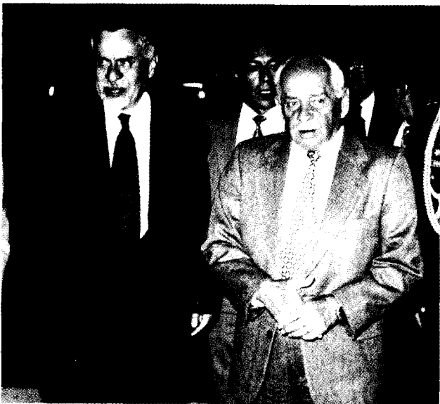
El Presidente de la República junto al Presidente del BCB.

En el discurso central del acto, el Presidente del BCB, Juan Antonio Morales Anaya, dijo que se debe mantener un alto grado de independencia lo cual "no significa discrecionalidad ni arbitrariedad, sino respeto a la Ley" para cumplir a cabalidad su objetivo de preservar la estabilidad de la moneda nacional.